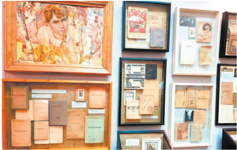
Один из залов музея Сергея Есенина в Ташкенте

Долгие годы подробности пребывания Сергея Есенина в Ташкенте были неизвестны. В литературных энциклопедиях начала тридцатых и середины шестидесятых го-