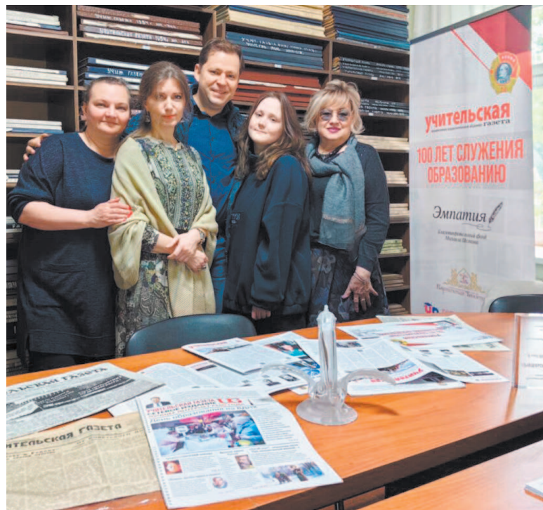
Работаем с архивами «УГ»

В разные годы в «Учительской газете» публиковали статьи выдающиеся личности: Шалва Амонашвили, Симон Соловейчик, Александр Асмолов, Василий Сухомлинский, Максим Горький, Корней Чуковский, Осип Мандельштам, Сергей Михалков, Римма Казакова, Дмитрий Лихачев, Наталья Сац и многие другие. Авторами выступали не только из-