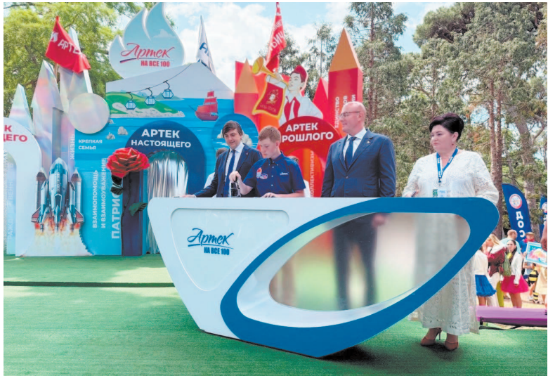
Гашение юбилейной почтовой марки

Празднование дня рождения 16 июня 2025 года началось на площадке Дружбы в лагере «Морской»,