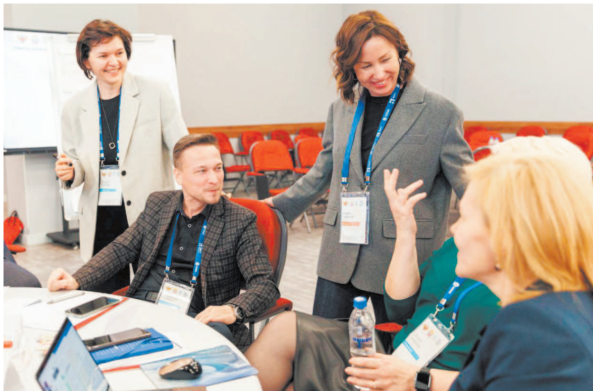
Участники программы «Директор на высоте»

Впереди участников программы «Директор на высоте» ждут еще два образовательных модуля, во время которых они под руководством ведущих экспертов перейдут к проектированию позитивных изменений на основе сформированной собственной профессиональной позиции.