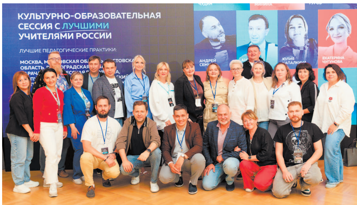
«Летние Умные каникулы» в Тобольске, август 2025 года

Первые «Умные каникулы» прошли в июле 2024 года в Тобольске на