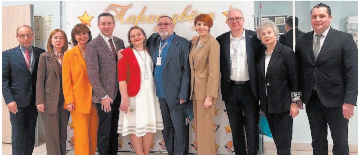
Участники форума на Брянщине

Я не случайно начала издавала, с кулинарии, потому что если меня спросят, что же за рецепт такой у ОМППШ, то я отвечу: бородинское