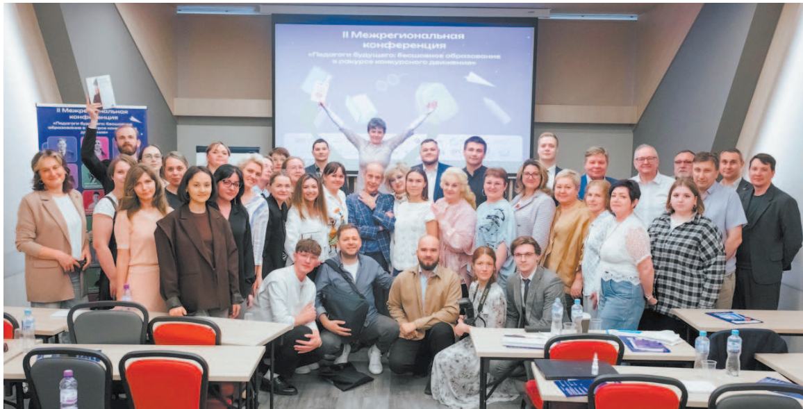
После мастер-классов мэтров педагогики

«На этой педагогической конференции - часть педагогического