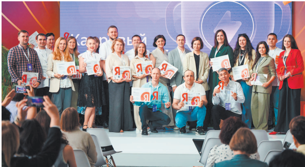
Победители Премии Яндекс Учебника

«Кадровый резерв» - бесплатная программа Яндекс Учебника для профессионального развития школьных учителей информатики, преподавателей СПО и студентов педагогических специальностей. Участники проекта могут проходить курсы повышения квалификации, проводить уроки, диагностику и олимпиады для школьников, участвовать в профессиональных конкурсах и программе наставничества, делиться опытом. За это учителя получают баллы, которые открывают им доступ к дополнительным мероприятиям и наградам «Кадрового резерва».