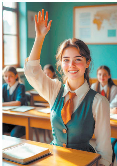
Фото сгенерировано ИИ

Взяла Пионеркина первый текст и стала поливать из шланга адекватности водой восприятия. Отмылись налипли лишние языковые конструкции, остались одни «сухие» тезисы. А со второй речью поступила по-другому. Достала фен смысла и направила поток образов и метафор. Тут же испарились бессодержательные строчки. Потом предстоя-