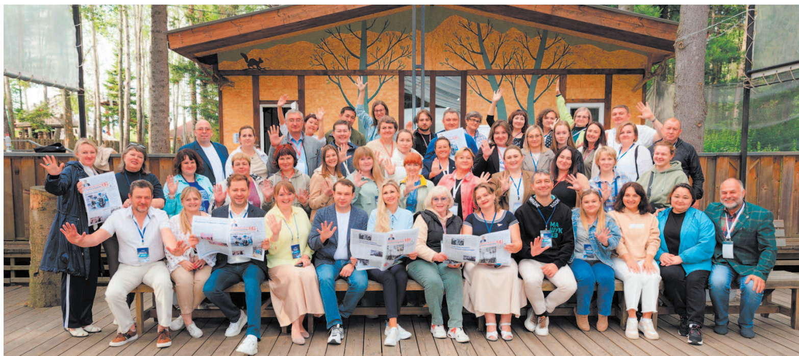
Участники и спикеры первой сессии «Умные каникулы»