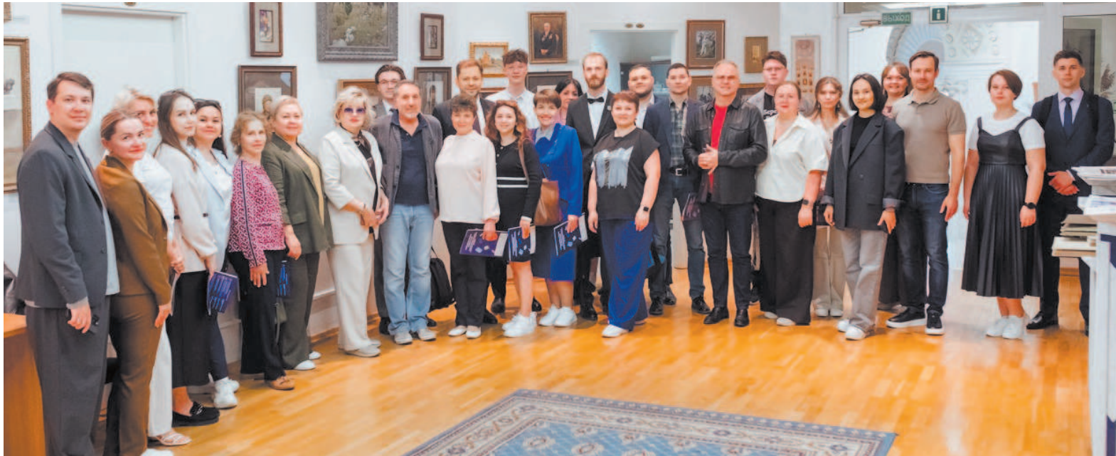
Участники конференции в Президентской библиотеке в Москве

Он рассказал о своих книгах, в которых можно найти советы по разра-