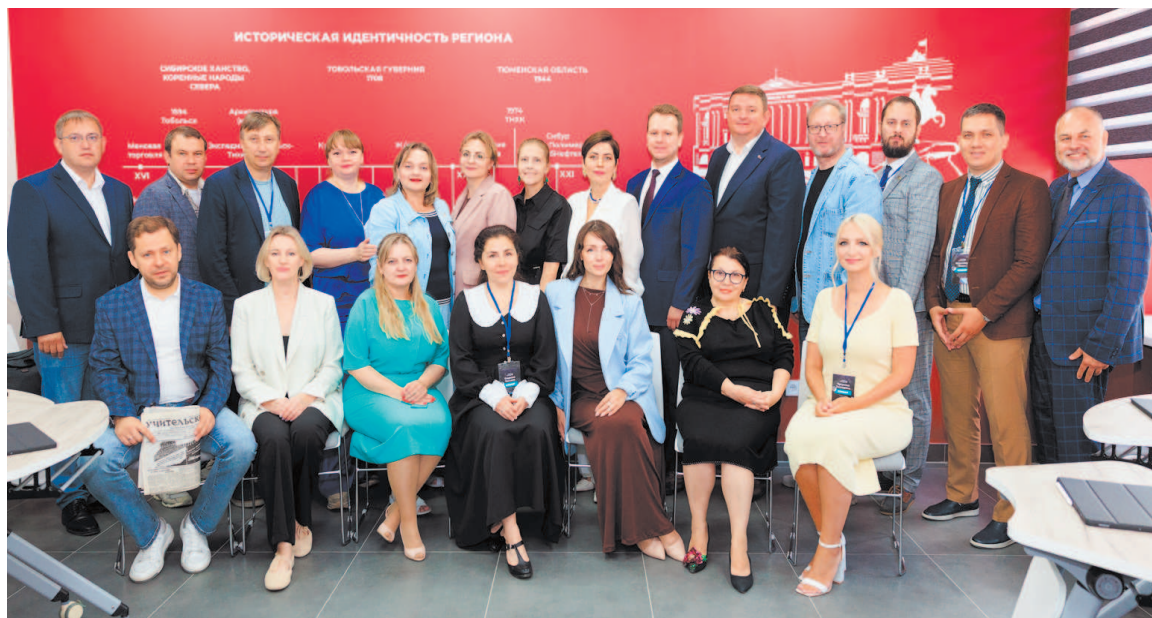
Открытие электронного читального зала Президентской библиотеки в ТМТ

В электронном читальном зале, в отличие от интернет-портала, доступны книжные издания, редкие архивные дела, старинные рукописи, изобразительные и картографические материалы, мультимедийный контент (аудио и видеозаписи). Здесь можно найти все выпуски «Учительской газеты» за ее вековую историю.