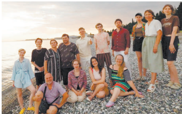
Летняя экспедиция учителей года в Абхазии

Среди многочисленных памятников Владимиру Ильичу Ленину на постсоветском пространстве этим летом несказанно повезло тому, что стоит во дворе Гагрского лицея-интерната в поселке Цандрыпш, в соседней братской Абхазии. За его спиной на ветру уже несколько дней полшуют флаги двадцати восьми регионов нашей страны, из которых сюда приехали 250 человек, чтобы принять участие в двадцать третьей экологической экспедиции школьников, теперь уже международной,