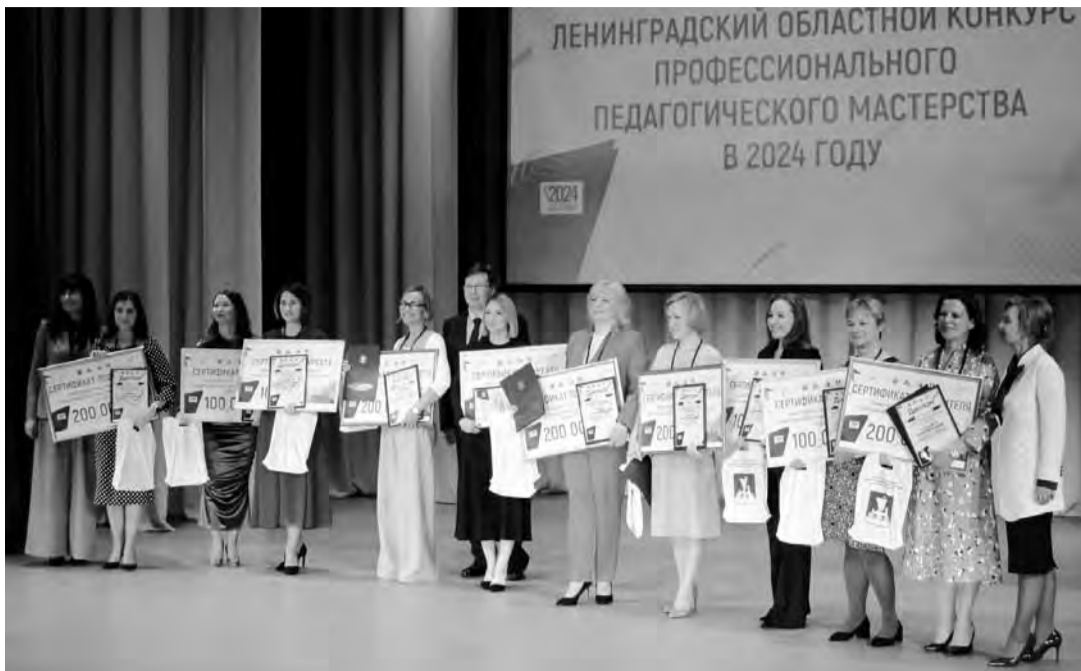
Победители и лауреаты конкурса педагогического мастерства Ленинградской области

Хорошие традиции должны продолжаться. В Ленинградской области одной из них стало проведение финала регионального конкурса педагогического мастерства сразу в пяти номинациях: «Учитель года», «Воспитатель года», «Учитель-дефектолог года», «Библиотекарь года» и «Педагог-психолог года». В этом году лидером образования принимал город энергетиков и нефтепереработчиков Кириши.