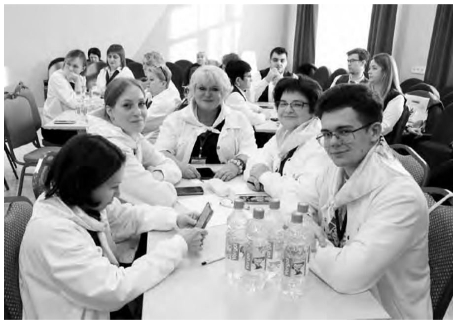
Профактивисты Южного округа Москвы

Команда Южного административного округа Москвы среди территориальных организаций с численностью более тысячи человек заняла третье место. По мнению председателя территориальной профорга-