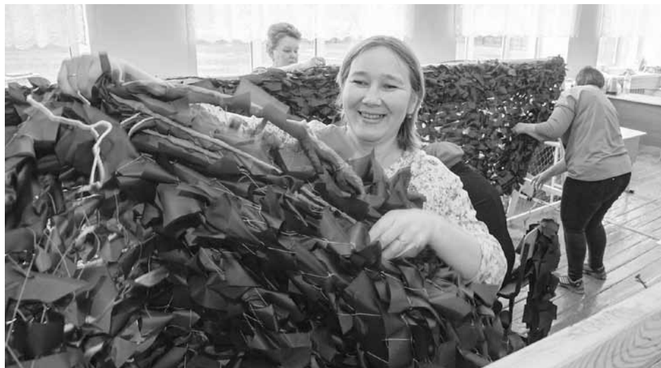
В каждую маскировочную сеть вплетена «визитная карточка»

По итогам соревнований команда-победительница награждается призами, например пионерской символикой.