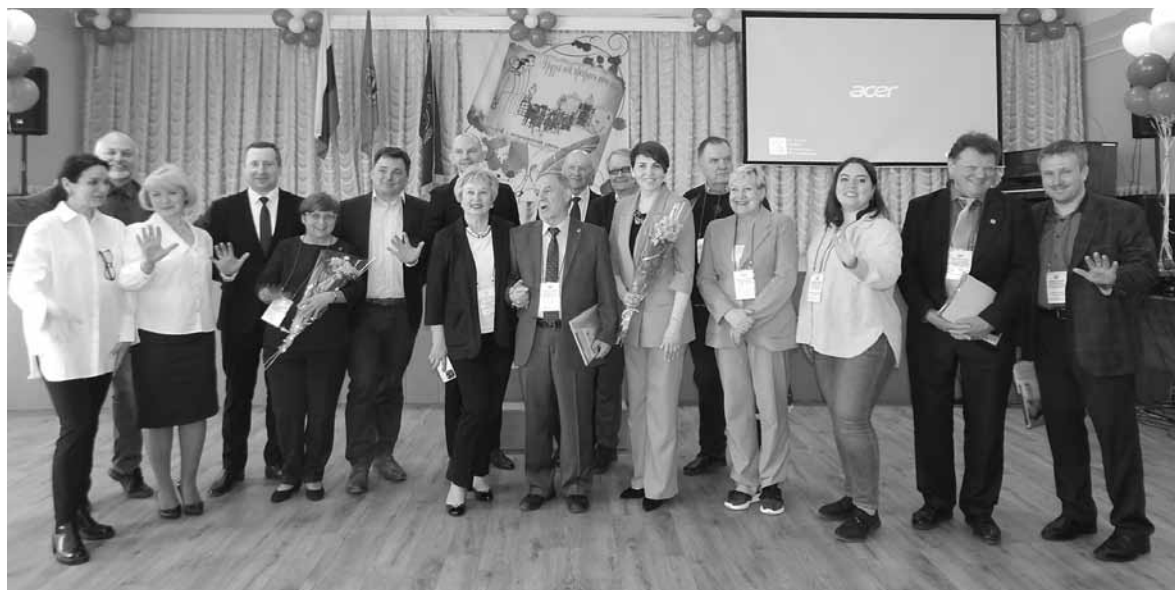
Участники и организаторы форума

ственного результата, не оставили никого равнодушным.