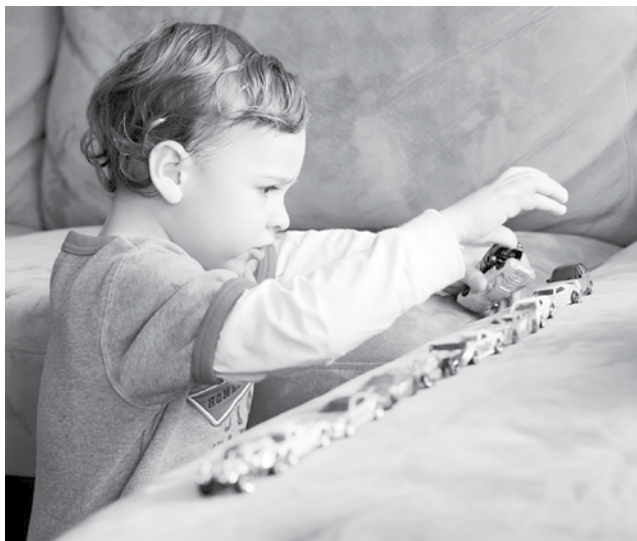
Для детей-аутистов характерно расставлять игрушки в строгом порядке

Аутизм - одна из самых загадочных психических патологий. При этом людей, в том числе детей, страдающих аутизмом, довольно много, и некоторые из них даже обладают интеллектом куда выше среднего.