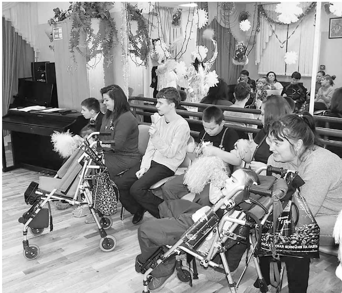
В зрительном зале театра кукол