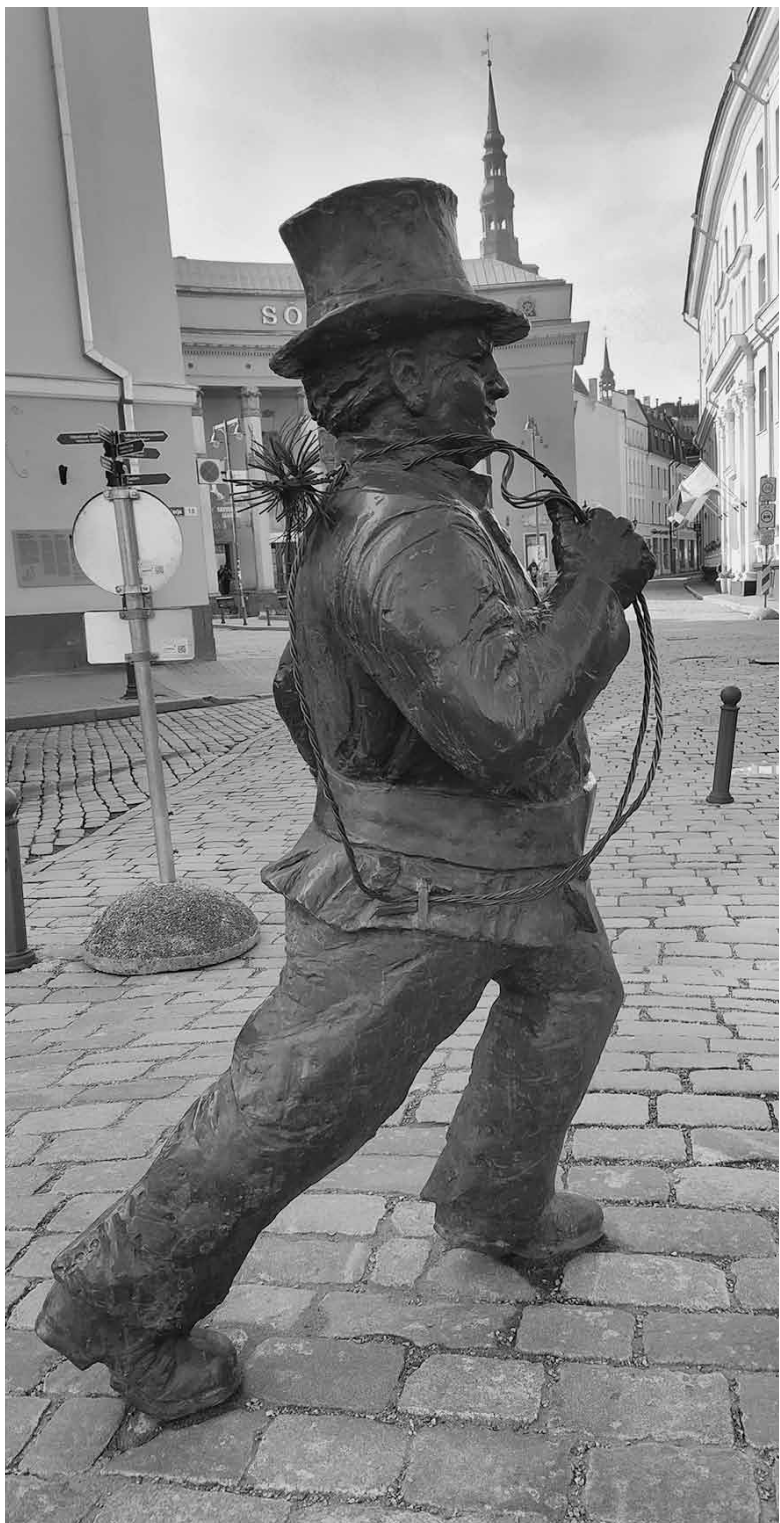
Трубочист делает решительный шаг по булыжной мостовой

Еще такой нюанс в связи с проблемой замусоривания обитаемой среды. Весенним преображением назвали городские власти уборку улиц. Это не только очистка их от грязи и избавление от случайного мусора, который накопился под снегом. Отмечу несколько разумных решений мусорных городских проблем, «очистительных» инициатив, достойных внимания жителей других городов (не только, понятно, столичных) за пределами Прибалтики. Одна из бед приморского Таллина - чайки, вороны, голуби, которые устраивают гнезда на крышах домов и балконах, в сенных нишах и вентиляционных трубах, изрядно загаживая все вокруг. Как поступить? Лишить птах их исконных мест гнездования или оставить все как есть, разрешив пернатым вести себя в городской среде как им заблагорассудится? Эксперты помощи птицам советуют горожанам по весне все же очистить крыши от остатков прошлогодних гнезд, вытопанных птенцами. Следует убирать и растущий на крышах мох, так как той же чайке стоит примять его клювом, как туда уже можно класть яйца. Постоянно подчищая за чайками по весне их старые гнезда, человек как бы деликатно намекает птахам, чтобы они устраивали свои квартиры в других местах, которых полно за городом. При этом власти предупреждают, что старые гнезда можно убирать только до тех пор, пока там не появятся яйца, поскольку уничтожение яиц или даже нарушение покоя птиц категорически запрещено.