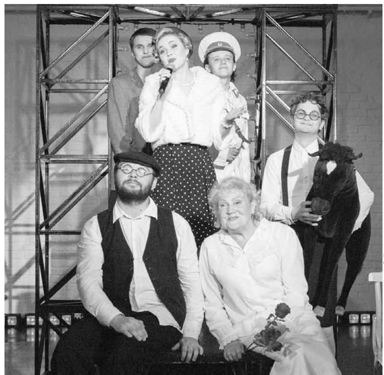
Музыка как эхо времени гармонично встраивается в сюжет

Ах, эти милые заблуждения «никогда не пустовавшего сердца Алек-