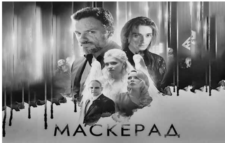
Идет ли на пользу картине визуально-смысловый винегрет?