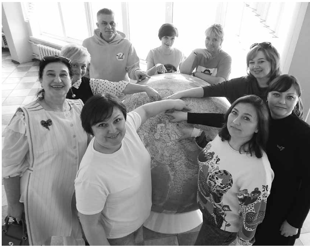
Участники мероприятия мыслят глобально!

Значит, фестиваль «Под крылом Синей птицы» выполнил главный завет притчи «Кры-