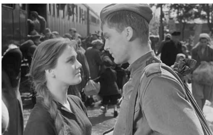
Актеры: Жанна Прохоренко и Владимир Ивашов (фильм «Баллада о солдате»)