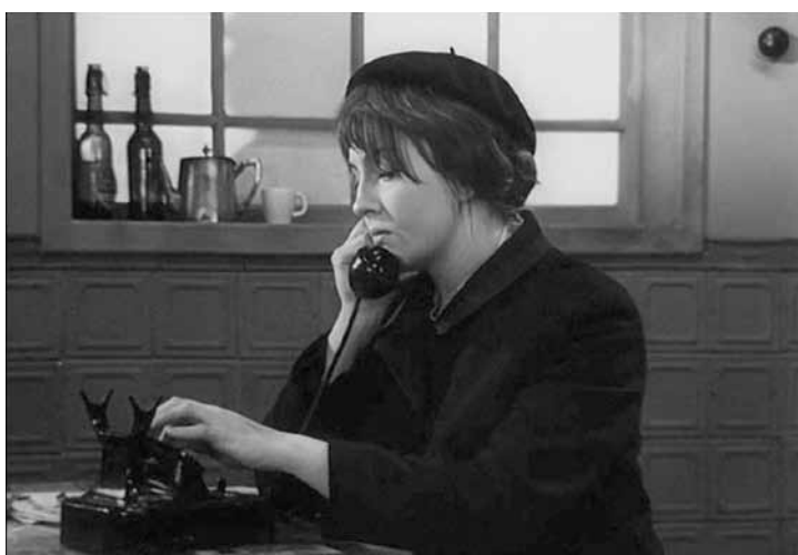
Актриса: Екатерина Градова (фильм «Семнадцать мгновений весны»)