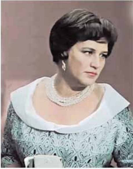
Актриса Нонна Мордюкова (к/ф "Бриллиантовая рука")