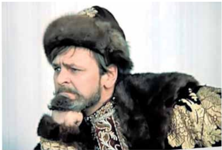
Актер Юрий Яковлев (к/ф "Иван Васильевич меняет профессию")