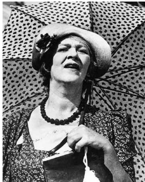
Актриса Фаина Раневская (фильм «Подкидыш»)