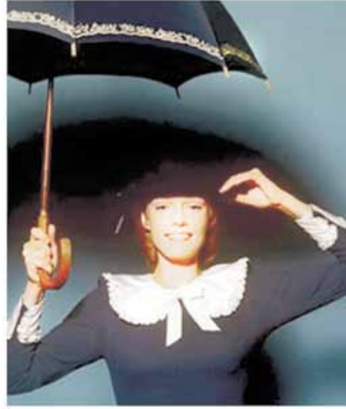
Актриса Наталья Андрейченко (к/ф "Мэри Поппинс, до свидания!")