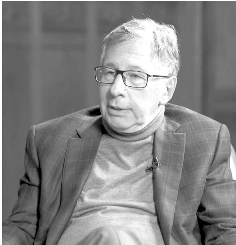
Петр АВЕН: «Когда мои дети росли, они были очень финансово ограничены. Я им никогда денег не давал»

денег. Деньги нужно заработать на работе. Следовательно, чтобы переписываться с друзьями по Интернету, мне нужно ходить на работу и работать хорошо, чтобы меня не уволили.