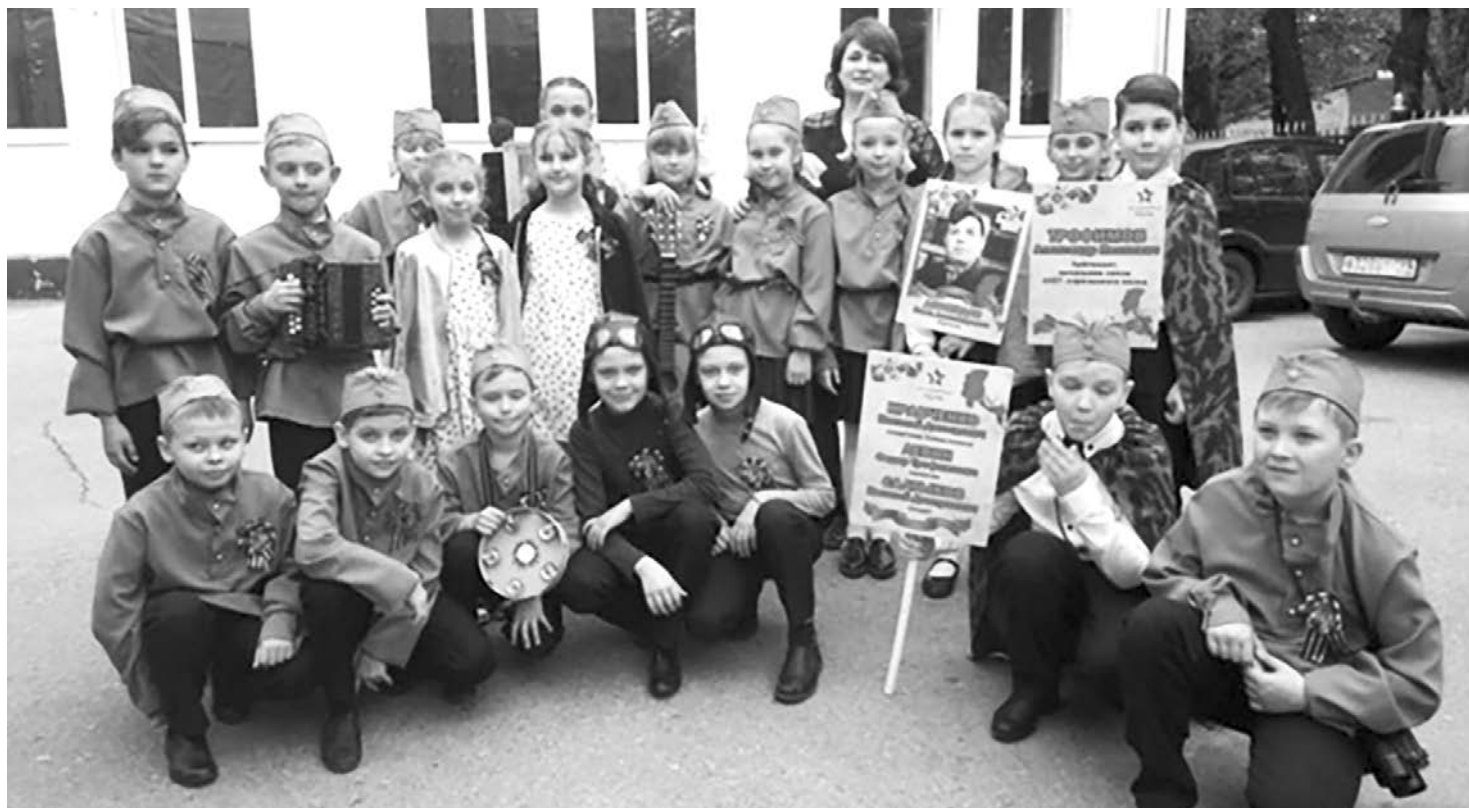
Воспитание в школе начинается с 1-го класса