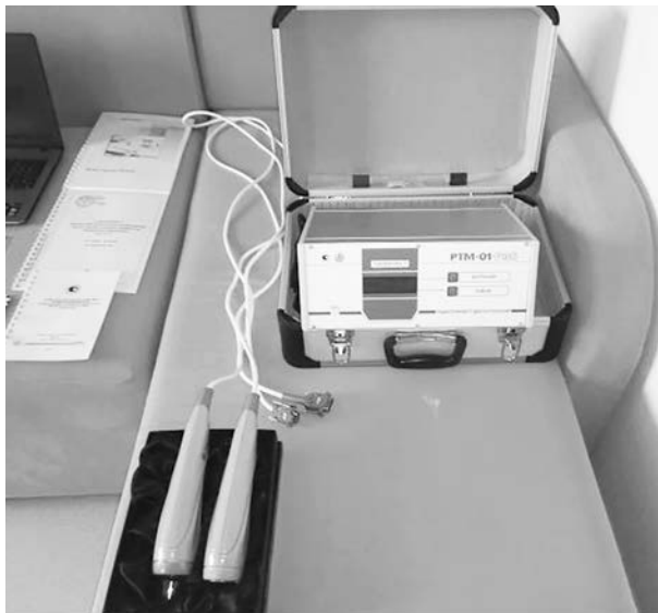
Рак можно выявить, измерив температуру тела