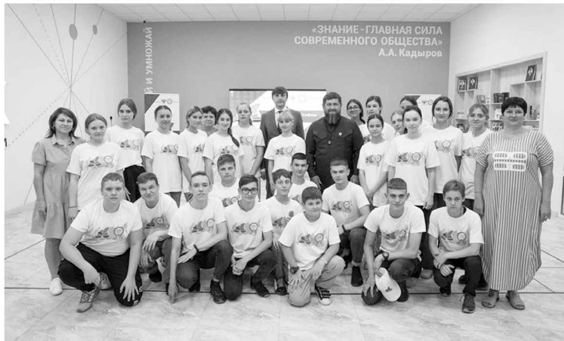
Сергей КРАВЦОВ и Рамзан КАДЫРОВ с участниками Университетской смены в ЧГПУ

Также Сергей Кравцов осмотрел Чеченский государственный колледж и строящуюся в Грозном школу на 1224 места. Открытие нового учреждения позволит разгрузить близлежащие школы, в том числе те, где есть третья смена. Работы практически завершены.