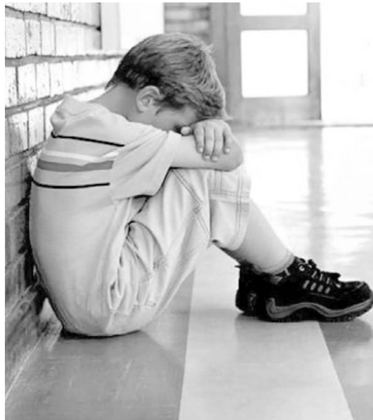
Каждый третий ребенок в мире хоть раз был жертвой издевательств

ющей редакции, где говорится, что ребенок имеет право на защиту от злоупотреблений со стороны родителей (или лиц, их заменяющих), предлагается защитить ребенка от неправомерных действий любых лиц. Сейчас в Семейном кодексе пе-