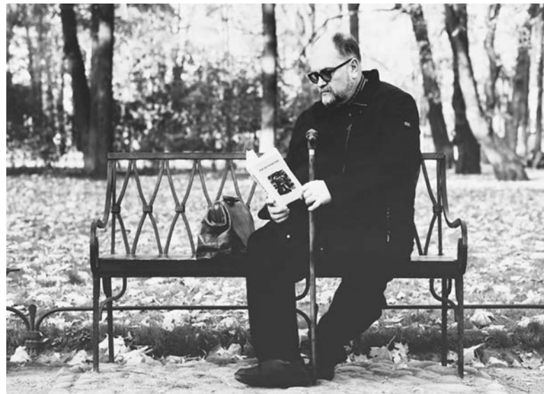
2022 год. Наедине с книгой и самим собой

го обучения, они часто носят интегрированный характер. Трудно однозначно определить образовательную технологию директора гимназии. Это главным образом культуроцентричность в преподавании истории и обществоведения, системное использование метода проектов. Одна-