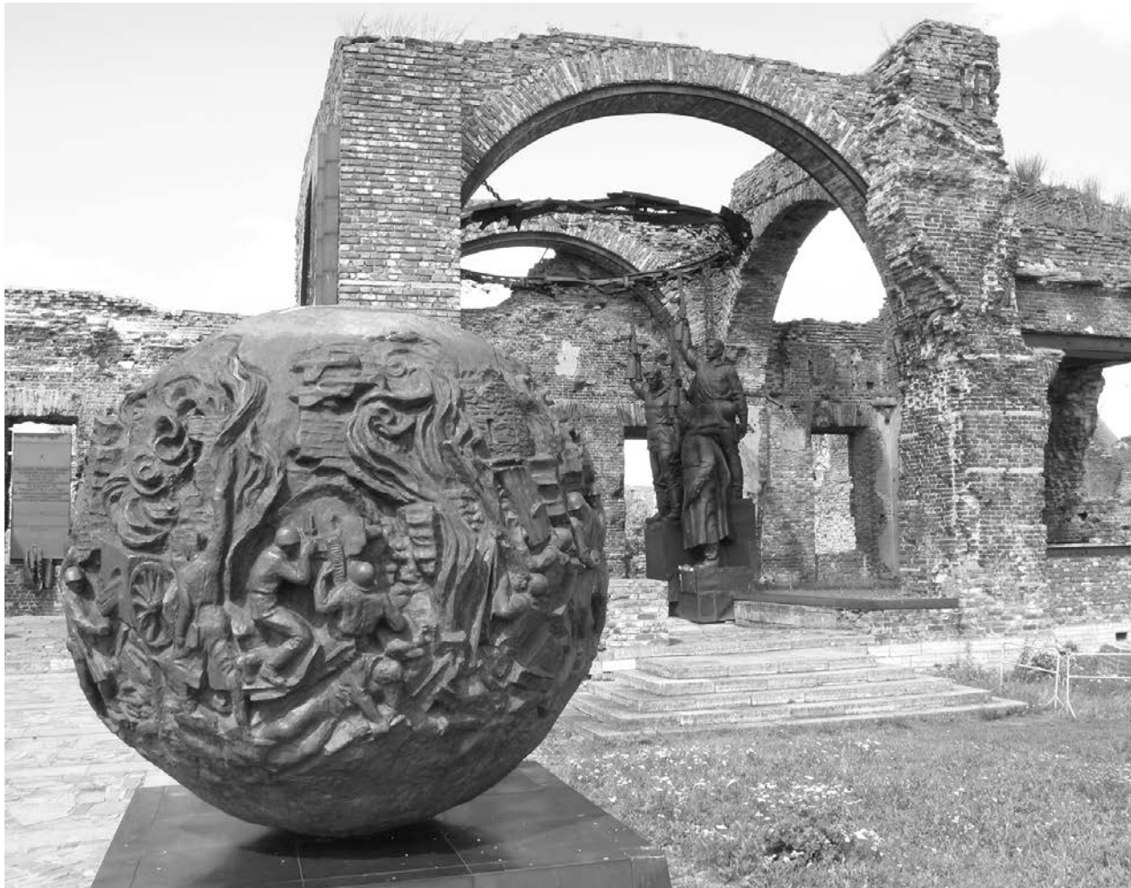
Крепость Орешек стала русской Бастилией

Увидим мы и выставку к 320-летию штурма Нотебурга. Она раскроет нам все карты, гравюры, планы и схемы из собрания ГМИ Санкт-Петербурга, Национального архива Швеции и Российского государственного архива Военно-морского флота, посвященные славной баталии. Называться выставка будет «Зело жесток сей орех...». Умел Петр Великий высказаться. На века!