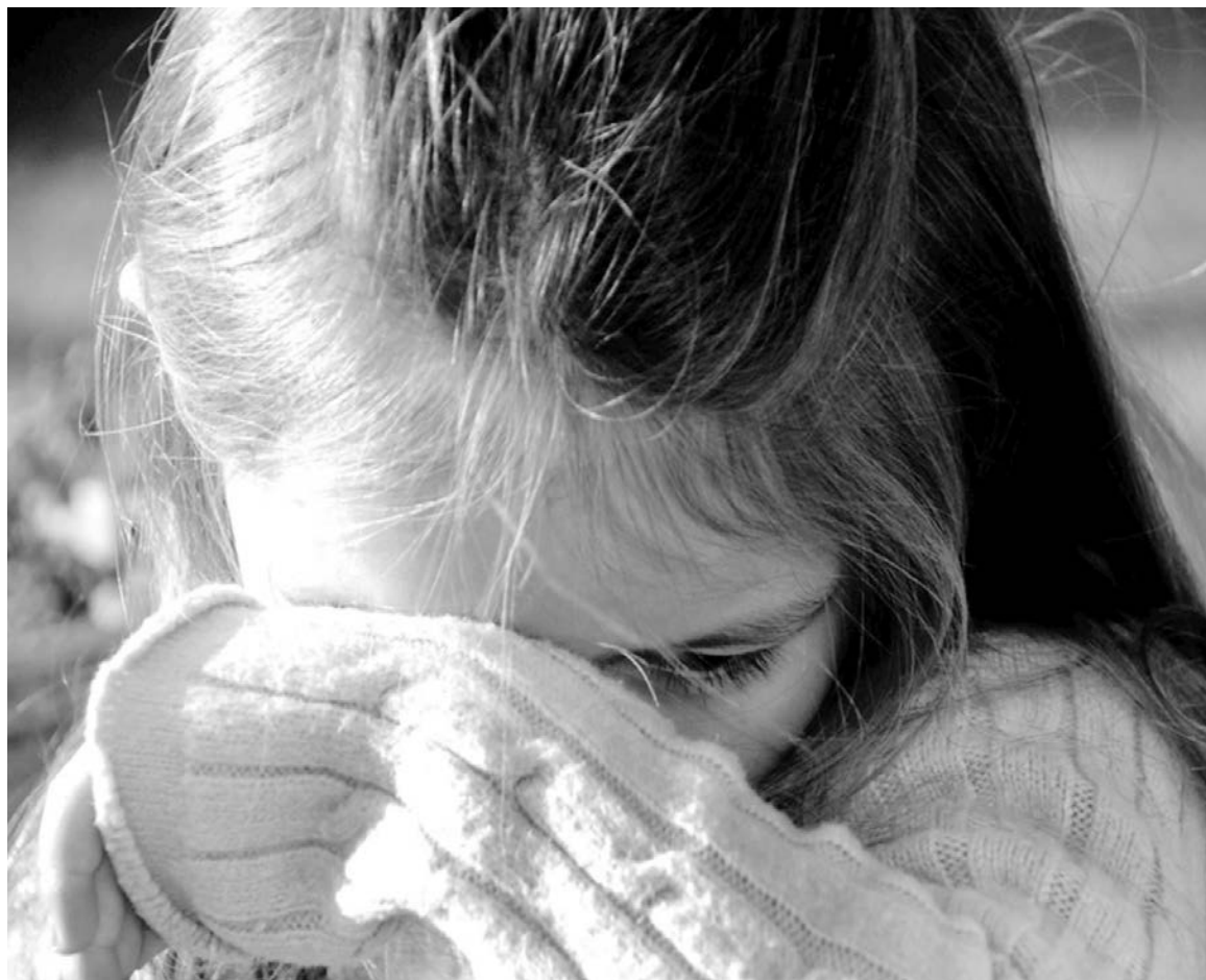
Из «непредсказуемого», замкнутого ребенка может вырасти сильный лидер

Вот как долго могут сохраняться детские обиды, нанесенные взрослыми. Помните об этом, учителя!