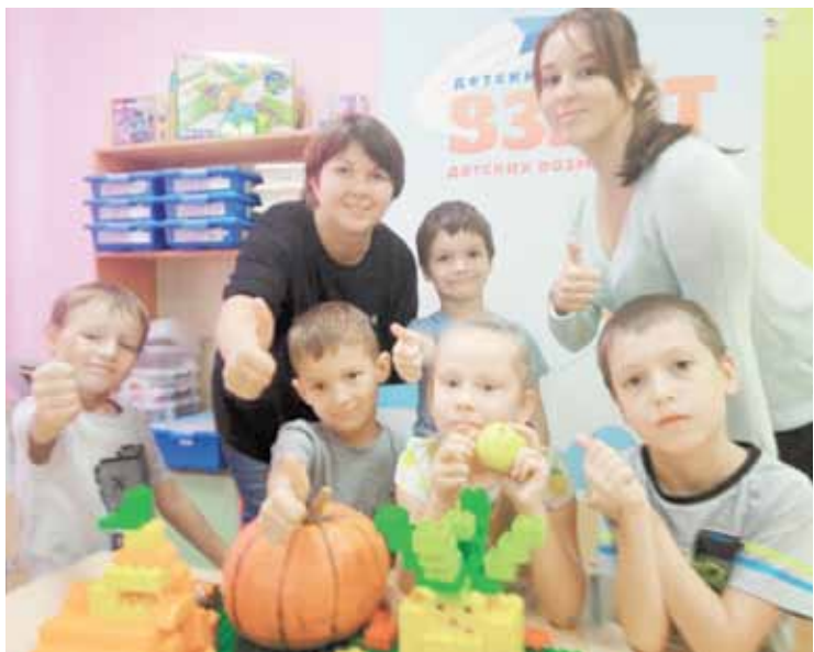
Счастливые дети - здоровое будущее.

Два года назад в Перми взяли за амбициозную задачу - сделать переход из детского сада в школу настоящим бесшовным, а уровень образования на начальной ступени одинаково высоким по всему городу. Здесь впервые в стране началась работа над уникальным муниципальным проектом «Детство равных возможностей». В проекте принимают участие 30 команд образовательных учреждений, объединившихся по месту расположения в кондоминимумы и работающих над единой целью - обеспечить каждому ребенку на своей территории образование высшего качества.