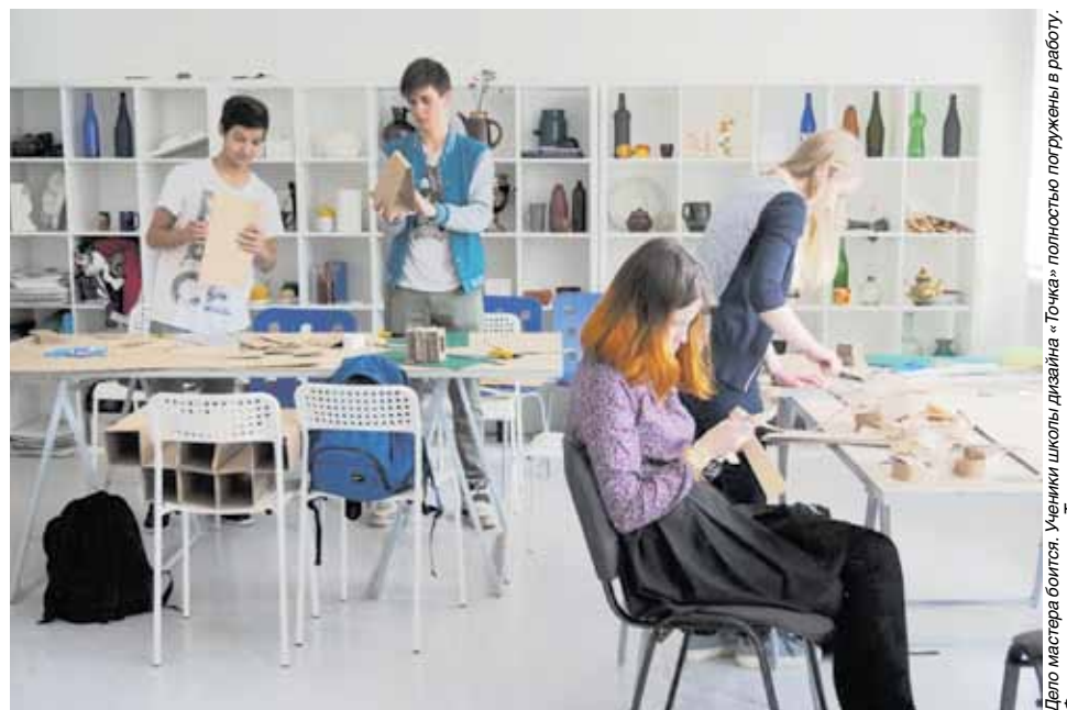
Дело мастера боится. Ученики школы дизайна «Точка» полностью погружены в работу.

В «Точке» инструменты дизайна перенесены на школьные предметы. Например, в рамках предмета «Технология» выделен модуль «Ин-