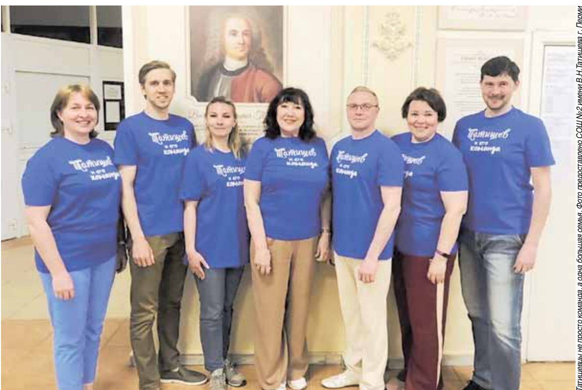
Татищевцы - не просто команда, а одна большая семья.

На базе школы проводятся такие мероприятия, как ежегодная научно-практическая конференция «Татищевские чтения», городская игра, посвященная дню рождения В.Н.Татищева, «Всю жизнь Отечеству служить», проекты «Татищевский вестибюль», «Татищевский дворик» и «Аллея губернаторов».