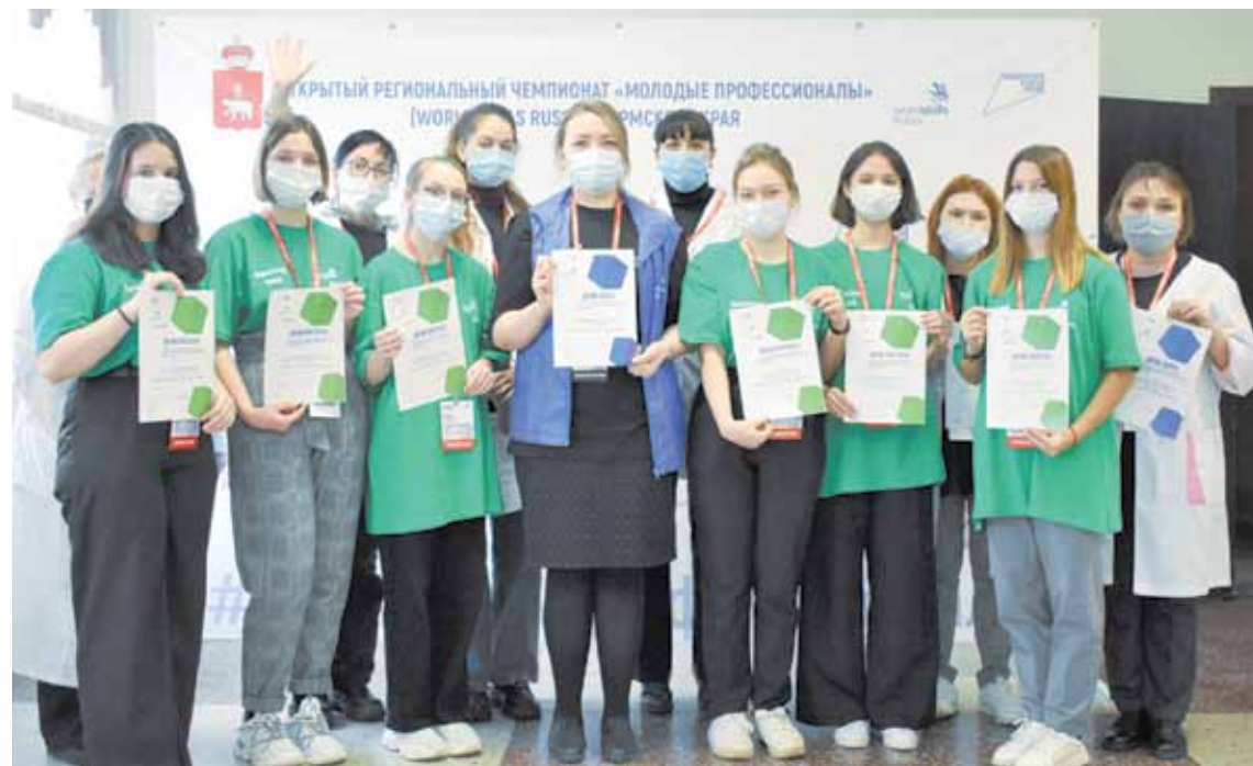
Молодежь ответственно относится к своему и чужому здоровью.

Помимо этого «Дуплекс» эффективно работает в рамках кластера «Содружество». 30 сентября 2021 года был заключен договор о сетевом сотрудничестве между школой «Дуплекс», школой №32 и школой «Приоритет». В «Дуплексе» открыты профили по английскому языку и ин-