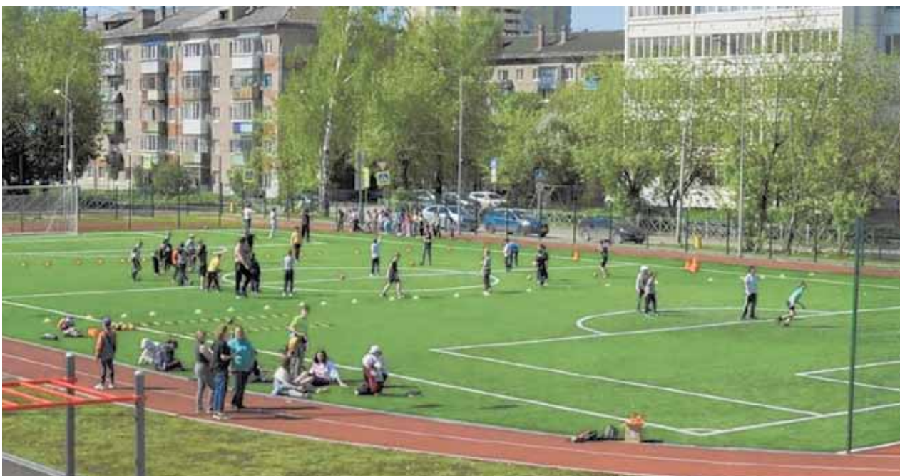
«И вот наши большое поле: есть разгуляться где на воле!».