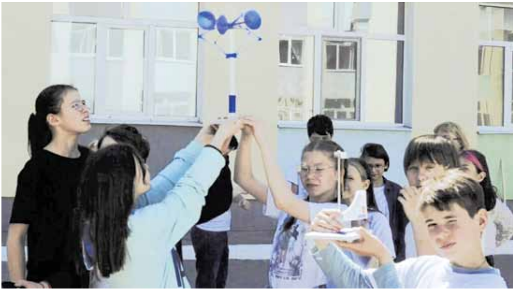
«Никто из нас не умеет так по отдельности, как мы все вместе!»