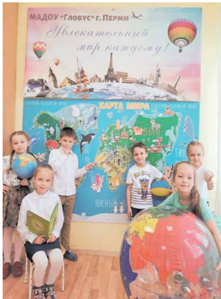
Исследователями не рождаются, ими становятся.

Отметим, что одной из основных целей является рост профессионализма преподавателей начальной школы во всех районах города, что также очень важно. Ведь на этой ступени образования семьи идут «на