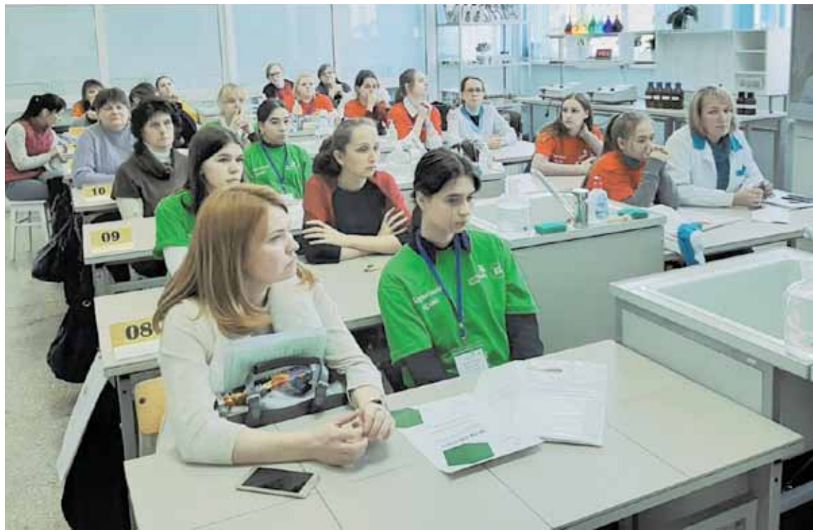
Внимательность, усердие, увлеченность - три кита погружения в учебный процесс

Физический факультет и астроklub «Телескоп» Пермского научно-исследовательского университета являются партнерами уникальной технологии гимназии «Открытая образовательная сессия». Метод погружения с заменой традиционных уроков учебно-практическими занятиями, экскурсиями, творческими мастерскими, мастер-классами и лекциями ведущих преподавателей вуза дает воз-