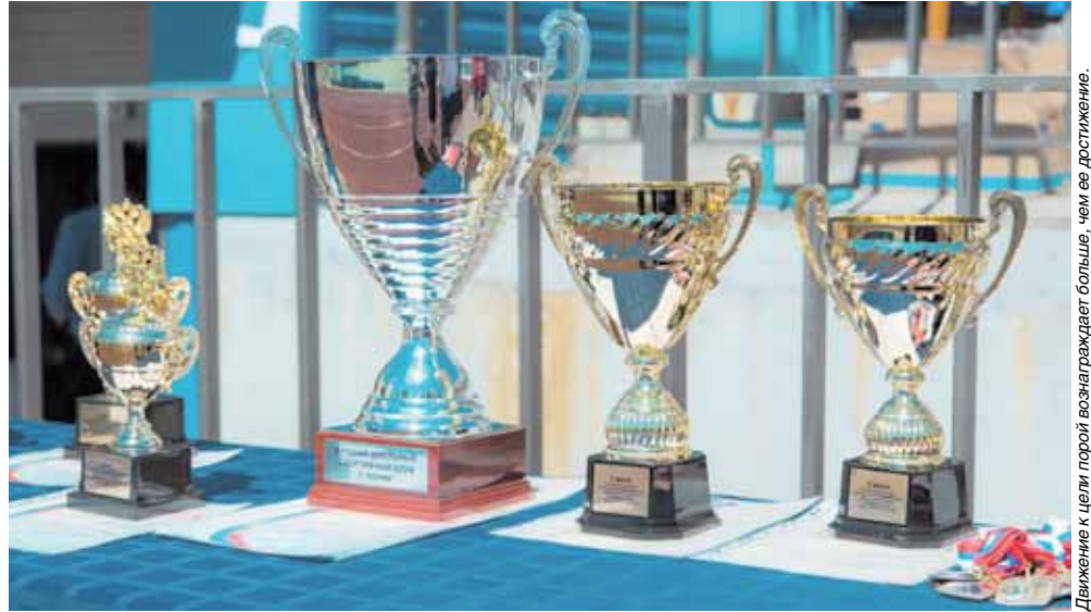
Движение к цели порой вознаграждает больше, чем ее достижение.