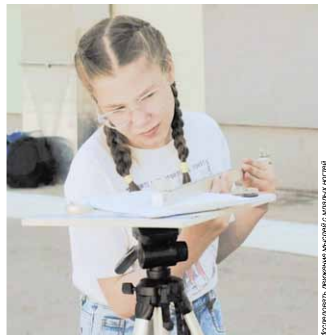
Исследовать движение мыслей с младых ногтей