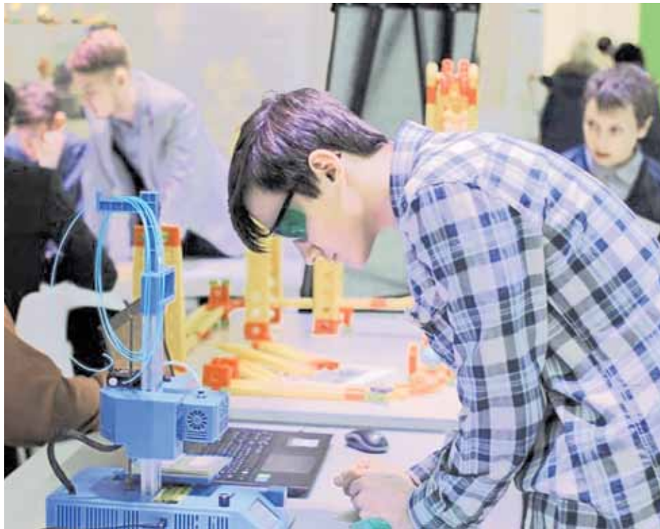
«Милые» технологии отлично служат столь же одаренным ученикам.