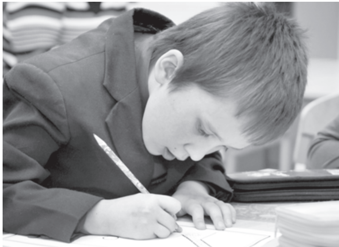
Хорошо учиться и быть здоровым!

Электронный паспорт здоровья можно использовать для мониторинга хронических заболеваний, наблюдения за развитием детей, занятий физкультурой и спортом.