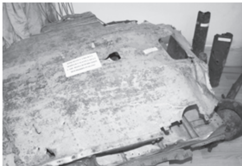
Найденное юными краеведами крыло самолета

Образовательный процесс на станции осуществляется в объединениях по военно-патриотическому, туристско-краеведческому, художественному, естественно-научному направлениям. Музеев помимо «Нормандии - Неман» еще два: боевой славы и этнографический. Это музеи, рассказывающие о земляках, о том, чем они жили, о том, за что они умирали. Ведь у героев всегда есть Родина, всегда есть то, что потерять страшнее, чем умереть. Но любовь к Отечеству совместима с любовью ко всему миру. И это особенно ясно понимаешь на примере подвига эскадрильи «Нормандия - Неман».