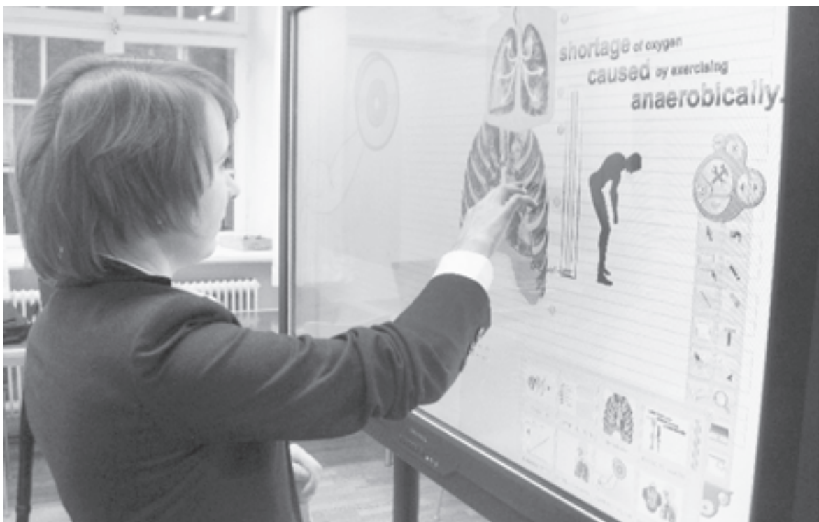
В рамках 9-го саммита Intel прошла выставка новейшего школьного оборудования