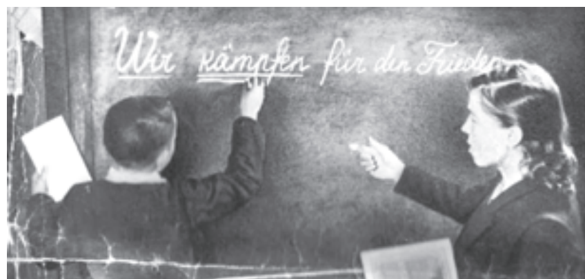
Школа шестьдесят лет назад