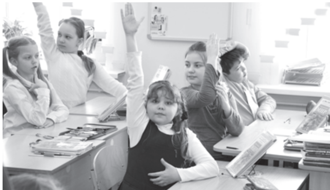
Спросите меня! Я знаю...

В ходе подготовительной работы формулирую цель родительской недели, при этом опираюсь на педагогические потребности и запросы родителей каждого учащегося, высказанные ими в результате опроса. Как правило, пожелания родителей связаны с конкретными