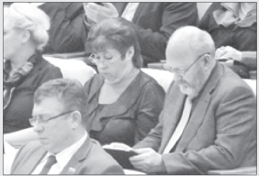
Людмила ШВЕЦОВА, вице-спикер ГД РФ, депутат ГД РФ от Москвы:

Мы предлагаем закрепить федеральным законом меры социально-экономической поддержки педагогических работников образовательных организаций, то есть гарантированный уровень оплаты труда педагогических работников не ниже средней заработной платы в соответствующем регионе, который должен быть установлен при расчете норматива затрат на оплату труда с учетом следующих условий: доведение средней заработной платы педагогических работников образовательных организаций общего образования, педагогических работников дошкольных образовательных организаций, педагогических работников среднего профессионального образования до средней заработной платы в соответствующем регионе и доведение средней заработной платы педагогических работников образовательных организаций высшего профессионального образования до 200 процентов к 2018 году от заработной платы в соответствующем регионе. По предварительным расчетам, в 2013 году на самом деле потребуются достаточно серьезные средства. Примерно 274 миллиарда рублей, в том числе из федерального бюджета - 27 миллиардов рублей, из региональных бюджетов - 247 миллиардов рублей. Естественно, это очень большая сумма для регионов. Мне кажется, на этапе принятия бюджета необходимо этот вопрос детально проработать, потому что все-таки бюджеты регионов в достаточно напряженном состоянии.