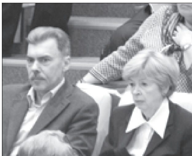
Зинаида ДРАГУНКИНА, председатель Комитета по науке, образованию, культуре и информационной политике Совета Федерации РФ, представитель Москвы в СФ РФ:

— Не раз Всероссийское педагогическое собрание выступало за то, чтобы народный учитель России, народный учитель Советского Союза имели отличие в пенсионном обеспечении. Пока этого отличия нет. Народных учителей Советского Союза и России всего 240 человек на всю страну, это наш золотой фонд, о котором надо позаботиться. Пенсия за выслугу лет педагогическим работникам сейчас идет в виде общего дохода, а затем процент включается в пенсию по старости. А почему не вся пенсия? На наш взгляд, если уж пенсия по выслуге лет выплачивается после 25 лет работы учителя в школе, то она должна в полном объеме добавляться к пенсии по старости.