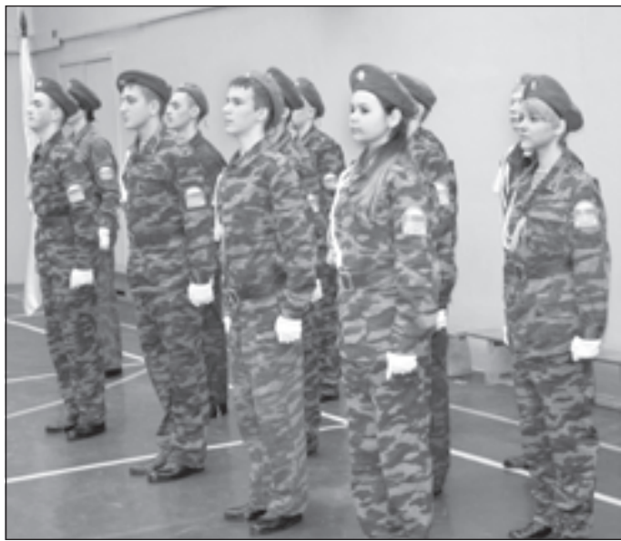
Строевая подготовка старшей группы

Смотр-конкурс начался в актовом зале с представления объединения «Звезда», которое сопровождалось театрализованным выступлением ребят. Многим образ Отечественной войны 1812 года знаком по книге Александра Гладкова «Давным-давно», а песню с таким же названием из кинофильма