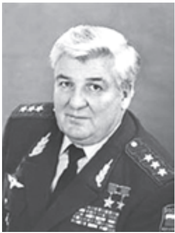
Петр КЛИМУК, дважды Герой Советского Союза, летчик-космонавтЦ

- Мы знаем, что у человека есть две матери. Одна мать, которая его родила. Вторая мать - его Родина, которая воспитывает на протяжении всей человеческой жизни каждого из нас, эту мать надо очень серьезно защищать, любить и беречь. Мы помним героев, которые спасали челюскинцев, героев, которые отстаивали честь и независимость нашей страны во время Великой Отечественной войны, во время войны в Афганистане, в локальных войнах.