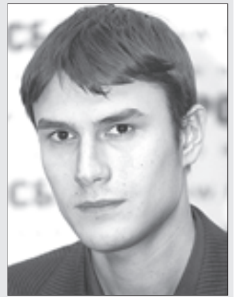
Сергей ШАРГУНОВ, писатель и отец:

В Древней Греции каждый мальчик должен был уметь играть на кифаре. Каждый мальчик — будущий воин, в руки которому давали оружие. Оружие — вещь капризная, с одной стороны, оно создано для того, чтобы защищать землю, идеи, семью, с другой стороны, оно очень легко может стать оружием бандитов. Поскольку эту грань нельзя прописать ни в одном уставе карательной службы, ее можно только почувствовать. Поэтому у греков было обязательное занятие искусством, для того чтобы можно было почувствовать красоту жизни чужого человека, которого можно убить этим оружием, чтобы для себя каждый раз человек задавал вопрос. Все классическое образование всегда учитывало эмоциональную природу человека, все, что касалось искусства, было обязательной частью образования, но у нас это из школы ушло. Поэтому ощущение стыда, что можно сделать, а что нельзя сделать, просто не существует как факт.