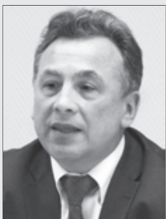
Вениамин КАГАНОВ, первый заместитель руководителя Департамента образования:

— Электронные учебники - это тема, которая живо интересует не только образовательное сообщество, но и вообще общество в целом. Правительство Москвы объявило конкурс на разработку электронного учебника. Под словами «электронный учебник» каждый понимает свое, еще нет устоявшегося определения. Мы под словами «электронный учебник» понимаем программный комплекс, который имеет не только содержательную информацию, связанную с той, что, как правило, есть в полиграфических учебниках, но и еще массу различного рода электронных ресурсов, либо раскрывающих ту или иную тему, либо позволяющих в виртуальном режиме освоить те или иные навыки.