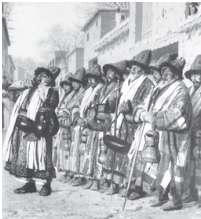
Московская школа образца 2010 года Schola mendicans (в настоящее время термин не актуален)

Воспитательная функция - основная в деятельности школы. Именно ее Федеральный закон «Об образовании в Российской Федерации» ставит на первое место в определении понятия «образование»: «Образование - единый целенаправленный процесс воспитания и обучения». Поэтому, как любая воспитательная система, школа и в самом деле в состоянии содействовать развитию только тех качеств, которыми обладает сама. В этой связи первая стратегическая педагогическая задача, которая была поставлена Департаментом образования в 2010 году, заключалась в том, чтобы помочь московской школе стать авторитетной, заслуживающей доверия, солидной, самодостаточной, свободной и ответственной за свою свободу, а также надежной для всех партнеров.