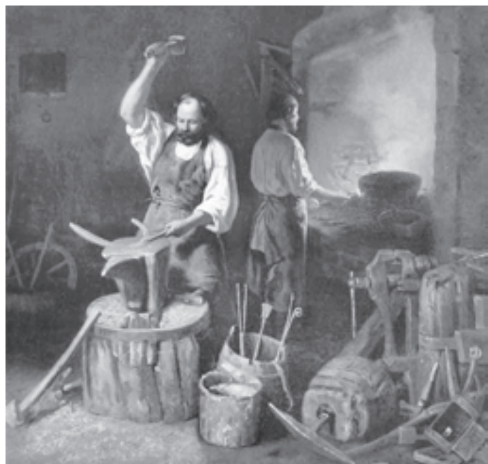
Образовательная система Москвы - это профессиональная среда для роста управленческих кадров нового поколения. Введенная в Москве аттестация кандидатов на должность руководителя открыла заместителям возможность для реализации своих замыслов. А в Школе мудрого директора, кующей достойные кадры для других школ, не будет недостатка в талантах, стремящихся попасть в эту «кузницу». И самому кузнецу-директору нечего опасаться за себя - кузнецы в России всегда были в почете.

2010 году таких детей было 8167, а в 2014 году их стало 4027. Этот пример еще раз убедительно доказывает тот факт, что школа теперь заинтересована в каждом ученике.