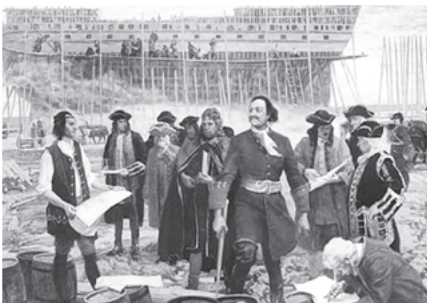
С 2010 года изменилась роль директора: раньше - проситель и снабженец, сегодня - стратег и организатор

сто можно слышать, что директора боятся отпускать своих замов на аттестацию, дабы те их не подсидели. Наверное, некоторые не очень умные директора, мысленно приватизировавшие школы и установившие крепостное право для своих работников, так и думают. Мудрые же понимают, что как минимум укрепляют свою команду, как максимум - готовят пополнение для директорского корпуса Москвы. И то и другое делается в интересах московских семей, потому что, безусловно, отражается на качестве образования. У команды школы, кующей достойные кадры, никогда не будет недостатка в талантах, стремящихся попасть в эту кузницу. Да и самому кузнецу-директору нечего опасаться за свою судьбу: кузнецы