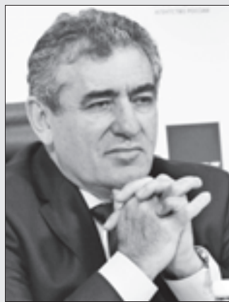
Исаак КАЛИНА, министр образования Москвы:

На портале «Активный гражданин» 27 октября 2014 года стартовал опрос, участники которого должны определить, в какое время будут проходить в Москве школьные каникулы. В то же время в столице проходят дискуссии по этой теме, в которой принимают участие активные москвичи.