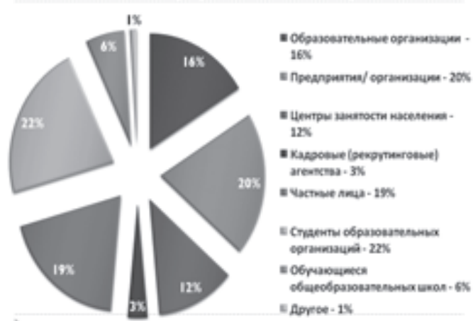
Заказчики программ профессионального обучения и дополнительного профессионального образования

Изучить опыт деятельности учебных центров в столичной системе профессионального образования можно на базе