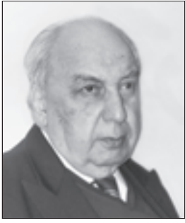
Александр ЧУБАРЬЯН, директор Института всеобщей истории, председатель Комиссии по разработке единой концепции учебников истории, академик Российской академии наук:

— Почему, собственно, вдруг возникла идея и необходимость сегодня говорить о новом или новых учебниках нашей отечественной истории? Вообще это общемировой процесс, сейчас по всему миру идет обсуждение национальных систем образования и идеи создания каких-то новых поколений учебников. Я был на двух заседаниях Совета Европы в Стамбуле и Осло, на которых обсуждали, каким должен быть европейский учебник по истории. В процессе подготовки нашей концепции учебника я ознакомился с тем, как обстоит дело в Азии, Китае, Японии, где учебникам сейчас тоже уделяется очень большое внимание.