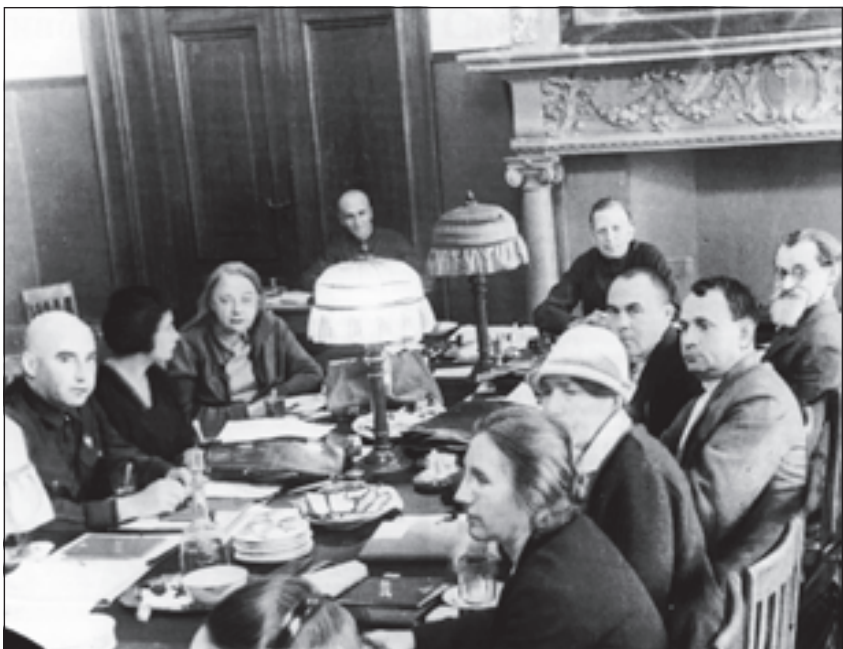
Надежда КРУПСКАЯ на заседании ученого совета при Наркомпросе, 1935 год.

«Учительская газета» выполнит свою задачу - быть коллективным организатором учительства». «Сделать слышнее голос учительства» - вот уже 90 лет газета живет под этим лозунгом, провозглашенным в передовице, хотя многое переменялось за это время. Ушел в прошлое призыв, украшавший газету не одно десятилетие: «Пролетарии всех стран, соединитесь!», а вот простые, душевные слова о том, чтобы учитель не чувствовал себя безнадежно одиноким, не теряют своей актуальности. Да и газета для учителей живет, меняя лишь периодичность, формат, цену. Та первая, пять копеек за номер, вызовет сегодня вздох изумления, но у «шкрабов» тридцатых годов зарплата была от 6 до 18 рублей в месяц.