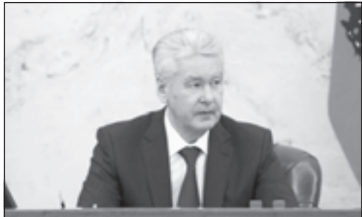
Сергей СОБЯНИН, мэр Москвы