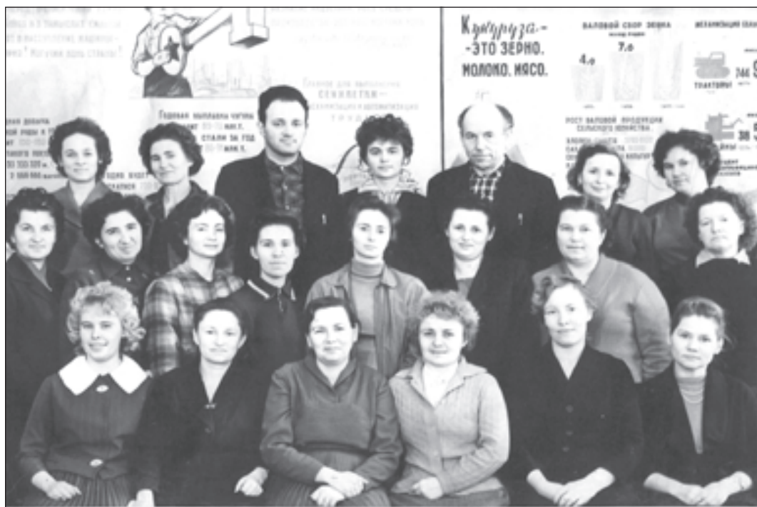
ПЕРВЫЙ УЧИТЕЛЬСКИЙ КОЛЛЕКТИВ