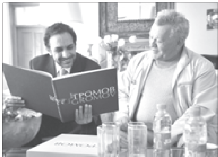
В эту поездку художник взял с собой свой альбом, в котором 370 мгновений истории