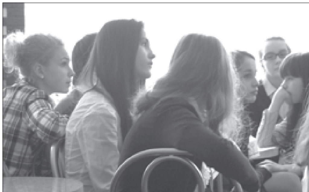
Столовая гимназии превращена в арт-кафе