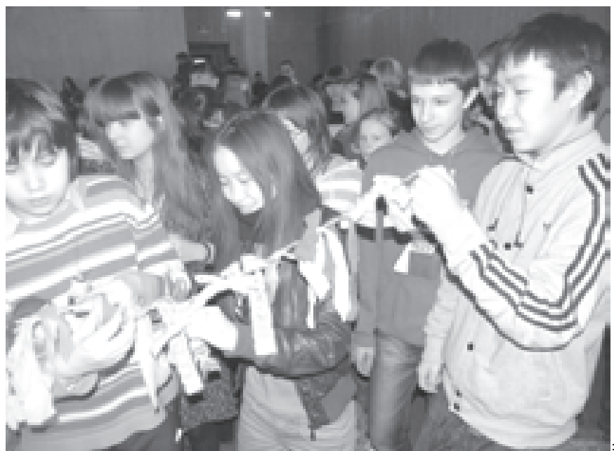
Новая традиция игр, заглядывая желанием, завязывать узелок

В нашем государстве можно построить гражданское общество, победив правовой нигилизм и правовую неграмотность. «Дебаты» дают такую возможность.