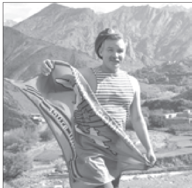
Никто, кроме нас!