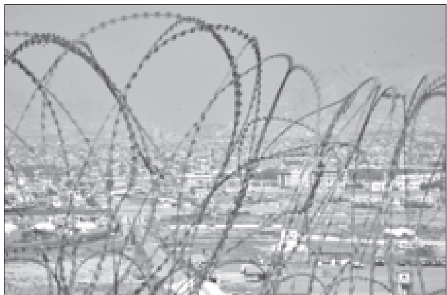
Вид на разрушенный Кабул