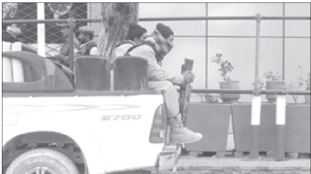
Война окончена. Но осадок остался