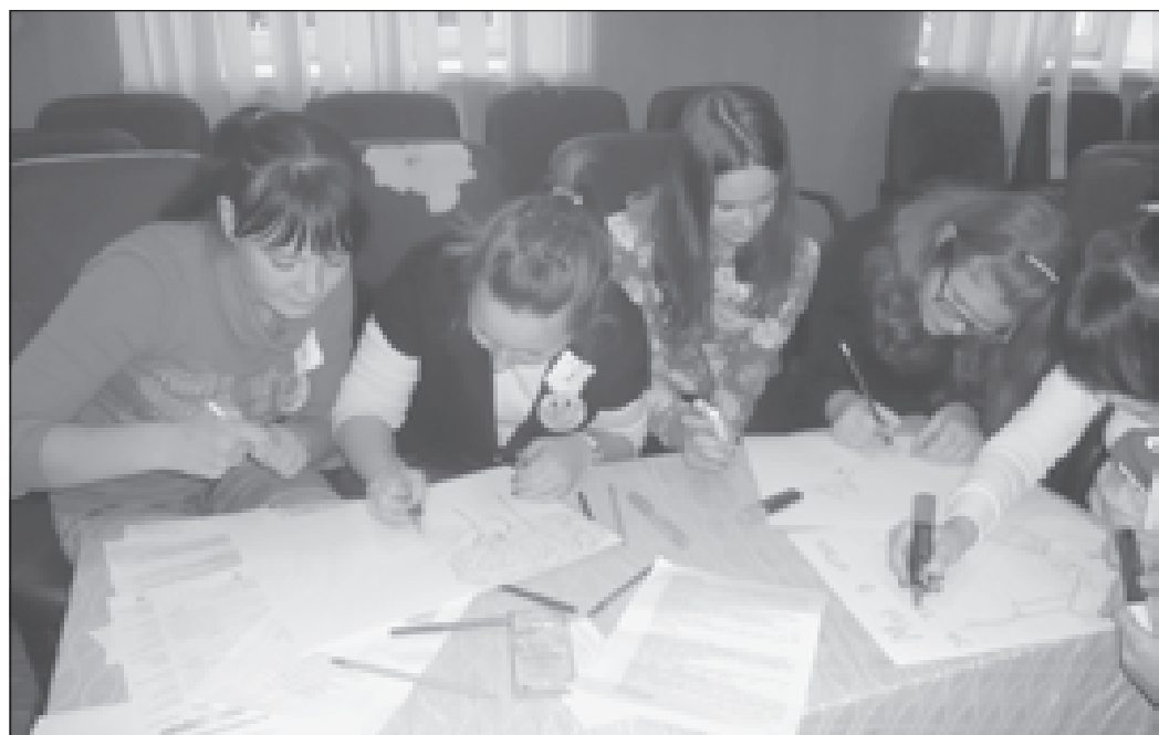
Так рождаются школьные плакаты