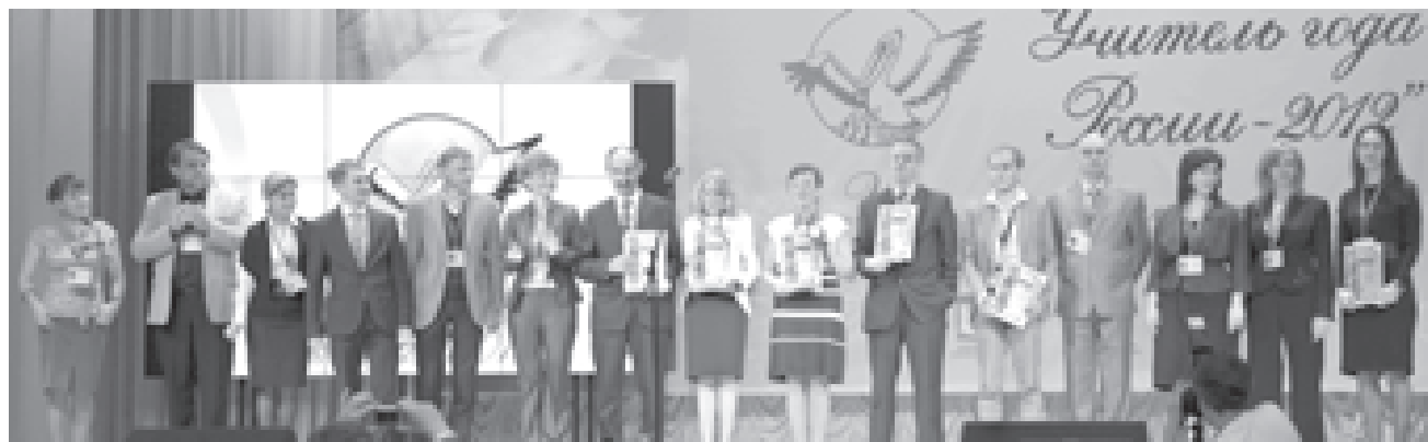
Пятнадцать финалистов. Пятнадцать звезд

Кому достанется главный приз Всероссийского конкурса - «Большой Хрустальный пеликан» - станет известно уже завтра.