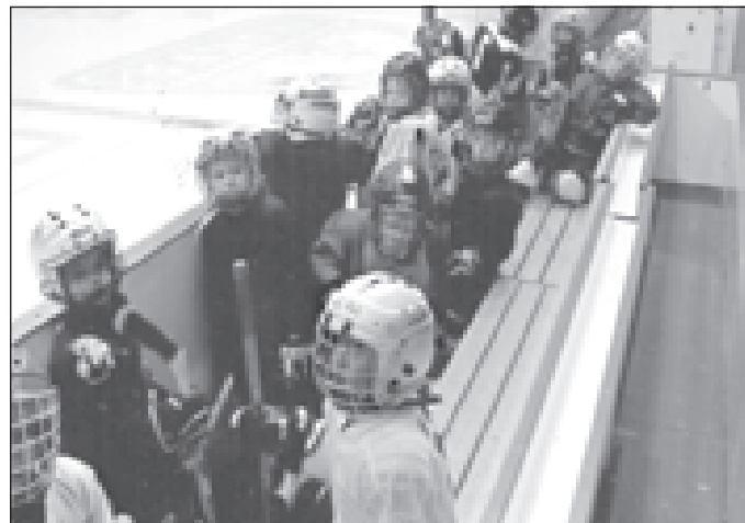
Еще можно, что эти малыши станут звездами хоккея