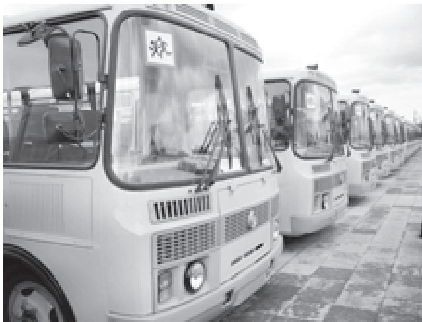
Все автобусы отвечают современным требованиям к безопасности

В 2011 году в рамках проекта модернизации системы общего образования автопарк забайкальских школ пополнился 22 автобусами. Из федерального бюджета поступило более 15,5 миллиона рублей на приобретение транспорта для перевозки школьников, 12,5 миллиона рублей было выделено краевым бюджетом.