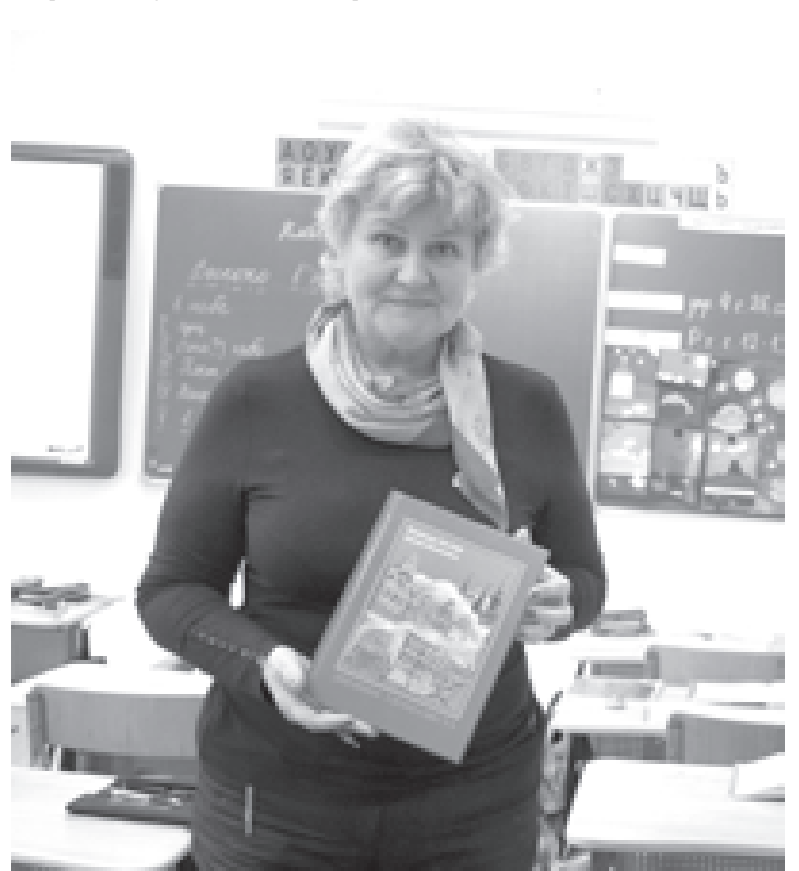
У гимназистов есть собственный дневник

нии, воспитании. Здесь было не важно, какие у кого фамилии, родители. Мой старший брат учился здесь. Потом младшая сестра. Моя дочь окончила школу с серебряной медалью. Это история каждого из нас. Когда мы устраиваем встречи выпускников, все стара-