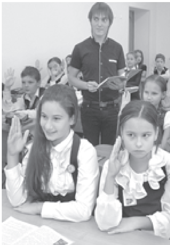
Нам учиться интересно!