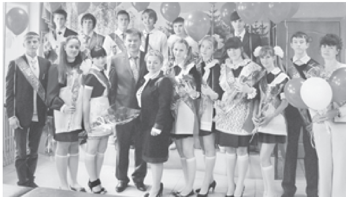
Команда, без которой мне не жить

- Да, у нас на тот момент одна учительница находилась в декретном отпуске, а когда вышла, мы ей сказали и о необходимости знания компьютера, и об обязательной аттестации. Также о том, что надо будет в конкурсах участвовать и ей, и ее ученикам. Стали ей помогать, подсказывать, что прочитать, где найти информацию... Смотрим, а она приносит заявление об уходе.