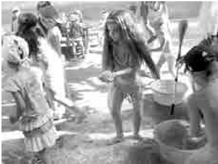
На занятии «Красота воды»

Что такое смерч? (Это сильный вихрь, поднимающий столбом воду и песок.)