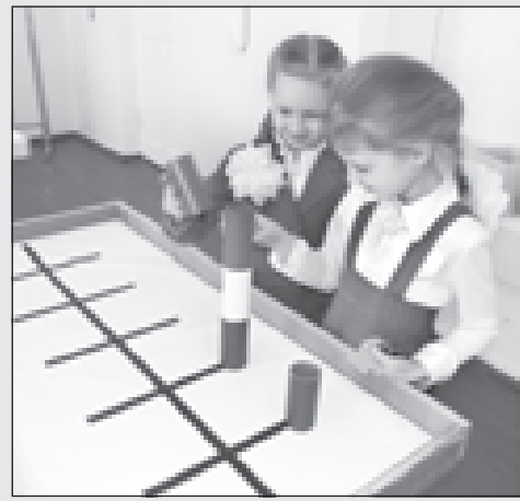
Робототехника увлекает и девочек

- Работать с нашими детьми интересно. Здесь никого не надо заставлять. Наоборот, ребята после занятий домой не торопятся. Два часа пятнад-