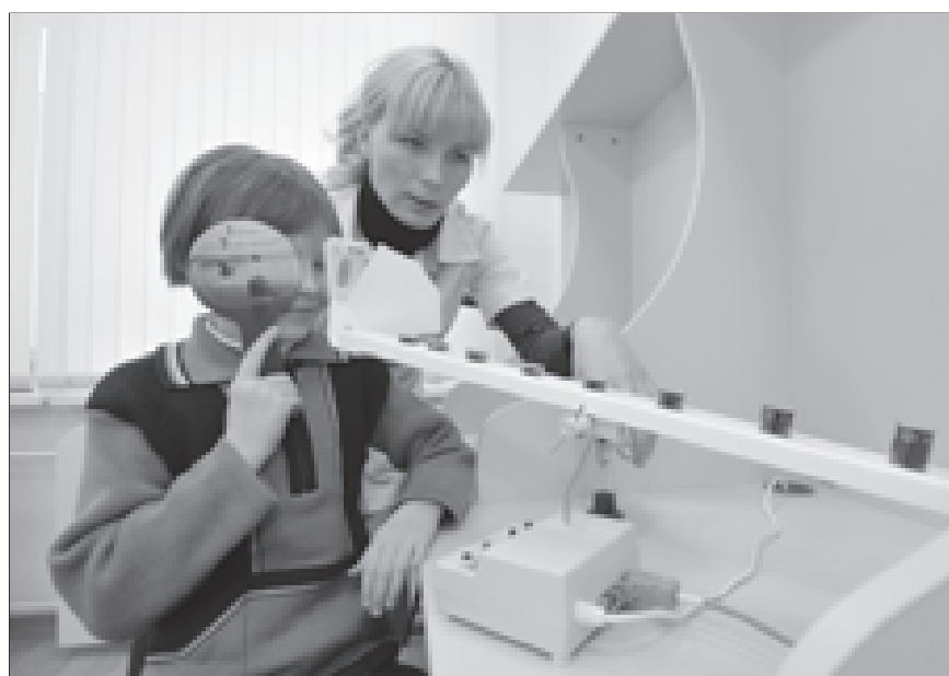
В школе есть прекрасно оборудованный офтальмологический кабинет

Особое внимание уделяется здесь коррекционным курсам - ориентировка в пространстве, ребята осваивают социально-бытовую ориентировку, занимаются ритмикой. Им помогают развивать мимику и пантомимику, зрительное восприятие. По некоторым курсам созданы авторские программы, которые прошли апробацию и получили