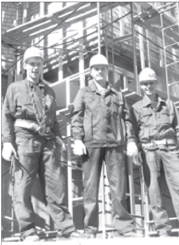
Профессия строителя сегодня самая востребованная

В 2012 году в Челябинской области функционируют 49 учреждений начального профобразования с численностью обучающихся 13685 человек и 67 образовательных учреждений среднего профобразования, студенческий состав которых равен 53890. Система профобразования насчитывает 116 учебных комплексов, расположенных в 32 муниципальных образованиях. В союзе с предприятиями и объединениями работодателей действуют 28 ресурсных центров, на базе которых создана система оценки качества образования. ЮУрГТК один из них.