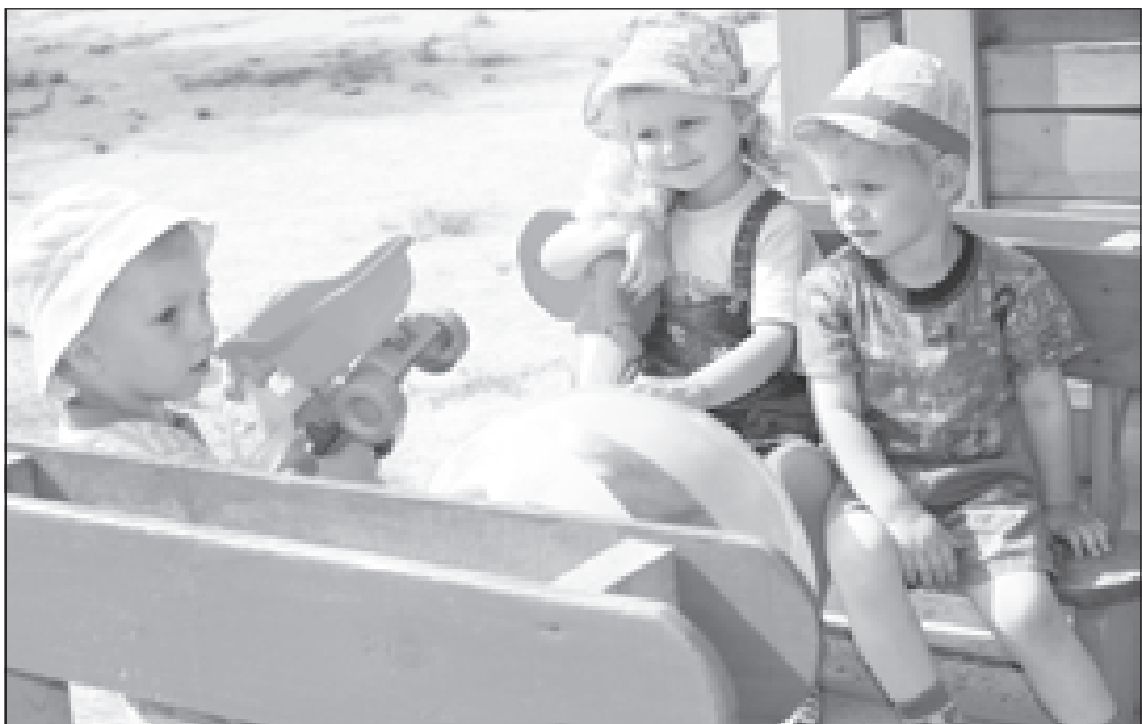
В этом саду комфортно, как дома

Порадовало, что практически все воспитатели, причем далеко не юного возраста, прекрасно владеют компьютерными технологиями, со-