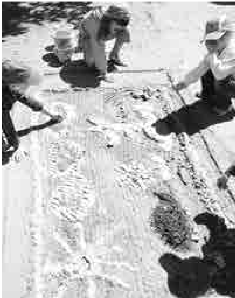
На занятии «Разные формы земной поверхности»

Психомышечная тренировка с фиксацией внимания на дыхании: игра с «песком».