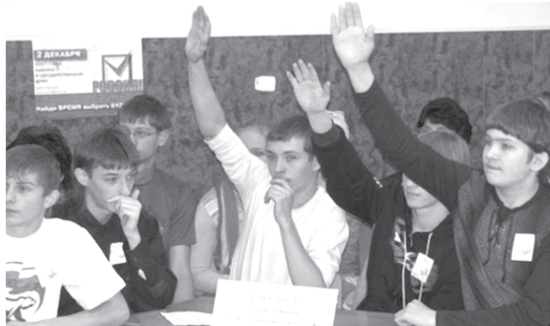
Готовы ответить на все вопросы!

Масштабность этой работы в Приозерском политехническом колледже можно охарактеризовать следующими данными: за период 2008-2011 гг. студентами написано и защищено более 1400 курсовых проектов и работ, защищено 390 выпускных квалификационных работ (далее - ВКР). Необходимо отметить, что значительное число курсовых проектов (работ) и ВКР включает элементы научных исследований, а часть ВКР рекомендована к внедрению Федеральной службой по интеллектуальной собственности, патентам и товарным знакам. Сегодня Приозерский колледж является патентообладателем трех полезных моделей деревообрабатывающего оборудования. О достаточно высоком качестве выполненных студентами ВКР свидетельствуют количественные и качественные показатели и оценки Государственной аттестационной комиссии.