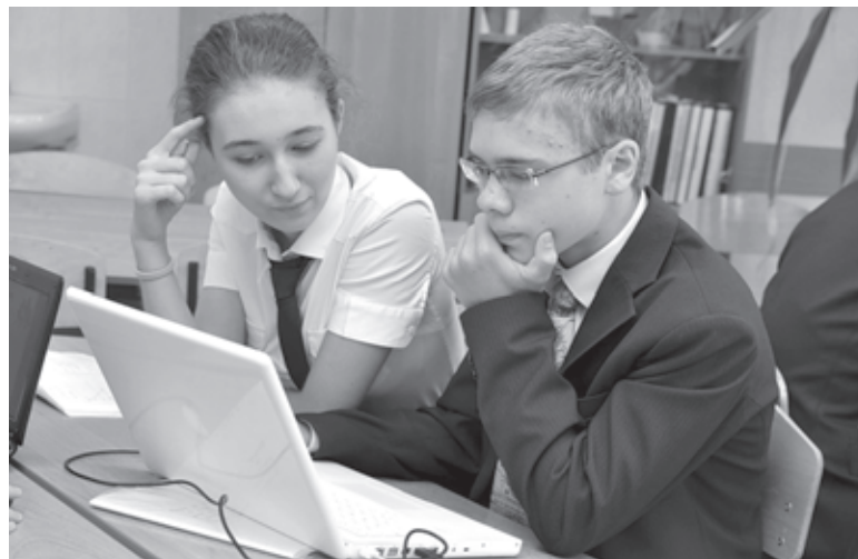
Социальные сети можно сделать полезными для детей

Правда, нужно отметить и положительные сдвиги. Например, уже даже само Минобрнауки РФ, беря пример с первых лиц нашего государства, принялось осваивать сети, создав аккаунты в Живом Журнале, в Твиттере, в Ютубе и ВКонтакте. Сегодня нет, наверное, ни одного известного политика, актера, депутата, журналиста, который бы не вел свой блог и не участвовал в интернет-обсуждениях. Свои представительства в тех или иных социальных сетях имеют вузы, колледжи, издательства, СМИ и многие другие организации. Возможность воздействовать на пользовательскую аудиторию, ощущать ее настроение, получать последние известия из первых уст и так далее оценили все, кто способен понять всю важность момента. При некоторых образовательных учреждениях (на-