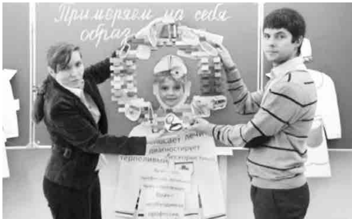
Профорориентация в начальной школе - это еще и попытка понять самого себя

- воспитывать ответственность, творческую самостоятельность,