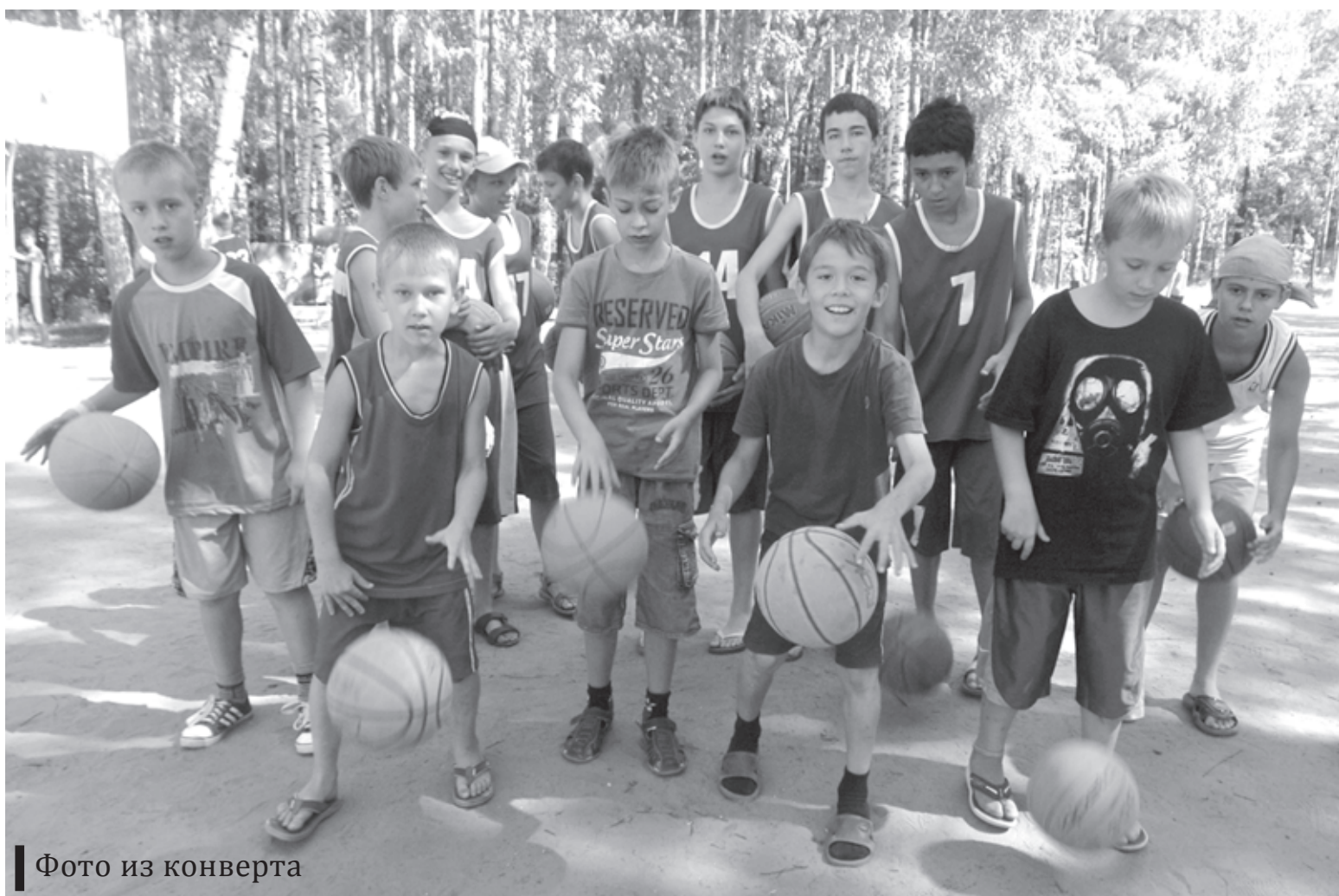
Фото из конверта

Лето, солнце, футбол... Юным спортсменам из школы олимпийского резерва города Казани настоящее раздолье в живописном лагере «Пламя», расположенном на берегу озера Лебяжье. Кстати, лагерю в этом году исполнилось шестьдесят лет