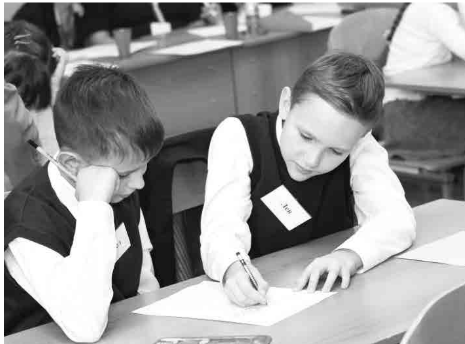
Работа в группе, даже в паре, требует особого внимания и ответственности