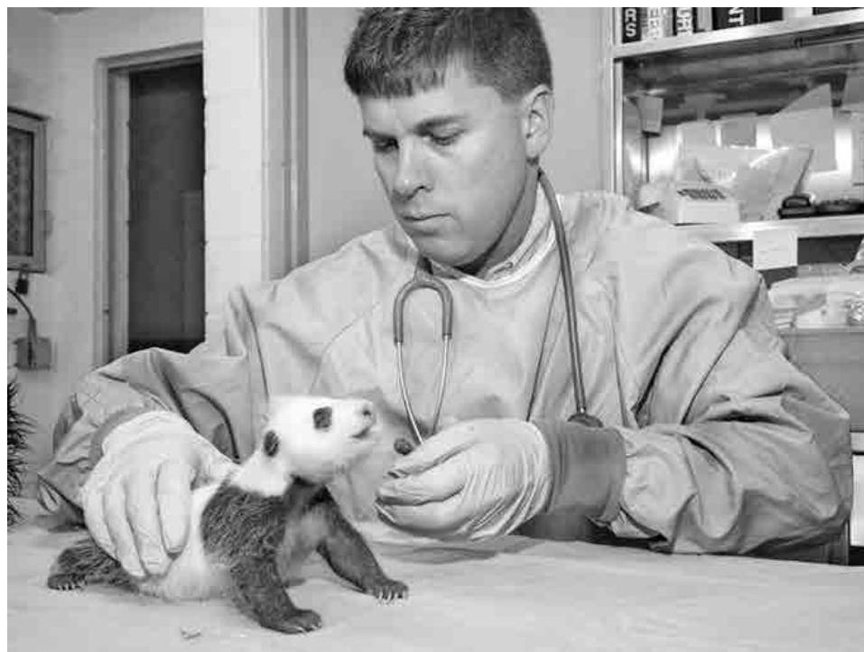
Непростая работа у ветеринара