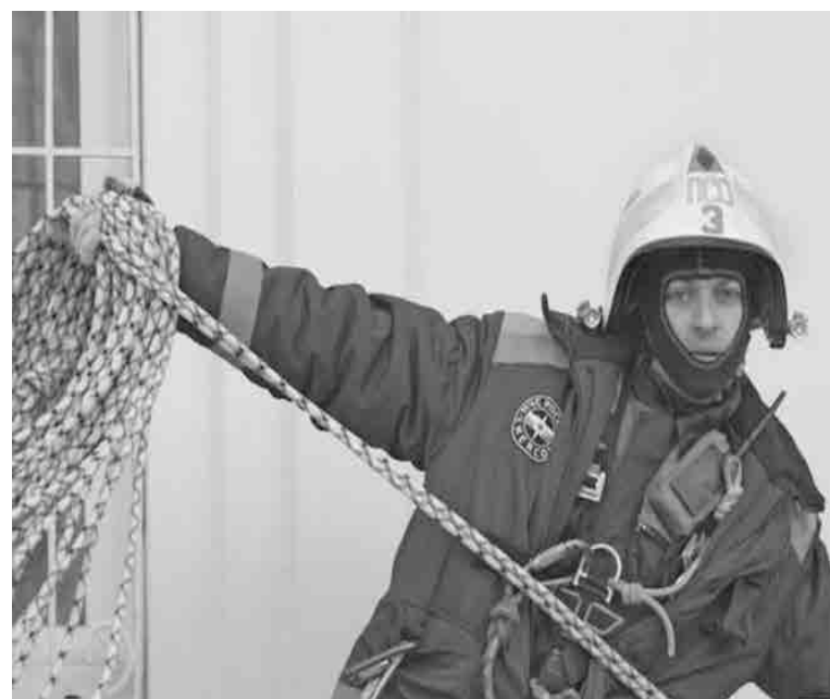
Профессия - спасатель

коммуникабельность, трудолюбие, бережное отношение к результатам своего и чужого труда; - воспитывать понимание роли труда в жизни человека.