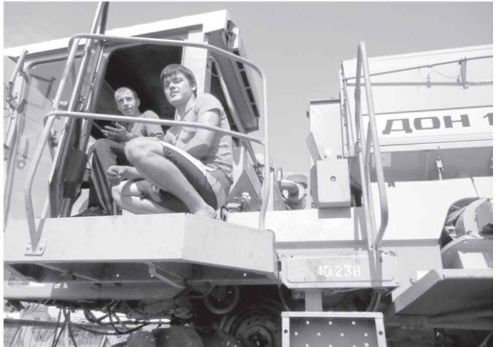
Торжественный выход в поле

В этом году в техникуме впервые на время летней практики создан студенческий сельскохозяйственный отряд «Колос», который уже больше месяца работает на базе ООО «МАПО-Ардатов». Студенты - всего их здесь 10 человек - готовят технику к уборочной. Они сами же на этих комбайнах будут выходить в поле. Предприятие выделило студентам «ДОНы 1500», «Акросы 580». Третьекурсники приняты на работу комбайнерами, второкурсники - помощниками комбайнеров. Два человека на один комбайн. Когда начнется уборка ячменя и пшеницы, зависит от погодных условий. Местные надеются приступить к работе в самое ближайшее время.