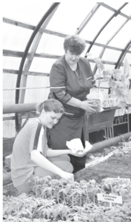
Школьники будут готовить к трудовой деятельности

Галина СИБИРКИНА, Новосибирск