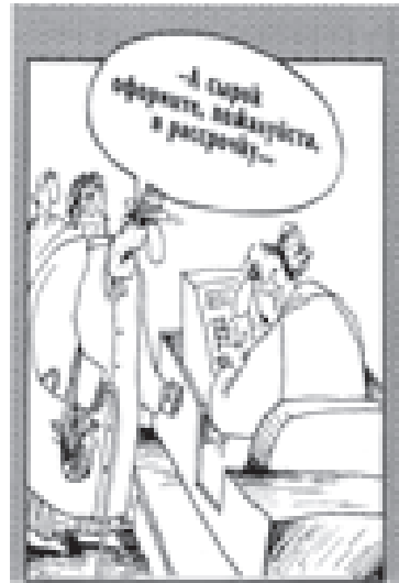
Рис. Вячеслава ШИПОВА

В определении Конституционного суда РФ от 15.05.2007 №378-О-П «Об отказе в принятии к рассмотрению запроса Амурского городс-