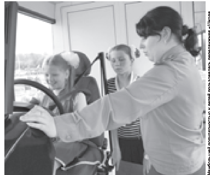
Наибольшей популярностью у детей пользовалась передвижная «Школа дорожной безопасности» — оборудованный тренажерами и видеозалом автобус

А ребята в этот день без устали принимали участие в увлекательных конкурсах и викторинах в рамках квест-игры «Остров безопасности» и подсказывала Красной Шапочке, отправившейся в страну Светофории, как избежать козней коварной госпожи Аварии. Все было исключительно живо и весело. Красочные образы помогают детям