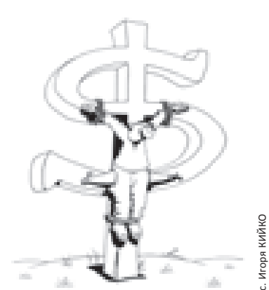
Рис. Игорь Кийко

Вместе с тем, принимая во внимание, что к государственным наградам, почетным званиям, к ведомственным знакам отличия, к участию в конкурсном отборе, как правило, представляются педагогические работники, имеющие квалификационную категорию, при рассмотрении их заявлений об аттестации на ту же самую квалификаци-