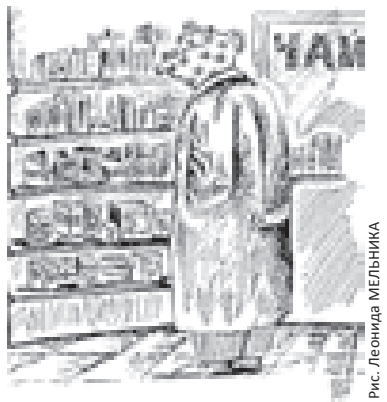
Рис. Леонид Мельник

Все помещения медицинского назначения должны быть сгруппированы в одном блоке и размещены на 1-м этаже здания.