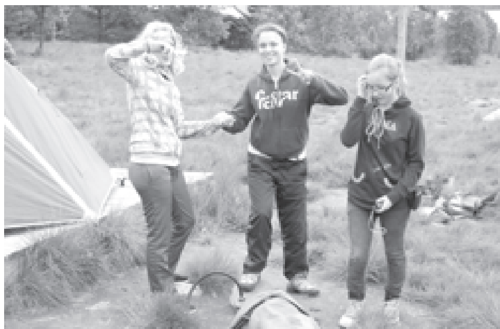
Как это важно - рука друга!

Спонсоры программ клуба «Приключение»: «Нестле Россия», «Нестле Пурина ПетКер», «Макдоналдс», ГУП «Столичные аптеки», ЗАО «Каргилл», Агрохолдинг ОВА, ОАО «Канат».