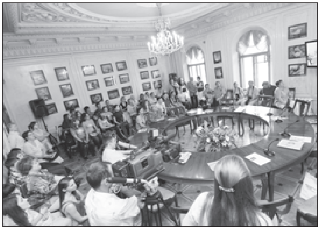
В блистательном мраморном зале среди архитектурных излишеств...