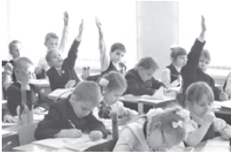
Наш учитель - самый лучший!

Теперь его молодым коллегам предстоит работа по определению более точных характеристик частицы и выяснению ее роли для понимания устройства Вселенной. Впрочем, не исключено, что «найденный» все-таки окажется не бозоном Хиггса, а чем-то другим, но не менее любопытным.