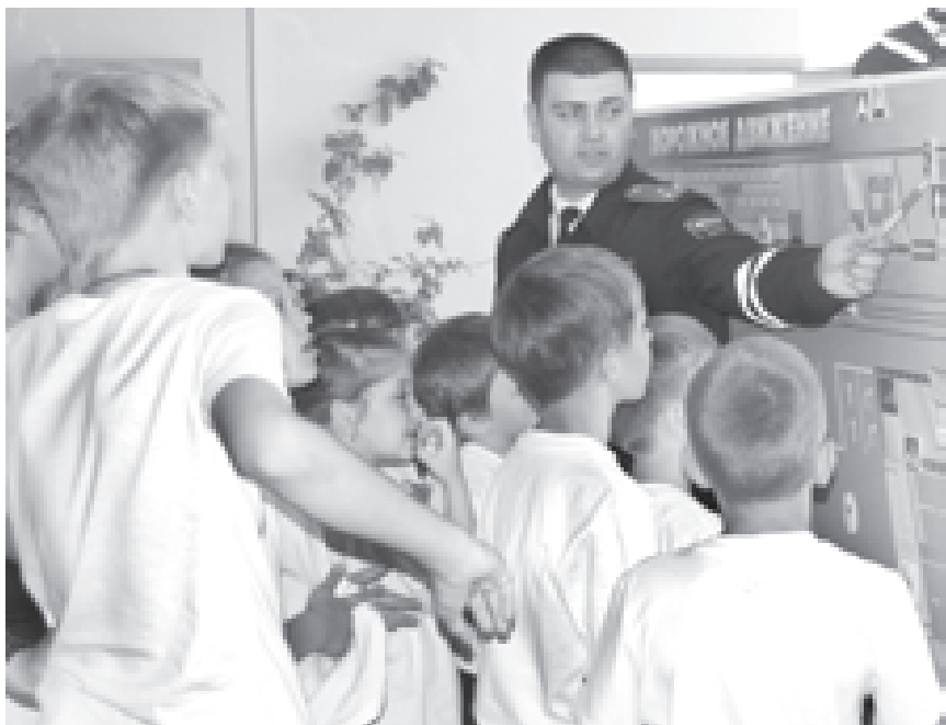
Инспекторы дорожного движения тщательно рассматривают с детьми каждую ситуацию