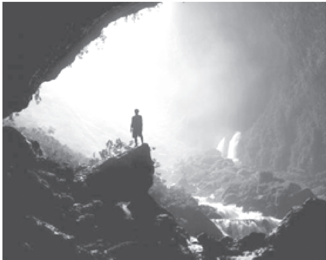
Загадочный и прекрасный мир