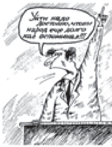
Рис. Леонид МЕЛЬНИКОВ

Необходимо учитывать, что данные причины устанавливаются судом при рассмотрении заявления об усыновлении ребенка на основании исследования и оценки всех