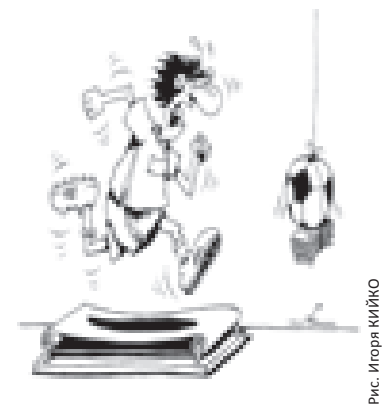
Рис. Игорь КИЙКО

Оздоровительные учреждения комплектуются из числа обучающихся одной или нескольких общеобразовательных, спортивных, художественных школ и иных учреждений для детей и подростков, подразделяются на отряды не более 25 человек для обучающихся 1-4-х классов и не более 30 человек для остальных школьников.