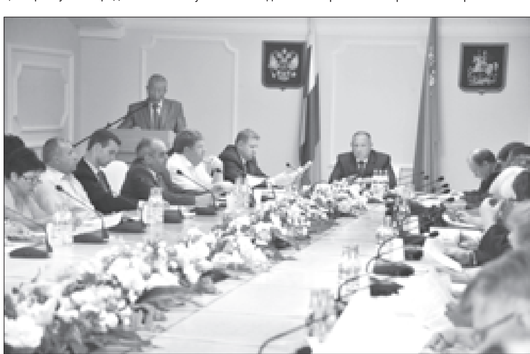
Работа на секциях была напряженной