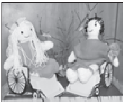
Подарка «Ребенок-инвалид - полноценный член общества» на Московском областном конкурсе «Права человека - глазами ребенка»

Эту необыкновенную историю рассказала мне мама. История так потрясла, что с тех пор иногда я ее вижу во сне.