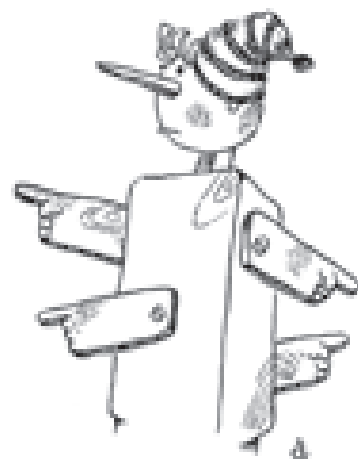
Рис. Василия АЛЕКСАНДРОВА