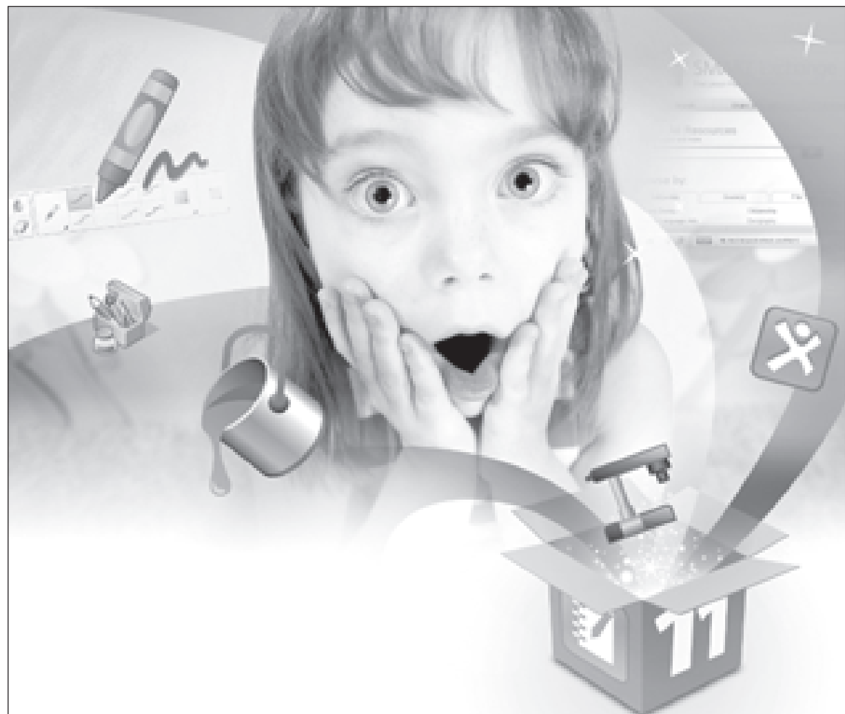
На пороге открытий

Плавный переход от лекций к индивидуальному обучению возможен