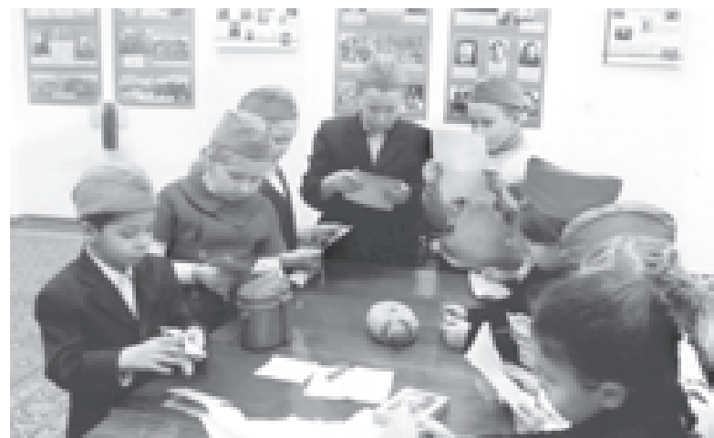
В школьном музее