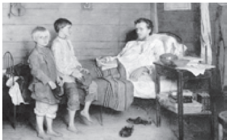
У больного учителя. Николай Богданов-Бельский

О какой поддержке сельских учителей может идти речь, если меры их социальной поддержки только ухудшаются?!