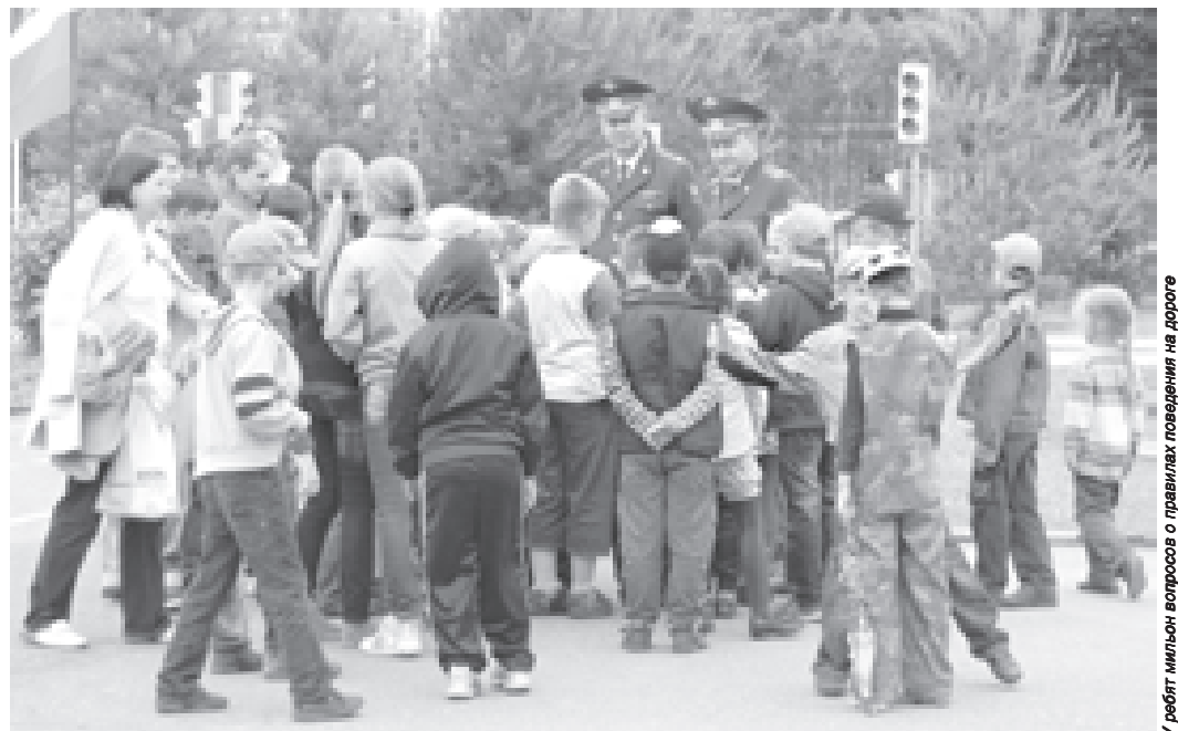
У ребят миллион вопросов о правилах поведения на дороге