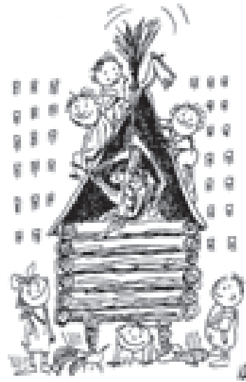
Рис. Виктория БОГОРАДА

При этом, если договором об ипотеке не предусмотрено иное, обращение взыскания на имущество, заложенное для обеспечения обязательства, исполняемого периодическими платежами, допускается при систематическом нарушении сроков их внесения, то есть при