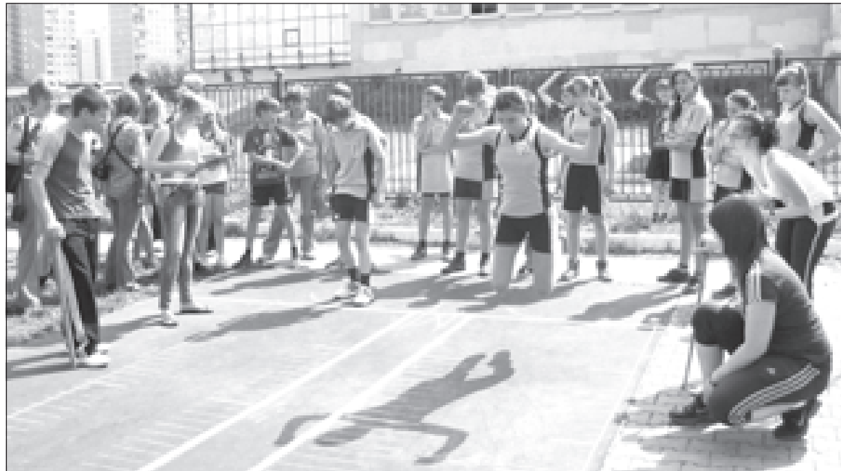
Студенты МГОУ судят финальные соревнования «Президентских состязаний»

Студенты освоить спортивный менеджмент не прочь