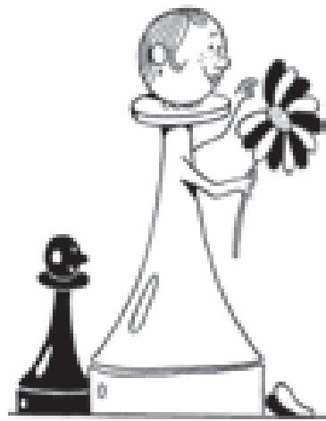
Рис. Виктория АЛЕКСАНДРОВА

Что касается определения доли супруга в данной квартире, то необходимо отметить следующее. По