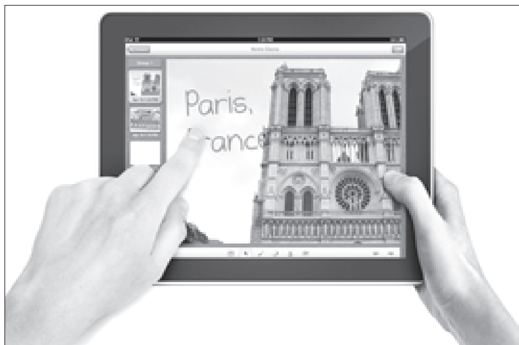
Отправляемся в путешествие

Предположительно программное обеспечение SMART Notebook Interactive Viewer будет доступно уже осенью. После завершения процесса локализации программного обеспечения SMART Notebook Interactive Viewer для операционной системы Microsoft Windows будет доступно на английском, французском, немецком, испанском, русском