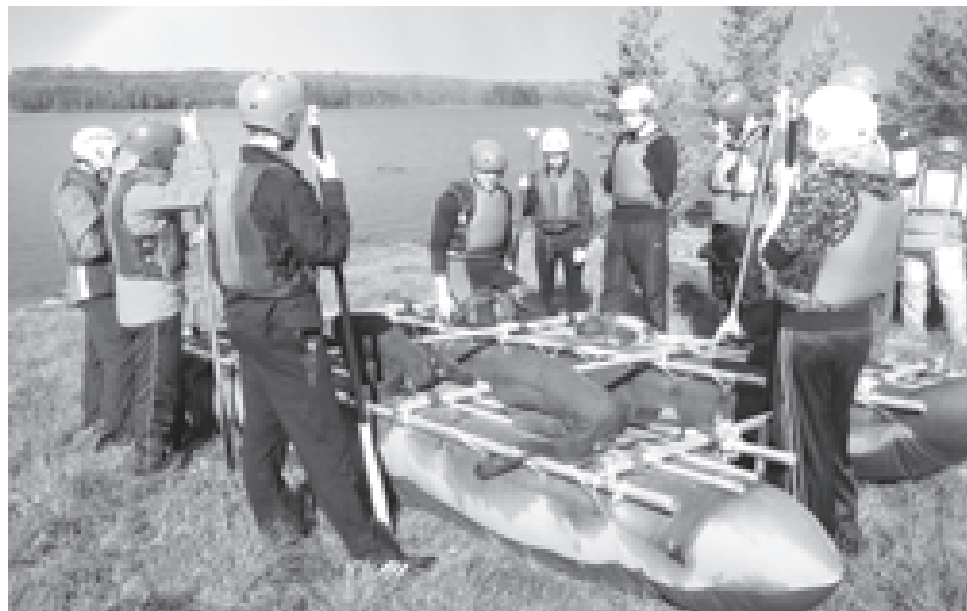
Подготовимся к походу

Картина четвертая. Закончился поход для еще одной «коррекционной группы» - детей из школы для умственно отсталых вел инст-