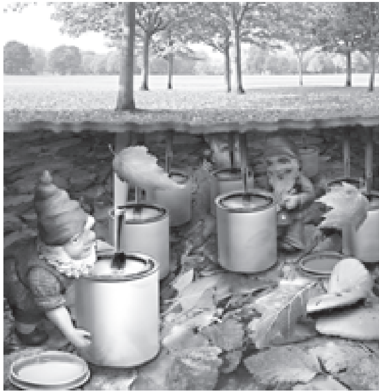
Одни живут на земле, другие под землей...