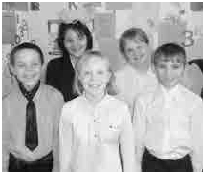
Наш класс - дружная семья!

« коллектив » - выбор и работа актива класса, работа по сплочению коллектива.