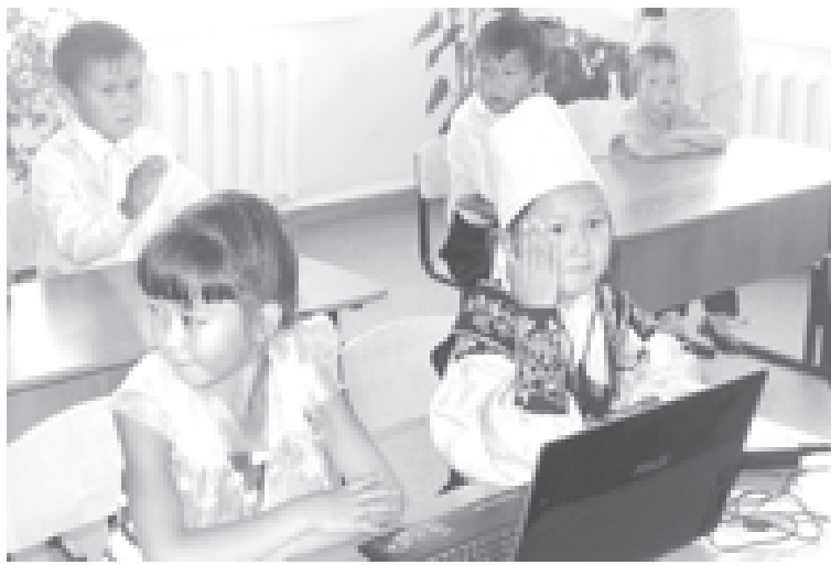
Теперь у ребят есть новая школа!