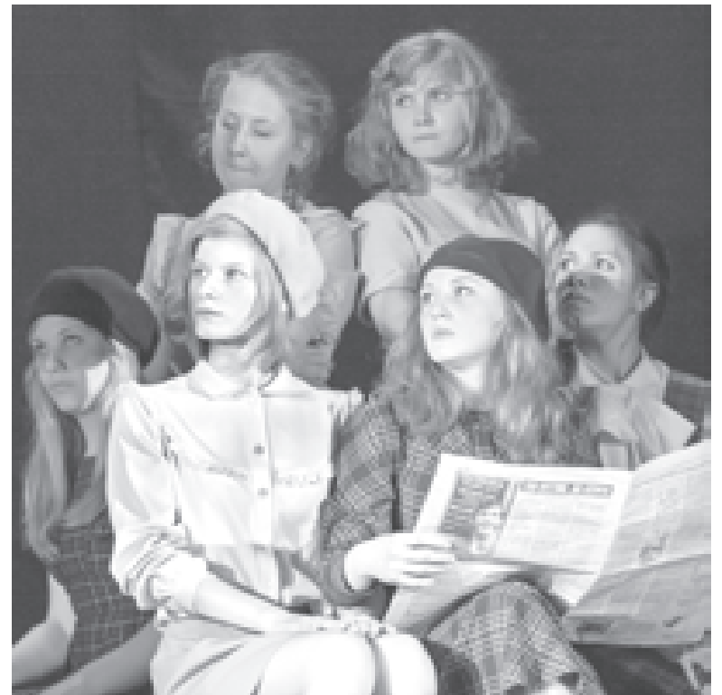
Спектакль «Дневник Анны Франк. Эпизоды» (молодежная студия-театр «Диминанта», г. Губаха, Пермский край)