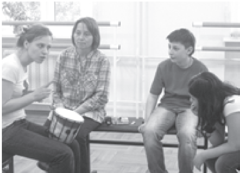
Детская редакция в творческом процессе

В мае в Москве прошел IX фестиваль-семинар детской театральной педагогики «Пролог-Весна», основные организаторы которого кафедра эстетического образования и культурологии МИОО и АНО культуры и образования «Пролог». В этом году в преддверии I Всероссийской конференции школьной театральной педагогики памяти Л.А.Сулержицкого авторская группа, иницилирующая и конференцию, и фестиваль-семинар, решила провести эксперимент и по-новому организовать образовательную программу фестиваля.