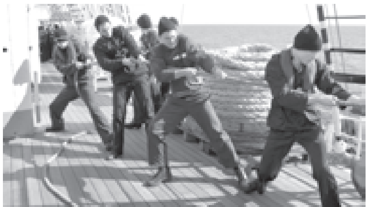
В походе ребятам предстоит нести вахты, драить палубы и вести бортовой журнал

светной экспедиции на этапе Осло (Норвегия) - Киль (Германия) - Мальме (Швеция) - Киль (Германия) - Куксхафен (Германия) - Бремерхафен (Германия) - Брест (Франция). Плавание продлится до 17 июля.