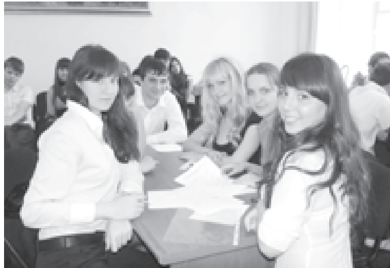
Студенты юридического института «переводят» законы на русский язык

земпляры «Налогового букваря» появятся к началу учебного года. Кроме того, книга будет иметь и электронную версию.