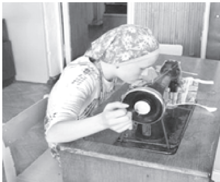
Работа в швейной мастерской.

Были работы, посвященные воинам-интернационалистам, жертвам терроризма. Необыкновенной силы работа о детях Беслана Мари-