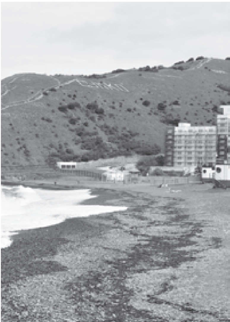
Скоро на Черноморском побережье станет многолюдно

С 30 июля по 16 августа в Федеральном детском оздоровительно-образовательном центре «Смена», что в поселке Сукко, в 20 километрах от Анапы, соберутся финалисты Всероссийской акции «Я - гражданин России», проводимой под эгидой «Учительской газеты». В суперфинальных состязаниях им предстоит выяснить, какая из 19 команд, прибывших со всех концов нашей страны, стала лучшей из лучших. Помимо этого взрослых и ребят ждет весьма разнообразная образовательная, воспитательная и оздоровительная программа, предложенная гостеприимными хозяевами.