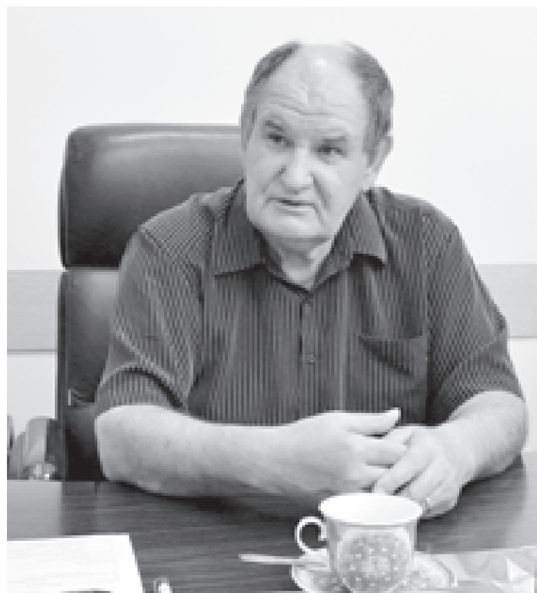
Четверть века на боевом посту

Пушкин, Невский, Ломоносов, Екатерина II, Суворов, Донской, Го-