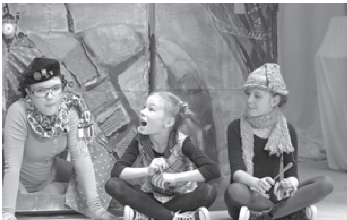
Спектакль «Где-то вдалеке пел дрозд» (московская студия «Однажды»)