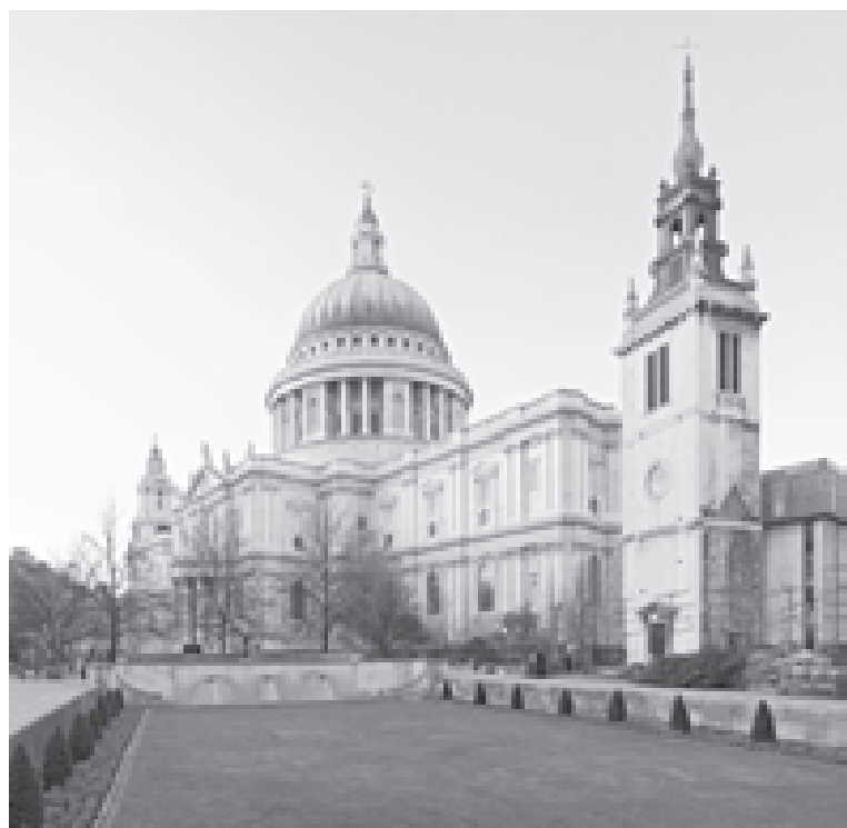
Кафедральный собор Святого Павла