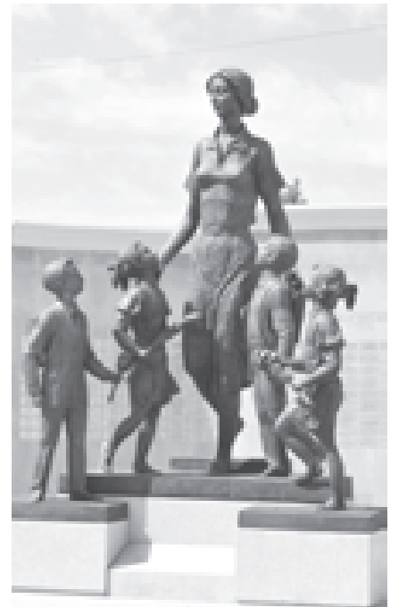
Бегом по «лестнице знаний»