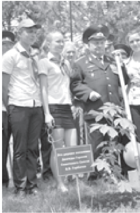
Дерево, посаженное героем-космонавтом, будет расти и крепнуть