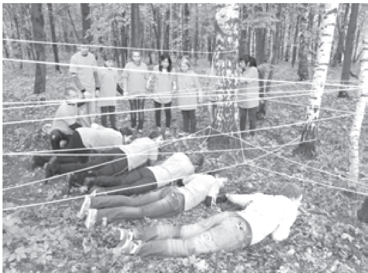
Игра на сближение. Задание - всей командой преодолеть полосу препятствий