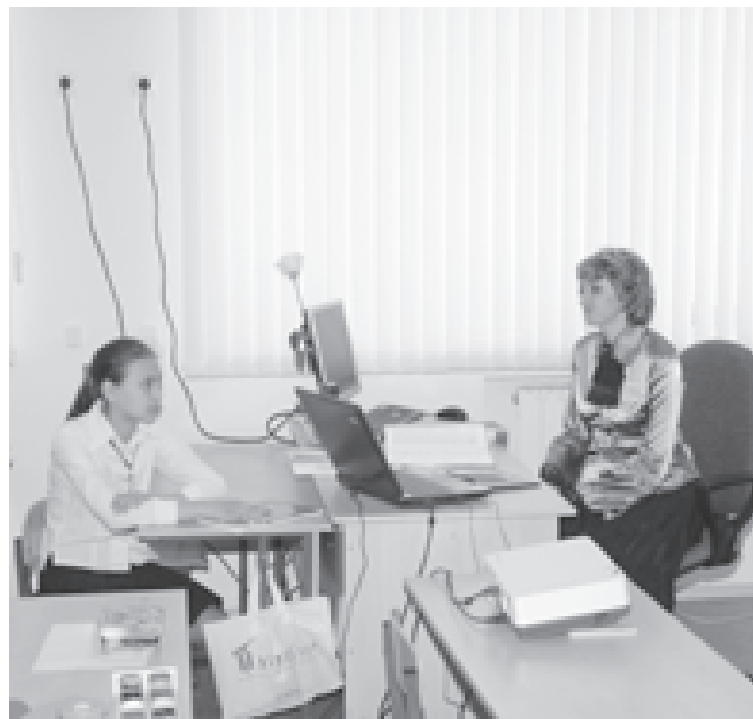
Волка ноги кормят, а педагога две ставки

плата, такие педагогические работники могут, на мой взгляд, участвовать в профессиональных конкурсах педагогов-психологов, социальных педагогов. Но все-таки, откровенно говоря, на данный момент эти педагоги получают заработную плату меньшего размера, чем учителя. Напряженности по этому поводу у нас в коллективе нет. Стараемся компенсировать разницу отгулами, премиальными выплатами.