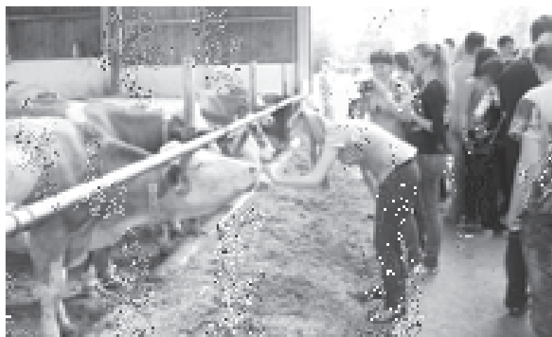
На животноводческой ферме