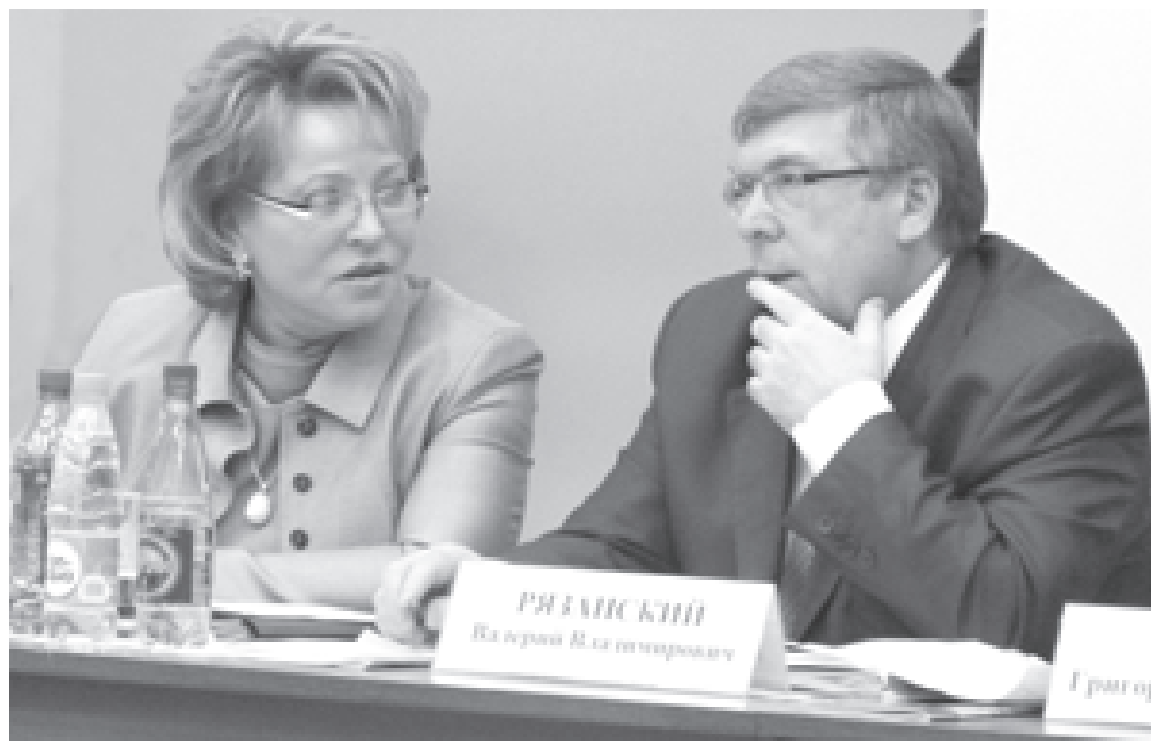
Валентина МАТВИЕНКО и Валерий РЯЗАНСКИЙ