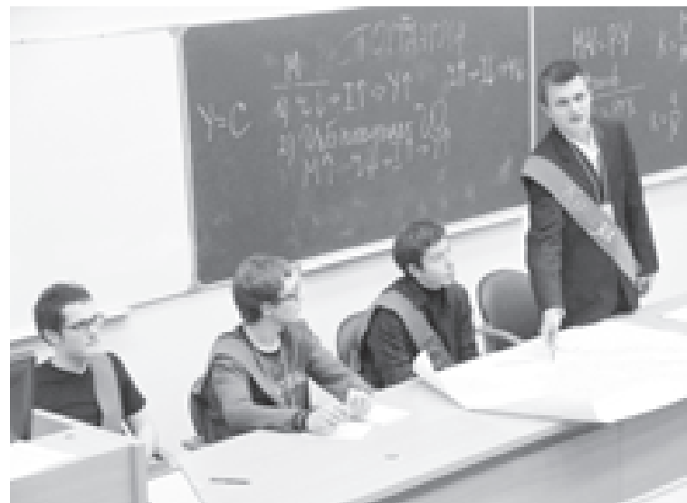
Заседание сената. Первый курс факультета глобальных процессов МГУ им. М.В.Ломоносова

Деятельность игроков можно разделить на две части. Первая - нужно крутить гайку. Она находится в помещении, где «действует радиация», поэтому игрок может находиться там не более 20 секунд. Здесь задействованы все, кроме того, требуется организовать командную работу - кто-то следит за временем, кто-то лечит пострадавших, кто-то координирует все действия. Вторая часть - решение задач, для того чтобы спасти корабль. Но часть параметров находится в комнате с реактором, где пребывание ограничено.