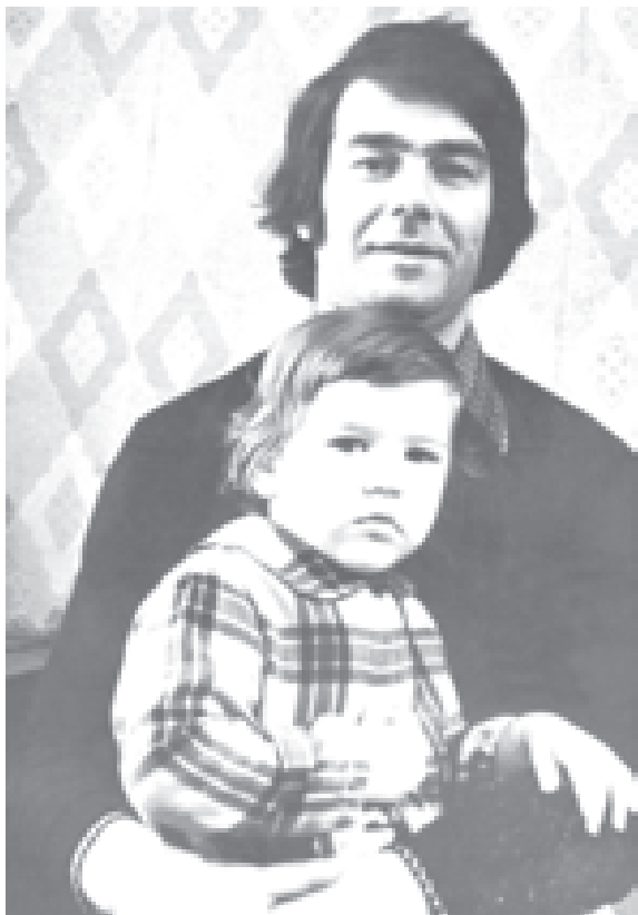
Знаете, кто это? Не знаете?! Это же мой папа!!!

После спектакля артисты спускались в буфет, в старинный зал с лепниной и огромным фонтаном, сохранившимся еще с дореволюционных времен. Тонкие молодые актрисы, казавшиеся мне неземными феями, гладили меня по голове, актеры галантно раскланивались, как со взрослой барышней. Я сидела в бархатном кресле, ела пирожное «каштан», а папа, самый кра-