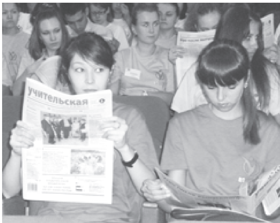
Первое знакомство с профессиональной прессой