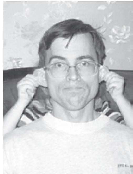
Папа может быть кем угодно... И я тоже!