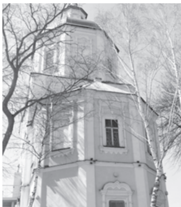
Покровский храм г. Тамбова

Завершение акции планируется к сентябрю 2014 года, а ее итогом станет издание сборника «Утраченные святыни земли Тамбовской», куда войдет вся собранная юными исследователями информация, и установка памятных знаков на местах разрушенных храмов.