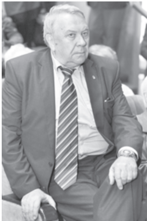
Академик Владимир ФОРТОВ предложил конкретную программу реформирования РАН

Надо признать, что больше всего конкретных предложений и критичности по отношению к РАН - в предвыборной программе академика Фортова. Выдающийся физик, чьи труды продвинули развитие импульсной и промышленной энергетики, космической физики, управляемого термоядерного синтеза и ракетной техники, бывший министр науки и технологий и вице-премьер в правительстве Виктора Черномырдина раскритиковал академию за инертность и бюрократизм, с которыми намерен усиленно бороться.