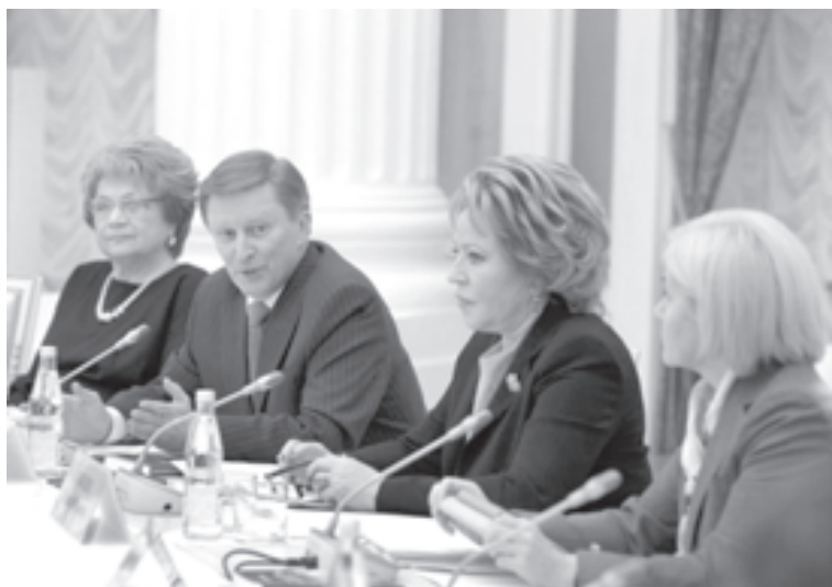
На заседании координационного совета

Как отметила в своем заключительном слове председатель Совета Федерации Федерального Собрания РФ Валентина Матвиенко, необходимо изучить поло-