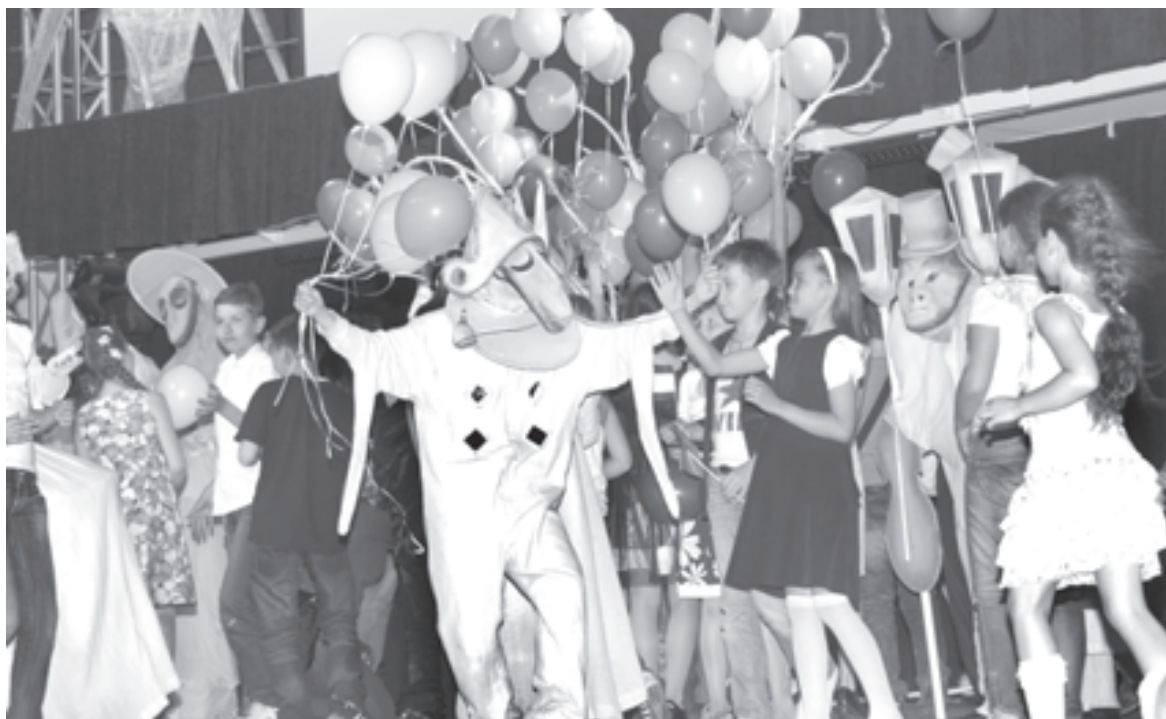
Финал конкурса стал красочным зрелищем

На конкурсе «Живая классика» литература преображала юных чтецов