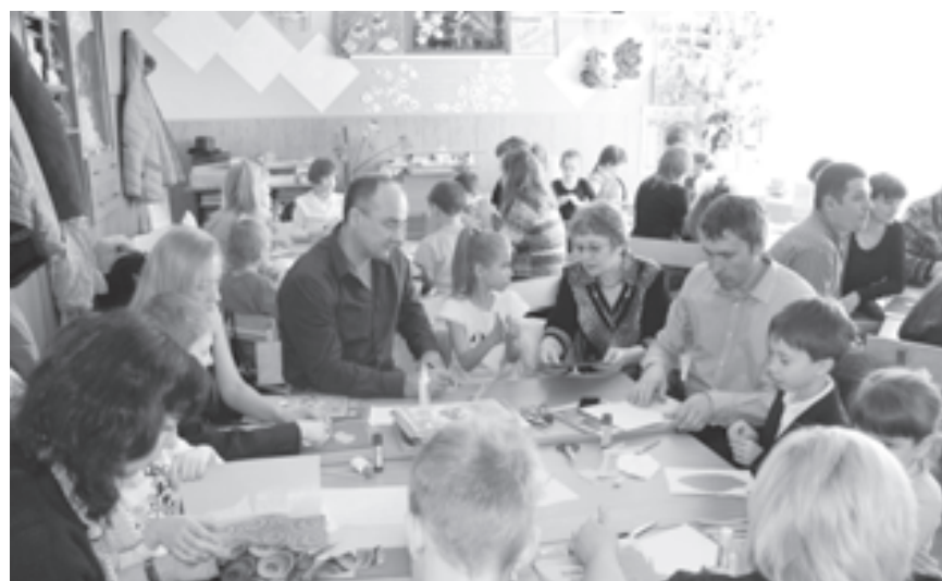
Увлечены все - и дети, и взрослые