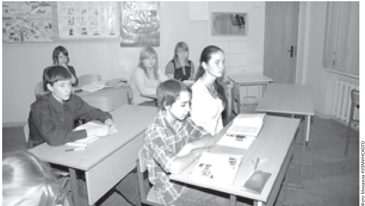
Именно на уроке литературы формируются личность и взгляды молодых

Я никогда не даю ученикам нужных примеров для сочинения. Только после того как они сами написали, я рассказываю, какие возможности здесь открываются для изложения своей точки зрения.