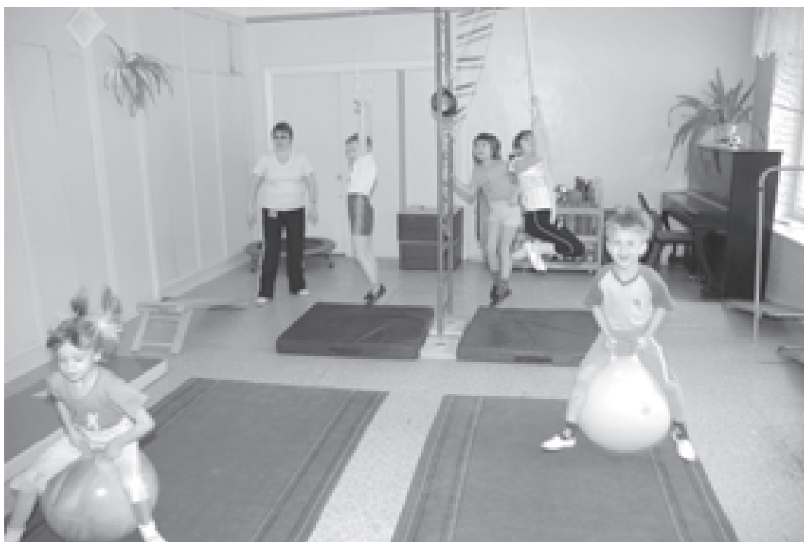
Успешность обучения в школе напрямую зависит от состояния здоровья

На мой взгляд, в школе сейчас есть команда, которая может и должна взять на себя всю ответственность за сохранение здоровья школьников, реализацию профилактических программ, внеурочных спортивных мероприятий, горячее питание, медицинское обслуживание, своевременную диспансеризацию, обсуждение с детьми вопросов здорового образа жизни, - это психолог, социальный педагог, медицинские работники, руководители дополнительного образования, преподаватель ОБЖ, учителя физкультуры и директор. Все вместе мы сможем создать насыщенную, интересную и увлекательную школьную жизнь, которая поможет нашим детям быть здоровее и счастливее!