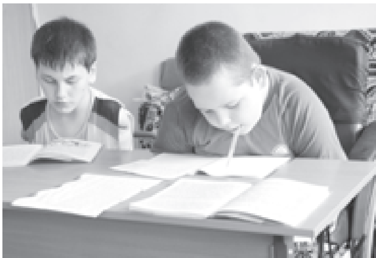
Выполняя домашнее задание...

Московского государственного заочного педагогического института, что помогло многим воспитанникам детского дома стать программистами. Получают девушки и юноши из Дмитрова и профессию техника, обучаясь на факультете «Вычислительные машины, системы, комплексы и сети» Московского промышленно-экономического колледжа. Невозможно - это всего лишь громкое слово, за которым прячутся маленькие люди, им проще жить в привычном мире, чем найти в себе силы его изменить. Невозможно - это не факт. Это только мнение. Невозможно - это не приговор. Это вызов. Невозможно - это шанс проверить себя. Невозможно - это не навсегда. Невозможное возможно!