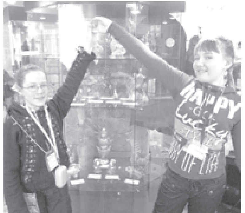
Студийцы у стенда со своими работами