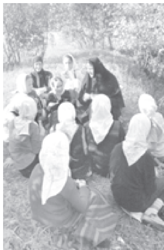
Беседы по душам

кой, пением, рисованием, лепкой, мозаикой, шитьем и другим рукоделием. Они зачислены во Всероссийский хор «Благовест», часто дают концерты вне стен Николо-Сольбинской обители. А уж в дни праздников перед многочисленными гостями монастыря юные служительницы муз с большим