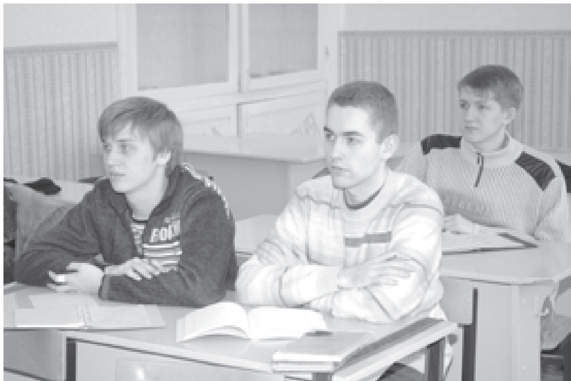
Квалификационный экзамен - дело ответственное

● сложно обеспечить процедуру наблюдения за процессом (например, выполняется умственная деятельность или процесс занимает длительное время). В этом случае при необходимости оценка продукта деятельности может быть дополнена защитой (обоснованием).