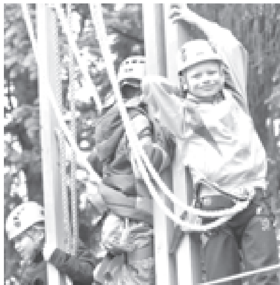
Юные спортсмены пробирются сквозь «Волшебный лес»

для преодоления одним человеком и крайне непросто для целой команды. Оказалось, что это действительно так, но в том-то и суть «Рубикона», что его нужно непременно перейти сообща. Это подтвердили и создатели тренажера. За рубежом, по их словам, есть множество подобных сооружений, но все они нацелены на развитие личностных качеств одного человека, а команда в лучшем случае может подбадривать его на земле и давать подсказки. Кроме того, тренажеры парка «Открытие» созданы в определенной мере и для облегчения социализации детей, и, конечно же, для воспитания духа сплочен-