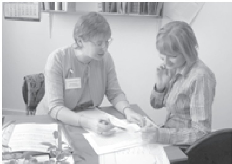
«Будьте внимательны, обобщая изученный материал»

Преподаватель: Тема, изучению которой посвящено сегодняшнее занятие, может быть сформулирована следующим образом: «Контрольные карты для количественных данных». Она логически продолжает изучение статистического управления процессами при помощи контрольных карт и является одним из существенных вопросов теории статистического управления. Контрольные карты используются для оценки того, находится или не находится производственный процесс в статистически управляемом (стабильном) состоянии, путем сравнения значений отдельных статистических данных из серии выборок или подгрупп с вычисленными или заданными контрольными границами. Цель ведения