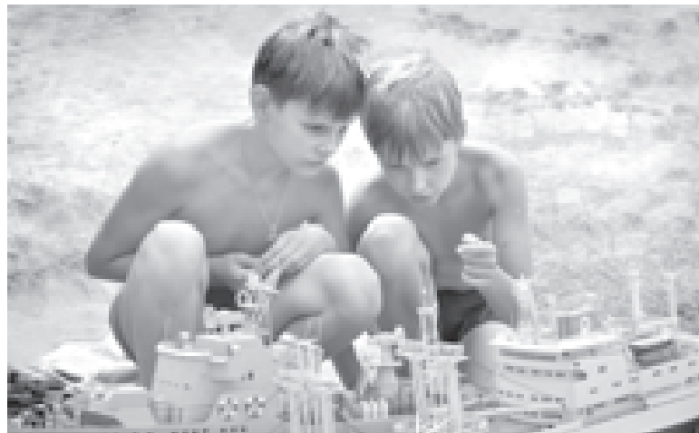
«Будущие кораблестроители». Александр БЕСЕДИН

Победителями фотоконкурса среди районов и городов стали Старооскольский район (I место), Шебекино (II место) и Белгород (III место).