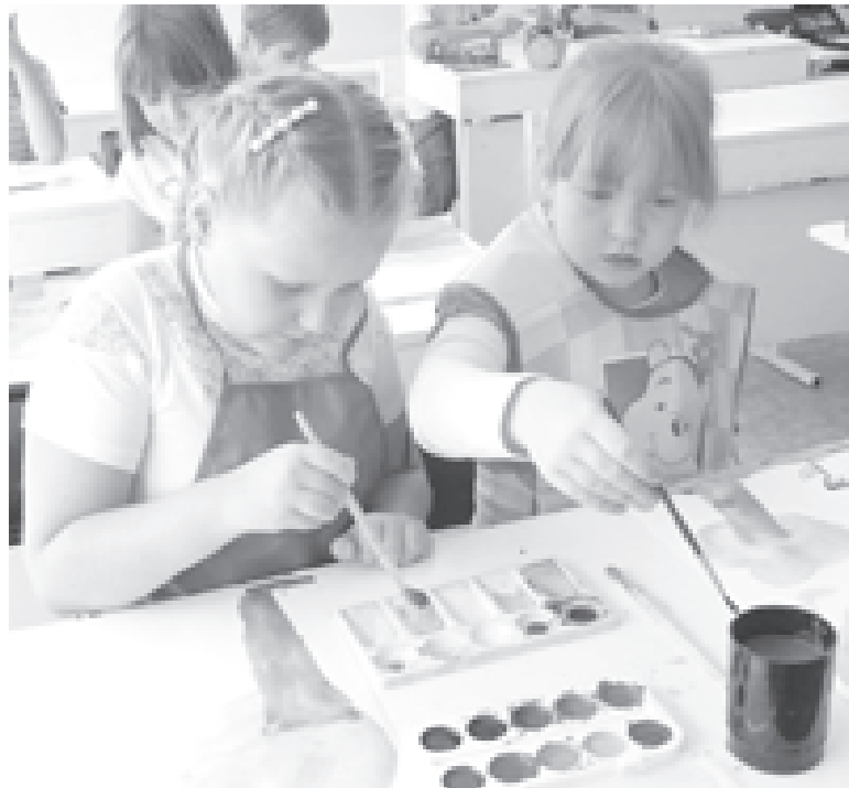
Один из главных критериев - активное участие детей в мероприятии

Сроки проведения Работы на XV Всероссийский конкурс «Сто друзей» принимаются по 3 сентября 2012 года включительно . Списки участников конкурса вывешиваются на сайте «Учительской газеты» www.ug.ru .