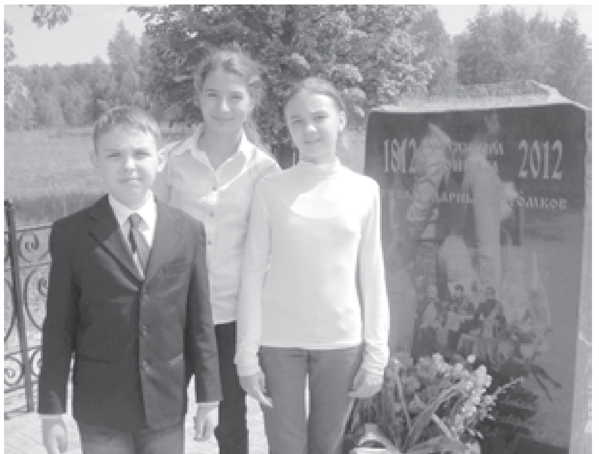
Об этом дне московские школьники будут рассказывать своим детям