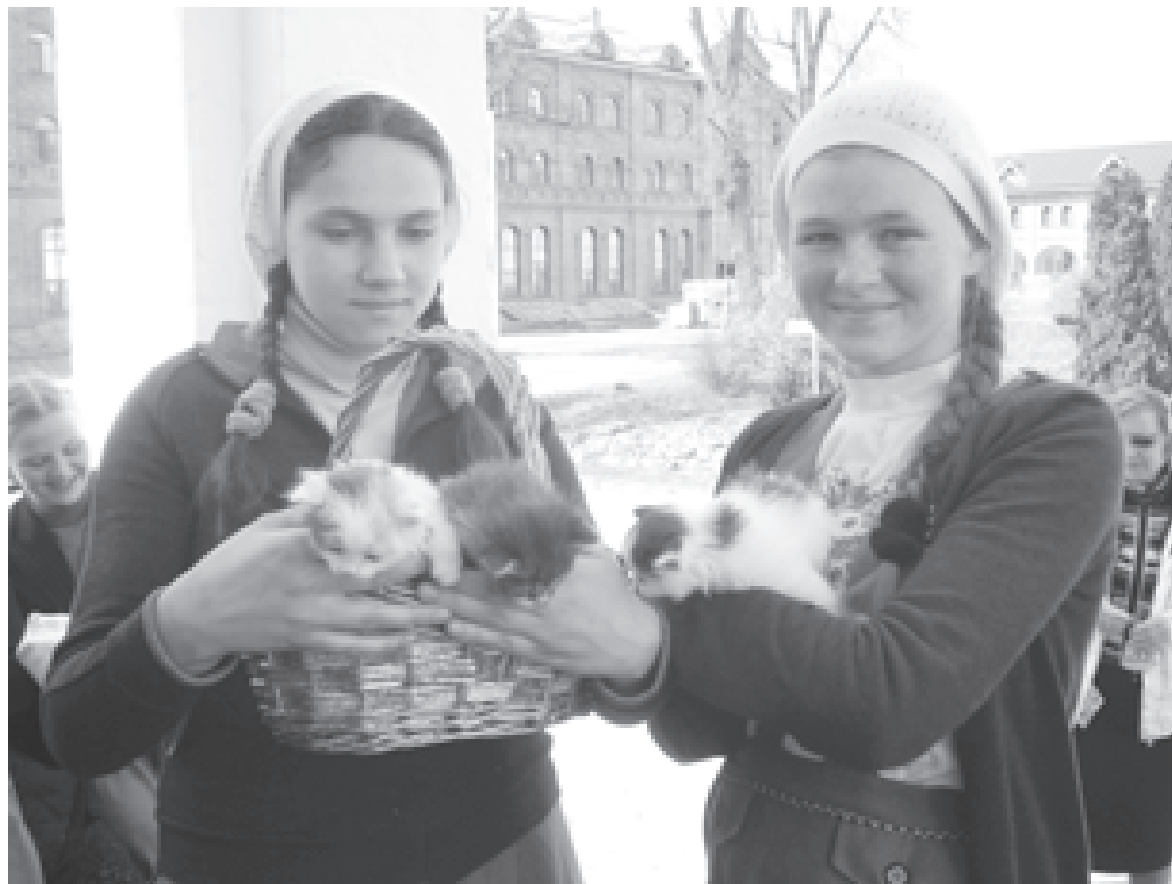
У этих девочек непростая судьба

Профессиональное жюри определило лучших. В каждой номинации были присуждены призовые места. Но подарки получили все участники конкурса. А закончился день большим концертом. И конечно, изделия поваров дегустировали все вместе.