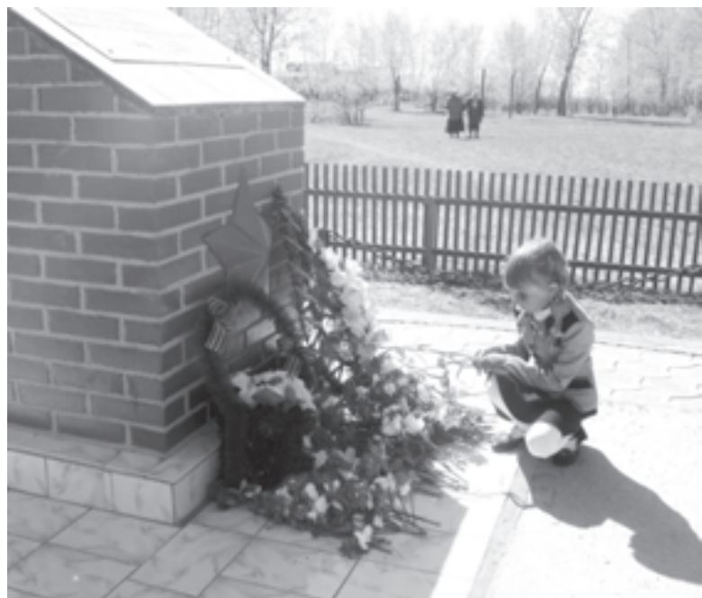
Память о Великой Отечественной войне жива в сердцах юных дробышевцев

«Люблю свое село, землю и людей, живущих на ней. Люблю за все - за богатое историческое прошлое, за нестыдное настоящее, за светлое и многообещающее будущее». Эти слова директора Дробышевской школы с полным правом может повторить каждый ее выпускник.