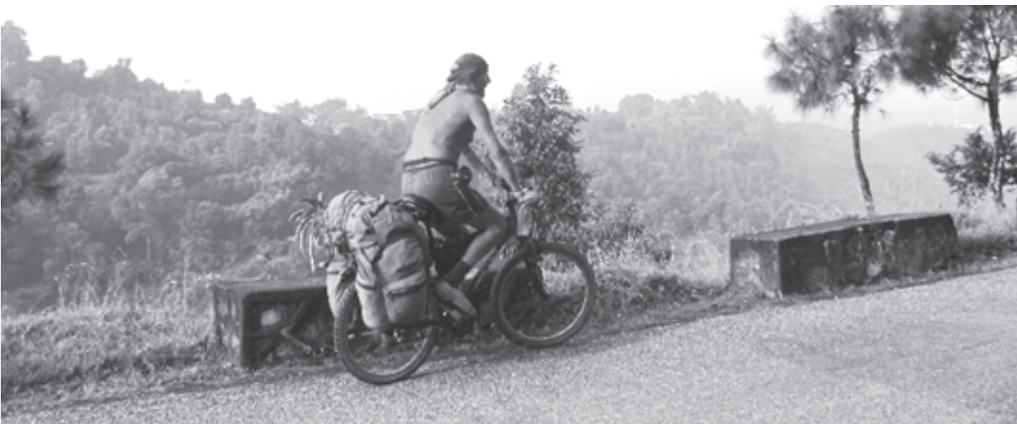
Увидеть мир и рассказать людям

Сколько раз, как погибающий и тонущий, я хватался за тебя, и ты всякий раз меня великодушно выносила и спасала! А сколько родилось в тебе чудных замыслов, поэтических грез, сколько переживалось дивных впечатлений! - под этими словами Гоголя, наверное, подписались бы многие, кого дорога, дальние путешествия вырывали из житейских омутов, кто однажды, сделав шаг за порог, рискнул побороть свой недуг «убегающими верстами». Лишь на ветреных перекрестках морей победно трепещут флаги бригадин, в тихих же гаванях с застойной маслянистой водой, в которой тускло мерцают звезды, зато ярко горят отражения береговых фонарей, паруса гниют и расползаются, а днища покрываются слизью и обрастают ракушками.