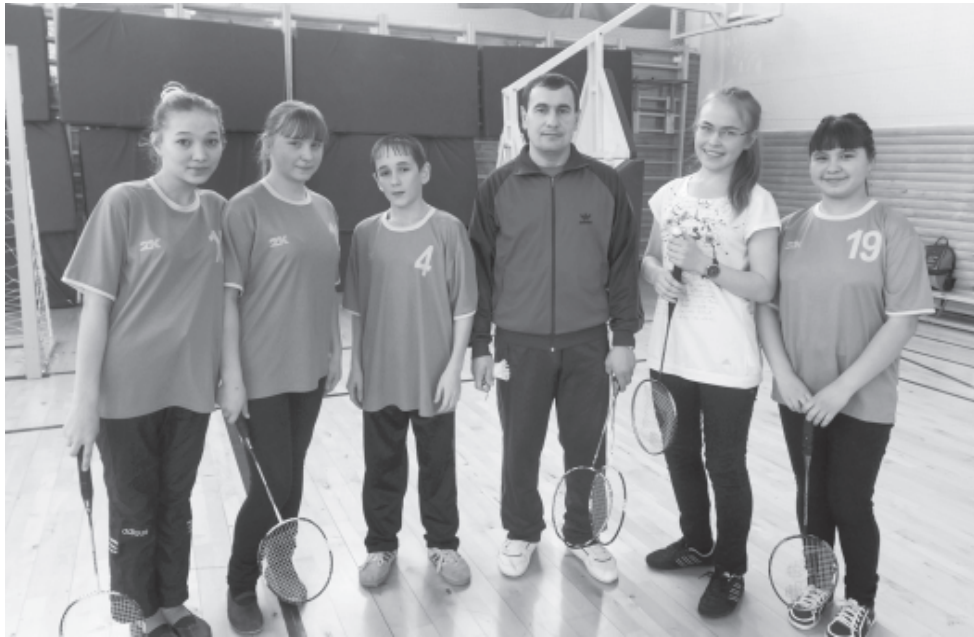
В спортивном зале

тельным. В кабинетах установлены проекторы и интерактивные доски. А на уроках химии, биологии и физики можно проводить различные лабораторные работы и опыты. Заметны ученики сельской школы своими успехами в предметных олимпиадах. А в спортивном зале есть все условия для занятий спортом. Недаром ученики Кильдебякской школы занимают призовые места в спортивных состязаниях разного уровня.