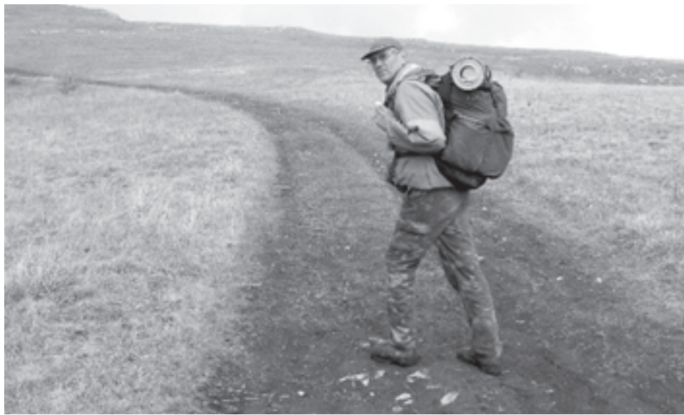
Сколько раз спасала далекая дорога!

Поэты, писатели, художники всех времен и народов часто связывали свою судьбу с дорогой, странствиями в надежде обрести здоровье, покой, вдохновение. Всю жизнь мятущийся Николай Гоголь жаждал «лечиться убегающими верстами». Дорога была для писателя физической исцеляющей потребностью, духовным лекарством, путем к истине и спасению. География его странствий охватывает Малороссию, Петербург, Москву, Западную Европу, Иерусалим, Рим и необъятные российские просторы, по которым мчится тройка Чичикова. «Боже, как хороша подчас далекая, далекая дорога!