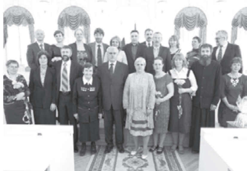
Большая дружная семья не только радостно, но и почетно

Как отметил Георгий Полтавченко, в городе многодетным семьям предоставляются значительные меры социальной поддержки. Выплачивается региональный материнский капитал, есть льготы по оплате услуг ЖКХ. Многодетные семьи получают квартиры и микроавтобусы. Город также начал предоставлять участки под жилищное и дачное строительство. Губернатор сообщил, что благодаря договоренности с правительством Ленинградской области выделение земли в ближайшее время заметно ускорится, и уже в этом году 350 семей получат дачные участки.