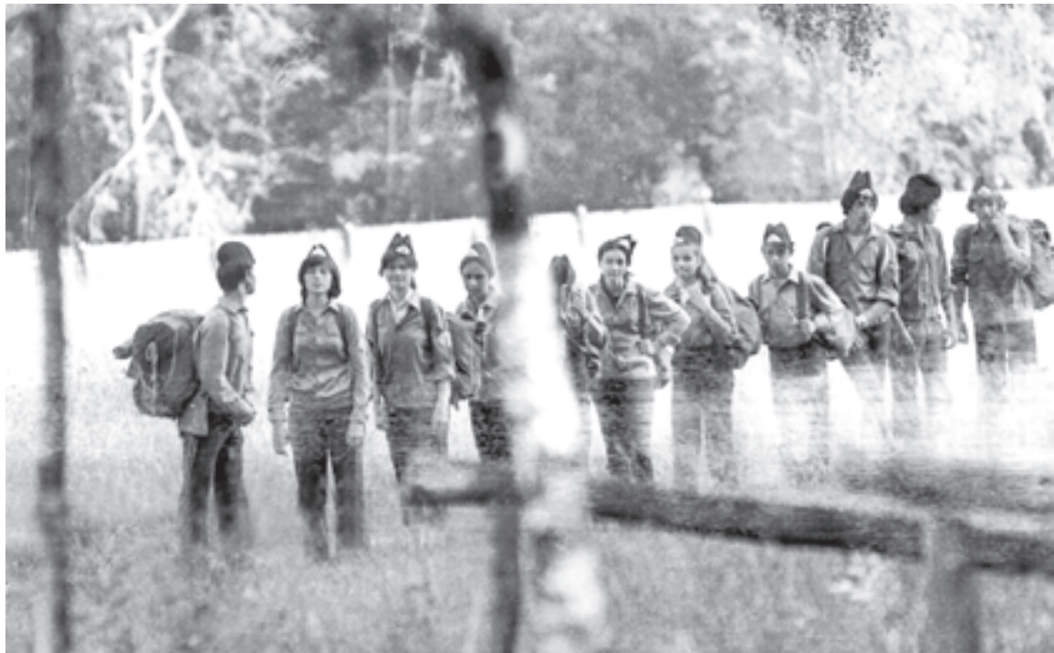
Строй коммунаров 60-х годов