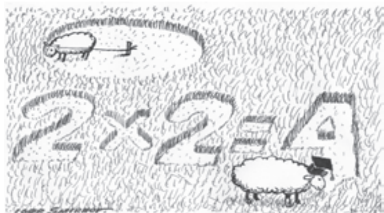
Рис. Игоря Смирнова

P.S. Обсудите эту тему на сайте «УТ» www.ug.ru