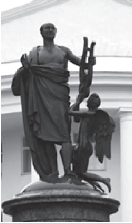
Памятник М.В. Ломоносову в Архангельске. Скульптор И.П. Мартос