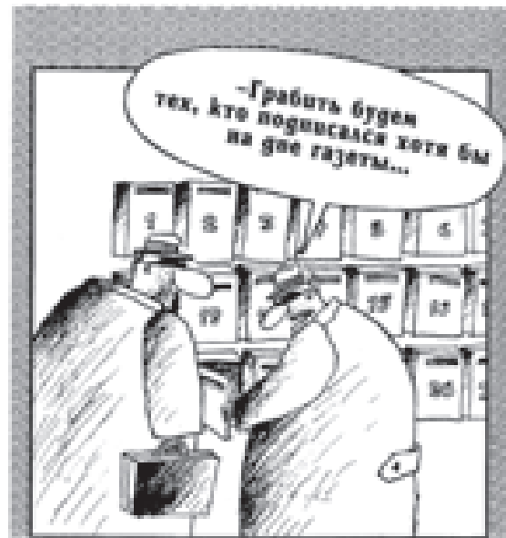
Рис. Вячеслава ШИШОВА

Ведь посещение платных образовательных услуг дело добровольное, поэтому бывают такие ситуации, когда группа открывается, а через месяц ее приходится закрывать. Родители, основываясь на