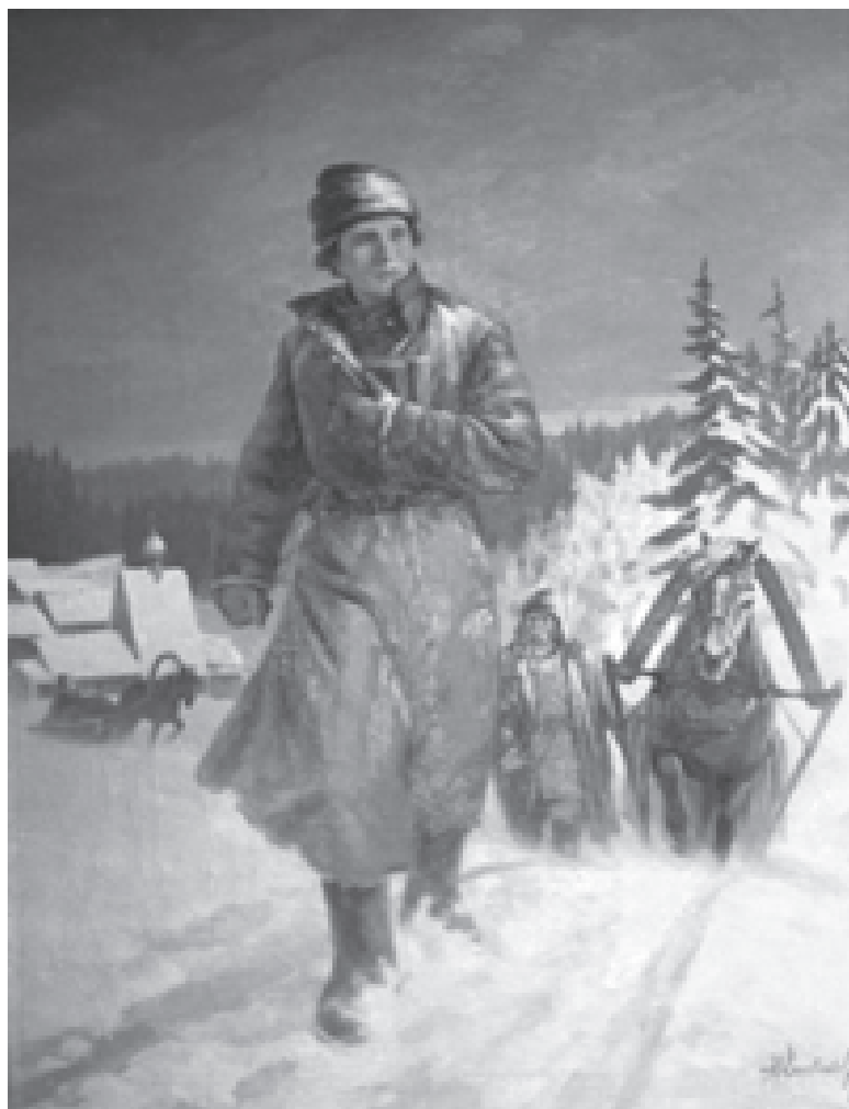
Картина Николая Кислякова «Юноша Ломоносов на пути в Москву»

снимать угол. Но ни голод, ни холод не отвратили Ломоносова от науки. Так прошло 5 академических лет.