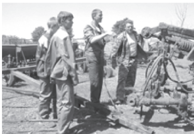
Идет подготовка к страде

У нас создана ученическая организация «Счастливая деревня» со всеми атрибутами: гимном, флагом, галстуками, президентом и министрами. Жизнь детской организации очень насыщена и интересна. Радует, что для наших воспитанников труд не тяжелая повинность, а основа преодоления трудностей в жизни, основа развития личности. А главное, наши выпускники успешны. Они продолжают обучение в техникумах и вузах, благополучно устраивают свою дальнейшую жизнь.