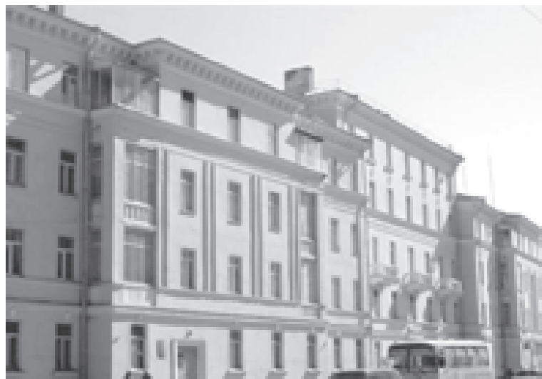
Центральная городская библиотека имени М.В. Ломоносова

С ... года, после длительной реконструкции, современное здание театра приглашает зрителей на спектакли, выступления, концерты.