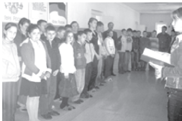
Торжественная линейка в Бутаковской школе

Нам очень хочется, чтобы политики и законодатели, принимающие судьбоносные решения, услышали их голос, почувствовали их боль. И еще хочется, чтобы они не отмахивались от письма жителей Бутакова, ведь в том, о чем они написали, много горькой правды.