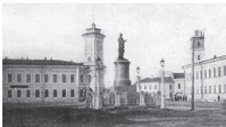
Ломоносовская площадь. Дореволюционная фотография

3. Найти число N , чтобы выполнялось верное равенство: