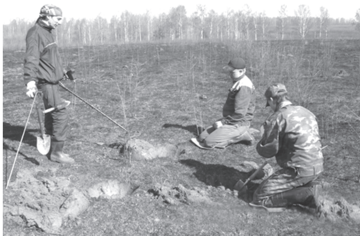
Работает поисковый отряд «Рифей»

Добрая половина работ, написанных членами нашей историко-краеведческой секции СНО, связана с Великой Отечественной войной. И среди них особняком стоят исследования о поисковом отряде