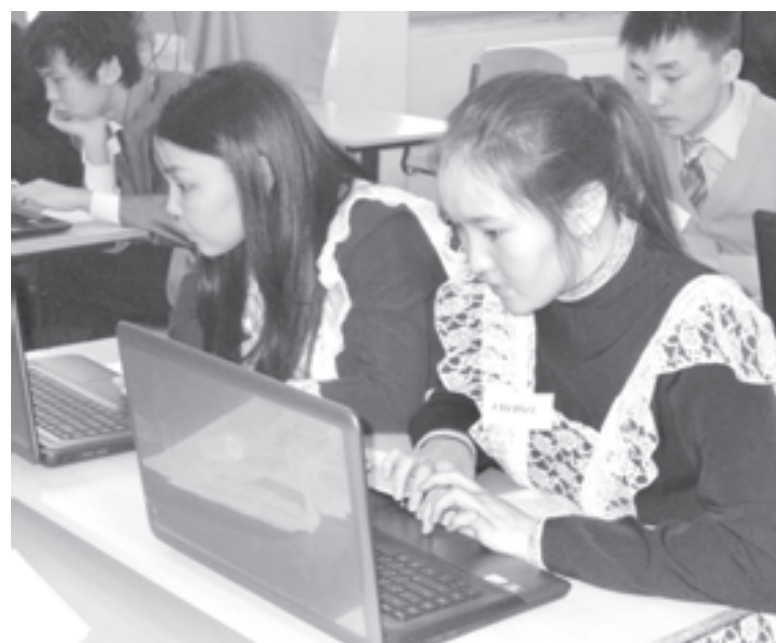
Ученики Верхневилуйской республиканской гимназии имени М.А.Алексеева во время открытого урока