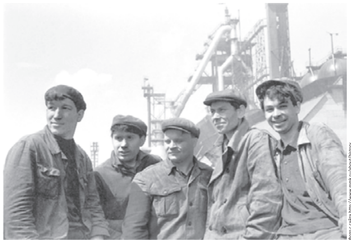
Рабочие Магнитогорского металлургического комбината. 1968 год

тории Магнитогорска. В годы войны говорили, что от Челябинска до Каргалов власть советская, а от Каргалов до Магнитки - власть Носова. Давно нет цензуры, ушла в прошлое КПСС с ее огромной, повсюду проникающей властью, много развелось в СМИ охотников поспрашивать подробности из жизни выдающихся людей, но нигде за всю сорокалетнюю трудовую жизнь я не встречал ни одной критической публикации о Григории Ивановиче. А ведь ему приходилось руководить градообразующим предприятием Магнитогорска в сложные предвоенные и тяжелейшие военные годы. Я подробно описал ученице несколько эпизодов из жизни этого выдающегося человека. Мы вместе изучали статьи и речи Носова, читали литературу о работе и жизни, беседовали с его современниками... А вскоре в Челябинском институте развития профессионального образования (ЧИРПО) нам предложили с очерком о Носове участвовать во Всероссийском конкурсе на лучшее журналистское произведение настенной печати,