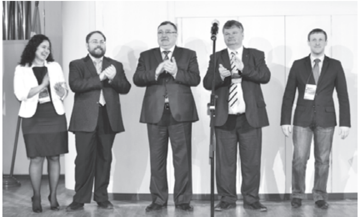
Обладатели Хрустальных пеликанов в Органном зале

Особый конек школы №2 - технологии выстраивания взаимовыгодного сотрудничества и утвержде-