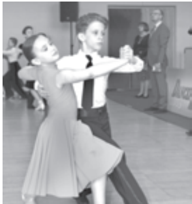
Особенно тепло зрители встречали юных танцоров

Четыре дня Москва принимала гостей более чем из 30 стран мира на XV международном турнире по спортивным танцам «Танцфорум-2013». Свое мастерство на паркете в «Лужниках» демонстрировали около 5 тысяч танцоров от 9 до 55 лет!