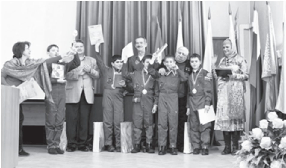
Лучшая команда юнг космических кораблей в России – экипаж «Беркут» из Нальчика