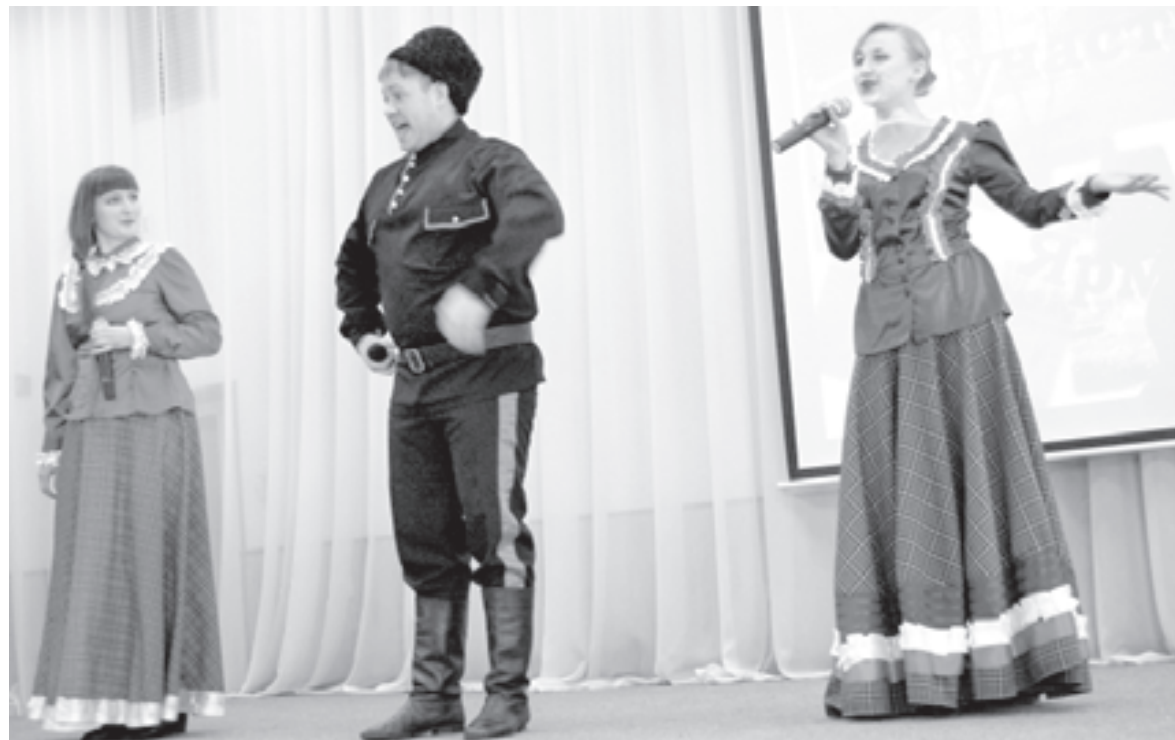
Какая ярмарка без казачьих плясовых?! Впрочем, возрождение казачьих традиций тоже послужило темой проекта

На кону аукциона оказалось 31500 рублей. Это не ставки на бегах, не продажа произведений искусств. Это практический опыт. Это конкретные вещи, апробированные, вымученные, принесшие своим авторам положительный результат. Это социальный феномен - интеллектуальная собственность, у которой есть цена. Да, ярмарка - немного игра. Но на ней происходит реальные вещи: здесь идет оценка потенциала педагогических идей!