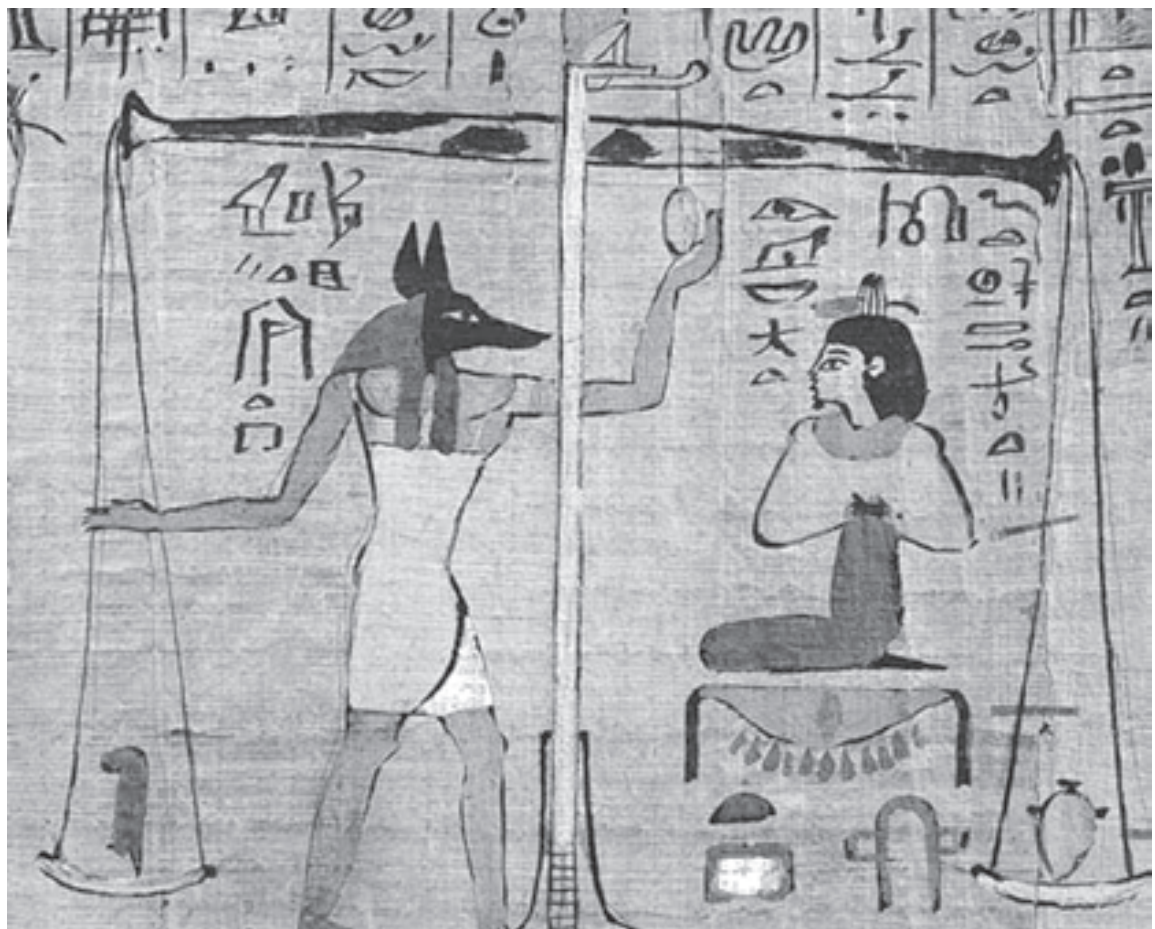
В Древнем Египте числа записывали, используя только сложение

Учитель: Посмотрите, пожалуйста, на славянский цифровой алфавит. Например, если записать в славянской нумерации числа 55, 288, 1 и 498, то получится фраза: «Не спи, а учи». В России славянская нумерация сохранилась до конца XVII века. При Петре I возобладала так называемая арабская нумерация, которой мы пользуем-