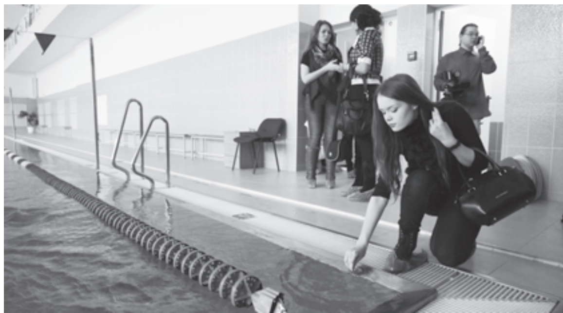
В новом бассейне Уральского федерального университета

«Тест-драйв: 3 дня в Уральском федеральном университете» - одна из составляющих большой программы «Абитуриада», которая помогает лучше узнать и понять друг друга вузу и его будущим студен-