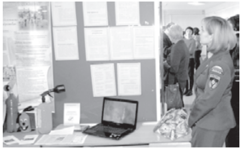
Пожарные - полноправные социальные партнеры образования, вместе с педагогами они пытаются формировать навыки пожарной безопасности у детей. Как? Все идеи в проекте!

Каждая эпоха, приобретая новые идеи, приобретает и новые глаза. Так говорил Генрих Гейне. Тематика проектов была довольно широка. Эксперты оценивали «товар» по определенным критериям. Требовались концептуальность (авторская позиция, выделение ведущей педагогической идеи, логика); актуальность, социальная значимость данного реше-