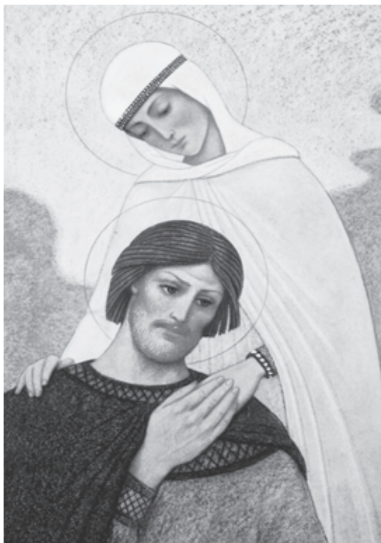
Петр и Феврония Муромские

Я желаю, чтобы вы помнили основные принципы христианской семьи, делали все от вас зависящее для упрочения и сохранения своих семей: берегли здоровье родных, уважали и не расстраивали взрослых. Пусть и ваши будущие семьи будут счастливы.