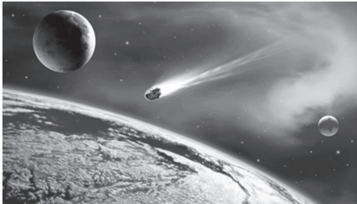
Опасность, идущая из космоса, превышает опасность пострадать от рук террористов

P.S. Пишите нам о ваших научных обществах учащихся, ярких открытиях, юных исследователях (в школах и вузах), и мы опубликуем лучшие материалы на полосу «Наука».