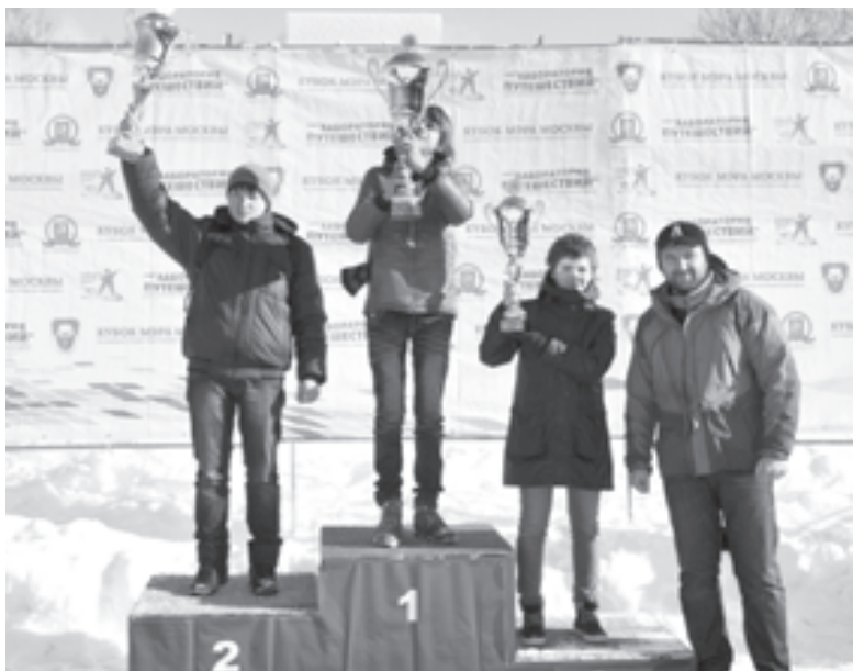
А следующей ступенью будет Северный полюс

В подмосковной Истре прошли ежегодные соревнования коррекционных учебных заведений по зимнему туризму на призы столичного градоначальника.