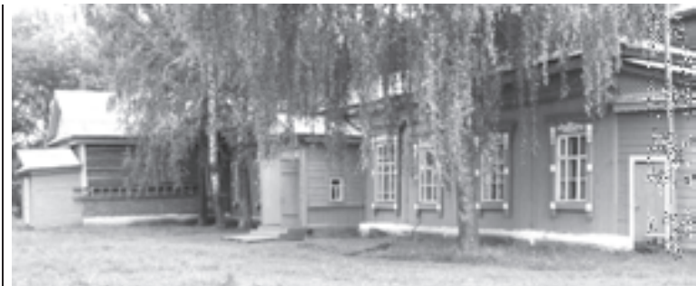
Здание сельской школы - памятник истории