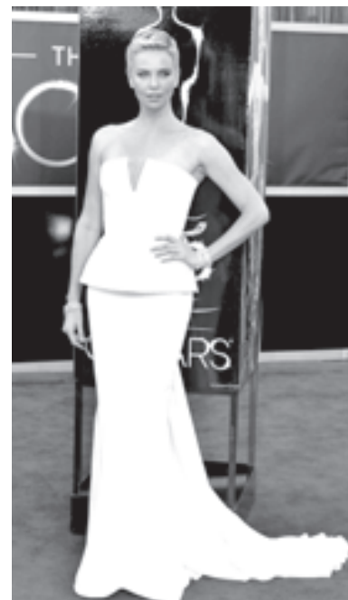
Шарлиз ТЕРОН была сама элегантность

Наряд последней тоже стоит отметить, кстати, народным голосованием он был признан лучшим. Серебристая многослойная воздушная тога с вышивкой из золотистых узоров и оригинальным