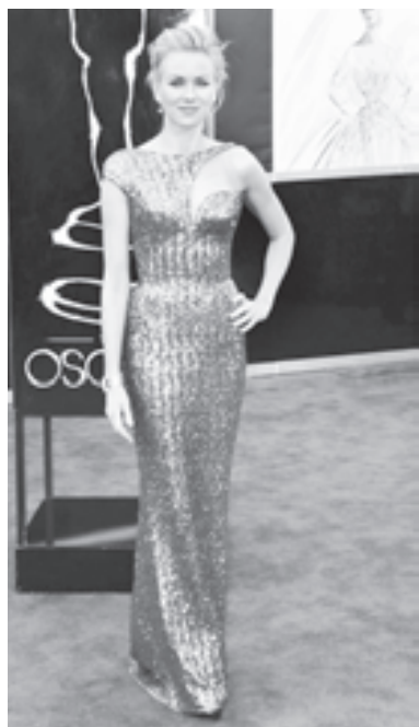
Металлический блеск оказался Наоми УОТТС к лицу

«Оскар» - это еще и всемирное модное дефиле. И если репортажи с Недели высокой моды в Милане или Париже смотрят лишь фанатки искусства от-кутюр, то церемонии самой престижной кинопремии мира - миллионы. И именно на красной дорожке лос-анджелесского театра «Долби» становится очевидным, какие из тенденций сезона на самом деле прижились, а какие фасоны пора отправлять на антресоли. Звезды, украсившие собой 85-ю церемонию «Оскар», снова дали массу поводов для пересудов и восторгов.