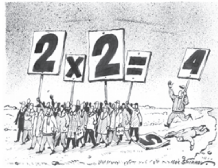
Рис. Игоря Смирнова

о стимулирующем фонде открыта и прозрачна. И, кстати, когда коллеги видят, что ребенок показал на конкурсе или олимпиаде хорошие результаты, то оценка его работы идет уже не только на финансовом, но и на моральном уровне. Педагога поддерживает не только админист-