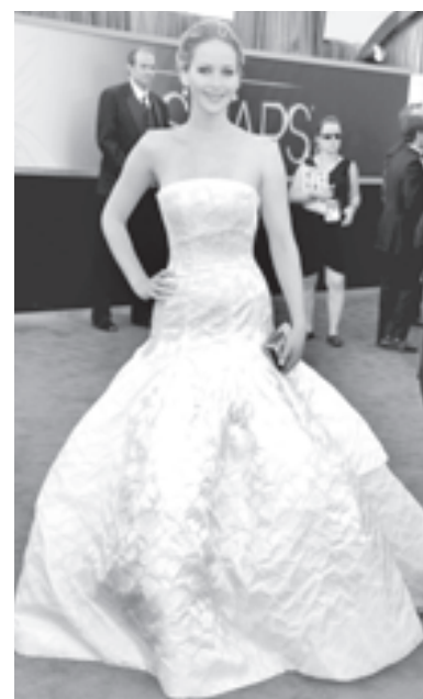
Дженифер ЛОУРЕНС не столь красило платье, как улыбка победительницы

Металлический блеск стал очередным трендом на красной дорожке. Удачнее всего его воплотила Наоми Уоттс, еще одна номинантка на лучшую женскую роль. Прекрасная блондинка продемонстрировала блестящее платье сложного серебристого цвета со смелым асимметричным верхом.