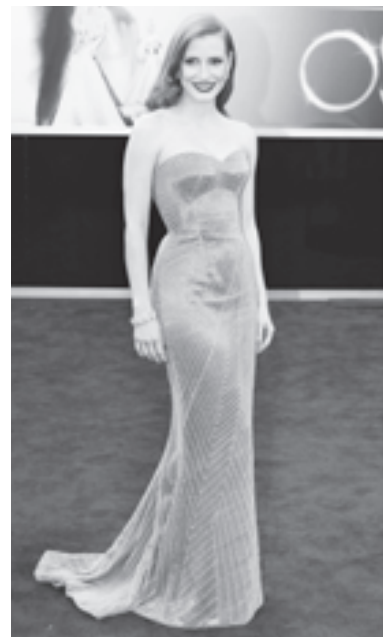
В своем наряде Джессика ЧЕСТЕЙН напомнила одну из див золотого века Голливуда

Зато умница и красавица редкого типа красоты Джессика Честейн, номинированная на награду за лучшую женскую роль в фильме «Цель номер один», подошла к делу ответственно и оказалась вне конкуренции. Хотя золотой наряд требует от его носительницы безукоризненного чувства вкуса, иначе выйдет пошло, претенциозно и дешево. Именно так, увы, произошло в случае с Кэтрин Зета-Джонс и Рене Зеллвегер. Мисс Честейн же выбрала благородный оттенок тусклого, как бы старинного золота. Эту цветовую гамму прекрасно дополнили роскошные рыжие волосы. Фасон вышитой драгоценными нитями тоги тоже классика, знакомая нам еще по старым черно-белым фильмам золотого опять-таки периода Голливуда.