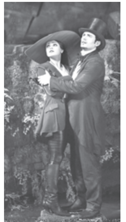
Фокусник Оз и волшебница Теодора: а счастье было так возможно...

решается на самоубийство и превращается в зеленую крошечную ведьму, в гоблина в юбке, способную отныне нести лишь смерть.