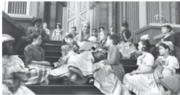
Волшебница Глинда - самый приличный человек сказочной страны

хорошенькие барышни, которым можно в преддверии поцелуя наврать с три короба про «бабушку-принцессу, погибшую в битве при Равиоли», - вот и все, чем наполнена его никчемная, в сущности, жизнь. Надо отдать ему должное: