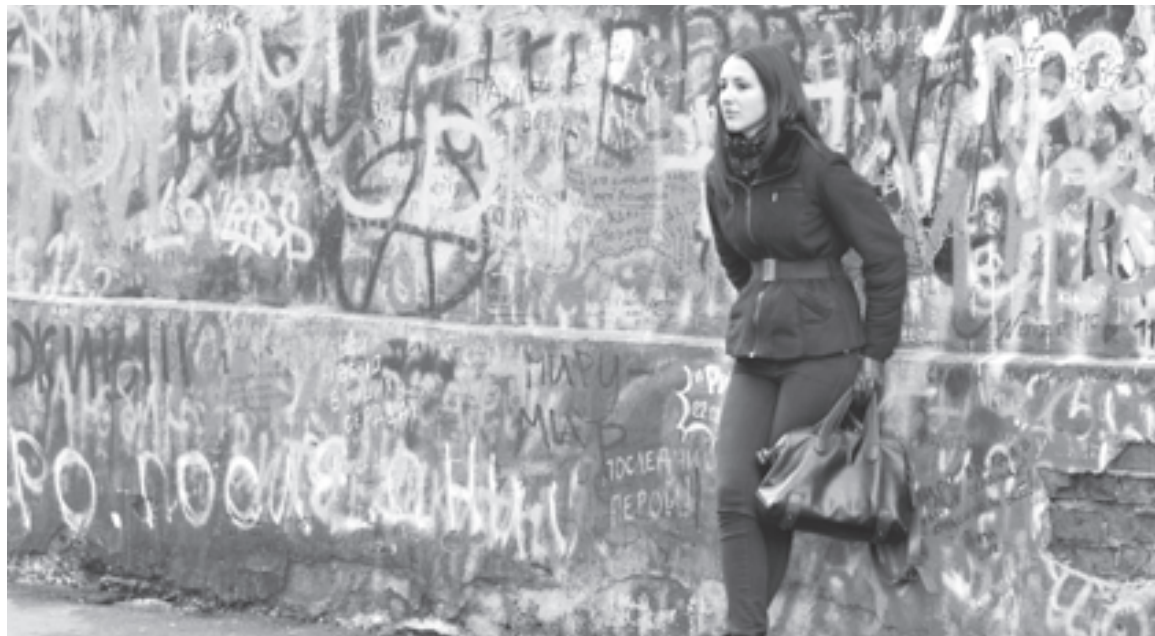
Одиночество в большом городе

роли, которую должна исполнять женщина. Ведущая роль в достижении оптимального баланса мужских и женских ролей в семье принадлежит готовности мужчины взять на себя часть семейных обязанностей и умения женщины отказаться от доминирования в семейной жизни. Надо только по-