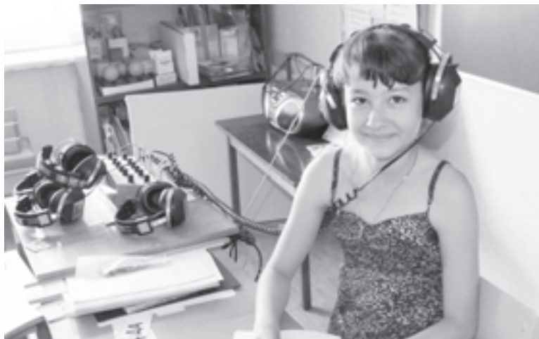
В Воронежской области дети обеспечены техническими средствами реабилитации

С 2012 года в регионе получила широкое развитие система реабилитации детей, страдающих аутизмом. К этой работе были привлечены Фонд содействия решению проблем аутизма в России «Выход» и автономная некоммерческая организация «Центр проблем аутизма в России». В 2013 году на реабилитацию детей, страдающих аутизмом, из областного бюджета выделено более 7 миллионов рублей.