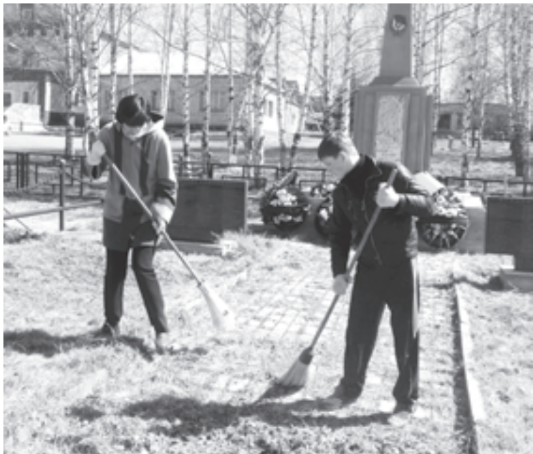
Чистота в мире - чистота в душе