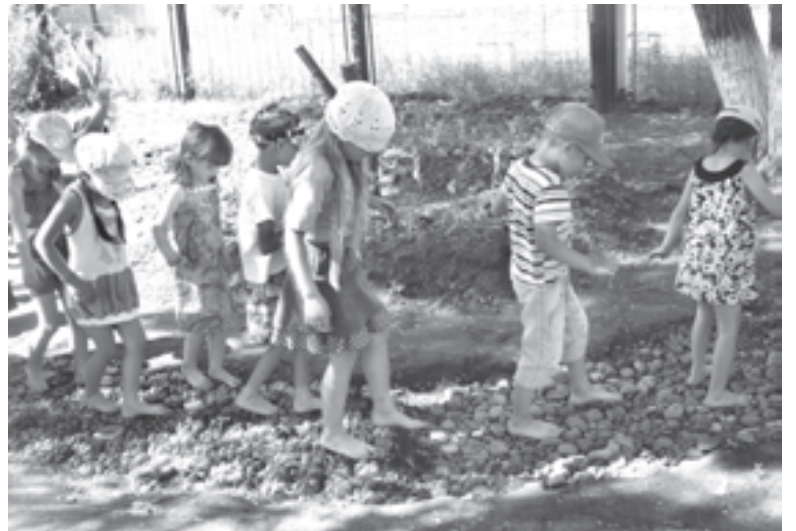
Босиком - это весело и здорово!

Пещеру мы планируем сделать на основе металлического каркаса куполовидной формы. Каркас покрыт сайдинговыми панелями под камень. Имеет сквозной проход.