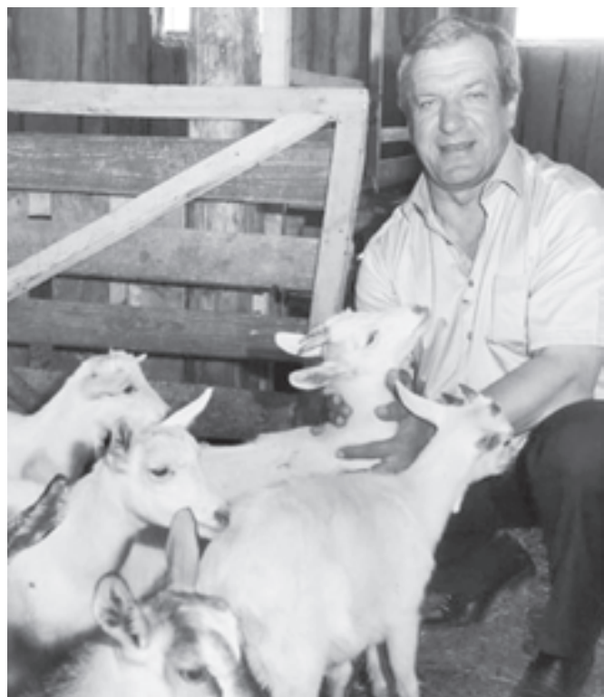
Козы - это не только ценный мех и мясо...

месяца надолго избавляет от этого недуга современности. Кроме всего прочего, козье молоко обладает бактерицидными качествами, улучшает обмен веществ, а значит, продлевает молодость! Народная медицина рекомендует употреблять козье молоко при анемии, бессоннице, мигрени. Оно отлично восстанавливает силы после про-