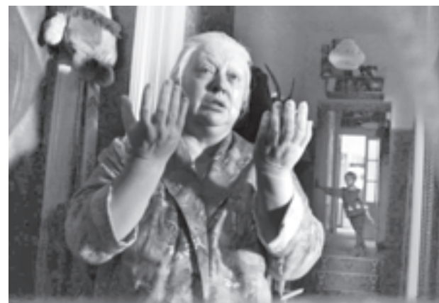
«Похороните меня за плинтусом»