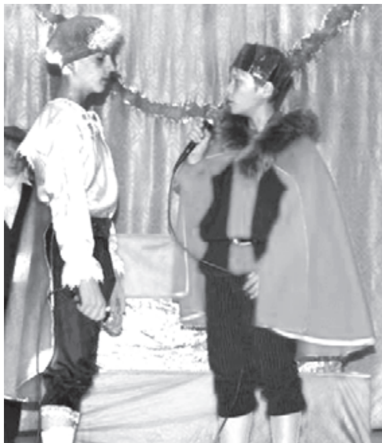
Диалог Принца и Короля

Под греческую (итальянскую) музыку в танце появляется Средиземноморская красавица.