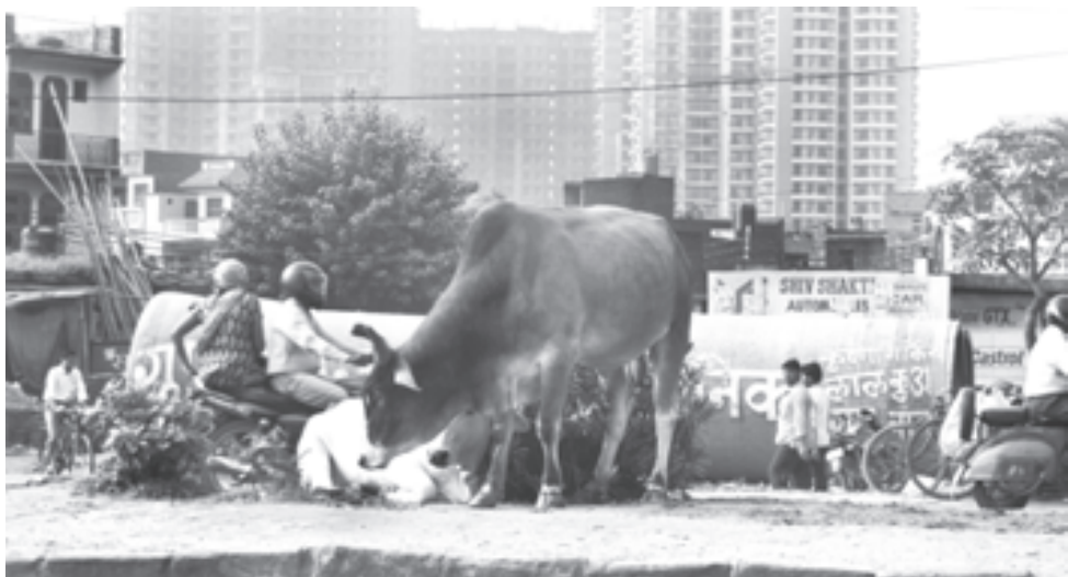
Праздно шатающиеся по улицам коровы священны

ными разноцветной и разноградусной алкогольной жидкостью, индиец бойко торговал ими через зарешеченное оконце. В конце концов он привлек к этому занятию и меня. «Эк!» - показывал один палец продавец, и я подавал ему одну бутылочку, два поднятых над головой пальца и короткое «до» означали, что я должен вытаскать из шоотка две бутылочки, три пальца и «тин» - соответственно три, ну и так далее. Впрочем, больше четырех («чар») - пяти («панч») бутылочек никто не брал. Так за пару часов я освоил счет. Правда, только до пяти. Однако если ничего другого не остается, то уже этим вместе с «намастэ» и «данавад» можно жонглировать бесконечно.