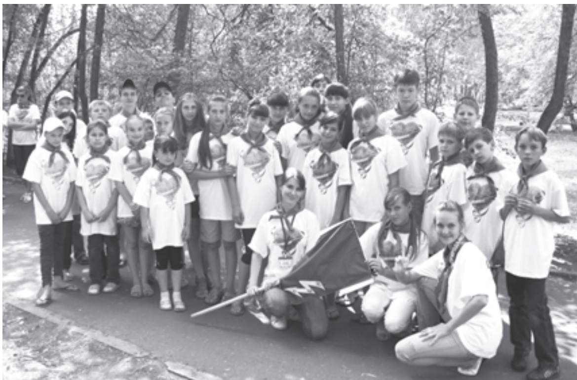
Очередной выпуск Омской станции юных натуралистов

Работы еще много: перестройка дело серьезное. Но главное - у педагогов проснулись мечты, а дети стали понимать, что не просто проводят время, а делают большое и очень важное дело - сохраняют природу родного края. И это значит, что в Сибири скоро вновь зацветут орхидеи и созреют монстеры.