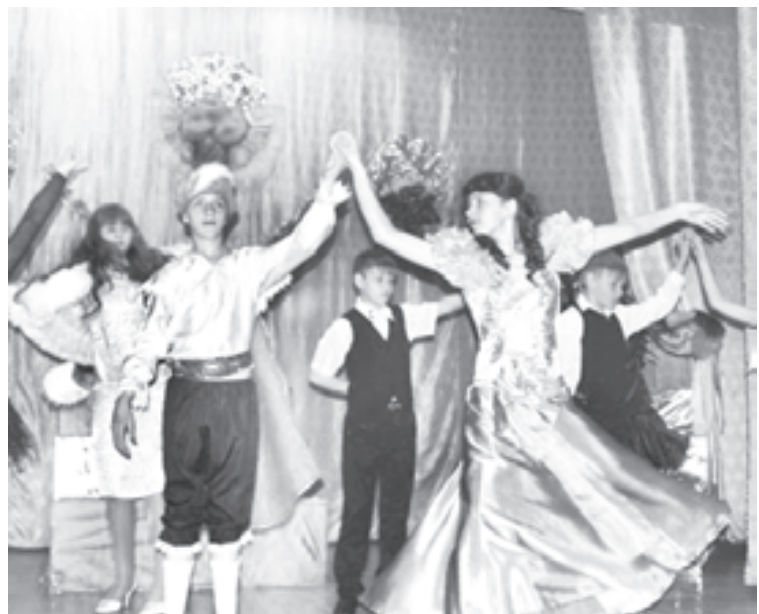
Финал спектакля. Все участники постановки

Выход Русалочки под музыку народов севера.