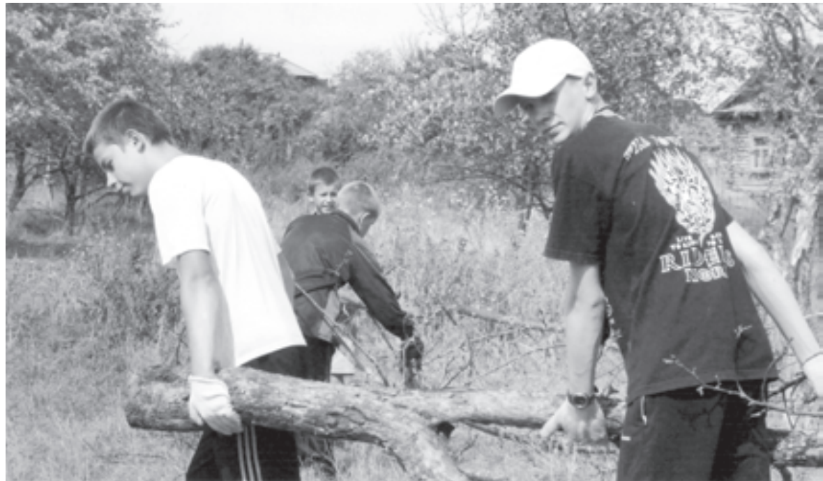
...А берега без мусора гораздо красивее!

Воспитание учеников бережно-го, сознательного отношения к