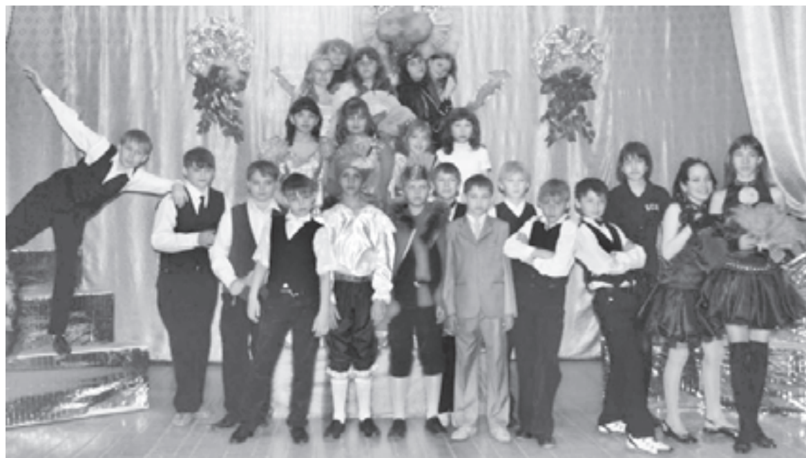
Когда-нибудь человек создаст вокруг себя море Красоты!

Сказочница: Почему ты думаешь, что у тебя нет шансов стать невестой Принца? Ты ведь очень красива. Посмотри на свои длинные и густые волосы из морских водорослей. На тебе сверкающая чешуя, говорящая о том, что ты абсолютно здорова. Другие Русалки