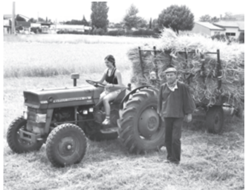
Экологически чистый тракторист работает на супе

пусть не химические, ни из банной. Поэтому воздух в Померании такой волшебный, что есть и спать совсем не хочется (оказывается, это очень верный признак экологического благополучия территории) и порез на пальце заживает моментально без всяких воспалений и нагноений. А теперь вспомните, сколько дней в своей местности вы ходите с перевязанной раной, если вам «повезет» порезаться добросовестно наточенным кухонным ножом? Вот то-то. Россияне не обращают на это внимания, а любой немецкий школьник знает, что здоровье напрямую зависит от экологии. В Германии практически нет людей, тем более подростков, больных ожирением. Все немцы, от детей до стариков, заядлые велосипедисты, и не мудрено: специальные желтые дорожки для велосипедов есть на всех без исключения дорогах, места для перевозки двухколесного транспорта пре-