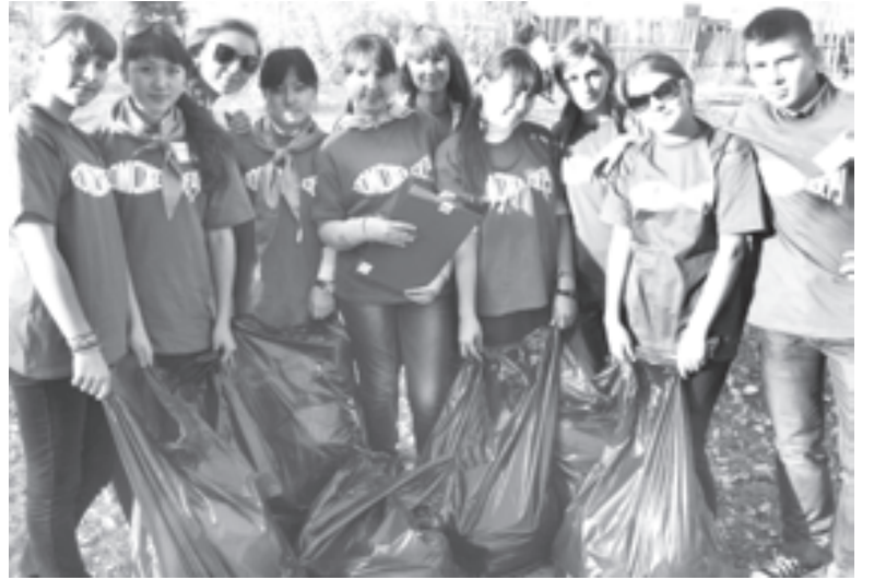
«Мусор - наш враг!»

Деятельность дружины проводится совместно с Омской региональной детско-юношеской общественной организацией охраны окружающей среды «Экологический центр», который организует ежегодные фестивали, конкурсы, проекты «Белая береза», «Водные проекты старшекласников». А нынче «ВЭЛСТОН» принял учас-