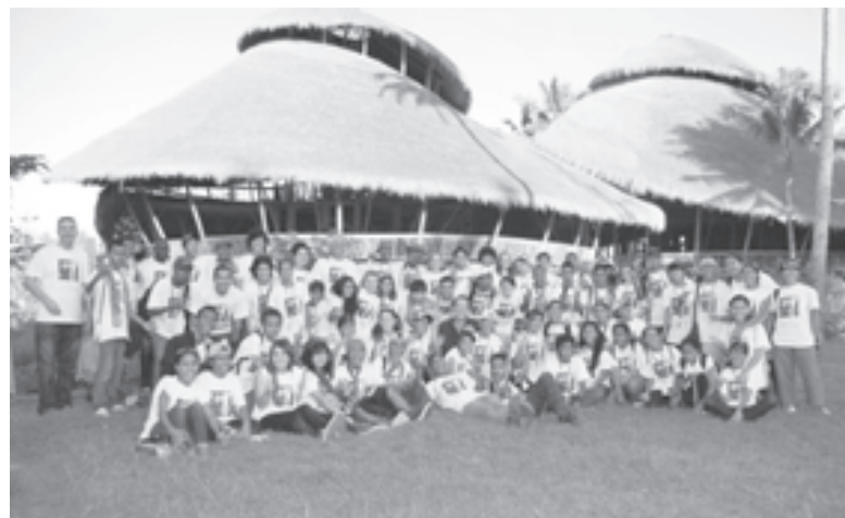
Школа из бамбука на Бали