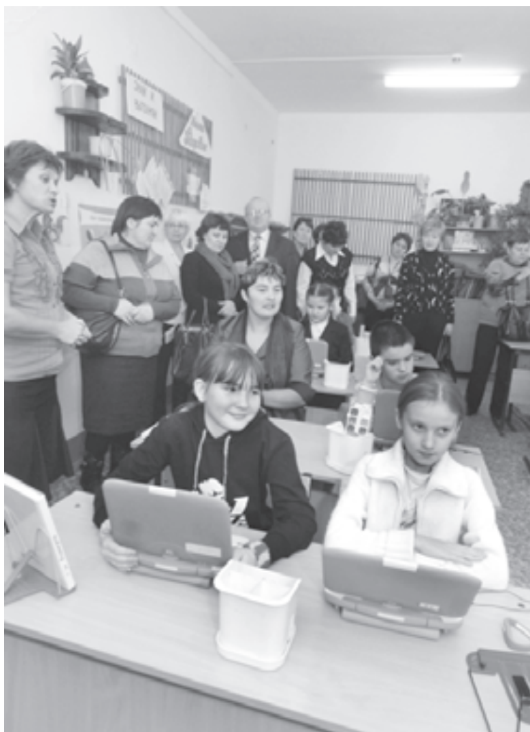
Открытый урок в школе

В райцентре гости ознакомились с работой учреждений дополнительного образования. В современном спортивном комплексе «Дельфин» для сельских ребят работают два бассейна, тренажерный зал, большой футбольно-баскетбольный комплекс с душевыми и сауной. В детской школе искусств каждый из юных жителей района может развивать свои таланты. После посещения ряда учебных заведений гости отметили хорошую оснащенность школ современным оборудованием. И хозяева, и гости пришли к общему мнению, что есть чему учиться друг у друга. Было подписано межрайонное соглашение о сотрудничестве сроком на пять лет.