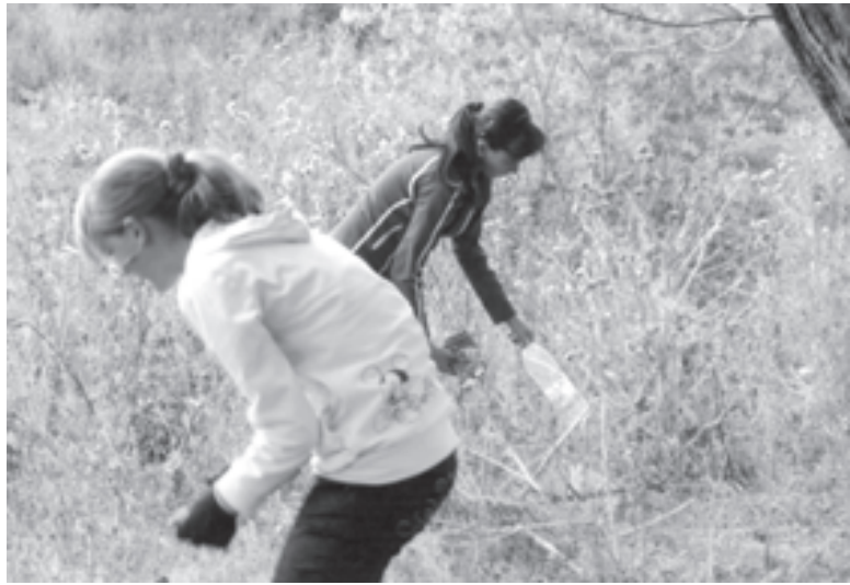
Пластик в природе разлагается сотни лет...

И еще. Работа на позитивный имидж не только самого руководителя, но и его организации тоже искусство. Чтобы показать все лучшее, что у вас есть, к тому же системно и объемно, предлагаем взять на заметку такую форму сотрудничества с «УГ», как специальные вклады в газете... Не упустите хороший шанс широкого общественного признания вашего региона!