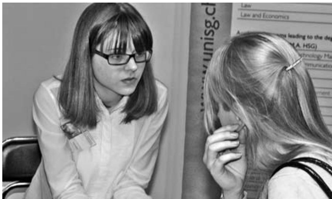
Неужели иностранный приоритетнее русского?

В одной детской песенке утверждалось: «Учиться надо весело, чтоб хорошо учиться». Надеюсь, что мой веселый урок культуры речи усвоится лучше, нежели скучное перечисление незбылемых норм.