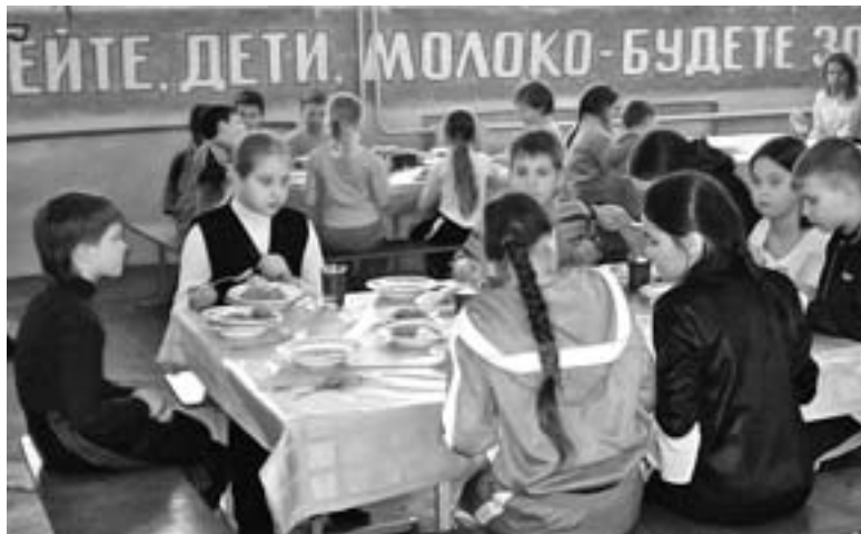
День школьного молока - праздник для ребят

В Воронежском театре юного зрителя впервые прошел день школьного молока, участниками которого стали более 300 учеников начальных классов города и области.