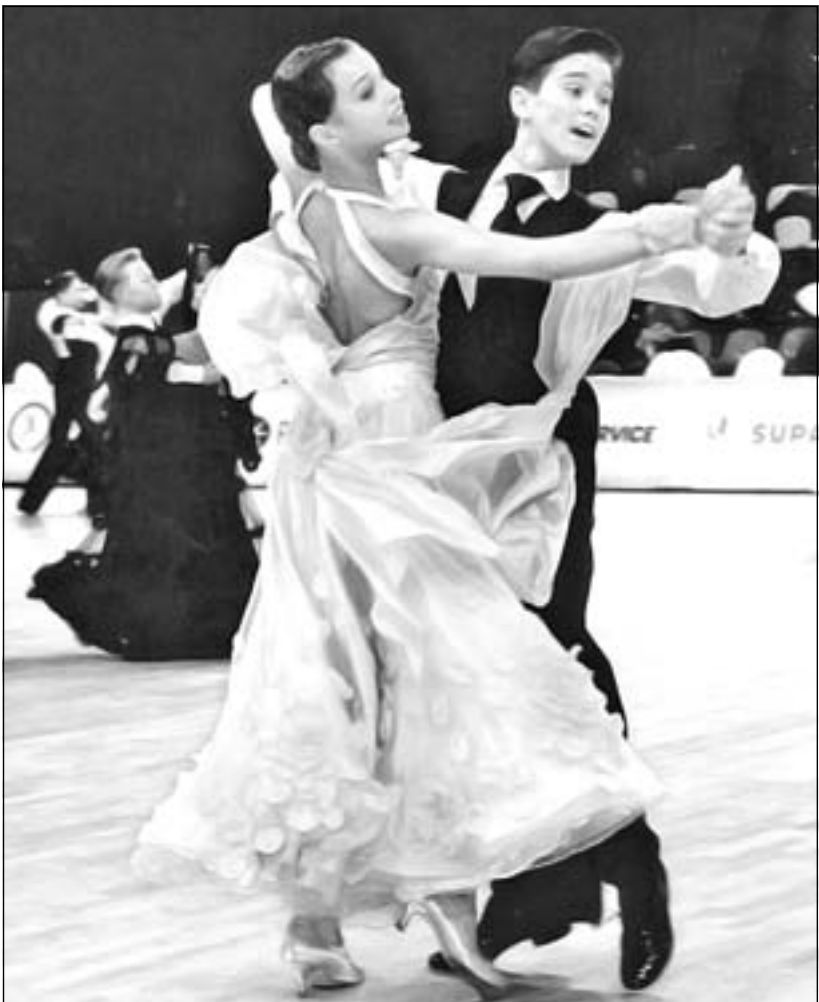
Творчество развивает личность