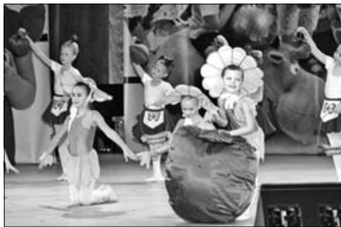
Выступление малышей никого не оставило равнодушным

Губернатор проинформировал, что только в Московской области работает свыше 1800 детских садов, где воспитываются 244,5 тысячи малышей. «В наших дошкольных учреждениях трудится большой дружный отряд педагогов-воспитателей, за что им огромное спасибо», - подчеркнул он. Борис Громов также признался, что вдвойне рад тому, что первый в России конкурс «Воспитатель года» проходит именно в Подмоскowie. «Хочется, чтобы этот конкурс вошел в историю не только как первый,