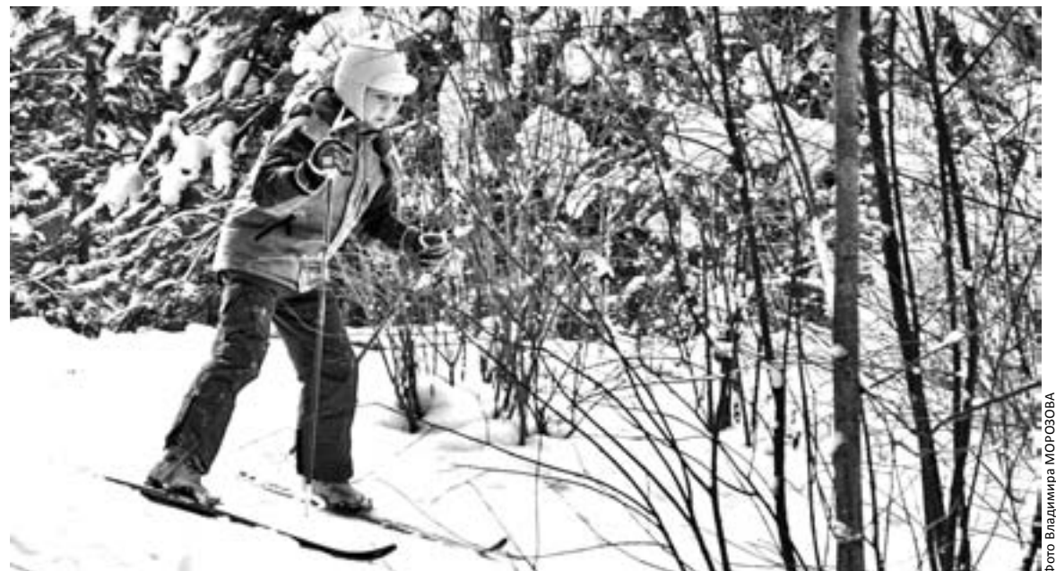
Юные экологи частенько выходят в лес на лыжах

Кроме того, мы много лет занимаемся экологической работой. Школа звучит не только на районном, но и на областном и региональном уровнях. У нас ребята - победители международных олимпиад в области экологии. Дети занимаются исследовательской работой, например исследуют водоемы, реку Луга, Заклинское озеро, различные источники и т. д. У нас даже есть своя лаборатория. Многие из юных экологов и в дальнейшем связывают свою жизнь с этим направлением, поступают в вузы по данному профилю. У нас создана Красная книга района, и ребята знакомятся с ней уже с первого класса. А два раза в год мы проводим экологический обход вместе с родителями, всем поселением, выходим и чистим лес и за туристами, и за собой в том числе. Упор на природоохранную деятельность позволяет ребятам взглянуть иначе на свое место в этом огромном живом мире.