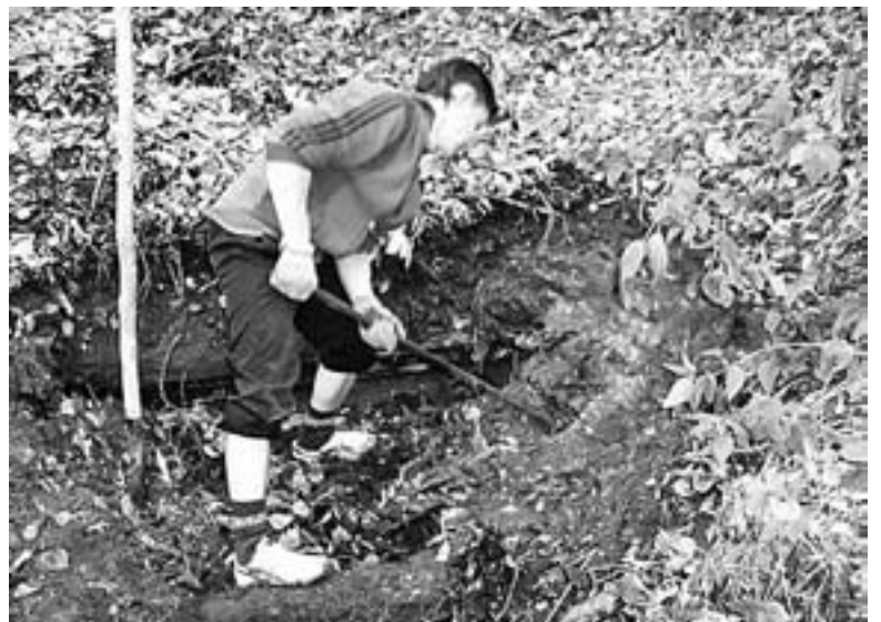
Где же тут родник?