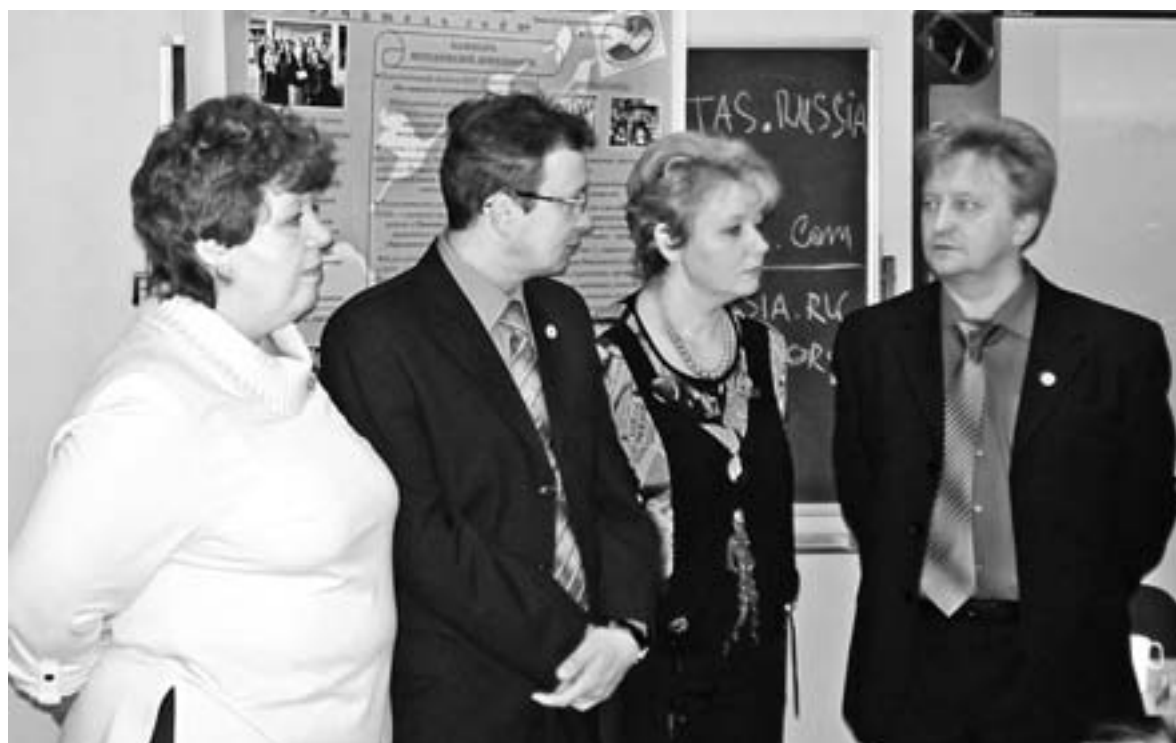
Мастер-класс экспромтом - это вам не фунт изюма!