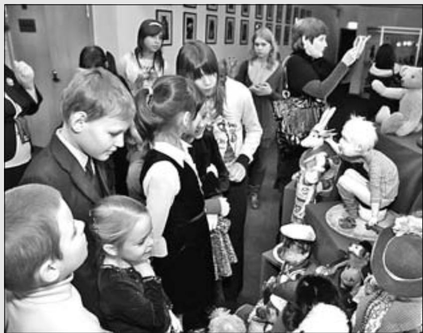
Игрушки Анастасии Байковой были действительно дробными и ручными

Зоя ЛАРИНА, Михаил КУЗМИНСКИЙ (фото) Красногорск