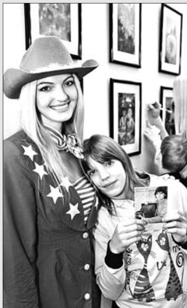
Материнского тепла не хватает каждому

Многие из этих детей не видели ничего хорошего и светлого. Жизнь