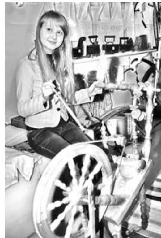
Домашнюю утварь для школьного музея ребята собирают сами

Зато не запрещено с помощью рубанка, молотка и стамески делать чудесные шкатулки, коробки, кухонные доски, вешалки и маленькие сувениры. Работы моментально разлетаются по выставкам и домам учеников. Что уж говорить о скворечниках, которыми увеша-