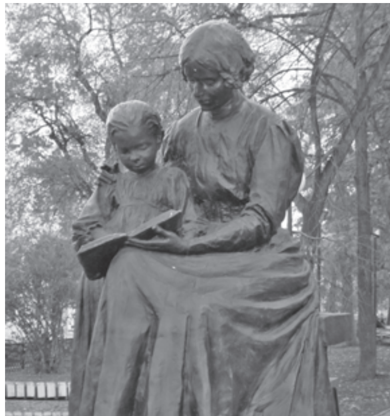
Памятник первой учительнице в Саратове. Современный скульптор изобразил бы ее с ноутбуком