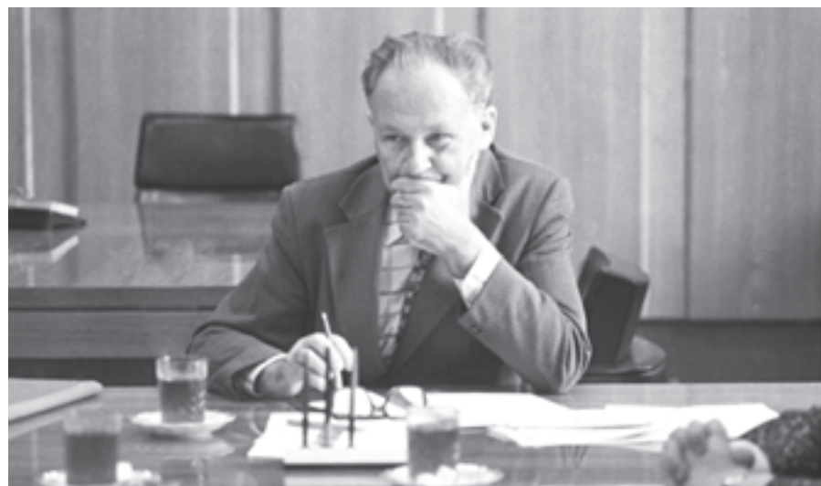
Михаил ПРОКОФЬЕВ в своем кабинете на Шаболовке

С мая 1966 года работал министром просвещения РСФСР, с декабря того же года - первый союзный министр просвещения. Возглавлял министерство до 1984 года. Автор многочисленных научных трудов по химии биополимеров. Член-корреспондент АН СССР, академик АПН СССР. В 1965 году стал действительным членом президиума Академии педагогических наук СССР, в 1966 году был избран членом-корреспондентом АН СССР. С декабря 1984 года и до конца своих дней - профессор-консультант МГУ им. М.В.Ломоносова.