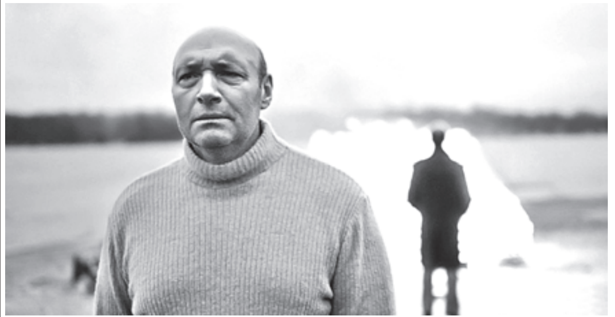
Кадр из фильма «Овсянки». Языческие обряды в картине ярки и убедительны

Современное кино исследует мистическую связь человека и природы