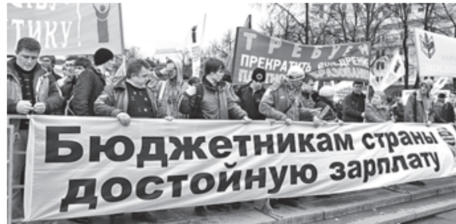
Пикет на Театральной площади в Москве