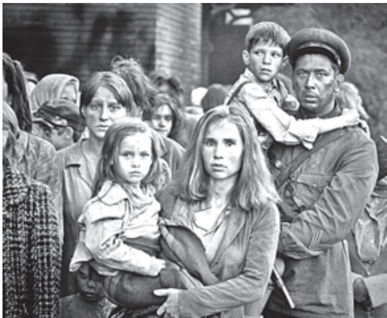
В фильме «Брестская крепость» вместе с известными актерами снялась едва ли не половина жителей Бреста

«Брестская крепость» - наш ответ «Перл-Харбору»