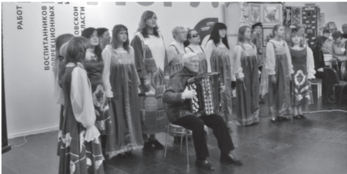
Открытие выставки-ярмарки в ЦДХ на Крымском Валу