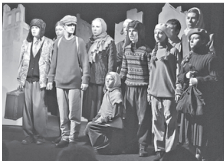
Дети войны. Сцена из спектакля «Далекие близкие звезды»

торое также обсуждает спектакли и выносит свои решения, присуждает награды. Даже если его мнение расходится с мнением «взрослого» жюри, тем не менее оценки детей говорят о том, что и они, и взрослые мыслят в одной иерархии ценностей. Можно говорить о том, что спектакли несовершенно, что дети могут что-то не так сыграть, режиссер может ошибиться в выборе пьесы, однако иерархия ценностей усваивается детьми. И оценки детского жюри обычно радуют.