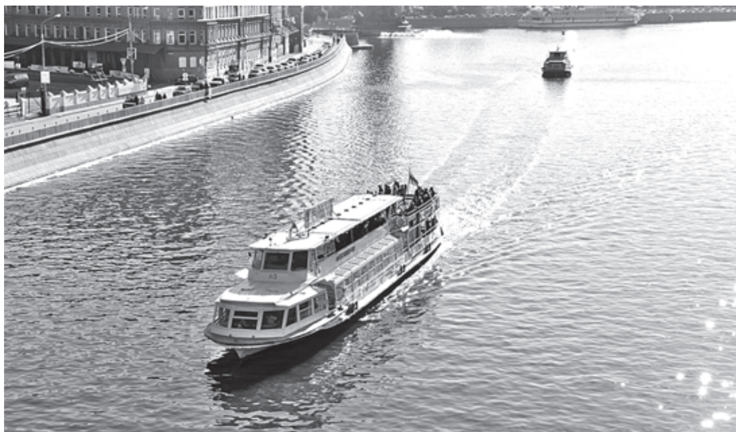
«Мир стал заманчивей и шире, и вдруг - суда уплыли прочь...»

«Светлая жена» - у Блока это не только об- раз женщины, но и России. А Россия - это мы.