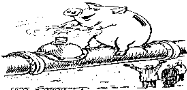
Рис. Игорь Смирнов

Политика межбюджетных трансфертов регионам ставит под угрозу целостность страны. Этот бюджет будет порождать сепаратизм! С 2010 по 2013 год из суммы трансфертов изымается 130 миллиардов рублей, при этом на регионы навешиваются дополнительные налоги и все расходы. А ведь у нас 69 регионов дотационные. Еще один поразительный раздел бюджета называется «Другие расходы». Все они увеличиваются: от 30-40 процентов до двух и более раз. Там «закопаны» миллиарды.