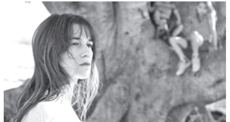
Кадр из ленты «Дерево». Для героини дерево стало олицетворением связи с умершим мужем

Затем героиня находит забвение в романе со своим начальником, но тут от дерева откальвается и падает на ее постель, проломив стену, толстая ветвь. Для Дон это становится знаком, что муж еще не ушел из ее жизни. А после веселого морского уик-энда с новым другом матери, когда от отца