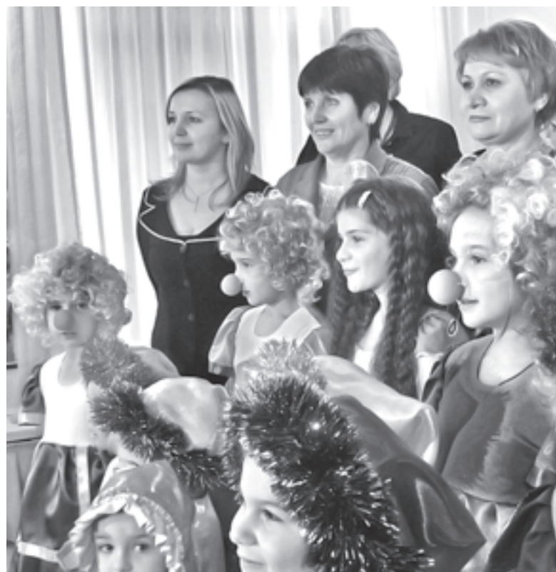
Гостям в «Улитке» рады