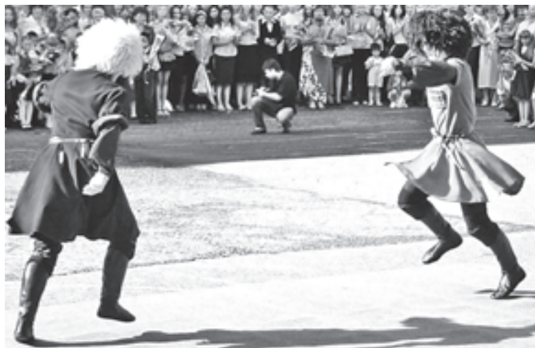
Какой праздник без зажигательного танца?

Коллектив гимназии активно работает над формированием системы дистанционного обучения, которая включает учебную деятельность (уроки предпрофильной подготовки, профессиональной подго-