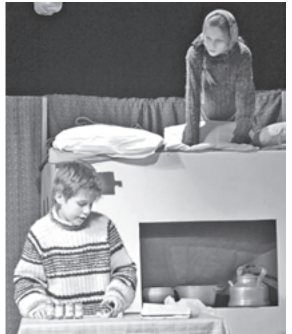
Разговор за изготовлением пельменей. Сцена из спектакля «Далекие зимние вечера»

Второй год на фестивале работает детско-юношеское жюри, ко-