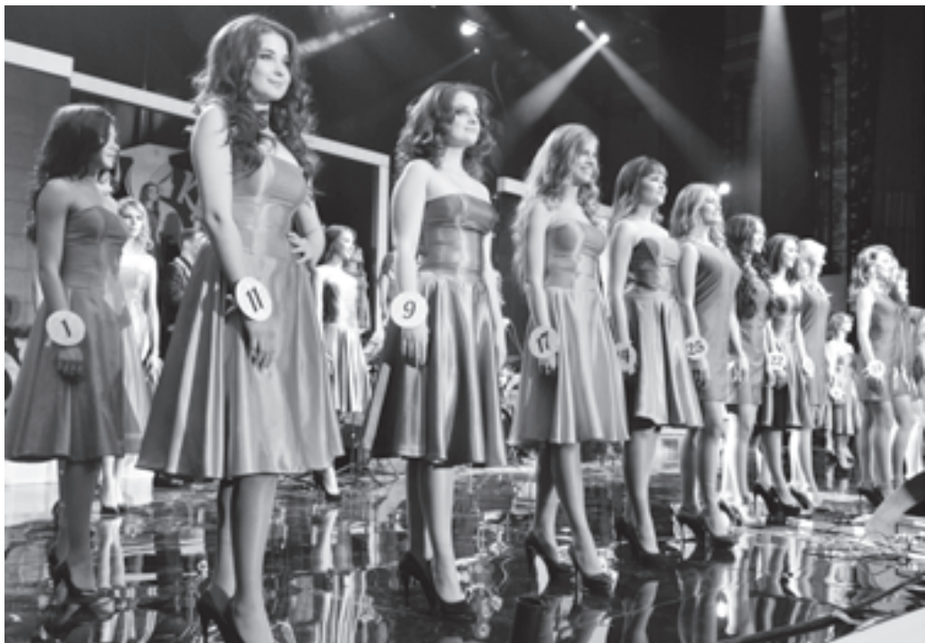
Количество красавиц на квадратный метр в Казани зашкаливало...

Выбрать самого сильного человека довольно просто - кто поднял самую тяжелую штангу, тот и победитель. То же с бегунами - пришел к финишу первым - все, никаких вопросов, ты лучший. И так далее. А вот как определить, кто самый-самый красивый? Ведь красота - понятие относительное, субъективное, тут человеческий фактор играет огромную роль. Вспомните предысторию Троянской войны: богиня раздора и вражды Эрида подбросила на пиршественный стол золотое яблоко, на котором было написано лишь одно слово-посвящение - «Прекраснейшей». А кто прекраснее - Гера, Афина или Афродита? Юноша Парис выбрал богиню любви, чем восстановил против себя остальных. Что из этого вышло, мы все прекрасно знаем.