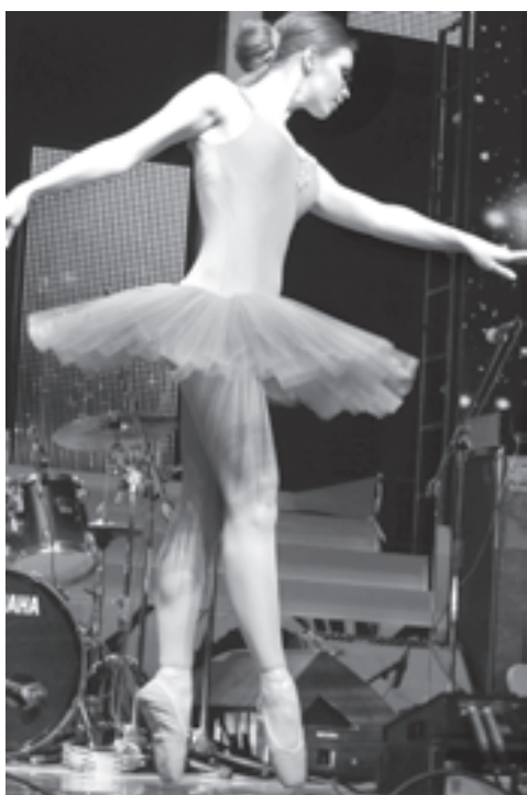
«Легко парит она в воздушном танце»

- «Краса студенчества России» проходит впервые в таком масштабе, - рассказал председатель Российского союза молодежи Павел Красноручий. - Основные критерии оценивания - это ум, интеллект, грация, находчивость, творчество, красота.