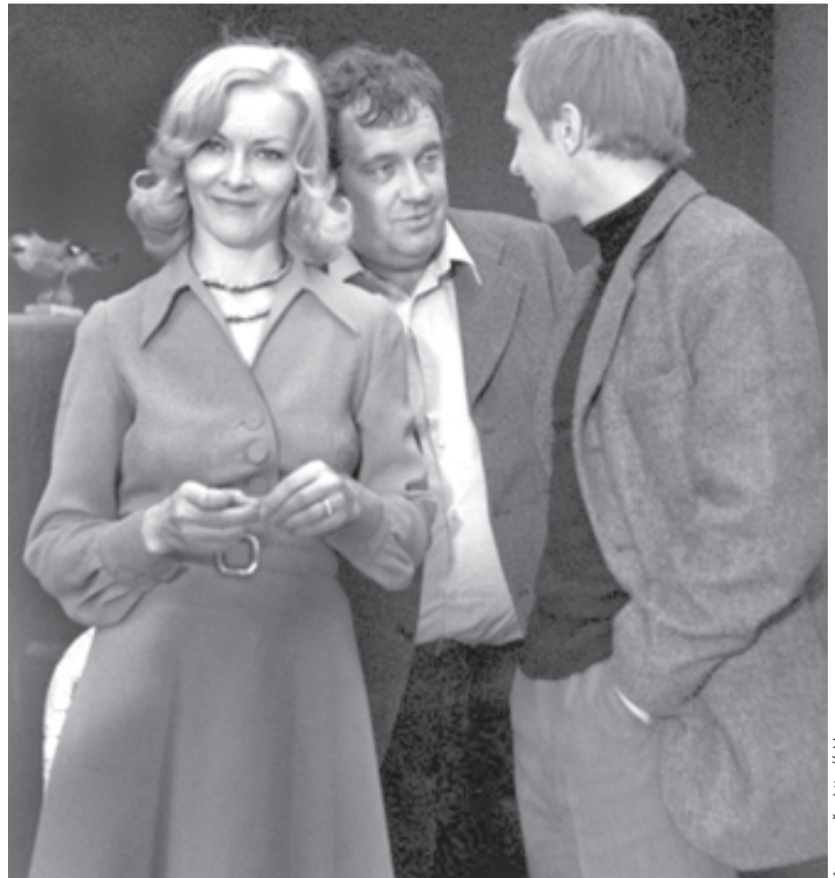
Эльдар РЯЗАНОВ на съемках новогодней комедии «Ирония судьбы, или С легким паром!» с исполнителями главных ролей Барбарой БРЫЛЬСКОЙ и Андреем МЯГКОВЫМ

Эльдар Александрович прославился также в качестве ведущего телепередачи «Кинопанорама». Кроме того, он создал более 200 авторских телевизионных программ. Наиболее популярными стали телевизионные циклы «Восемь девок, один я», «Белоснежка и семь гномов», «Разговоры на свежем воздухе», «Поговорим о странностях любви» (цикл передач о выдающихся людях).