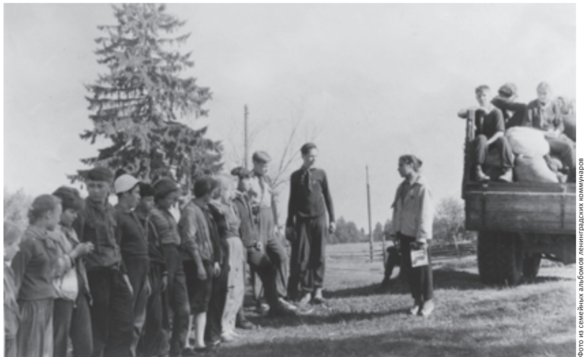
1961 г. Ефимия. Во время школьных каникул ленинградские коммунары высаживали трудовые десанты в самые экономически запущенные районы области

Это был первый шаг навстречу новой педагогике. По Иванову*. Со