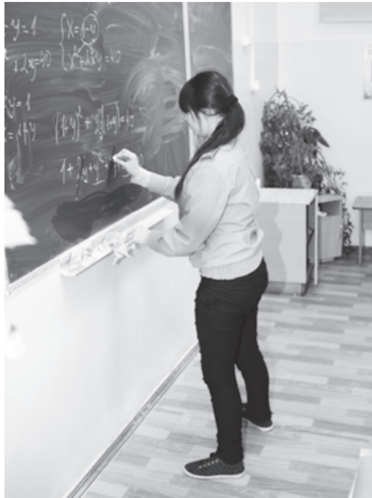
Запись решений принципиально важна!

Одной из целей введения ЕГЭ еще в начале 2000-х годов было разрушение дурной традиции натаскивания на определенный тип задач, характерный для того или иного вуза. Такое натаскивание иногда перерастало в служебное преступление - подготовку к решению вариантов будущего вступительного экзамена. Но и без того подготовка под конкретные типы заданий, соответствующие отдельным позициям письменного экзамена, была спецификой и репетиторов, и подготовительных курсов при вузах. Такая подготовка повышала шансы на поступление, но обедняла математическое образование.