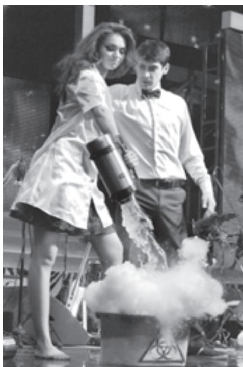
«А теперь приготовим формулу любви!»

По условиям конкурса в нем могут принять участие только те студентки, которые по всем предметам успевают не ниже отметки «4» и не имеют академических задолженностей. Так что тут мало быть просто краси-