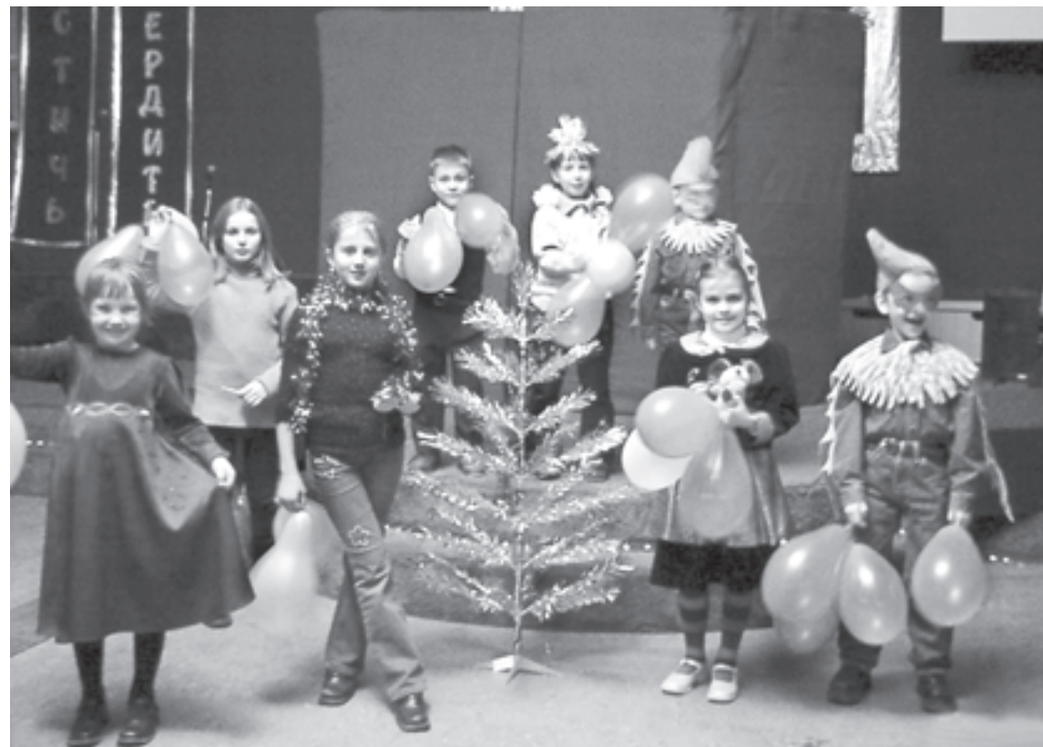
Гвоздь мероприятия - парад карнавальных костюмов