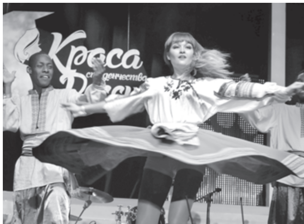
Красота спасет мир, труд, май

вой, нужно быть еще и умной, артистичной и незаурядной личностью. Все эти качества участницам предстояло продемонстрировать в ходе выполнения испытаний, рассказывая о своем родном крае, о себе, своих достижениях и творческих планах. Конкурс проводился в три тура: видеопрезентация участниц (рассказ о себе, своем вузе, своей малой родине); творческий номер; конкурс ораторского мастерства «Топ-спикер». При этом интрига сохранялась до последнего, поскольку жюри было крайне нелегко по