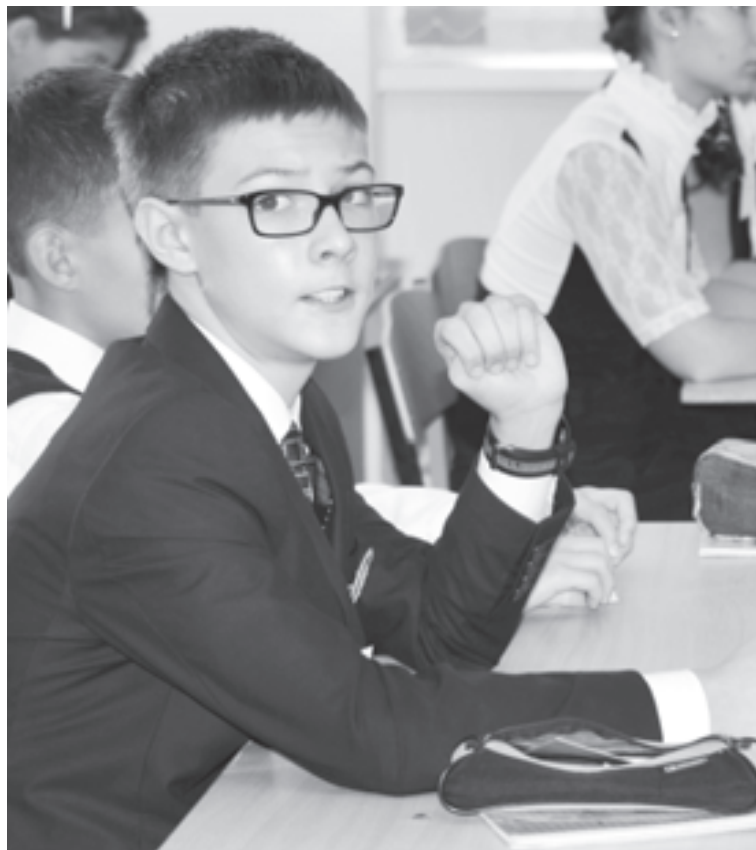
«Когда строку диктует чувство»

век прочитал множество пособий и для учителя, и для учеников по подготовке к написанию части С ЕГЭ по русскому языку. Все они построены по одной колодке: чтобы прийти к нужному результату, то есть получить хороший балл, нужно заранее знать, что необходимо, к примеру, писать о совести и какие