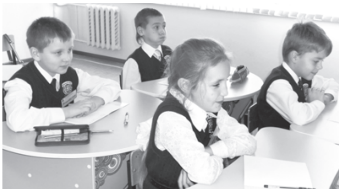
Все открытия для них, наших учеников

Теперь я учитель. За спиной годы практики и обучения, но урок для меня и сейчас место открытий. Открытий талантов детей, новых знаний и умений. Открытий радостных и грустных, однако без открытий на уроке скучно и учителю, и детям.