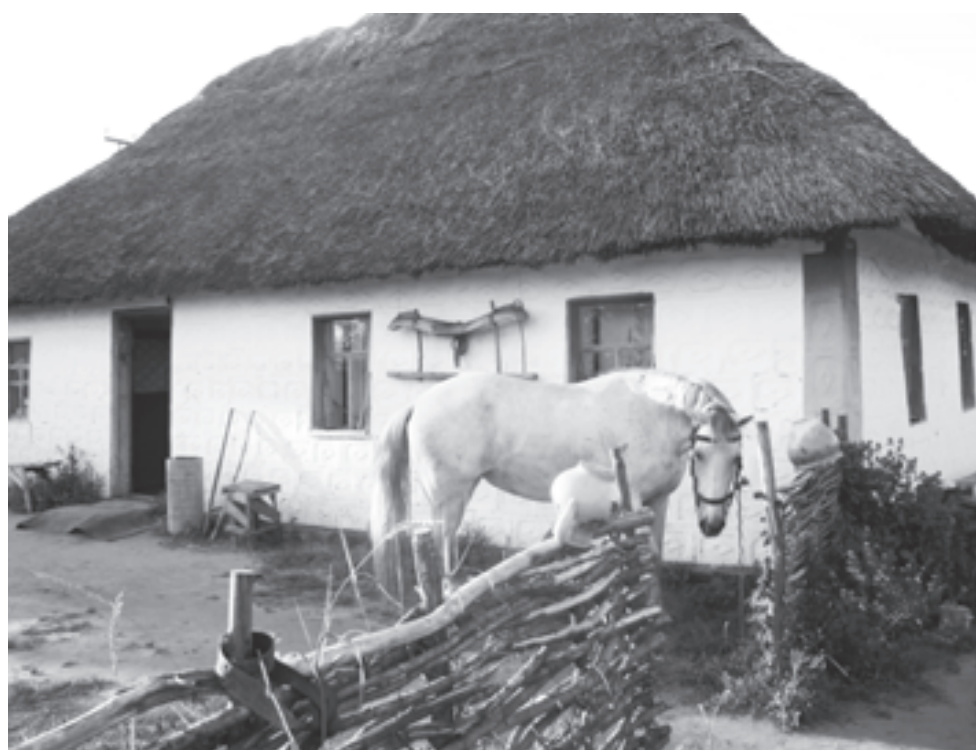
Друг, помощник, красавец...

- И мимо нас не проскочишь, - добавила та, что в платье. - Нас, Корковых, все одно не минешь!