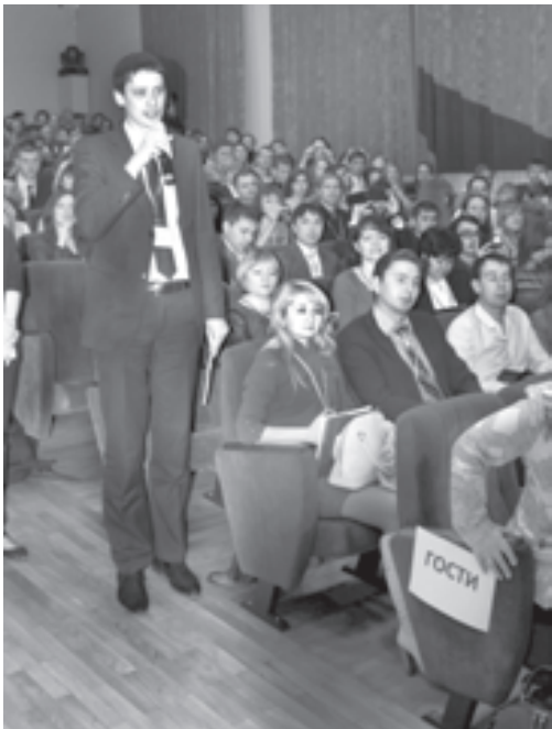
Молодые педагоги не упустили случая задать все наиболее важные вопросы

Внимания власти к проблемам становления молодых учителей в профессиональной сфере, возможность открыто обсуждать проблемы непосредственно с высшим руководством Министерства образования и науки Российской Федерации говорит сегодня о значимости образования в нашем обществе в принципиально новых складывающихся для нашей страны социально-экономических и политических условиях.