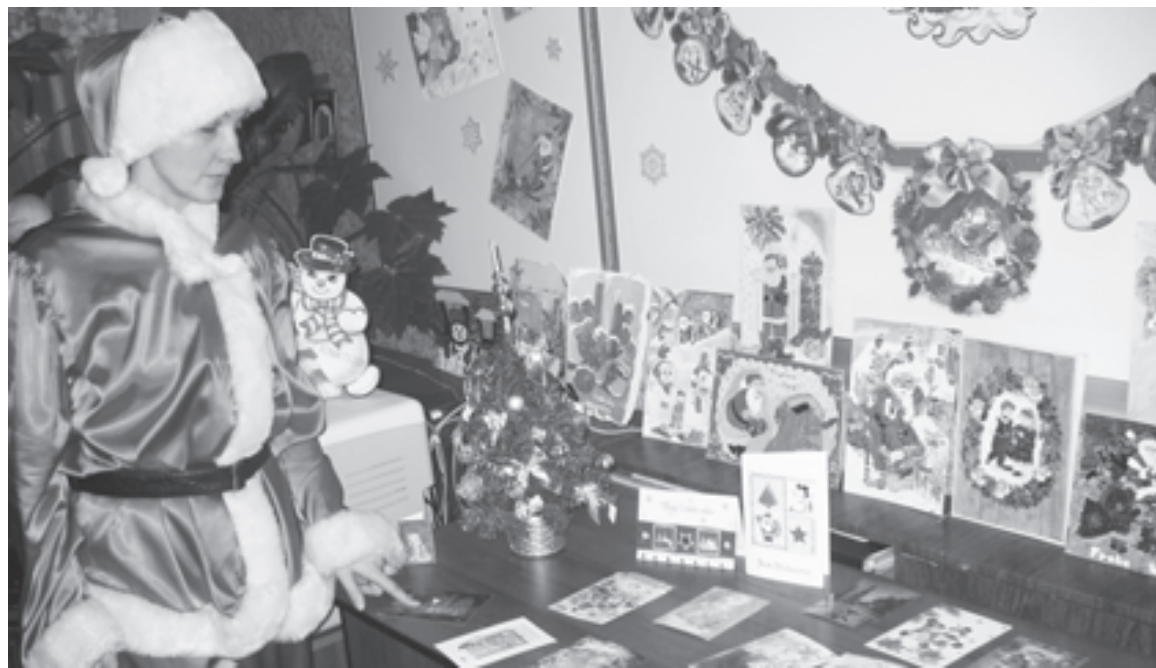
Рождественская выставка в школе

Прим. ред.: сценарий спектакля по Н.В.Гоголю «Ночь перед Рождеством» опубликован на сайте «Учительской газетой»: http://www.ug.ru/method_article/866 .