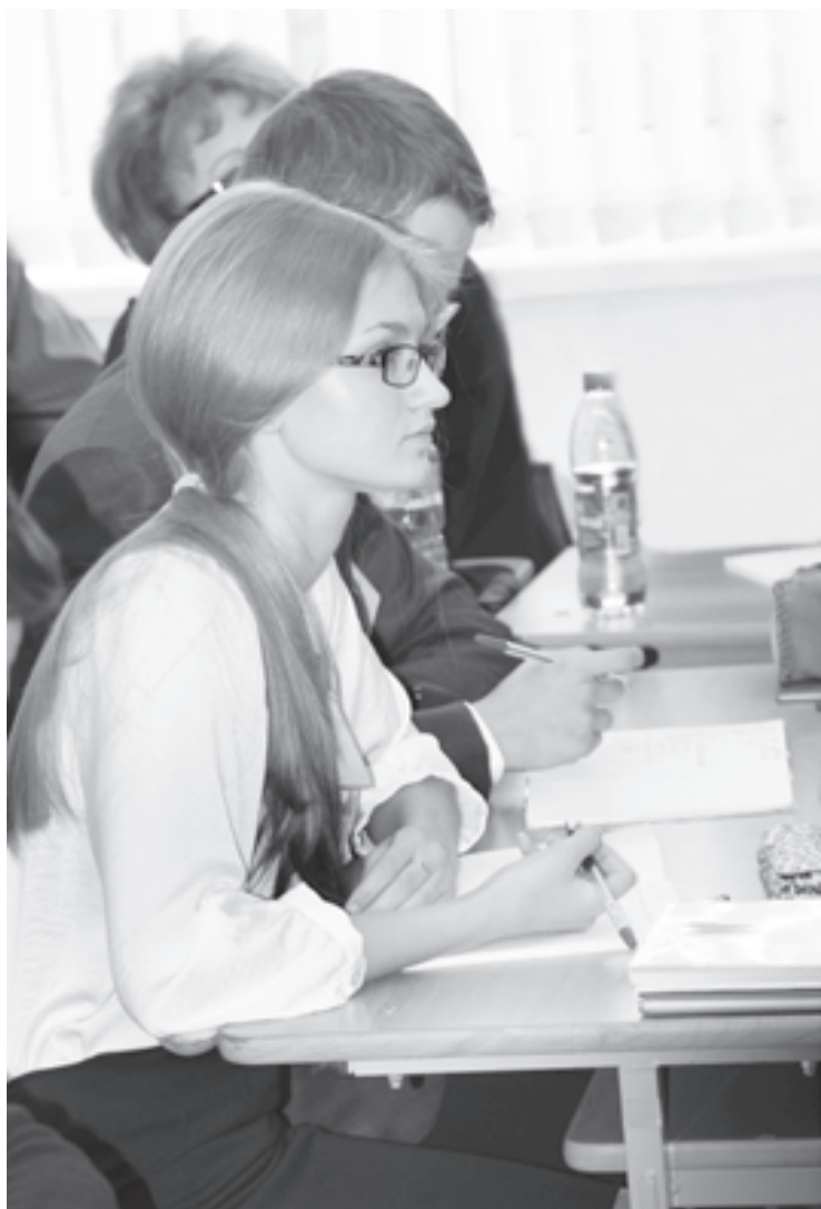
Писать «как надо» или «как я думаю»?..