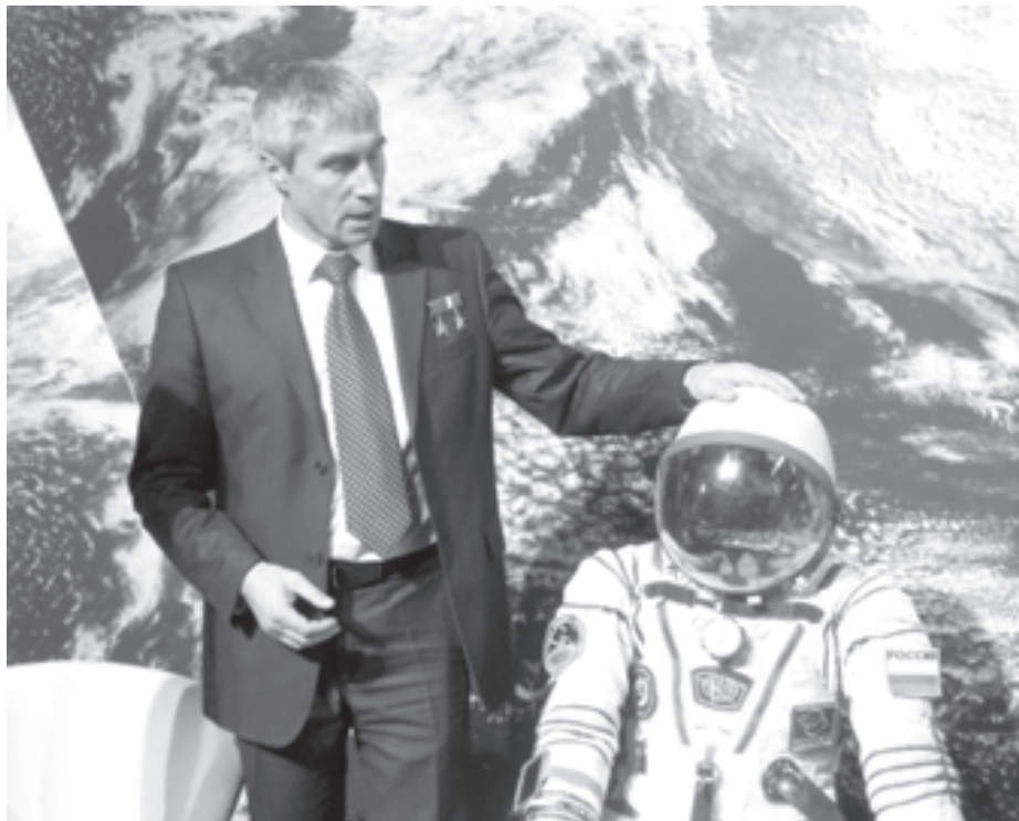
Сергей КРИКАЛЕВ, летчик-космонавт, Герой СССР и Герой России, объясняет, как устроен скафандр

Встречи со знаменитостями и лекции по самым разным областям науки сменяются проектной работой. Участники форума делятся на шесть кластеров - «Земля», «Космос», «Человек», «Общество», «Сети», «Город». Кластеры в свою очередь - на команды. За-