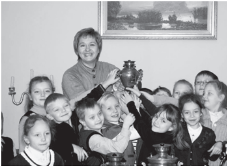
Чаепитие в музее

Приветствуя выпуск книги «История Слобожанщины и Белгородского края», губернатор нашей Белгородской области Е.С.Савченко выразил пожелание нашим народам: «История Слобожанщины - это наша история, история нашего родного края, каждого села, хутора. В этой книге - частица каждого из нас, наши корни. Мы являемся продолжателями наших предков, поэтому давайте эти роли поддерживайте. Ведь потеря культурного мира - это потеря нашего генетического кода».