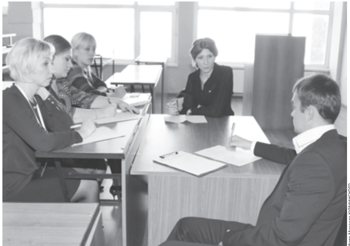
Вторая группа обсуждает свой образовательный проект

Первая идея, которая возникла во время обсуждения темы, - пусть проект будет связан с конкурсом «Учитель года»... Смолодыми учи-