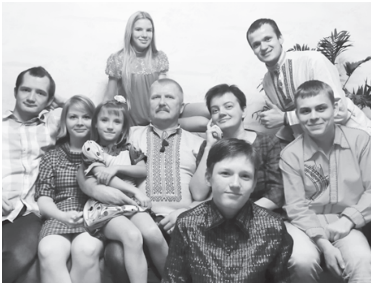
Семья вместе - душа на месте

Хороших учителей все же больше! Даже с теми, с которыми у нас при первом знакомстве и возникли некоторые разногласия, после совместных переговоров налаживались отношения и направлялись в нужное русло усилия. Ведь учителей тоже можно понять, их никто не учил общению с детьми-«подранками». По-