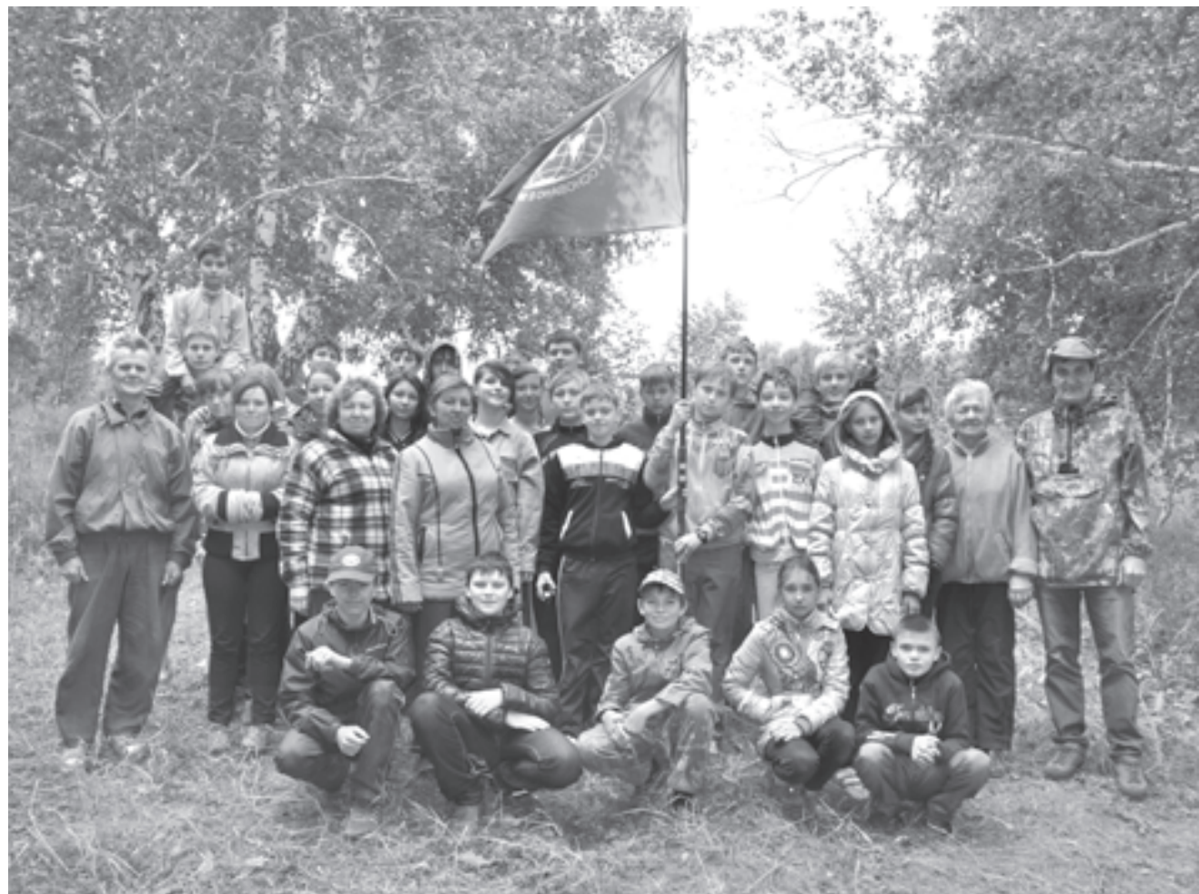
Юные геологи в условиях, «приближенных к боевым»

Сегодня в клубе занимаются более 70 подростков Орска, в летней школе принимают участие дети, увлеченные геологией, из ближайших городов. Кстати, в последние