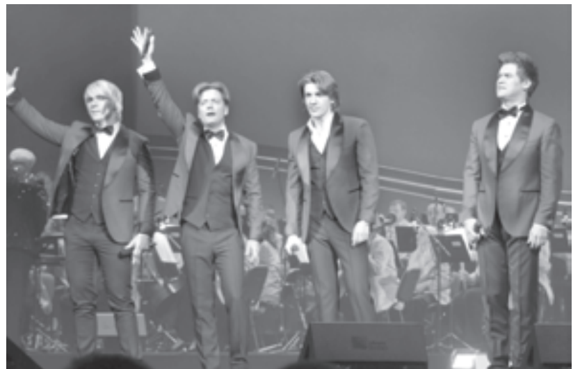
Группа «Квадро» покорила зал великолепным сочетанием голосов