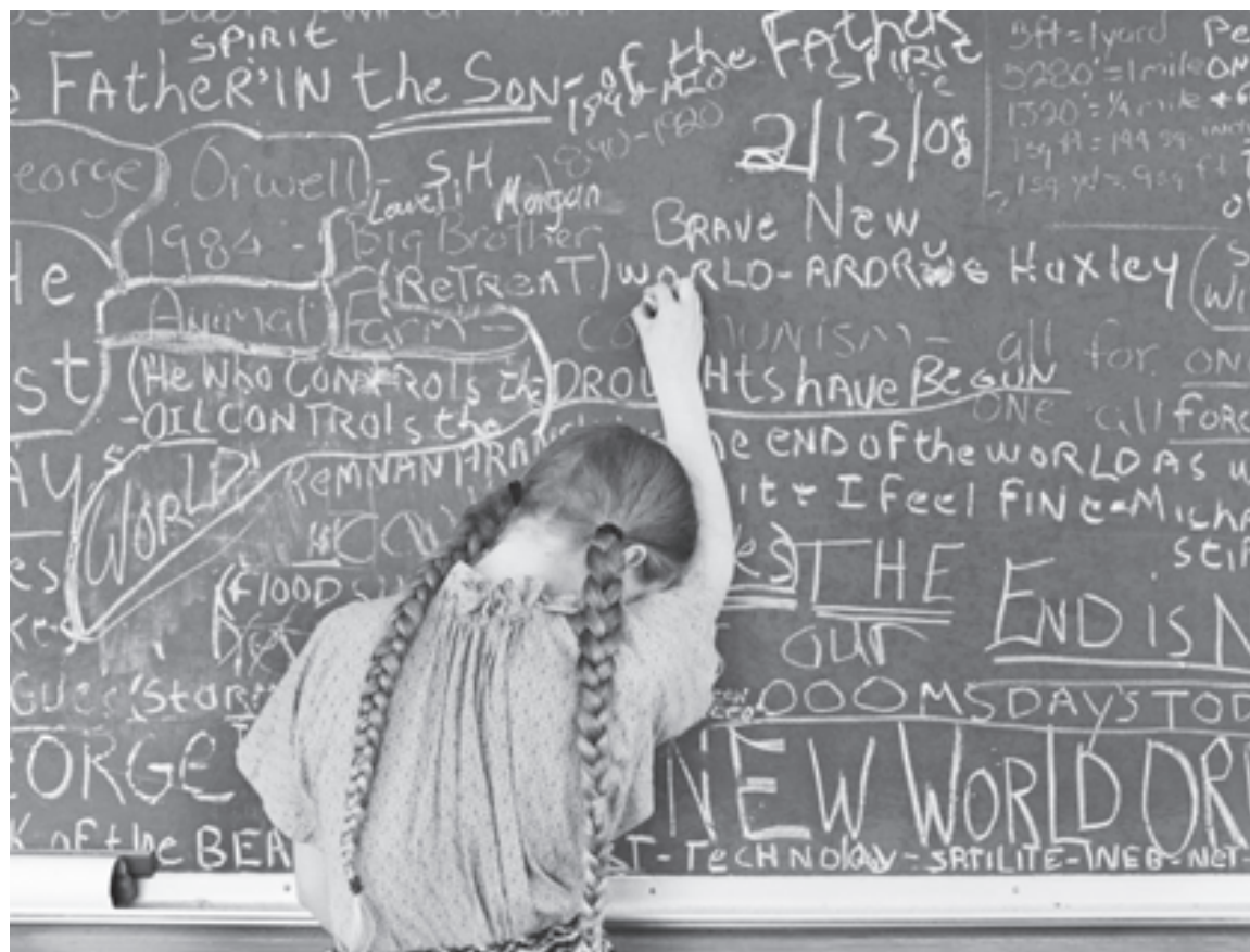
Когда общество беспокоят только баллы и результаты - это путь в никуда