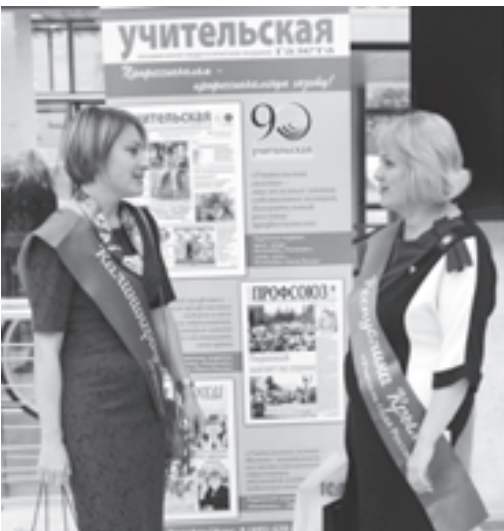
«Учительская газета» всегда объединяла самых талантливых педагогов России

Урок завершился, а вернее, завершились десять дней экспресс-обучения на уникальных курсах «Учитель года России-2014». Пришла пора наградить того, кто лучше всего показал себя в испытани-