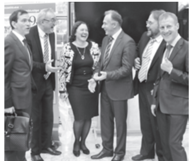
Братство «пеликанов» - это навсегда!