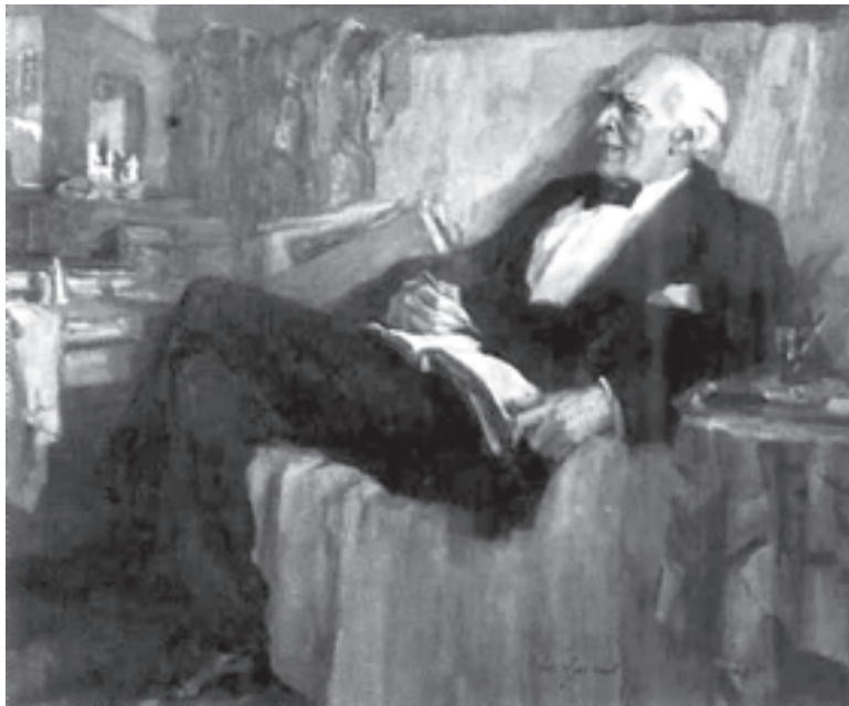
Николай УЛЬЯНОВ. К.С. Станиславский за работой

Старшее поколение помнит, какое сильное влияние оказало творчество Николая Павловича Ульянова на духовную жизнь общества в 30-40-е годы. Назовешь имя, и на память искусствоведа сразу приходит знаменитый портрет «К.С. Станиславский за работой». За эту картину Ульянов был удостоен Государственной премии СССР. Известно его полотно «Пушкин с женой на