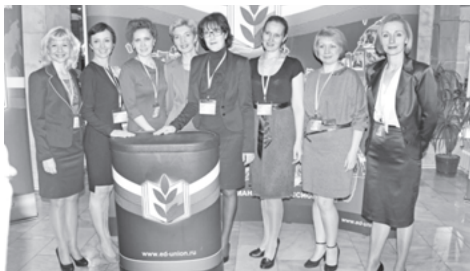
Конкурс - всегда экзамен и праздник

Но конкурс - это не только финал в Москве. Это и широкое послеконкурсное движение, которое охватывает не только участников конкурса, но и всех работников дошкольных образовательных организаций, кто заинтересован в повышении своего профессионализма. На сайте Всероссийского профессионального конкурса «Воспитатель года» www.vospitatel-goda.ru/index.php начиная с первых дней его основания Общероссийским профсоюзом образования в целях дальнейшего развития системы отечественного дошкольного образования, профессионального и личностного роста работников в рамках Всероссийского интернет-клуба работников дошкольного образования «Созвездие», созданного в 2011 году, проводятся профессиональные состязания, победители которых приглашаются на финал Всероссийского про-