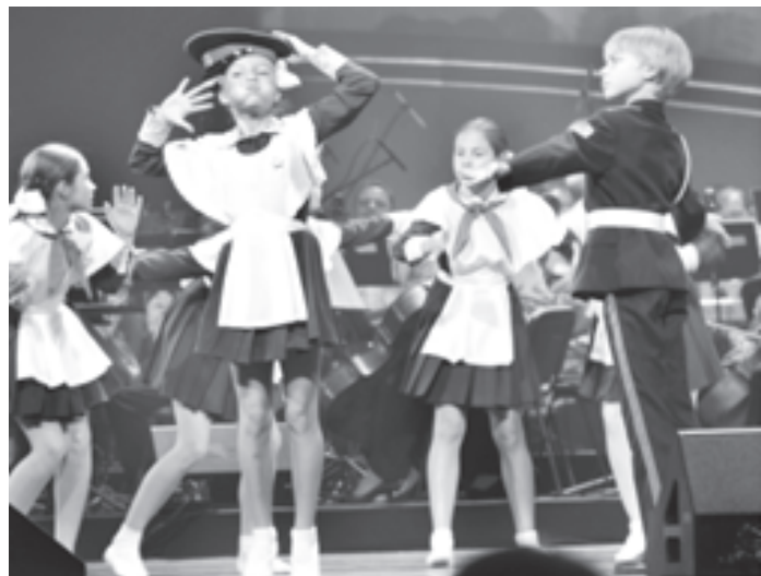
В Международный день учителя на сцене Кремлевского дворца, конечно, были и ученики

Чтобы донести до зрителей-учеников раздаточный материал, в зал выбежали дети-газетчики, похожие на тех, которые в начале XX века торговали свежей прессой на улицах городов России. Все с удо-