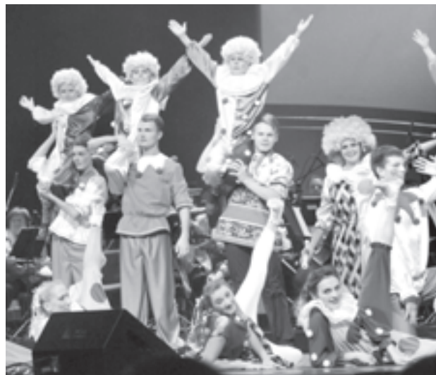
Для 5 тысяч зрителей концерт в Кремлевском дворце стал настоящим праздником