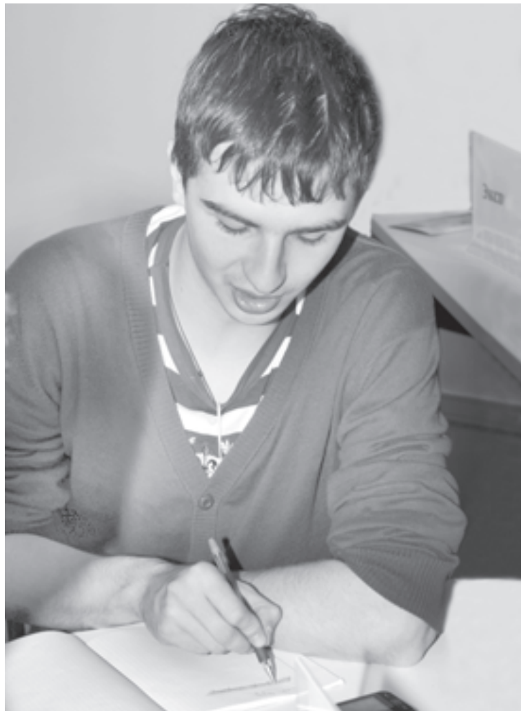
Сочинение - поиск ответа на вопросы

Сегодня же по части обоснования у нас явно негусто. Господствует предложение товара. Между тем уже обращение к прошлому педа-