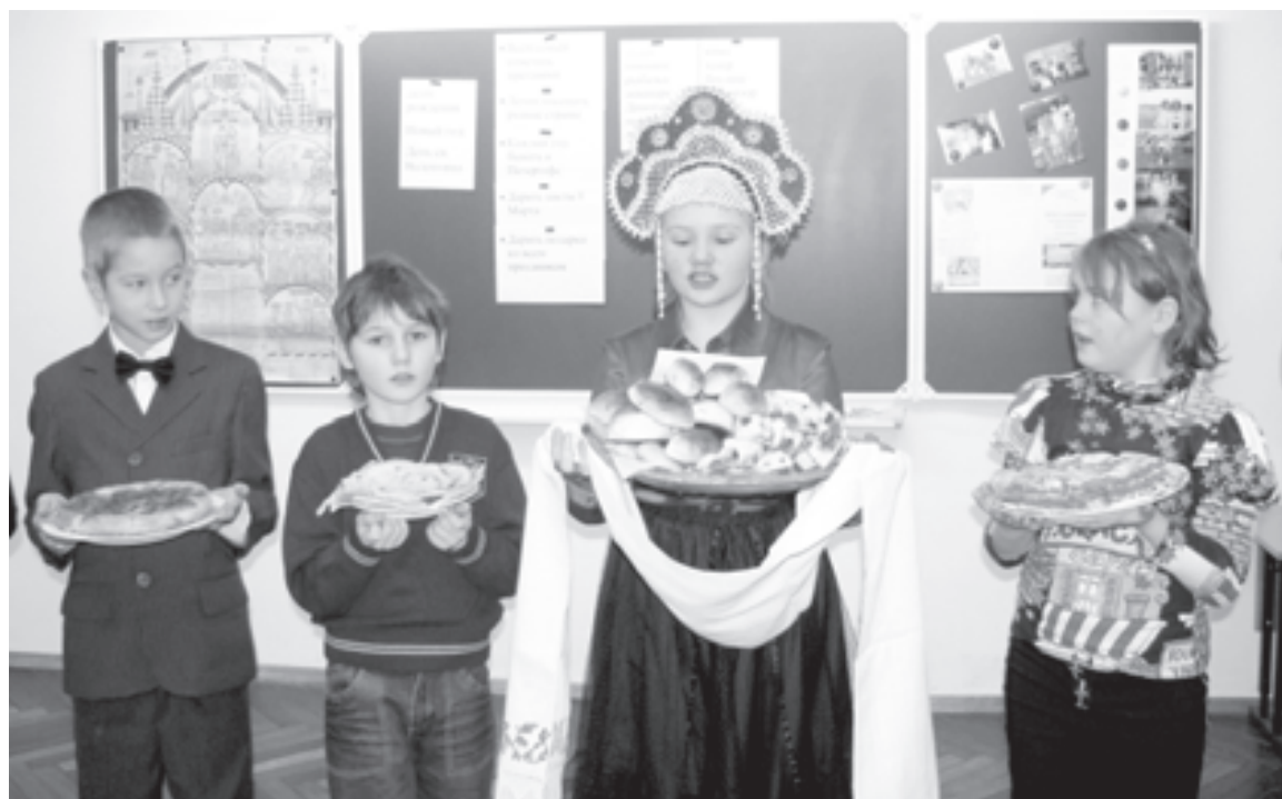
Юные кулинары представляют фирменные блюда своих семей

Прим. ред. Все приложения к сценарию вечера опубликованы на сайте «Учительской газеты» http://www.ug.ru/method_article/842