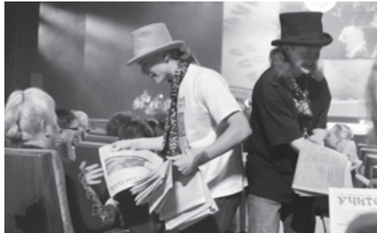
Зрители получили репринтное издание самого первого выпуска «УГ» от 3 октября 1924 года