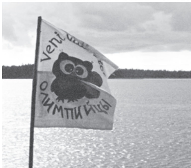
Большое приключение начинается!