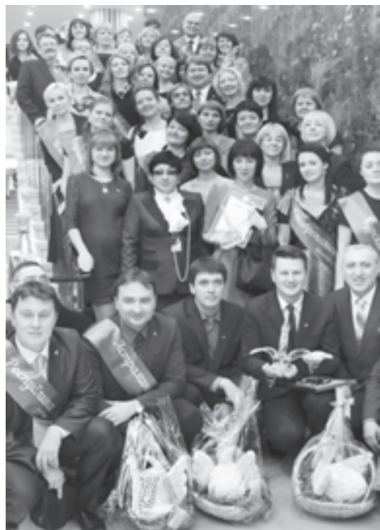
В «Учителе года России-2014» приняли участие педагоги из 81 региона страны

«Учитель года России» и «Учительская газета»