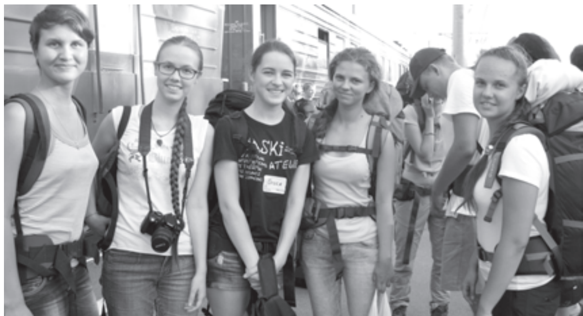
Поход - хорошая возможность испытать себя и найти друзей