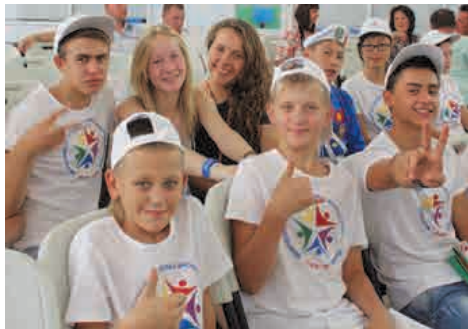
Участники Межгосударственного слета юных инспекторов движения