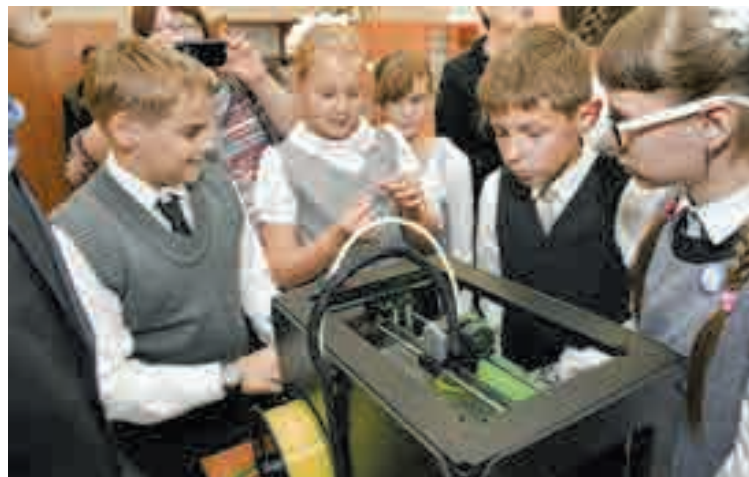
В подарок к 1 сентября зеленогорский лицей получил от госкорпорации «Росатом» суперсовременное 3D-оборудование

Руководство лицеев отмечает перспективность организации такого практико-ориентированного учебного процесса. Работа дает реальные результаты. Более 70% выпускников всех лицеев выбирают технические специальности, поступают в лучшие вузы страны.