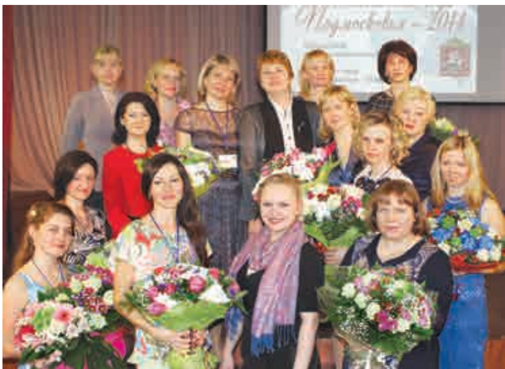
Команда единомышленников - специалисты Московского областного центра дошкольного образования «Содружество» и воспитатели

детском саду такой, чтобы она запомнилась как некое необыкновенное событие. И вот для этого и необходима особая площадка, где ученые и педагоги, эксперты и родители могли бы обсуждать, что и как сделать, в чем и зачем нужны изменения.