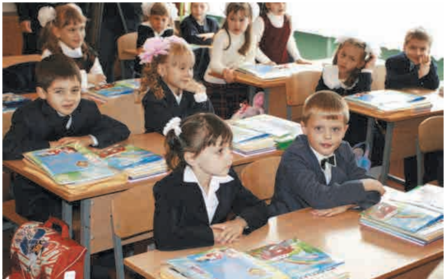
«Карта Юниора» позволяет детям успешно усвоить урок финансовой грамотности

- На данный момент - более 260 школ по всей России. В каждой школе банк бесплатно устанавливает POS-терминалы для приема карт к оплате. То есть за оборудование учебного заведения платить не нужно. При этом за платежи, которые проводятся по картам «БИНБАНК кредитные карты», никаких комиссий со школы не взимается.