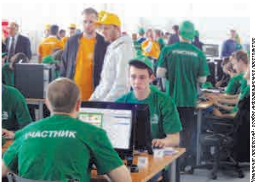
Чемпионат професий - особое информационное пространство