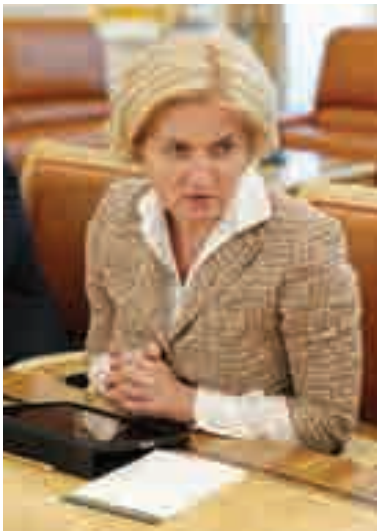
Ольга ГОЛОДЕЦ, заместитель Председателя Правительства Российской Федерации:

- Общероссийский рейтинг школ становится уже хорошей традицией. Рейтинги - важный ориентир для всей системы общего образования. Успехи конкретной школы важны и для педагогов, и для родителей, и для учеников. В этом году появилось несколько новаций, которые должны сделать систему оценки еще более объективной и справедливой. Прежде всего это дополнительные рейтинги по отдельным направлениям, в которых школа может быть особенно сильна. В общей сложности в рейтинг 500 лучших школ, рейтинг лучших сельских школ и рейтинги по направлениям вошли школы из 79 регионов России. То есть практически в каждом уголке страны можно найти действительно хорошее образование.