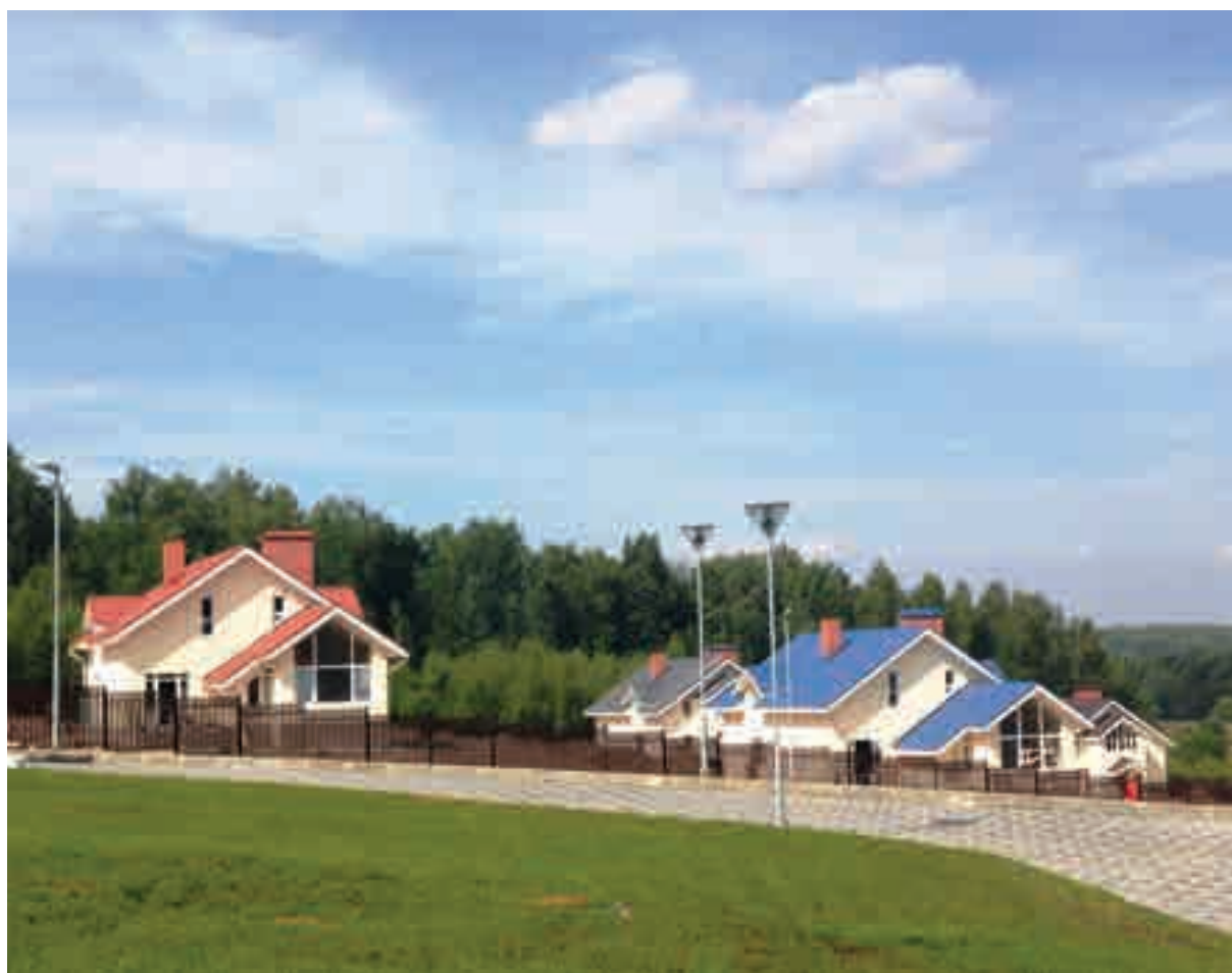
Семейный городок - новая жизнь в красивом ландшафте