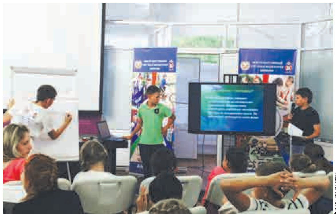
Занятие, посвященное светофору

2. Легкого или средней тяжести вреда здоровью человека либо материального ущерба.