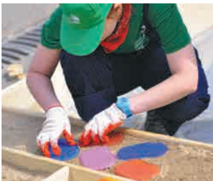
«Надеюсь, получится красиво»

И все-таки складывается впечатление, что времена, когда слово «профессионал» ассоциируется лишь с Полем Бельмондо и тревожной грустью музыки Энни Марриконе, канули в Лету. В обиход снова входит слово «мастер», и оно становится... модным.