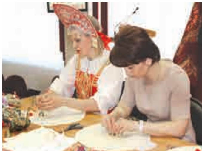
На конкурс приходят люди яркие, самобытные

Про сказкотерапию, народные праздники и жажду студентов создать детский сад будущего наша газета рассказывала. Было это семь лет назад э«УГ» №13 от У ноября 200ШгодаД а источником вдохновения для статьи послужила жизнь кафедры педагогики начального обучения Московского государственного областного гуманитарного института. Жаркие кафедральные дискуссии и самозабвенная работа над обновлением содержания дошкольного образования имели конкретный результат. Современный научный подход для практики детского сада оказался очень даже нужным, и на базе вуза в 2002 году был создан Московский областной центр дошкольного образования «Содружество», своеобразная инновационная площадка для обучения, профессионального общения, научного поиска, развития творческих идей.