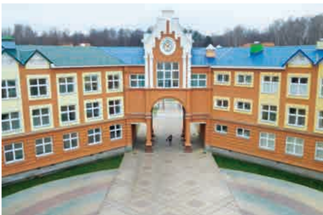
Школа должна вызывать восхищение...

проблемы: оптимальна ли организация образовательного процесса, правильно ли составлено расписание, учитывает ли оно распределение нагрузок с учетом физиологических возрастных особенностей, удобны ли школьные помещения, приемлем ли микроклимат, создаваемый кондиционерами, используются ли в работе современные средства обучения - электронные учебники, базы данных, коммуникационные каналы, - и насколько образовательное учреждение приспособлено для учеников с ограниченными возможностями здоровья.