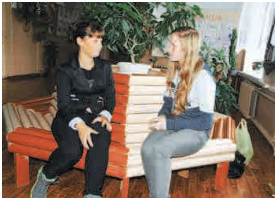
Прочитал книгу - обсуди с другом

P.S. Вот и новый образ на прощание: книга без бумаги - это как семья без детей - конец фамилии. Кстати, знаете, на что похож дом без книг? Точно - на гостиницу! По домам, друзья, по домам!