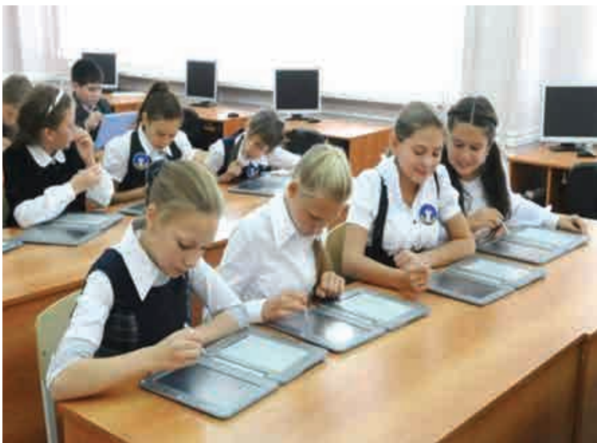
...и в ней все интересно

- Стандарт оформления общеобразовательного учреждения возник из множества предпо-