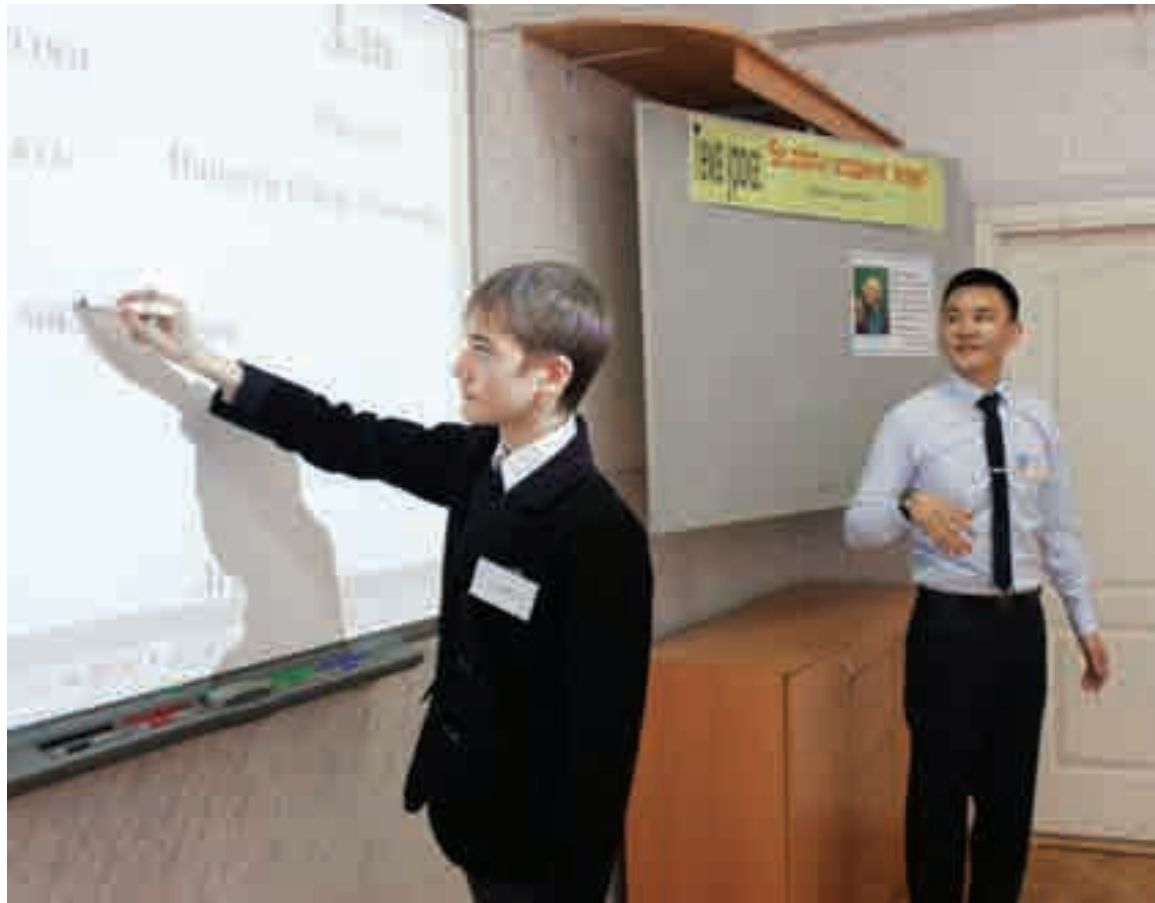
Ученик определяет, какие поступки добрые, а какие злые

Учитель: Джон Рескин, английский писатель, говорил: «Смотри на каждую утреннюю зарю, как на начало твоей жизни, и на каждый закат солнца, как на конец ее. Пусть каждая из этих кратких жизней будет отмечена каким-нибудь доб-