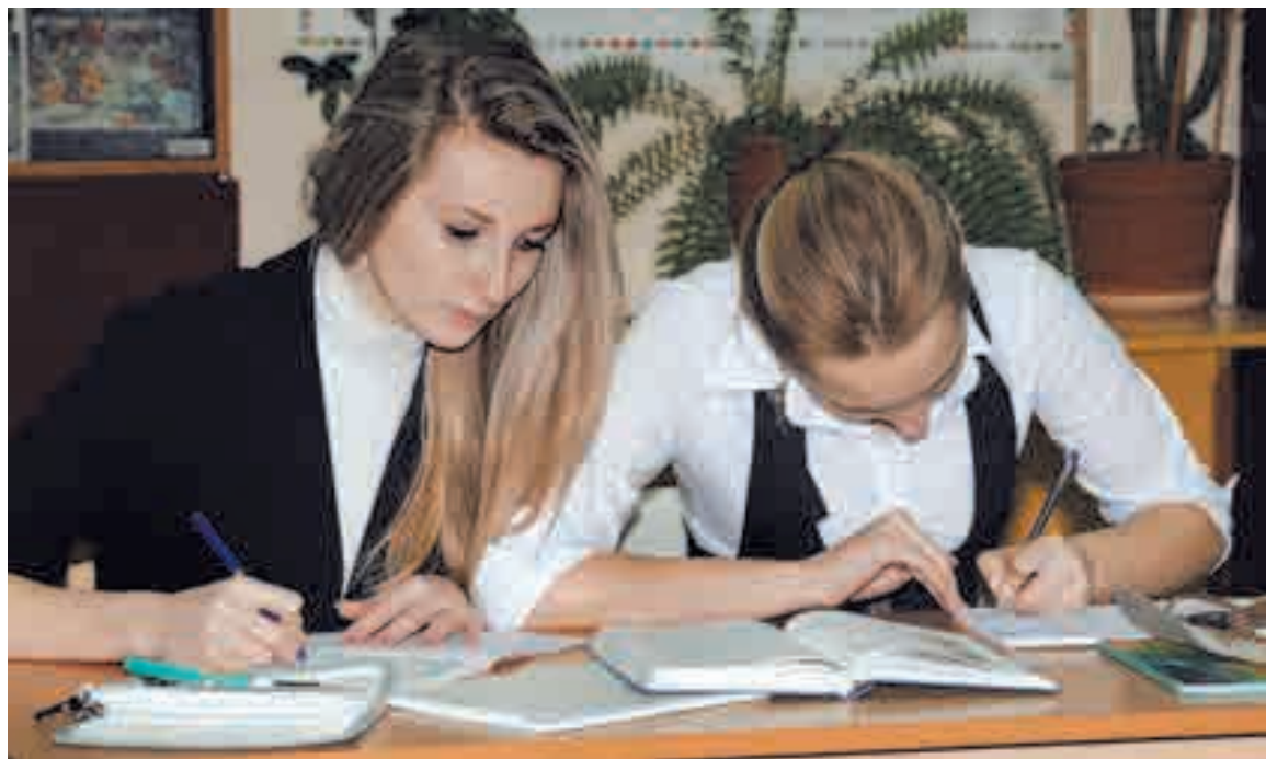
Учимся размышлять, рассуждать, излагать

Да что школа! Я читал выступления руководителей наших творческих вузов: ГИТИСа, ВГИКа, театральных училищ. К ним приходят, чтобы стать режиссерами и актерами, не прочитавшие ни одного романа Достоевского и Толстого. А вот свидетельство профессора, заведующего кафедрой мировой литературы и культуры международ-