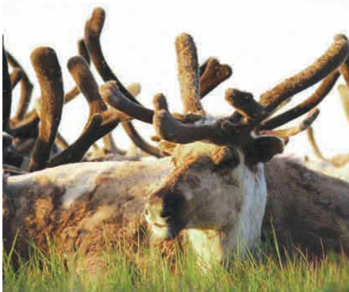
Северные олени тоже часть малой родины

Учитель: Спасибо вам за вашу работу, вы очень хорошо работали, а помогла нам в этом дружба!