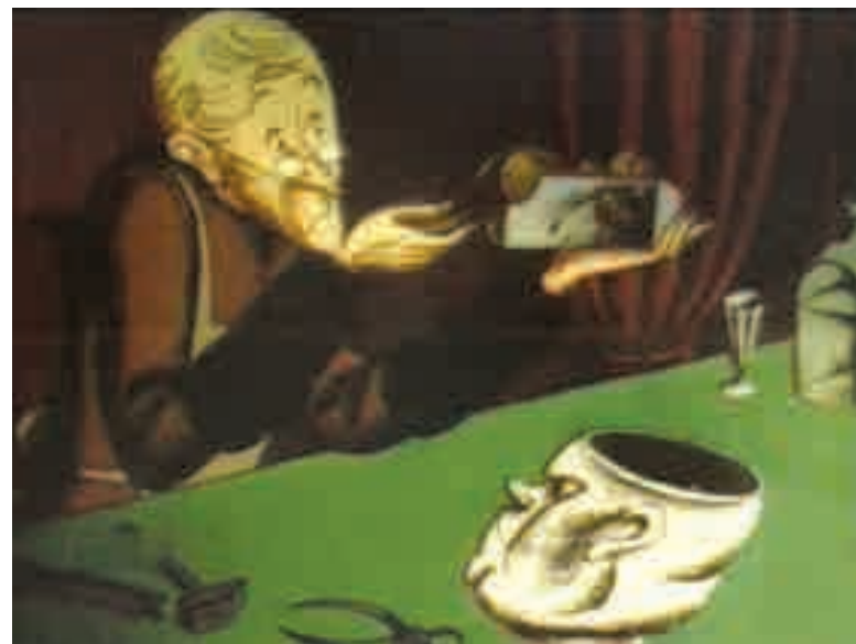
Фрагмент из мультфильма «История одного города»

И вдруг... Излучистая полоса жидкой стали сверкнула ему в глаза, сверкнула и не только не исчезла, но даже не замерла под