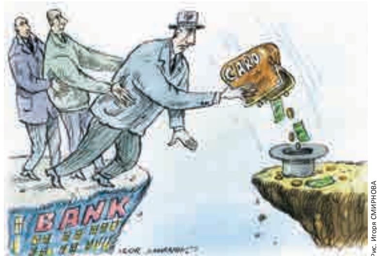
Рис. Игорь Смирнов

Довольно большая зарплатная «вилка» оказалась у мастеров парикмахерского дела. Как сказали в академии «Локон», выпускница учебного заведения может получать от 20 до 60 тысяч рублей в месяц. Поскольку большинство салонов красоты находится в частных руках, все зависит от работодателя и режима работы. Правда, в парикмахерском искусстве, как нигде, хорошо применимо выражение: «Все в твоих руках». Если руки золотые, то буквально за считанные месяцы у мастера появляется своя клиентура, что дает возможность