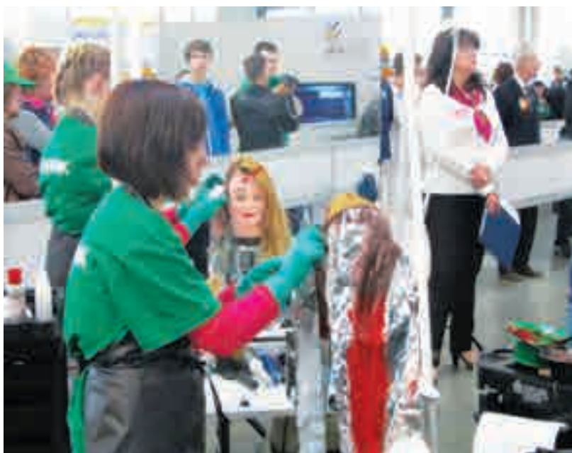
Пока в качестве моделей только куклы...

При подготовке к чемпионату прошли многочисленные тренинги в образовательных учреждениях-участниках. Чтобы попасть