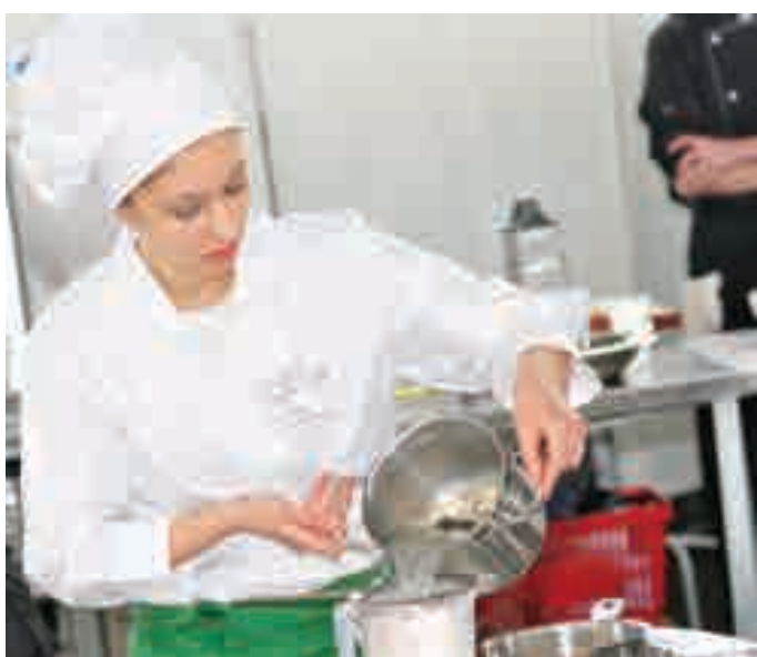
Это вам не съезки очередных серий «Кухни», это WorldSkills!

Первый национальный чемпионат по профессиональному мастерству WorldSkills Russia-2013 прошел в Тольятти. В чемпионате принимали участие 310 участников, 150 экспертов (из них 34 иностранных), 250 членов делегаций от 42 регионов России. Команда Московской области была представлена командой из одиннадцати студентов и шести экспертов.