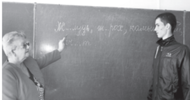
На занятии по русскому языку

- развивать коммуникативные возможности обучающихся в процессе подготовки к общеколледжному внеклассному мероприятию;