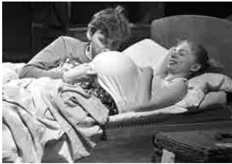
А начиналось все с любви... Сцена из спектакля «Кити и Лёвин. Сны»