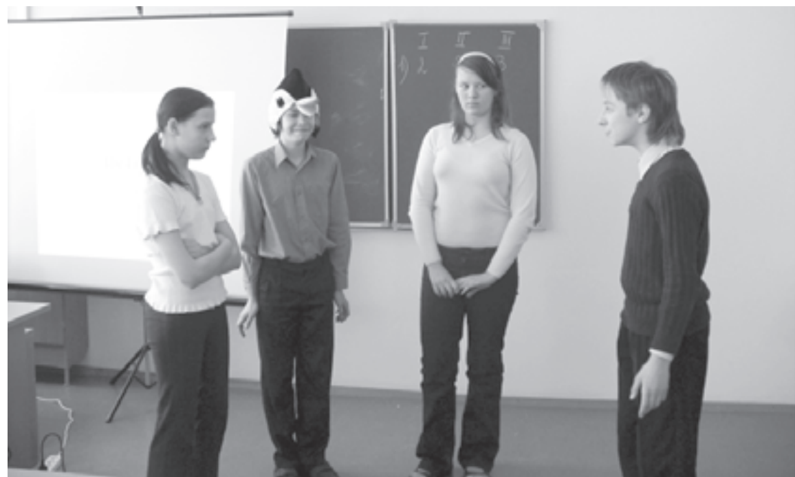
В игре не страшно ошибиться

Учитель называет экипаж-победитель, набравший большее количество баллов. Обращает внимание на то, какие умения показали ребята во время урока и над чем нужно еще поработать.