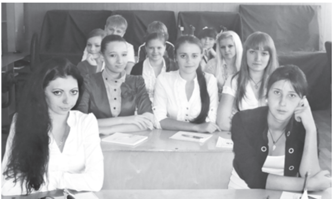
Студенты Регионального многопрофильного колледжа Ставрополя совсем не двоечники

Путь педагога - это не ошибка, Ведь это не работа, а судьба,