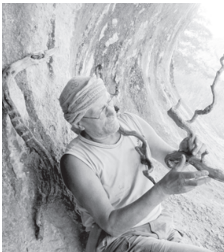
Обломок коряги превращаем в оберег

Иногда утром или на закате я пробую творить молитву. Увы, ничего не получается. Не научен и не приучен. Не то что мои далекие предки. В том числе и пещерные, конечно. Из своих скальных обителей они видели те же горы, те же облака, тех же птиц. Но для них они были не предметами и явлениями чуждого мира, а духами, на которые можно воздействовать, с которыми можно о чем-то договариваться. Кстати, название таврского племени напеев, обитавшего в этих краях, переводится с греческого как «нимфы долин». Звезда засияла - четче стал виден твой земной путь, ворон каркнул - судьба подавала голос. Древний человек не ощущал себя чужаком, гостем в мире природы. Обитатели здешних пещер были уверены, что с помощью оберегов, амулетов, молитв и заклинаний всегда смогут договориться с духами лесов, гор, ветров, облаков. Они им поклонялись, всячески задабривали, увещевали, а то и наказывали. Самое главное - у них не было страха.