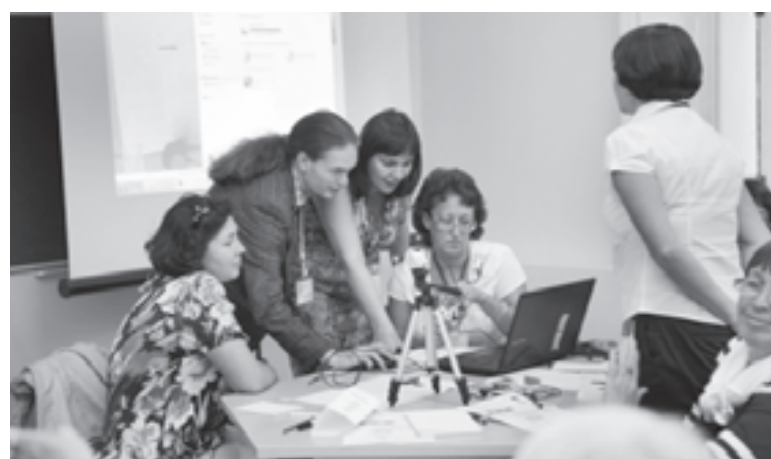
Мастер-классы стали демонстрацией талантов

К концу смены все дети должны разработать свои космические проекты, работа над которыми будет продолжена и после пребывания в лагере. Авторы лучших проектов получают приз - поездку на космодром Байконур.