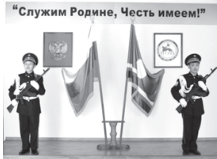
Это фото - часть материалов проекта о кадетской школе-интернате в поселке Чернышевский Республики Саха (Якутия)