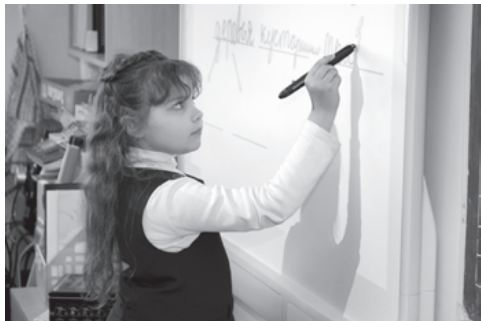
Слова писать умеем. А разговаривать?

И не надо заманивать участников факультатива четвертной пятеркой в классном журнале! Обещание предоставить возможность выступить с собственным рефератом