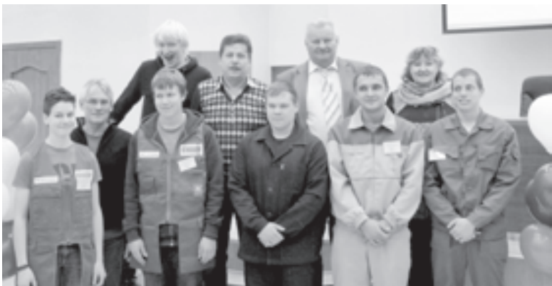
Команда ребят, представляющих Ленинградскую область в Казани

Немало мероприятий будет направлено на развитие детского творчества, спорта, отдыха, охрану здоровья, оказание материальной помощи, на научно-педагогическое, информационное, творческое и психологическое сопровождение процессов развития детей и подростков. Словом, будет сделано все, чтобы дети Ленинградской области чувствовали себя настоящими цветами жизни. Но главное, как пообещал Александр Дрозденко, - с окончанием календарного года Год детства не закончится. Большинство программ, направленных на поддержку семьи и детства, по-прежнему будут работать. Потому что о будущем нельзя забывать ни на минуту.