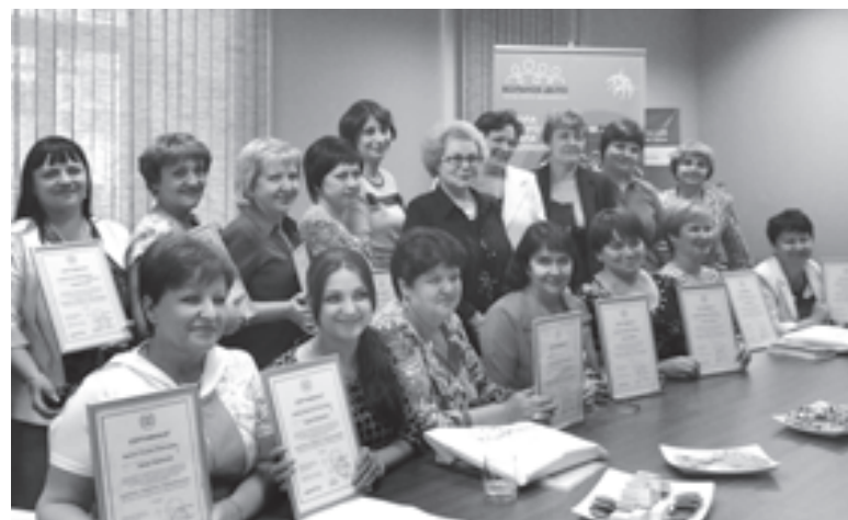
Вручение сертификатов педагогам проходило в фонде Олега ДЕРИПАСКИ «Вольное дело»