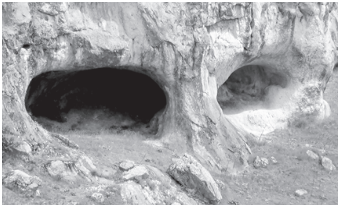
Такие гроты и ниши - находка для человека

На третий день неподалеку от таврского захоронения я увидел голу... змея, кажется, даже просматривался и изгиб тела в траве. Чуть нагнувшись и разглядел корягу, удивительно похожую на приличных размеров змею. Поднял и прихватил с собой. Коряга-змея тут же нашла свое место у входа в пещеру. Даже имя ей в духе местной топонимики как-то сразу придумалось - Аккаяна (тюркское «ак» - «белый», «кая» - «скала»). На следующий день к этому берегу моей скромной обители прибавился еще один. На подступах к вершине скального масси-