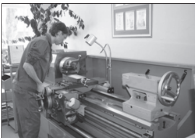
Конкурс по профессии «токарь»

эс . год. Прорвана блокада Ленинграда. Советские войска освобождают Одессу, фашисты выбиты из Севастополя. А в Липецке начинается строительство тракторного завода: победа не за горами, теперь это лишь вопрос времени, а значит, пора задуматься о том, как поднимать страну из руин, восстанавливать мирную промышленность, сельское хозяйство. Ведь еще чуть-чуть, и трактора наконец-то станут важнее танков и зениток, а рабочих потребуется больше, чем солдат. Открывается при заводе и собственный техникум - кузница будущих токарей, электриков и фрезеровщиков. С тех пор прошло - ы лет. Тракторный завод практически исчез с производственной карты России, но Липецкому машиностроительному колледжу подобная участь не грозит.