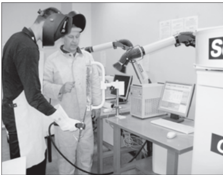
Мастер производственного обучения всегда поможет в освоении технологии

Сейчас на государственном уровне заявлено о важности подготовки в стране рабочих кадров. Ведь всем очевидно: в вузы идет чуть ли не каждый второй выпускник школы, в то время как слесарей не хватает, а сантехники на вес золота. Эту тенденцию переломить непросто, но в бывшем НПО, а нынче СПО верят, что это возможно. Как, например, в бывшем профессиональном училище, затем профлицее №5 Липецка, ныне Липецком политехническом техникуме, базовом учебном заведении ОАО «НЛМК». Его педагоги делают для этого многое: осваивают новое, высокотехнологичное оборудование и учат работать на нем молодых людей, да так, чтобы быть не хуже, а лучше заморских мастеров, что подтверждают соревнования профессионального мастерства разных уровней.