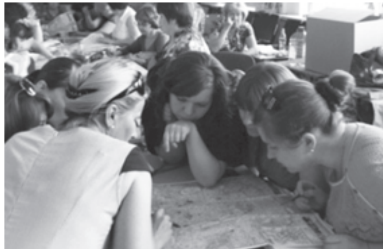
Работа в группах

Каждый детский вопрос - повод для нового исследования