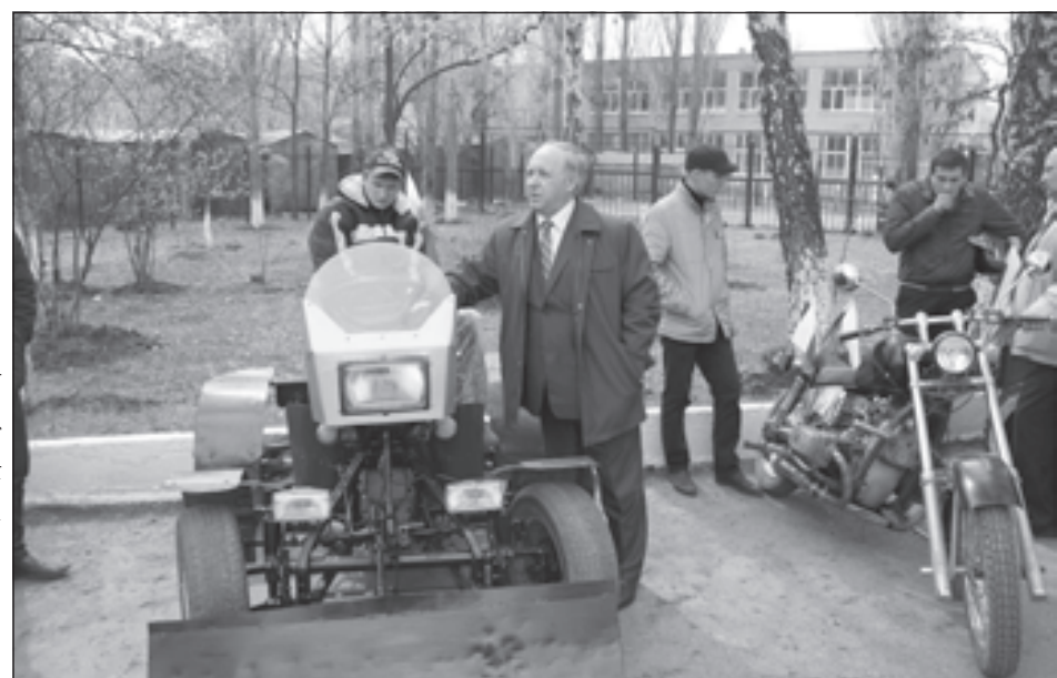
Учительская газета, №10, февраль 2011 г.

- Я сам в прошлом спортсмен, всего два года как повесил коньки, перестав играть в хоккей за ветеранов, - объясня-