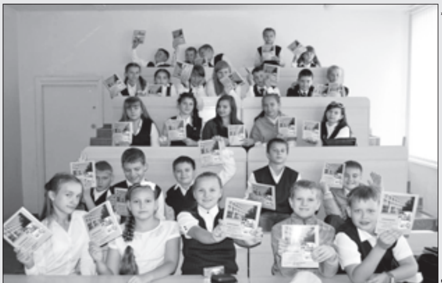
Эти дети еще не понимают, но уже чувствуют, как им повезло со школой...

- Благодаря технике, например пультам системы интерактивного опроса, ребята выполняют столько заданий, сколько сможет каждый, а я как учитель сразу вижу, кто с чем не справился, и могу подойти и помочь выйти из затруднения.