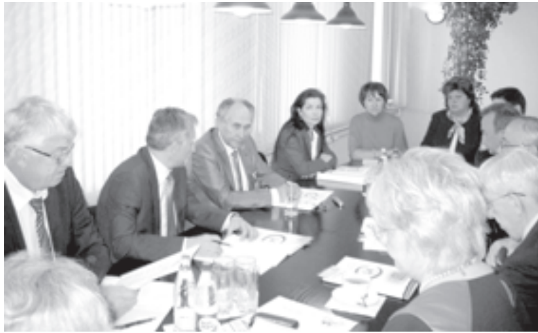
Идет заседание Общественного совета

Случаются ситуации, когда мудрые народные изречения верны с точностью до наоборот. Взять, к примеру, выражение «Хуже нет чужого совета». В образовании дельный совет решает многое, а если он исходит не от одного человека, а от целого коллектива уважаемых людей, то успех предприятия гарантирован. Согласно этой позиции в 2014 году в Ленинградской области был создан Общественный совет при комитете общего и профессионального образования Ленинградской области.