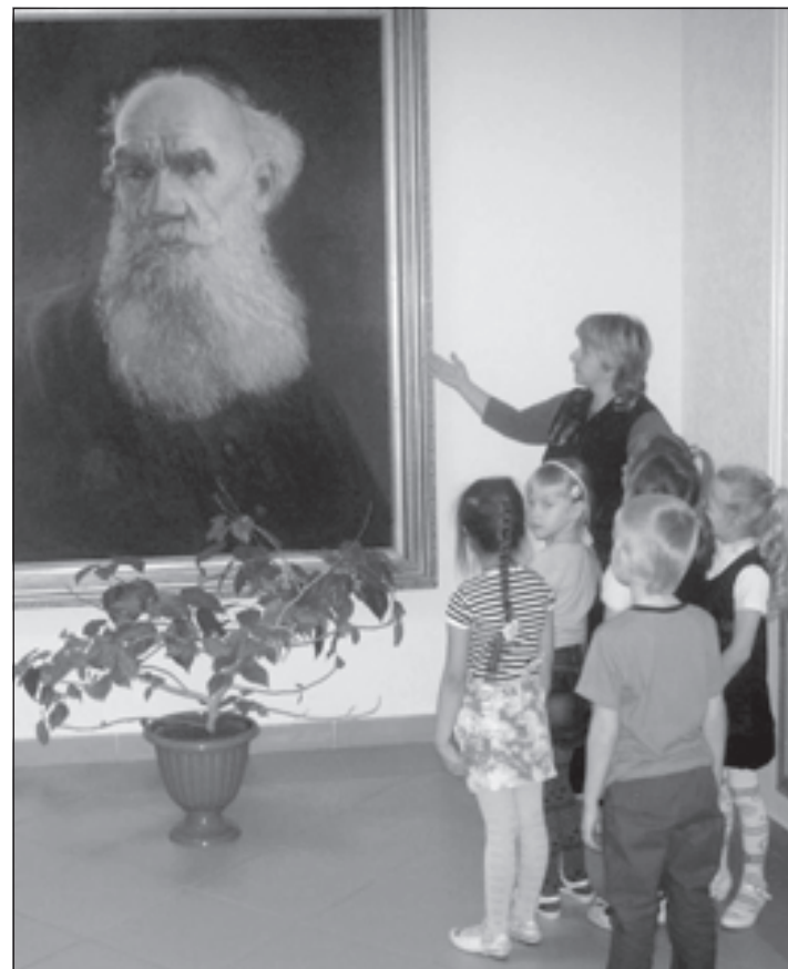
Первым делом будущим первоклассникам школы имени Толстого рассказывают о великом писателе