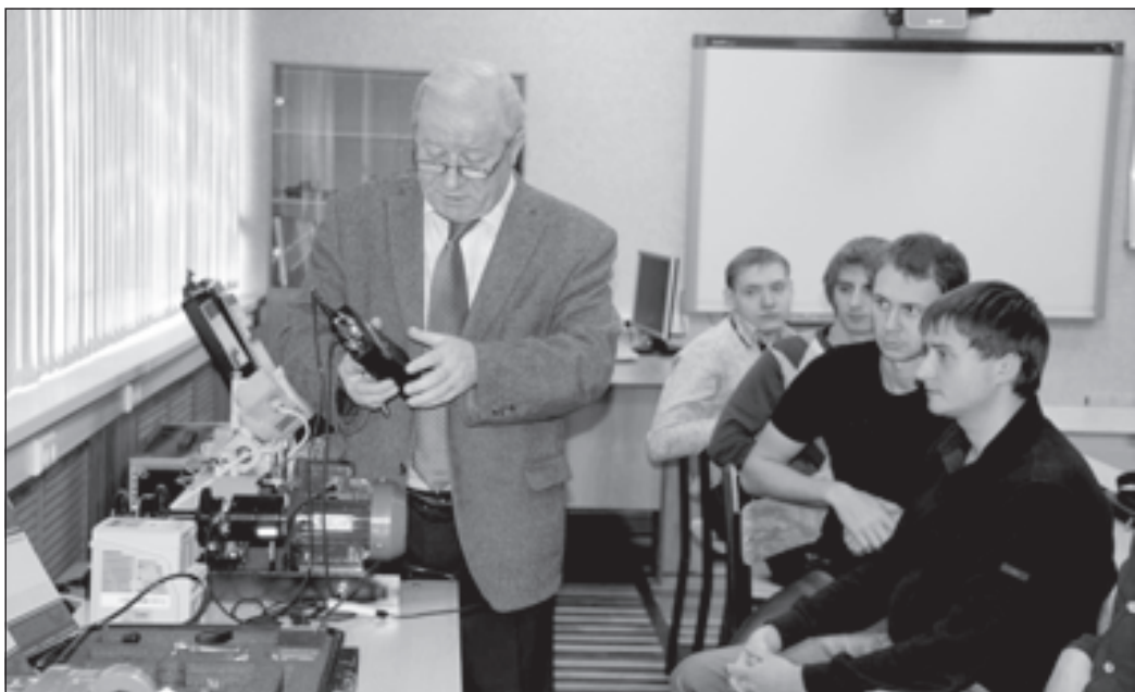
Студенты ЛГТУ учат на уникальном оборудовании.

Отношения с работодателями - это отдельный, огромный пласт работы ЛГТУ, нынешнее руководство которого смогло не только сохранить, но и развить эти связи на новом уровне. Новолипецкий металлургический комбинат, в состав которого входят десятки предприятий как в России, так и за рубежом, - стратегический партнер и основной работодатель выпускников университета. Поэтому здесь особое внимание уделяют практическим занятиям на реально действующих агрегатах предприятия, которые проходят на комбинате (кстати, НЛМК платит студентам, участвующим в этой программе дополнительного профессионального обучения, собственную стипендию). Поддерживает комбинат и одаренных студентов, еже-