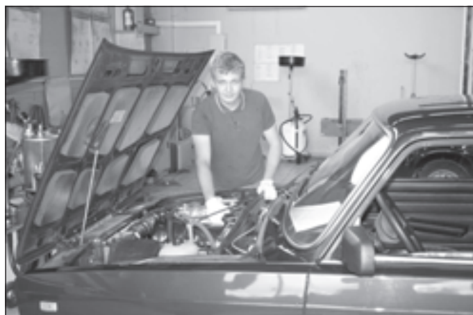
Автомеханик - это тоже доктор

кальные, танцевальные студии. Команды колледжа - неоднократные призеры и победители областных чемпионатов по легкой атлетике, волейболу, баскетболу, футболу, по гиревому спорту.