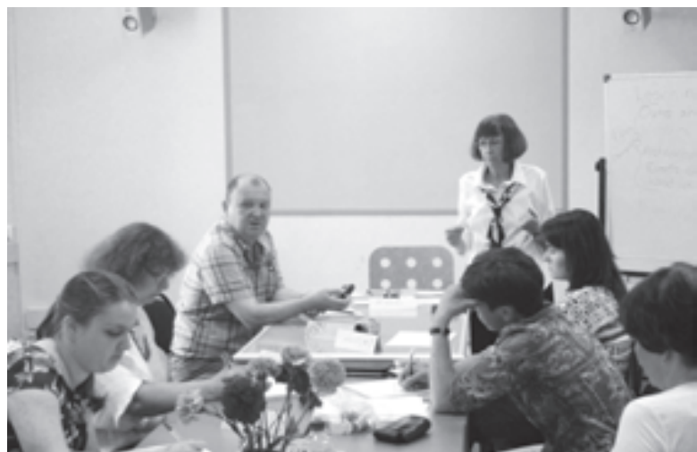
Важно обучить учителей новым технологиям