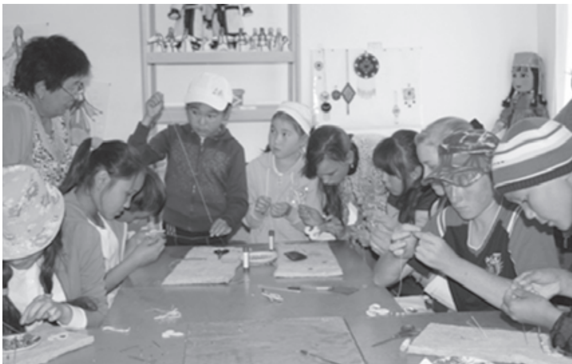
Готовим сувениры своими руками