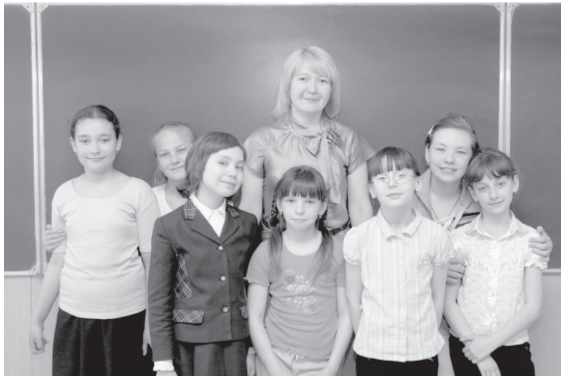
О наречиях знаем все!

Елочка, елочка, Яркие огни. Синими бусами, Елочка, звени.