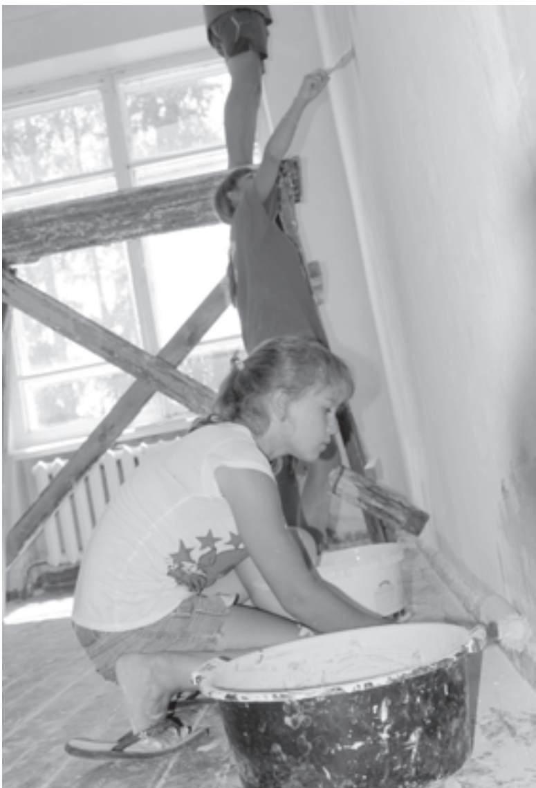
Лето - самое время для школьного ремонта

В этом году у первого агрокласса был выпускной. Эти парни и девушки - уже готовые специалисты для сельскохозяйственных предприятий, они могут открыть свое дело или продолжить образование. И они даже могут найти себя и в несельскохозяйственных профессиях. Выбор у них есть, потому что есть знания.