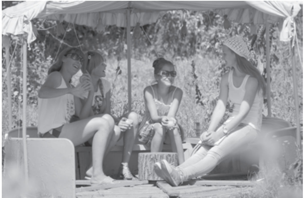
После работы можно и немножко отдохнуть

С 2011-го ученики агрокласса обучаются по агротехнологическому профилю зооветеринарного и агрономического направлений. К этому их подводят специальные программы элективных курсов «Основы агрономии», «Основы животноводства и зооветеринарии», «Агрэкология», «Техника в сельском хозяйстве», утвержденные в Институте повышения квалифика-