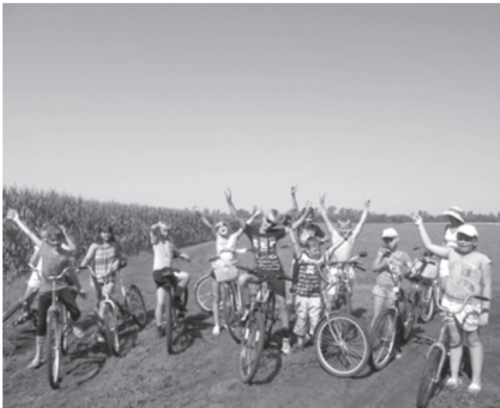
Путешествие на велосипедах нравится всем