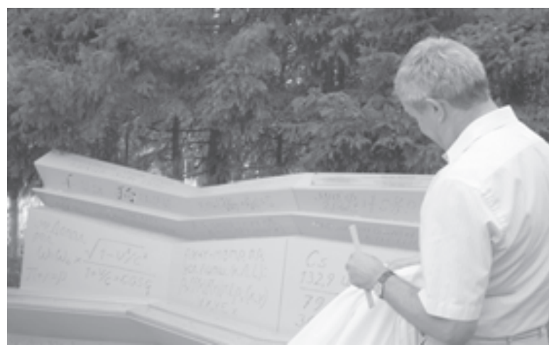
Лавочку можно читать

Необычные арт-объекты появятся по всему Академгородку. Для этого провели Всероссийский конкурс лавочек, на который было прислано более 40 концепций молодых архитекторов со всей страны. Например, возле технопарка