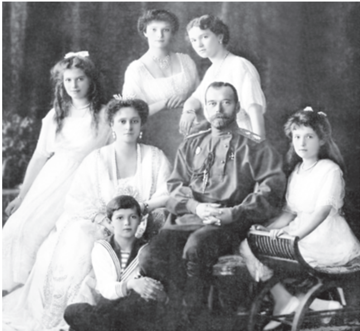
Николай II со своей семьей

В сложной международной обстановке, это понимал император Николай II, далеко не всегда возможно предотвратить войну. Он еще с 1895 г. предвидел возможность столкновения с Японией за преобладание на