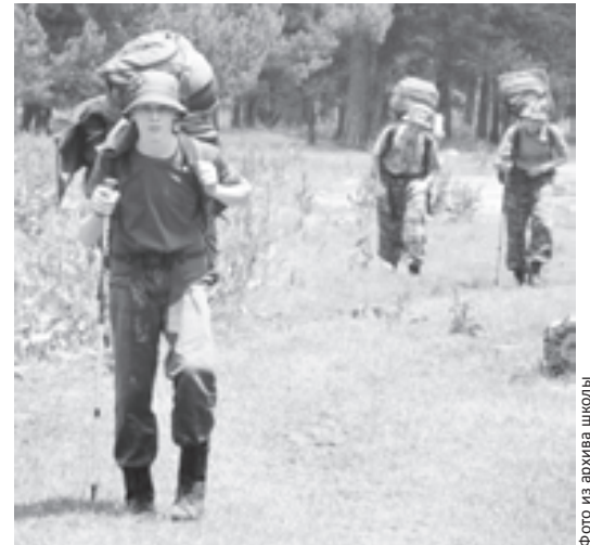
Лучше гор могут быть только горы, на которых еще не бывал

Словом, впечатлений у саранских школьников теперь хватит надолго. И хотя лето в самом разгаре, главное приключение, которое могло с ними произойти в эти каникулы, у ребят уже позади. Правда, теперь они мечтают о новых вершинах и планируют покорить высоту 5000 метров.