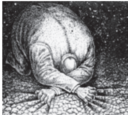
Рис. Игорь Смирнов