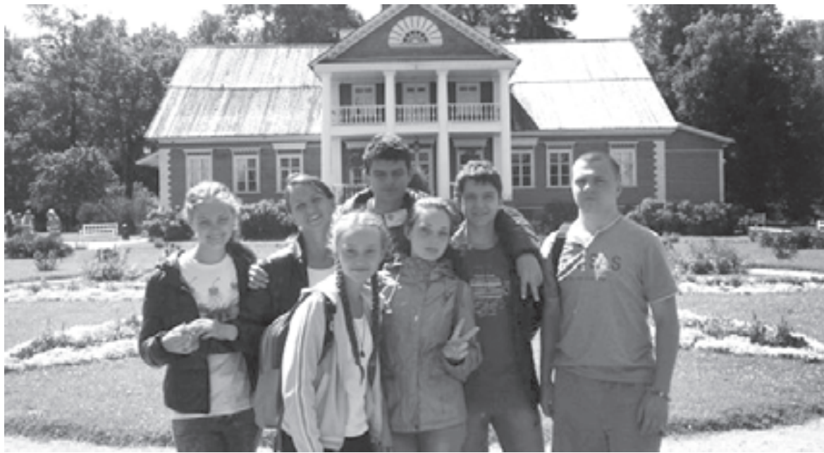
Экспедиция завершилась. Но через год снова захочется в путь