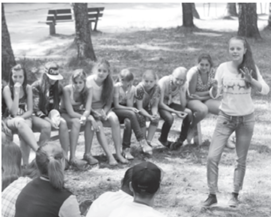
Учимся держать внимание аудитории