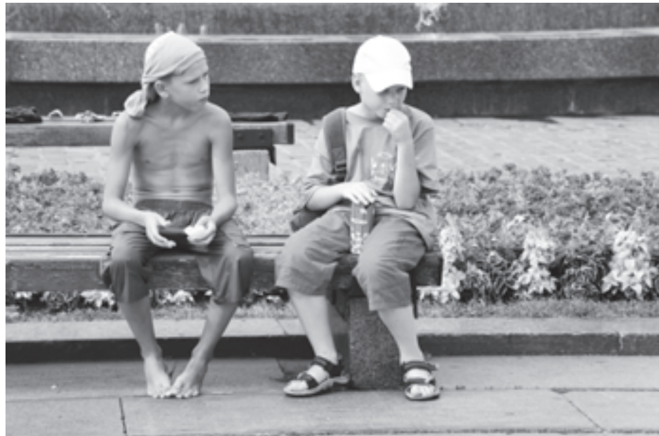
Отгораживаясь от чужой беды, мы лишь берем отсрочку на время

Мы вернулись в песочницу, но девочки, в которых внезапно проснулся материнский инстинкт, не хотели с нами расставаться. Они пришли к нам и стали помогать делать куличики, затем им захотелось поносить малышку на руках, они даже чуть не поссорились, отбирая ее друг у друга. Мне пришлось проявить смекалку, чтобы дело не дошло до слез. Вскоре одну из девочек, выглядявшую более ухоженной, позвали домой, вторая же осталась с нами. Она самозабвенно предавалась игре в дочку-матери. И мой осторожный намек, что нам надо скоро уходить, вызвал с ее стороны шквал эмоций: «Значит, я плохая? Плохая, да? Вы не хотите со мной играть?» «Да что ты такое говоришь? Ты очень хорошая!» - выдохнула я, решив терпеть до конца.