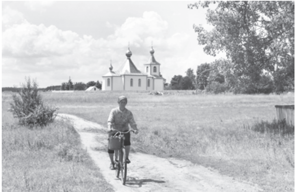
Широкие просторы родной земли