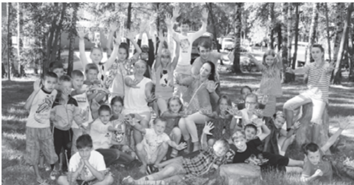
Дружная семейка. Угадайте, где здесь вожатые?

От подружек узнала, что вчера в лагере было знакомство с Италией, сегодня - с Испанией. Ведь смена называется «Веселый глобус». Каждый отряд - это своего рода туристическая фирма, которая и представляет ту или иную страну. Отличившиеся команды получают глобусы. «Нет, не настоящие, а бумажные, потом их на миры меняют», - весело рассмеялись мои собеседницы и тут же упорхнули по своим делам. Какие глобусы, что за миры в лагере с прозаическим названием?