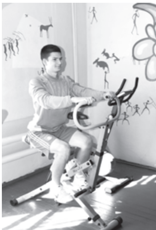
В тренажерном зале