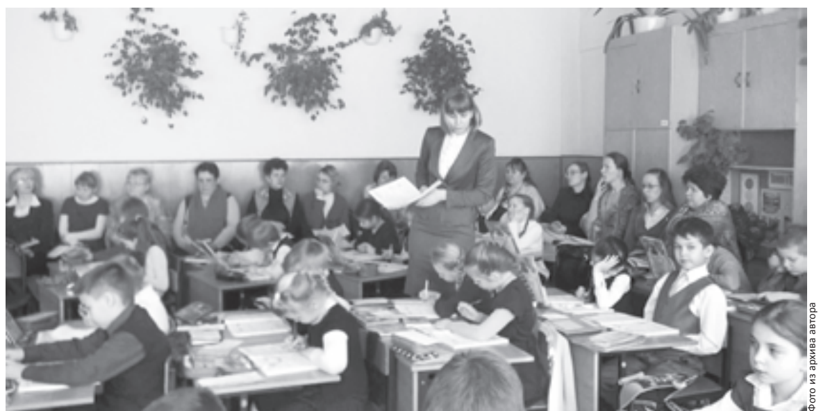
Ученики работают сами, учитель помогает