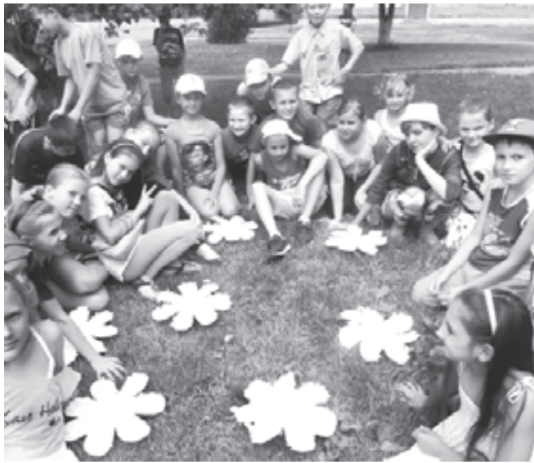
В кругу друзей скучно не бывает

танники, так и сами родители. Быстро пролетели три недели. Уходить ребята не хотели.