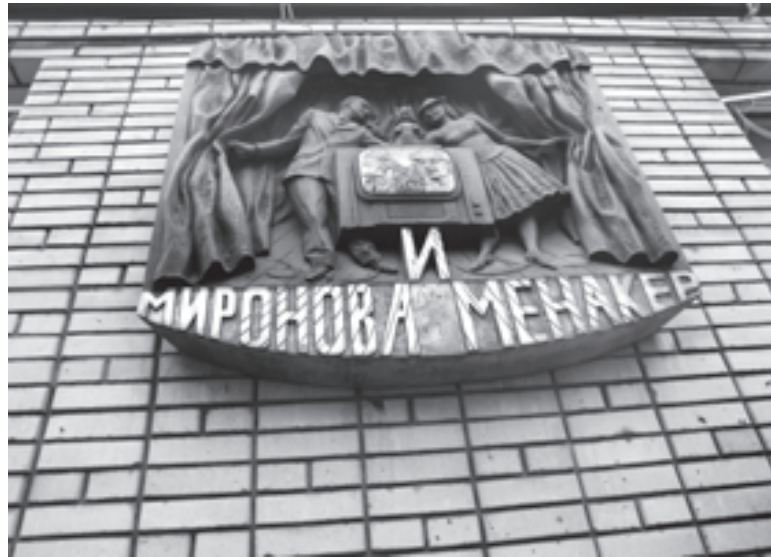
Даже мемориальная доска в музее актерской семьи Мироновых - Менакер очень необычная

- Раз пришли, значит, помните. Спасибо, что пришли!