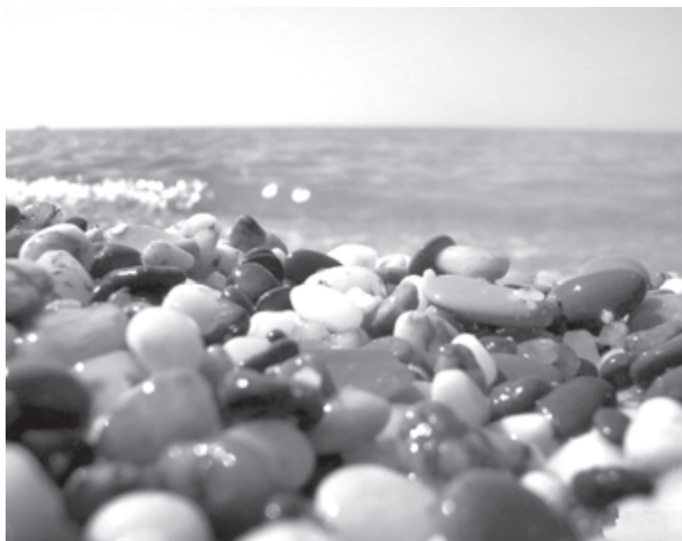
Время разбрасывать камни и время собирать...

То, что некоторые пишут о пропагандистской машине, считаю неправдой, потому что все видел собственными глазами. Люди действительно счастливы. В магазине не купит российский флажок. Я их вез из Петербурга. Крым настраивается на российскую волну, в том числе и его система образования. И в наших силах постараться помочь коллегам.