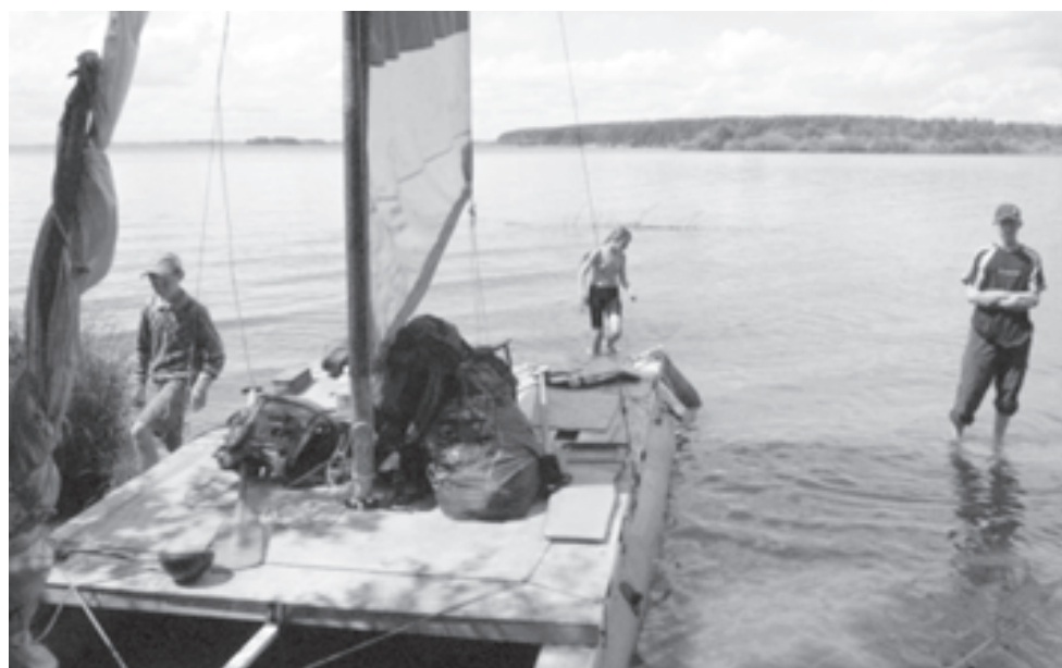
В экстремальных ситуациях любой человек взрослеет. Эти мальчишки не исключение