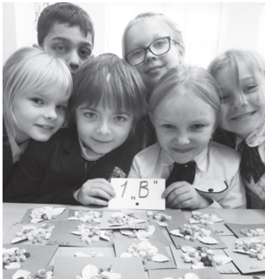
Ну чем не шедевры эти творения юных мастеров?!

...Я люблю бывать в Тарханах. Для меня Лермонтов жив, и я живу рядом с ним. Ежегодно несколько раз в году я спешу сюда, чтобы вновь встретиться с любимым поэтом.