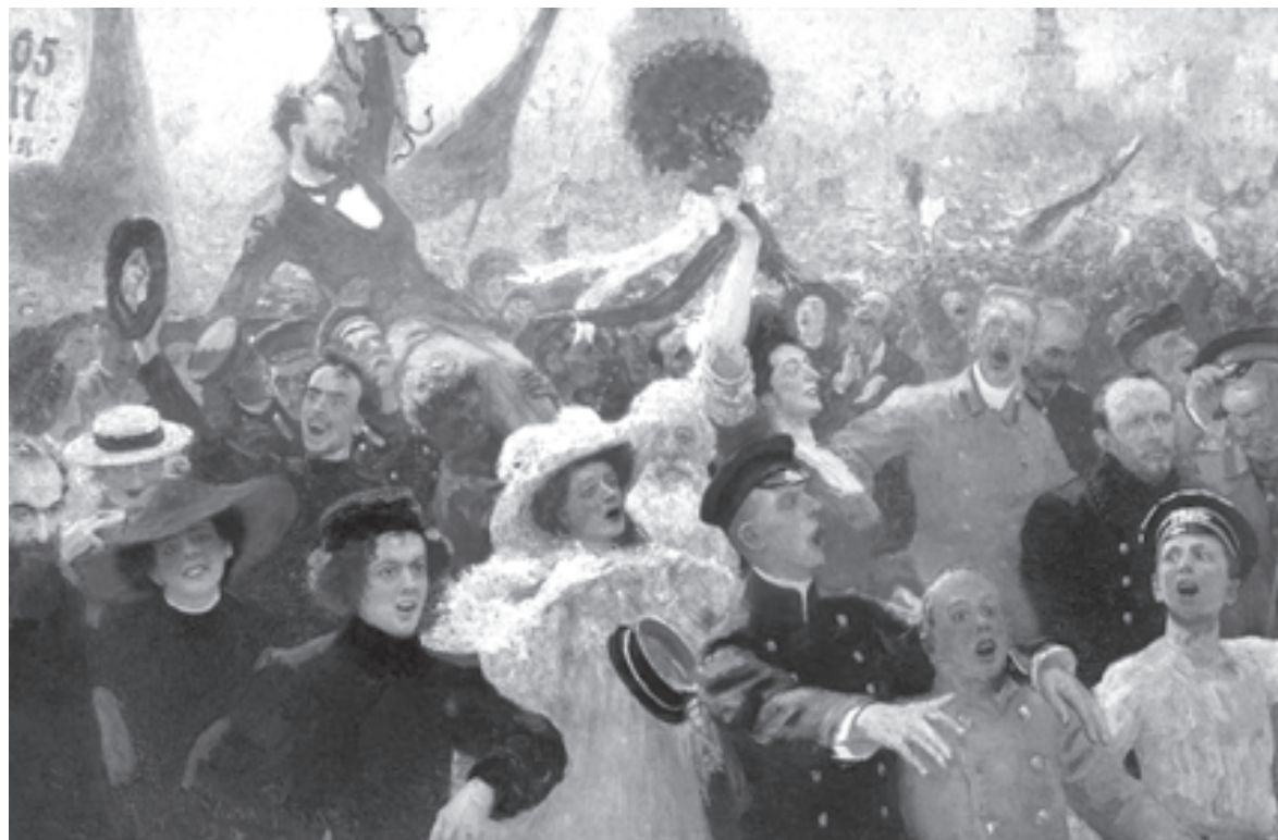
И.Е. Репин. «Манифестация 17 октября 1905 года»

Прим. ред. Презентация к занятию, приложения 1-5 опубликованы на сайте «Учительской газеты» http://www.ug.ru/method_article/806 .