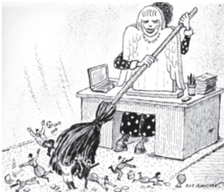
Рис. Игорь Смирнов

А каждому члену коллектива необходимо честно спросить себя: что для меня важно, на какие цели настроен. Если эти цели выше личностных амбиций, такой работник способен принять любого руководителя и превосходно выполнять свои обязанности при любой внешней обстановке. Но бывает и другое: смена