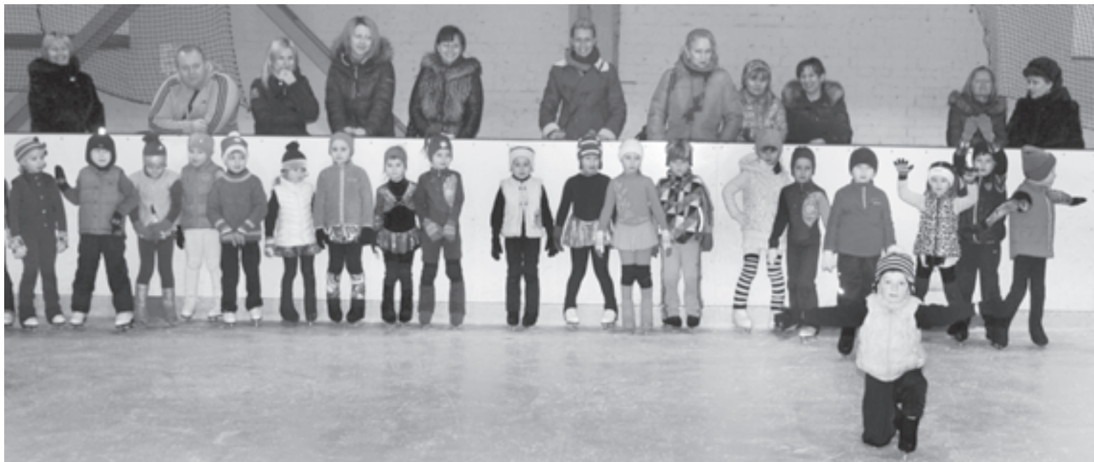
Посмотрите, как я умею!

Полюбовавшись на команду Сбербанка, уверенно дожимающую строителей вертолетов с подмосковного предприятия «Камов», я отправилась бродить по «Лужникам». Участники завершившихся только что соревнований по настольному теннису с удовольствием давали мастер-классы всем желающим, от детей до сотрудников спорткомплекса. Рядом шел шахматный турнир. Где-то наверху сборная команда мужчин играла со сборной командой женщин в волейбол - просто так, на интерес. И не было в этом никакой обязаловки, никакого официоза, а лишь истинный спортивный дух: дальше, выше, сильнее.