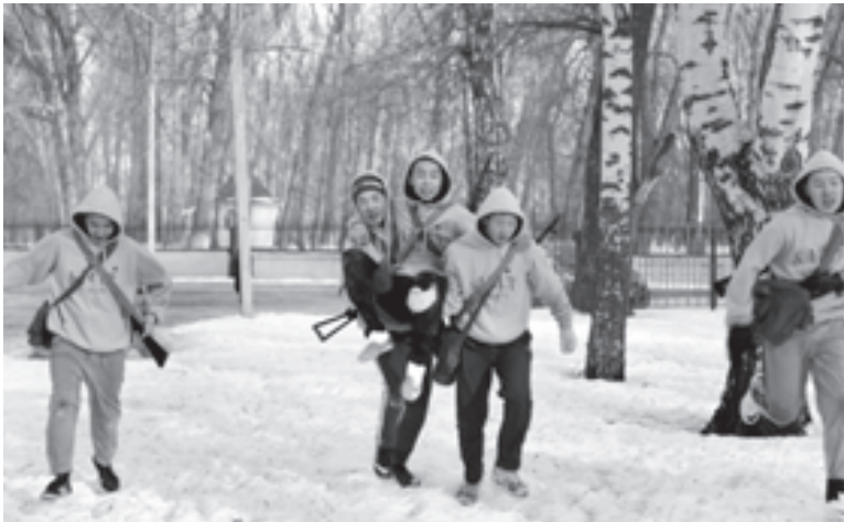
Трудный путь по «тропе разведчика»