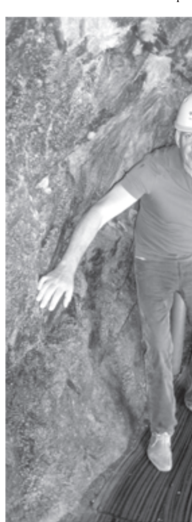
В тоннеле №3. Впереди пятиметровые бетонные перекрытия в несколько слоев. За ними - территория Северной Кореи