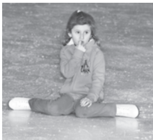
Не все получается сразу

дети заводчан. Но данными для этого обладали немногие. И он придумал театр. Теперь тот, кто сильнее, шел в школу, а те, кому не хватало «спортивного характера», становился актером. Роль находилась каждому, и каждый мог