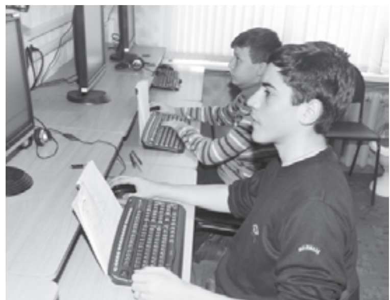
Самый лучший стиль управления - успешный

Один из древнегреческих правителей, прослышав о том, что диктатор Сиракуз успешно правит городом, послал к нему для учебы своего сына. Узнав о цели визита, диктатор предложил юноше прогуляться. Во время прогулки он не проронил ни слова, а только сбивал своим посохом все травинки, которые поднимались выше других. По возвращении во дворец диктатор заявил о том, что он все рассказал и юноша может возвратиться к отцу. Так история донесла до нас один из первых стилей руководства , применяемый порой и сегодня.