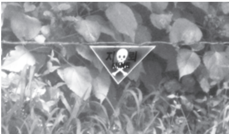
«Осторожно! Мины!» Они лежат в этой земле уже более шестидесяти лет

В автобусе группу поделили на тройки. К каждой тройке приставили сопровождающего - аспиранта университета иностранных языков. Предупредили, что мы должны вернуться в точно указанное место в точно назначенное время. Что касается пунктуальности, то корейцы в этом плане просто идеальны. Все мероприятия начинаются минута в минуту и длятся ровно столько, сколько было означено. Говорят, что даже на свадьбе никто не задерживается больше пяти минут после официального окончания, деловые ужины строго регламентированы и не превращаются в бесконечные застолья, как это часто бывает у нас, да и не только у нас, когда