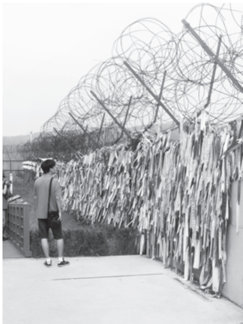
Ленточки на заборе комплекса Имчжингак, призывающие к миру и воссоединению