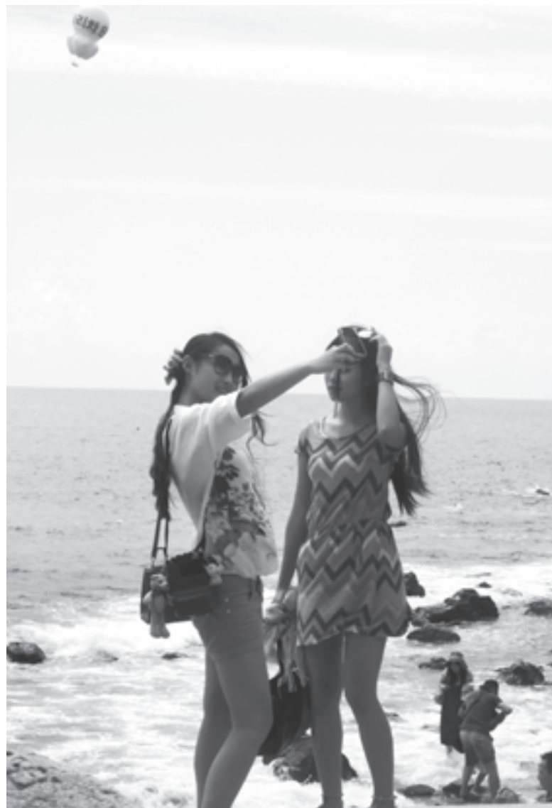
На берегу моря в Пусане. Скоро здесь откроется Международный кинофестиваль

Каждый день перед приемом пищи в монастырях произносят молитву, которая начинается словами: «Откуда взялась эта пища? Чьим трудом она оказалась передо мной? Моих добродетельных поступков недостаточно, чтобы принять эту еду, поэтому я испытываю стыд. Но, отбросив всякую жадность, я принимаю ее в качестве хорошего лекарства для поддержания моего тела, чтобы достичь просветления». На храмовой кухне есть алтарь, посвященный духу - защитнику кухни. Ему каждый день молятся. Не только послушники, но и миряне. Корейцы верят, что чован-син, так зовут этого духа, способен уберечь членов семьи от опасности. Я надеюсь, что когда-нибудь попаду в