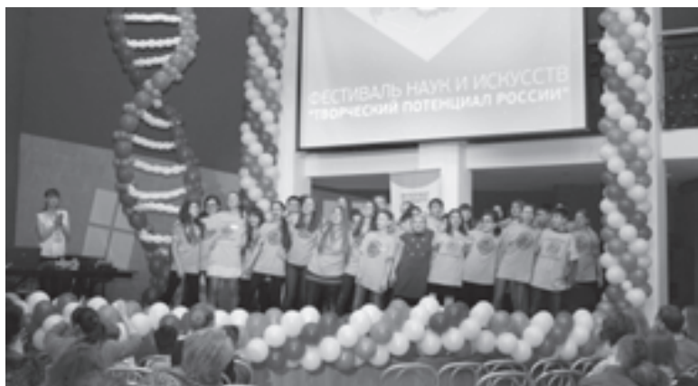
Команда-победительница из Краснообска Новосибирской области принимает поздравления

Впрочем, на фестивале было место не только науке, но и культуре. Под скрипичные мелодии Кристофа Глюка, под зажигательные южные ритмы и шелест испанских юбок, в этой пестрой гамме эмоций, сотворенной талантливыми школьниками для концертной программы закрытия фестиваля, здесь провожали зиму.