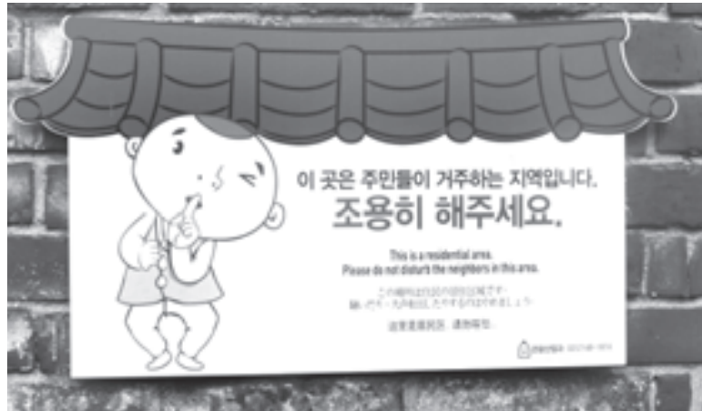
Надписи на стенах домов в сеульском районе Пукчхон: «Здесь живут люди. Пожалуйста, не тревожьте их!»