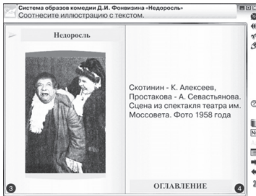
Рис. 2. Иллюстрация к комедии Д.И.Фонвизина «Недоросль»

Естественно, выполнять все три задания необязательно. Учитель может выбрать