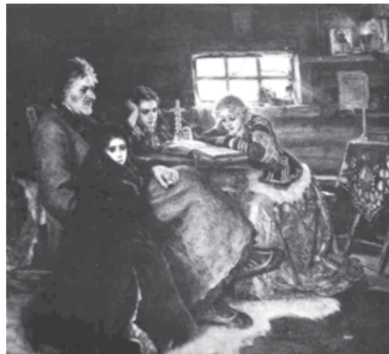
Василий Суриков. Меншиков в Березове

Очевидно, что подавление и отрицание негативных эмоций ведет к проблемам со здоровьем, непос-