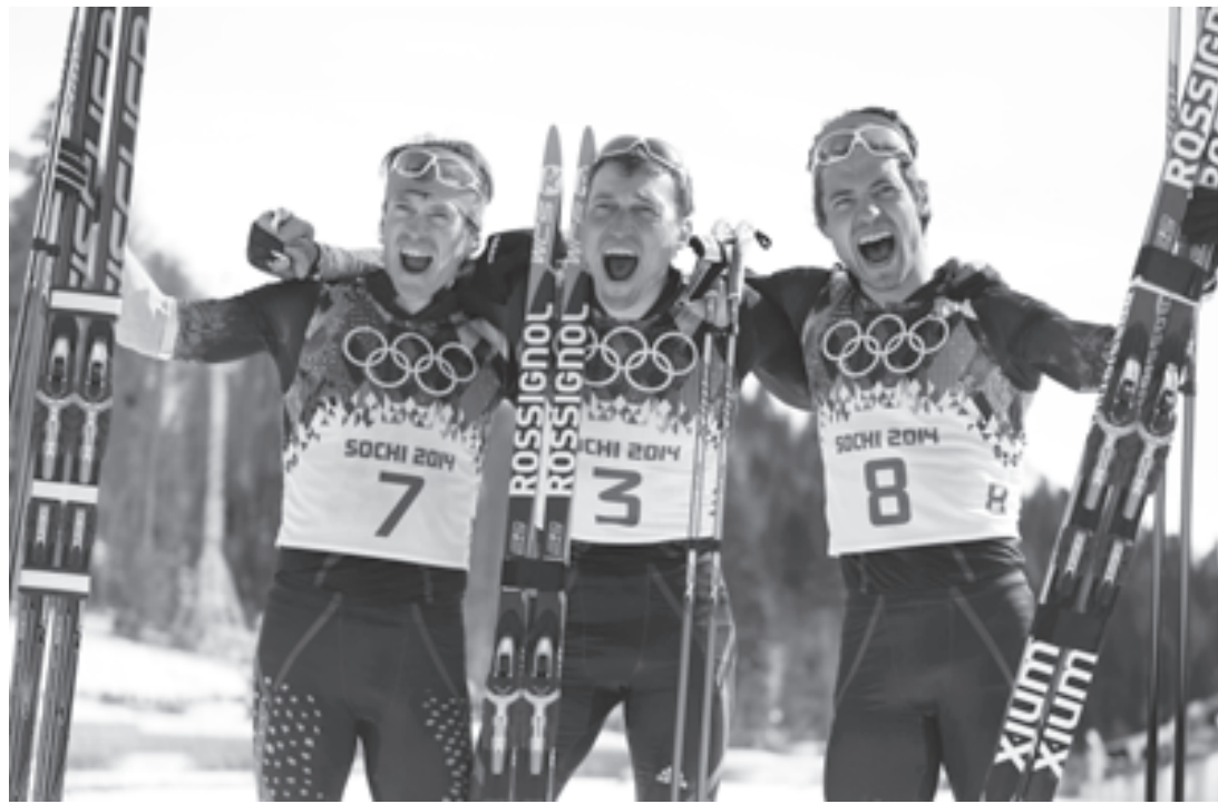
Максим ВЫЛЕГЖАНИН, Александр ЛЕГКОВ, Илья ЧЕРНОУСОВ - победители олимпийской лыжной гонки на 50 километров

На XXII зимних Олимпийских играх в Сочи Россия оправдала знаменитую поговорку «русские долго запрягают, да быстро ездят». Вся страна, а также около 3 миллиардов зрителей по всему миру следили за ходом неофициального, но на деле главного соревнования Олимпиады - распределения мест в общем медальном зачете. 17 дней нервоотрепки, и только к самому финалу Игр мы вырвались на заветное первое место. Кто бы что ни говорил, а продемонстрировать свою «крутизну» и политический вес (а большой спорт по-прежнему один из важнейших элементов имиджа государств) хотят все страны. России это важно, как никогда, особенно в свете рекордных потраченных на Олимпиаду средств, и наши спортсмены это понимали. И ведь не подвели!