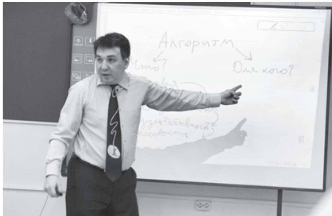
Есть слова, которые и во тьме светят

книги, статьи, блоги, смотришь фильмы и ток-шоу, путешествуешь по разным школам, общаешься с коллегами и зачастую встречаешь боязнь, неуверенность, пустую озабоченность.