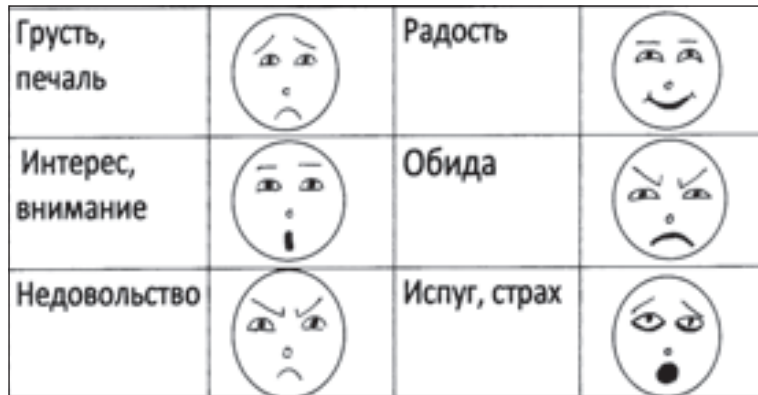
Примеры пиктограмм, обозначающих эмоции

Закройте глаза, представьте льва - царя зверей, сильного, могучего, уверенного, в себе, спокойно и мудро. Он красив и выдержан, горд и свободен. Этого льва