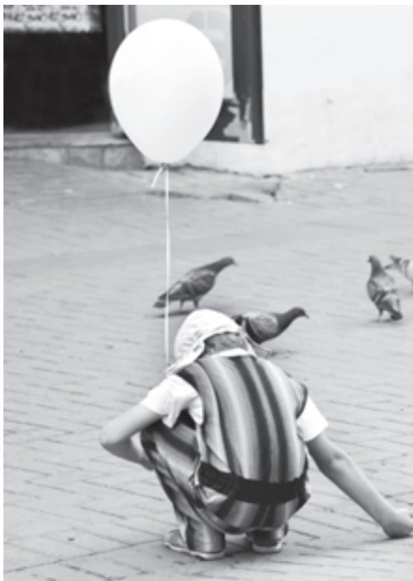
Как это важно - вовремя поддержать, выслушать ребенка