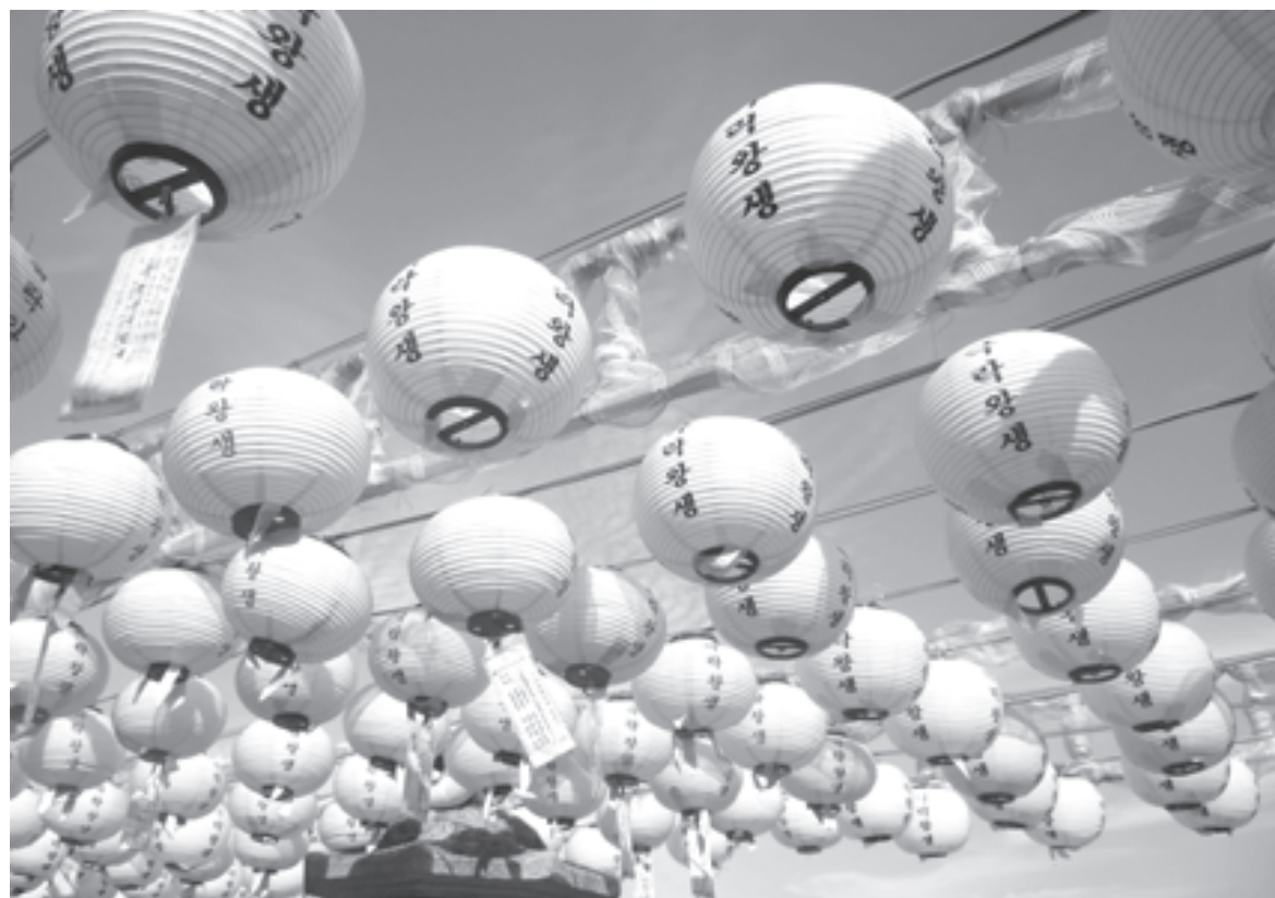
Буддийские фонарики с надписью «Достойный уход в вечность»

...Конфуций писал: «Знать что-то не то же самое, что любить что-то. Любить что-то не то же самое, что получать удовольствие от чего-то». Конечно, традиционную культуру надо знать, понимать, сохранять. Но важнее всего, чтобы она стала частью повседневной жизни и приносила удовольствие. Только тогда она останется живой.