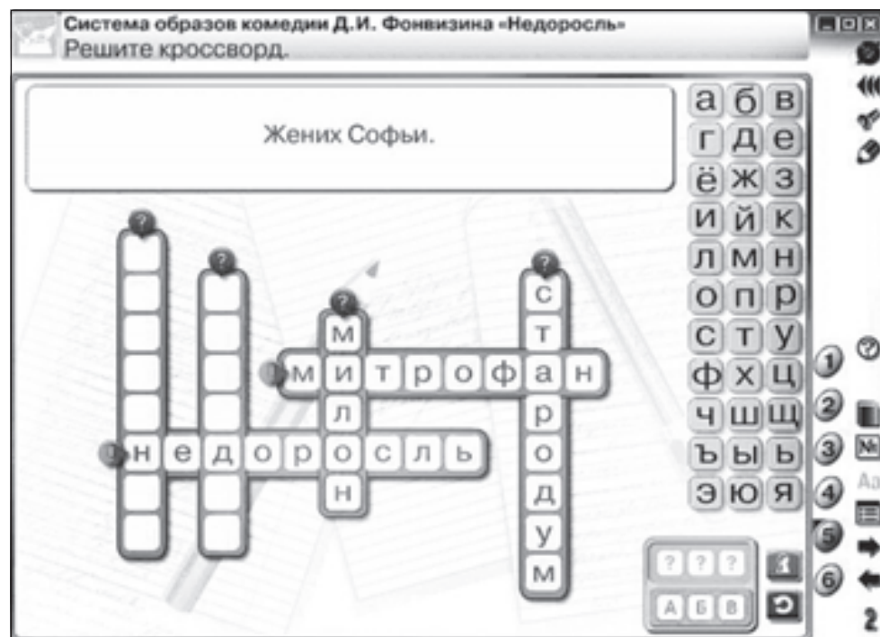
Рис. 1. Кроссворд

Подведем итог. Пособие по литературе «Наглядная школа» реализует требования ФГОС по организации деятельностного подхода в обучении. Система заданий, способы представления теоретического материала, мультимедийные возможности пособия позволяют организовать разнообразные виды учебной деятельности по освоению текстов