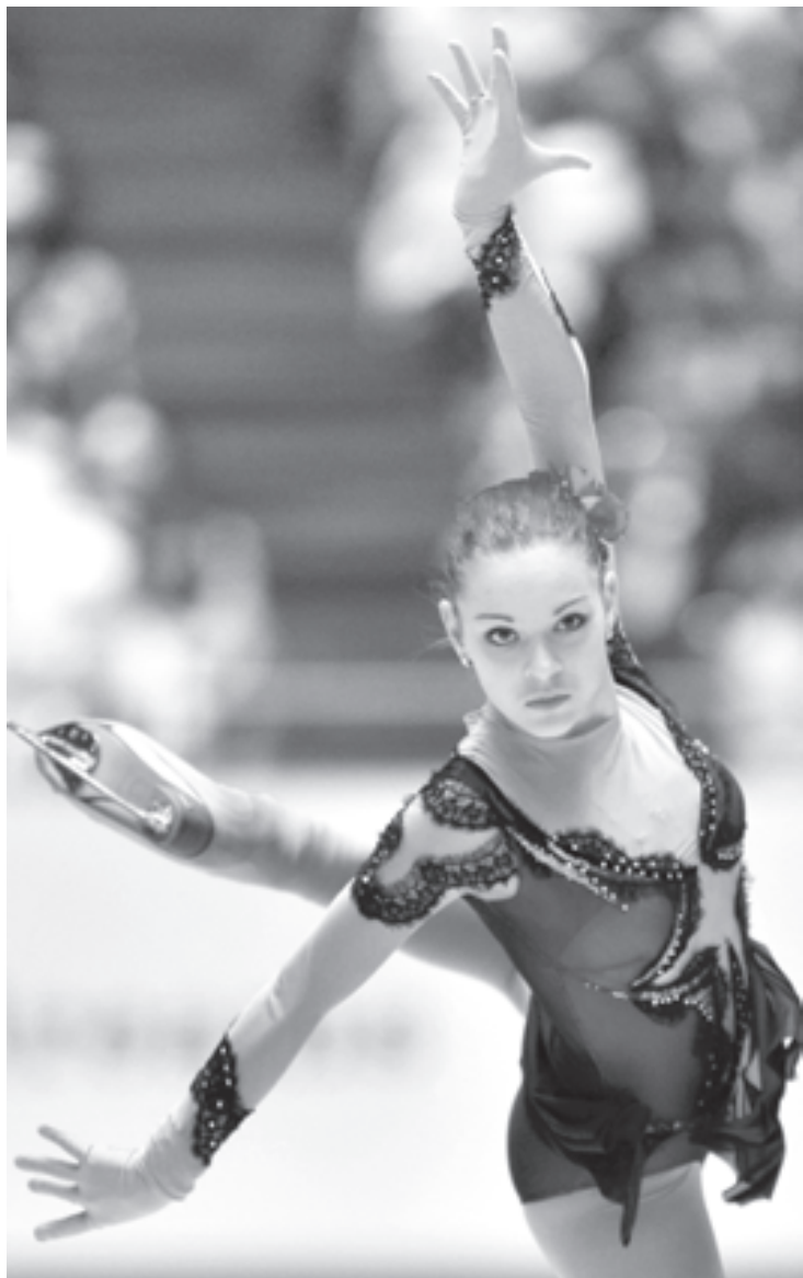
Олимпийская чемпионка Аделина Сотникова

Скандалы забудутся. В истории останутся фигуристы, бобслеисты, лыжники и другие герои XXII зимних Игр в Сочи