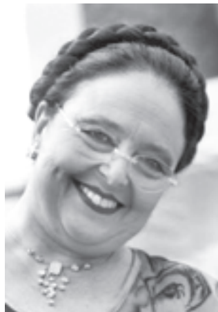
Е.И.В. великая княгиня Мария Владимировна

И когда речь идет о конкретных персоналиях, желательнее показывать их не просто бездушными вершителями судеб, а живыми людьми, с их чувствами, возвышенными стремлениями, переживаниями, остроумием, привычками, слабостями. Чем человечнее будет образ, тем он интереснее, и тем интереснее все, что связано с его эпохой.