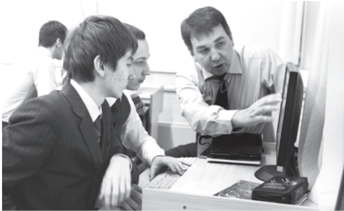
Есть ли жизнь в школе? Каждое утро учитель задает себе этот вопрос

Ключевые слова помогают находить выход из проблемных ситуаций на уроке и сводят к минимуму репродуктивную деятельность. Построение ментальной карты на уроке позволяет ребятам делать самостоятельные выводы из теоретического материала, уточнять