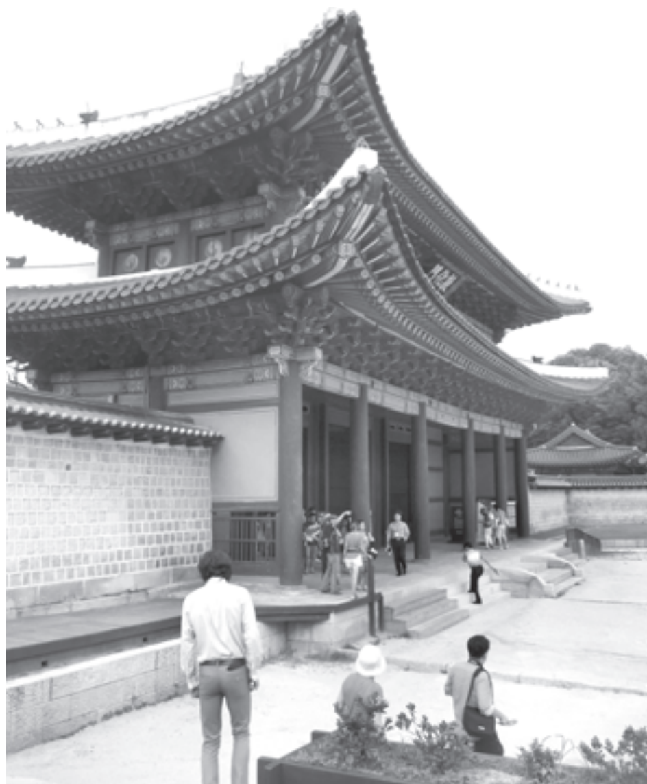
Чхандоккун - единственный дворец, сохранивший архитектурный стиль династии Чосон. Пройдя ворота Донхвамун, попадете на самый старый каменный мост столицы Гымчонгё (1411 г.)

Тток, или Еда, приправленная солнечным светом