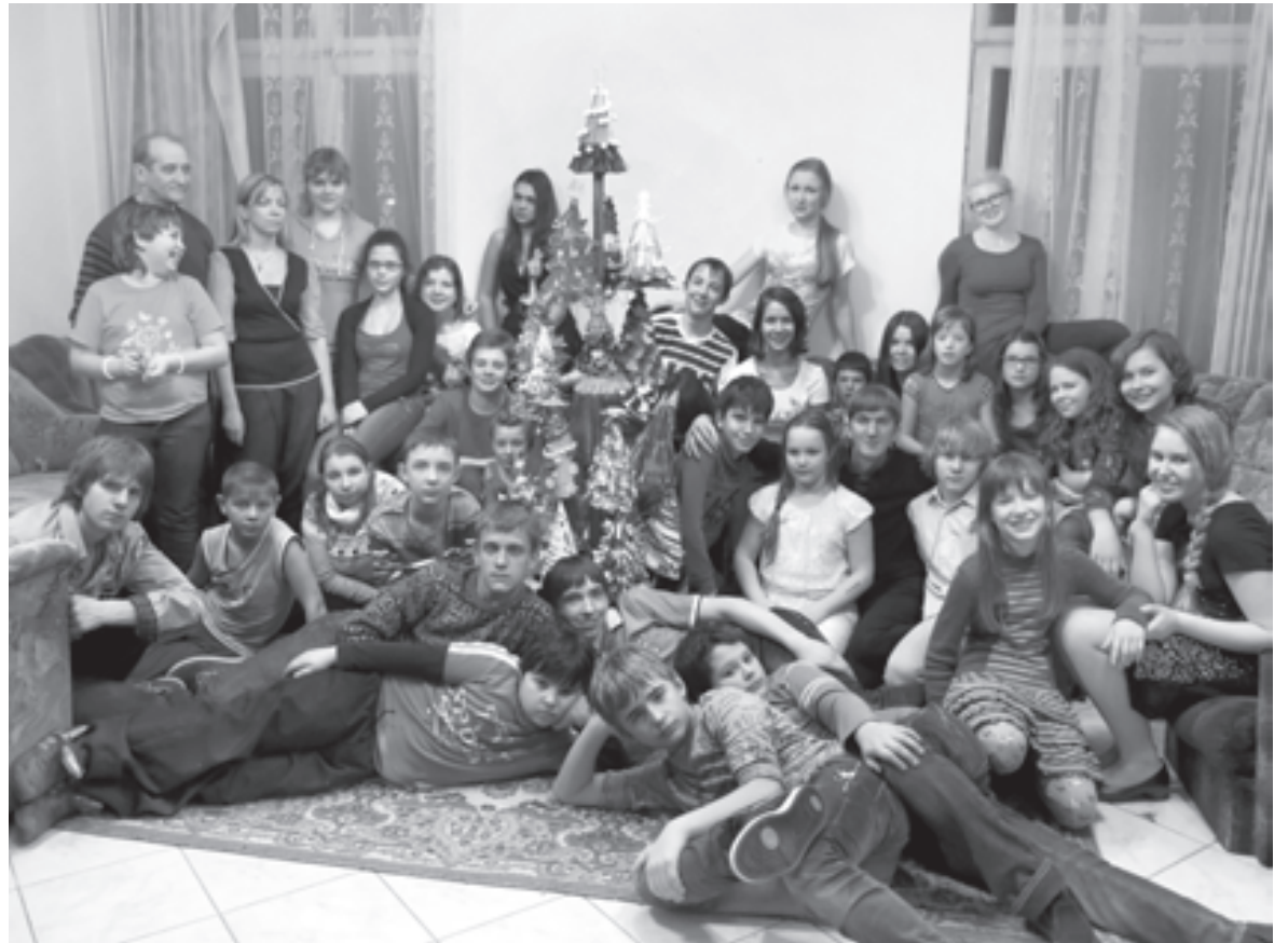
Здесь ребята дружат и плачутся, превращаясь в одну семью

Творчество - изобразительное искусство, архитектурно-конструкторское бюро (макетирование,