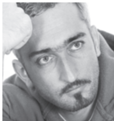
«Эспаньолка» придает мужчине изысканность и загадочность

● Круглолицые будут выглядеть мужественнее с «эспаньолкой» - небольшой бородкой, обрамляющей с усами замкнутый квад-