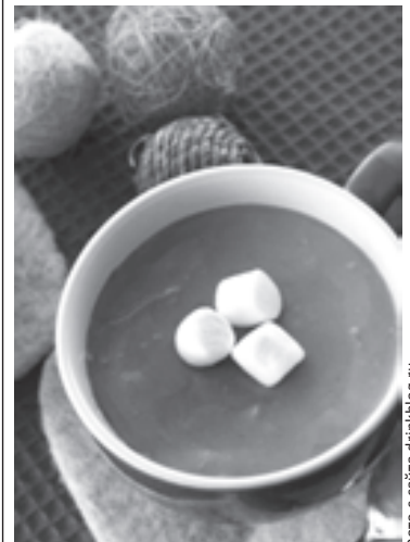
От головной боли спасет какао

● Хмурое утро лучше всего начать чашкой какао. Но не порошкового, а настоящего, крепко заваренного: 3-4 чайные ложки на стакан кипятка. Это идеальное сочетание невозможно горького вкуса, антиоксидантов, магния (помогает сердцу) и теобромину (безопасный аналог кофеина). Напиток стремительно ставит на ноги и сводит на нет действие все тех же продуктов распада алкоголя.