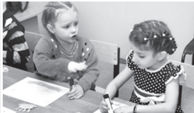
«Город добрых сердец» научил ребят новому и интересному

В Казани эту проблему пытаются решить уже к 1 сентября. В городе в этом году появится 4380 новых мест в детских садах.