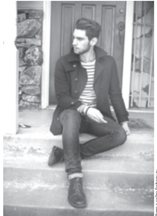
С мужчиной в бушлате можно хоть в кино, хоть под венец

Однотонные или в клетку длинные шарфы, длинные узкие черные галстуки. Вместительные «сумки почтальона».