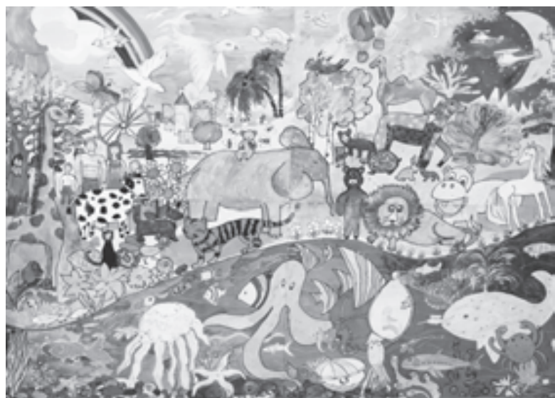
Созданный детьми мир получился населенным

«Учительская газета» регулярно освещает деятельность реабилитационного лагеря. Читайте материалы Наталии Богдановой в №44 от 28 октября 2008 года, №8 от 24 февраля 2009 года, №34 от 25 августа 2009 года, №34 от 24 августа 2010 года, №34 от 23 августа 2011 года.