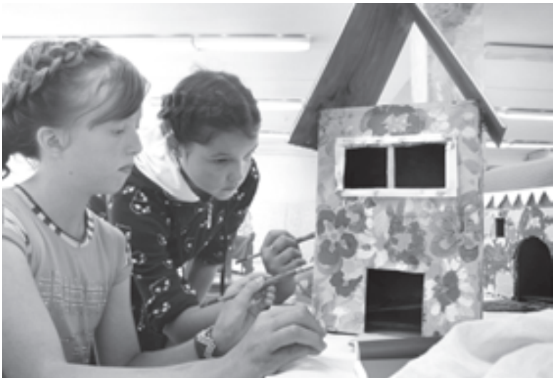
Строим город мечты