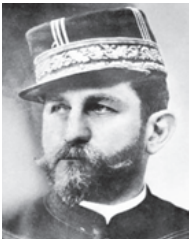
Клиновидная «буланже» названа в честь французского генерала Жоржа Буланже

Петр Первый, наверное, расстроился бы. Столько сил потратил, чтобы гладко выбрить русского человека, а она, борода эта живучая, возьми да снова вырасти. Одним лишь царя-реформатора можно успокоить: мода на бороду - явление столь же яркое, сколь и быстротечное. Сегодня на лицах окружающих нас мужчин мы наблюдаем по крайней мере третье за последние тридцать лет пришествие бороды. Отличие от предыдущих «визитов» - в разнообразии форм и «фасонов».