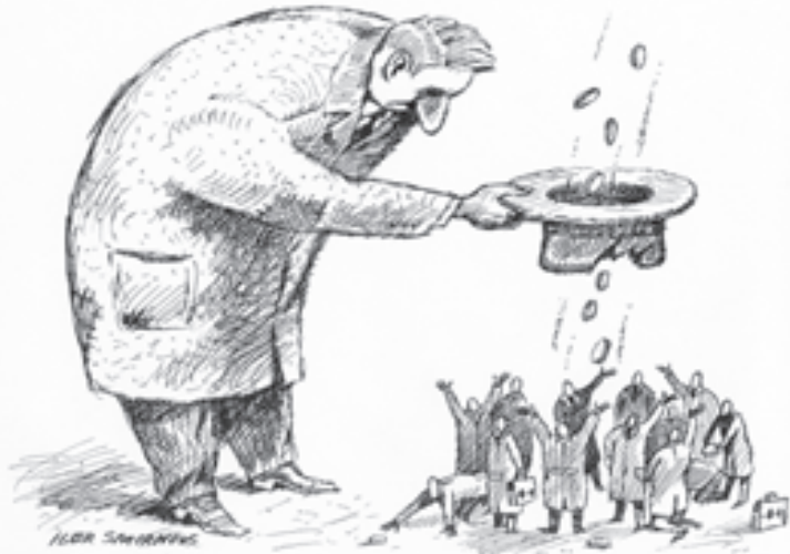
Рис. Игоря Смирнова

Но, с другой стороны, не все определяется и определяется деньгами. Например, в дошкольное учреждение №438 поступают дети с ограниченными возможностями. Муниципальное задание садика - 80 человек, из них 26 - инвалиды. Коллектив был сформирован 35 лет назад, он естественным образом обновлялся, но костяк сохранялся. И никакие внешние изменения - общественные, социальные, экономические - не оказывали заметного влияния на внутреннюю ситуацию в этом детском саду. Сюда пришли люди заинтересованные, готовые работать со сложными детьми и умеющие это делать, специалисты не только с педагогическим, но и психологическим, некоторые с медицинским образованием, с определенным складом души. Работа в дошкольных учреждениях всегда предполагает особый характер.