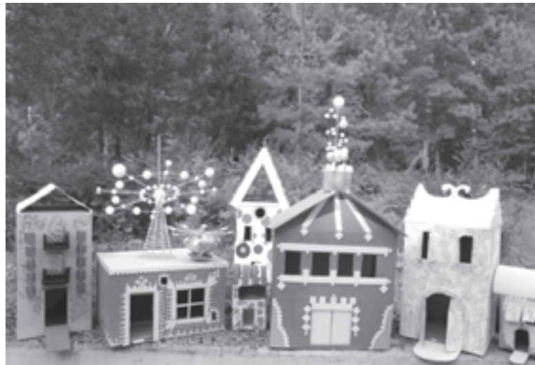
Получилось как в сказке!