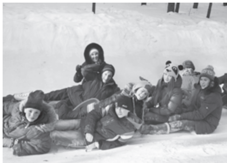
А на морозе жарко! Девятиклассники на горке

Самые яркие, активные, интеллектуальные и позитивные дети