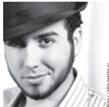
Молодежная Chin Curtain украшает только самую нижнюю часть лица

Отрастить бороду - это полдела. Важно придать ей правильную форму и опрятный вид, а также соблюдать все правила гигиены, ведь у бактерий появился еще