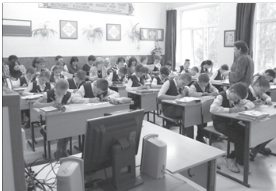
Учителя Отраденского округа активно используют на своих уроках инновации

Ведь ярмарка - это место встречи самых талантливых и перспективных специалистов образования. Здесь педагоги могут поделиться опытом, наработанным за многие годы своей деятельности, предложить свои креативные и умные разработки. Ярмарка вызывает желание созидать, искать, творить.