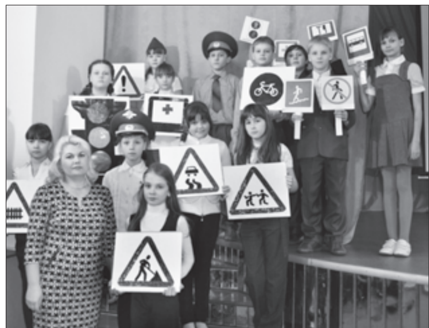
Изучаем правила дорожного движения

внеурочной деятельности детей. Активно действуют школьные СМИ - телестудия «Зеркало» и газета «Гоша», созданы клуб социальных проектов «Гражданин» и клуб «Живое право», отряд ЮИДД, студии изобразительного, вокального и хореографического мастерства. С 2003 года в школе работает Санкт-Петербургский профильный класс. Сегодня средняя школа №2 - научно-методический центр сопровождения учителей начальной школы по работе с учебно-методическим комплектом «Перспективная начальная школа», а также по новому курсу ОРКСЭ.