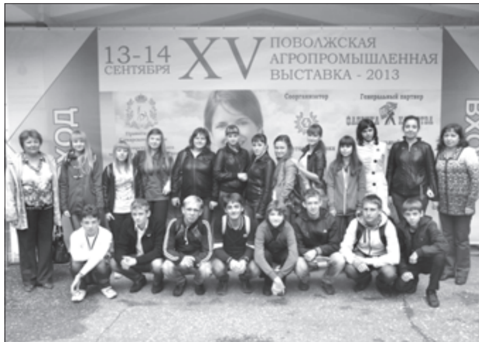
В Отраденском округе регулярно проходят различные выставки семинары и конференции

Опыт Отраденского округа привлекателен и для педагогов из других территорий. Здесь любят и умеют принимать гостей, приезжающих по обмену опытом. В то же время отраденские педагоги и руководители образовательных учреждений очень часто выезжают в образовательные туры по России и за рубеж, активно участвуют в различных семинарах, конференциях и конкурсах всероссийского масштаба. Сегодня мы публикуем мнение об инновационной работе округа как самих отраденцев, так и тех, кто сюда неоднократно приезжал, чтобы ознакомиться с уникальным опытом.