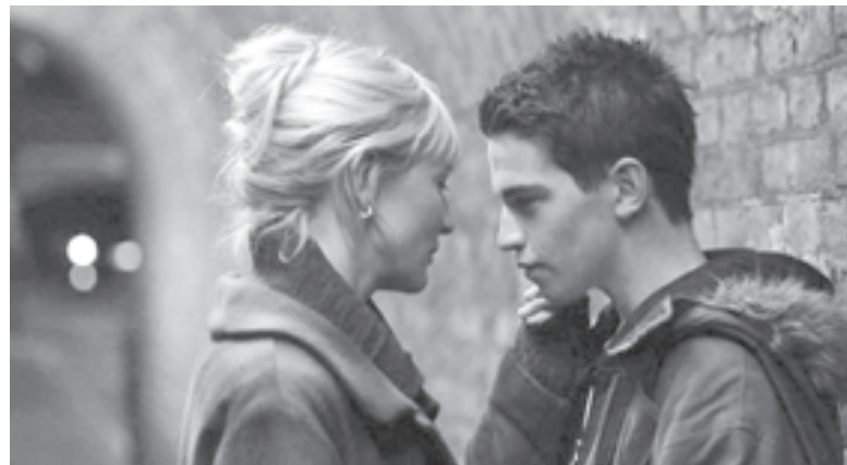
Любовь к детям - это не всегда хорошо. Кадр из фильма «Скандалный дневник»

новый оправдательный приговор. Каждому преступлению нынче полагаются не столько наказание, сколько объяснение и оправдание. И Шеба с Барбарой не исключение. С тотальным одиночеством мисс Коветт все ясно. Мало того что она, так уж случилось, не исповедует традиционные семейные ценности и вынуждена это тщательно скрывать, так еще и прозябает в заведении, где «результаты экзаменов стабильные вот уже 30 лет: ниже среднего национального уровня, но немного выше катастрофического». Но кто мешает ей все изменить, ведь каждый сам кузнец... и дальше по списку жизнеутверждающих афоризмов. Да-да, все так, но мы же не будем переписывать сценарий. Или вот Шеба. Талантливый, по всей видимости, художник, она не слишком счастлива в браке и материнстве: дочь - трудный подросток, сын, как это теперь принято говорить, с особыми потребностями. Разве о такой судьбе она мечтала? И на это можно возразить: многие несчастны в браке, но не все ищут утешения в объятиях пятнадцатилетних подростков. «Твой парень моложе моего!» - истошно кричит Шебе дочь. «Если тебе так уж хотелось мне изменить - изменяла бы, но со взрослым мужчиной!» - вторит дочери отец. Отчего-то всех вокруг беспокоит не сам факт обмана, не