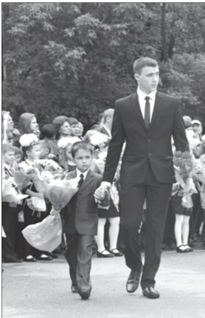
У первоклассников долгое путешествие в Страну знаний только на чинается

Если посмотреть достижения учащихся гимназии только за прошлый учебный год, то это уже впечатляет: 57 призеров всероссийских молодежных предметных чемпионатов, 18 призеров окружного этапа Всероссийской предметной олимпиады школьников, 18 призеров окружного фестиваля