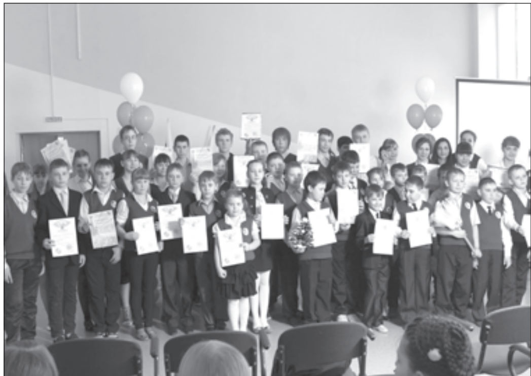
Ребята с удовольствием занимаются исследовательской работой

В рамках семинара по модульному обучению прошел фестиваль уроков.