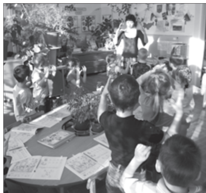
Школьные классы утопают в зелени