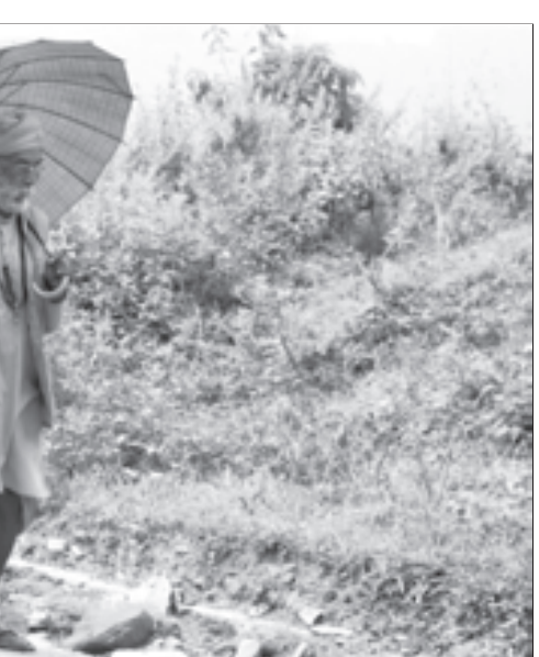
В дальний путь отправляйся налегке

этические нормы, которые бы позволяли в любой ситуации сохранять данные природой изначальные энергию и силу, внутреннюю гармонию. Очень часто это достигалось с помощью простоты, которая при любой ситуации позволяла выходить победителем, оставаться на коне. Стойки, например, учили, что человек обретет счастье не через накопленное богатство, а через простоту и добродетель. Эпикур считал, что только самосовершенствование даст спокойствие, а активная деятельность порождает сложности и проблемы. «Живи незаметно, - говорил он. - Кому не довольно малого, тому всего мало». Киники даже призывали к нищенству, под-