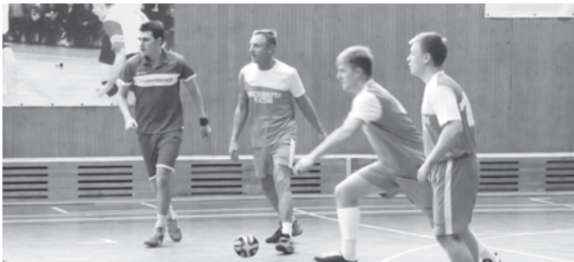
Футбольную команду возглавил Дмитрий ЛИВАНОВ

Еще на подходе к спортивному комплексу были расклеены афиши: каждому болельщику - «пять» в зачетку по физкультуре, поэтому трибуны были заполнены под завязку. Но студенты абсолютно искренне болели за своих. На стороне министерства был авторитет (все-таки команду возглавлял сам министр), на стороне студентов - молодость. За считанные мгновения до финального свистка табло показывало 3:2 в пользу Минобрнауки. Однако студенты все-таки забили решающий гол. Финальный счет 3:3, кажется, устроил всех.