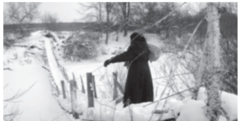
Кадр из фильма «Рясный хлеб». Режиссер Алексей ФИЛЬКОВ. Оператор Андрей ИОСИФОВ

На этапе подготовки режиссерским решением было снят в избе,