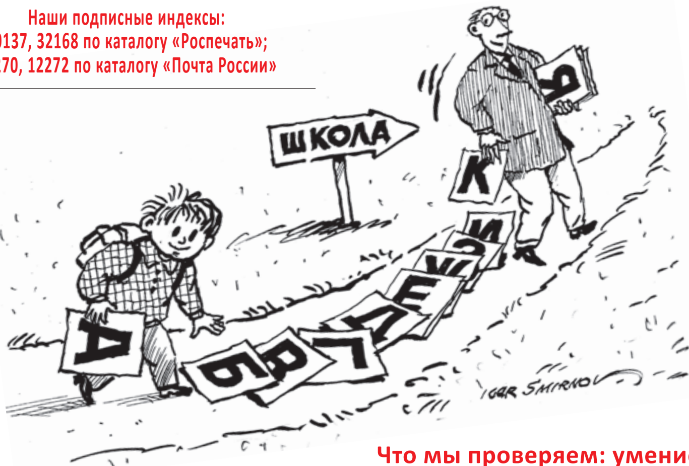
Рис. Игорь Смирнов

Наши подписные индексы: 50137, 32168 по каталогу «Роспечать»; 12270, 12272 по каталогу «Почта России»