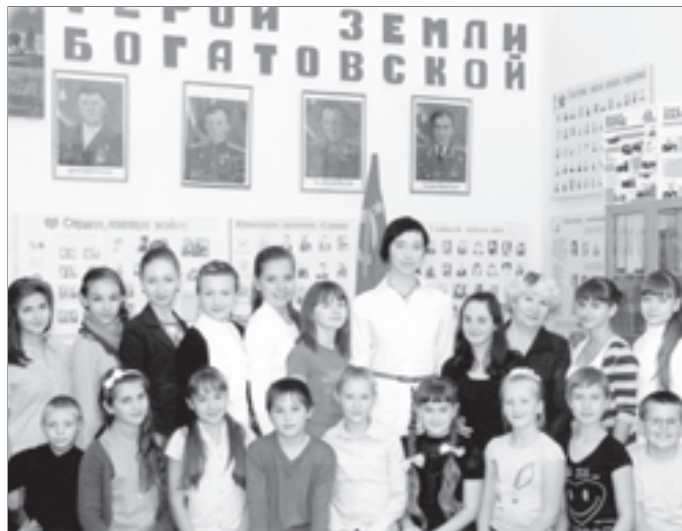
В школьном музее

Члены экологического кружка ведут большую научно-исследовательскую работу, результаты которой успешно представляют на конференциях и конкурсах регионального, всероссийского и международного уровней (областной конкурс юных исследователей окружающей среды, региональная научно-исследовательская конференция «Юный исследователь», областной юниорский лесной конкурс «Подрост» за сохранение природы и бережное отношение к лесным богатствам, областной форум «Зеленая пла-