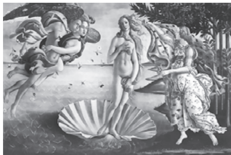
Сандро Боттичелли. Рождение Венеры

Прим. редакции. Приложение (задания для групп) и другие материалы к уроку опубликованы на сайте «Учительской газеты»: http://www.ug.ru/method_article/767