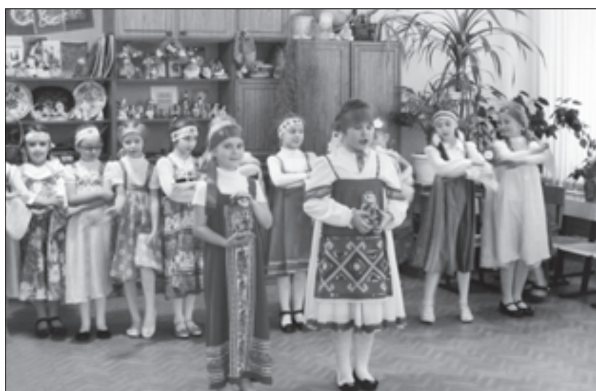
В музее народного творчества

Актуальной и достаточно болезной является тема итоговой аттестации выпускников основной и средней школы. Центр ведет в этом направлении огромную работу. На каждом августовском заседании идет обзор статистических данных о результатах итоговой аттестации вы-