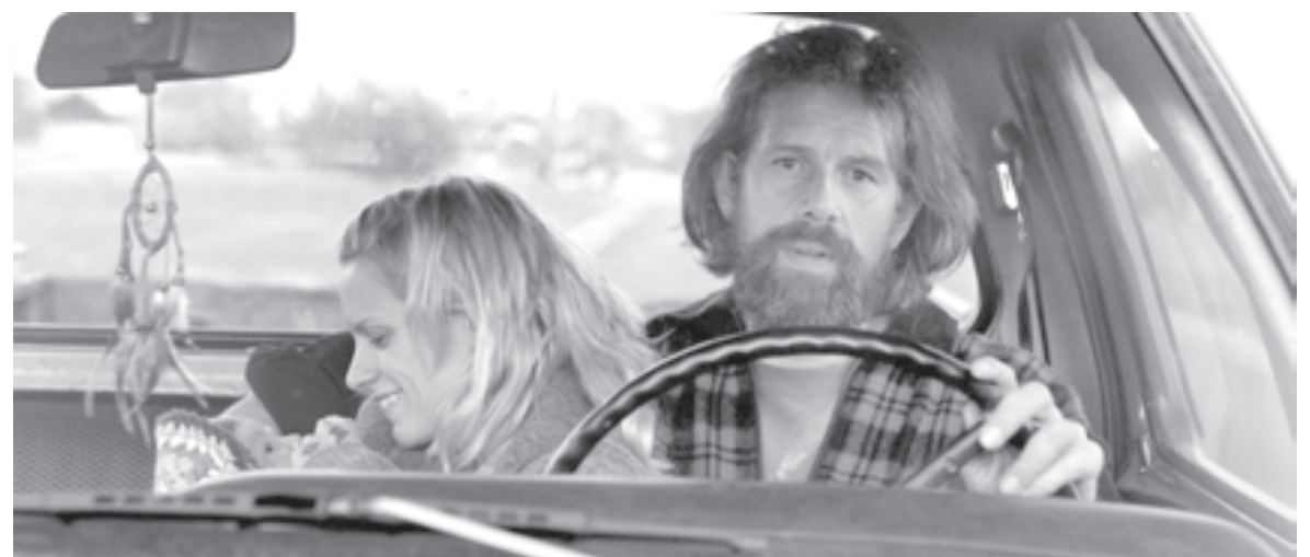
Пока еще счастливая семья. Кадр из фильма «Разомкнутый круг»