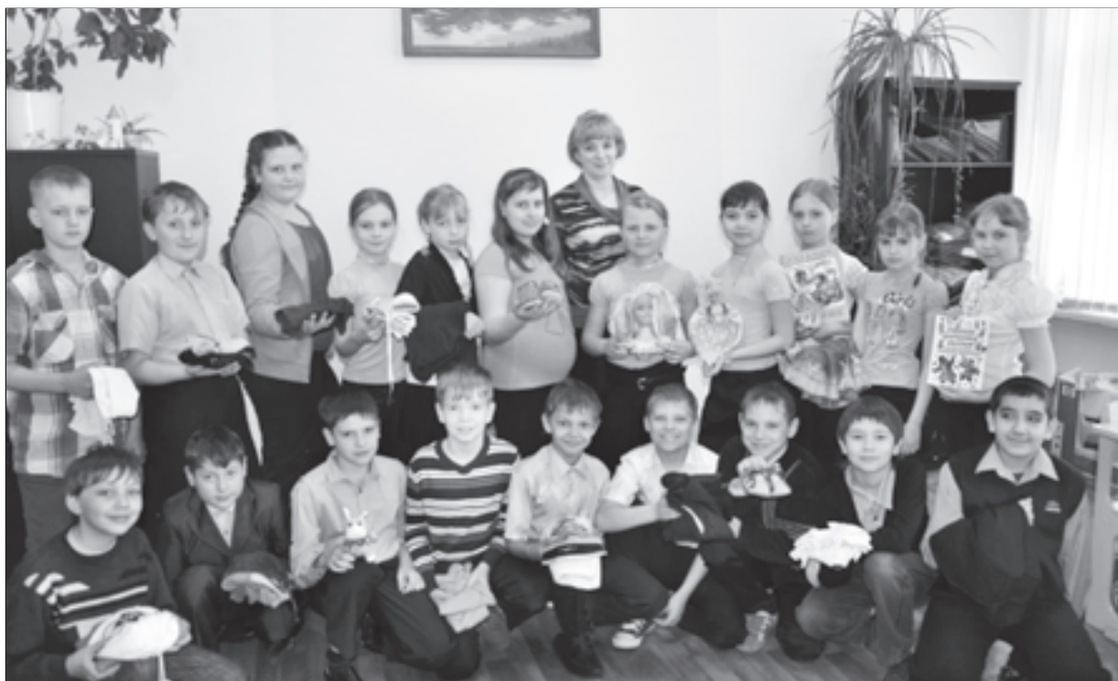
Развитие творческих способностей - одна из главных задач начальной школы

Кинель-черкасская средняя общеобразовательная школа №2 «Образовательный центр» - крупнейшая на территории Отрадненского округа. Располагается она в наиболее урбанизированной части районного центра. Ребята, обучающиеся в этой школе, живут и на территории вертолетного полка, и в микрорайонах Зеленка, Печа, населенных пунктах Тоузаково, Полудни, Ерзовка, Новые Ключи.