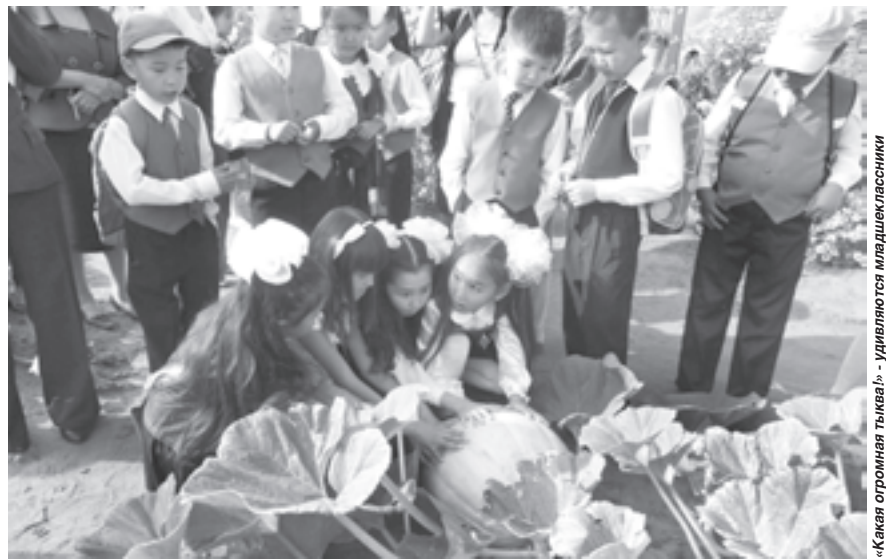
«Какая огромная тыква!» — Удивляются младшеклассники