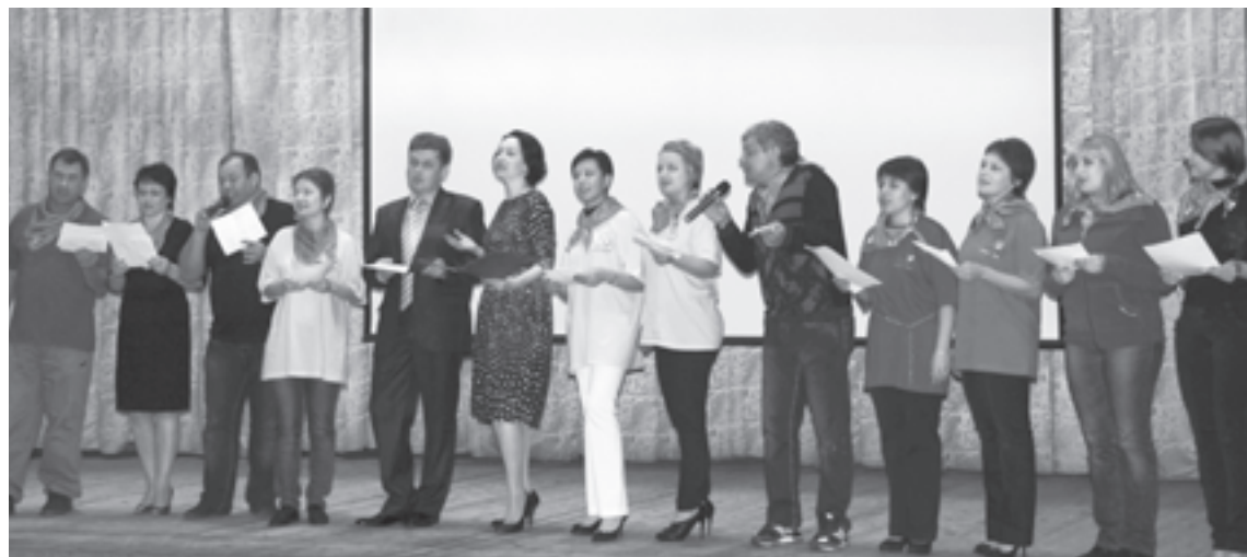
Клубу «Учитель Дона» десять лет

Олимпиадой семинар и завершился. Мы возвращались в Москву на двухэтажном поезде, пущенном специально для болельщиков, которые совсем скоро потянутся в Сочи. И в Москве фотографировались рядом с вагонами, украшенными олимпийской символикой, прощались с друзьями. Спасибо, Ростов! Спасибо, Сочи! До встречи в будущем ноябре!