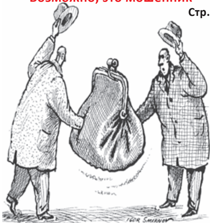
Рис. Игоря Смирнова