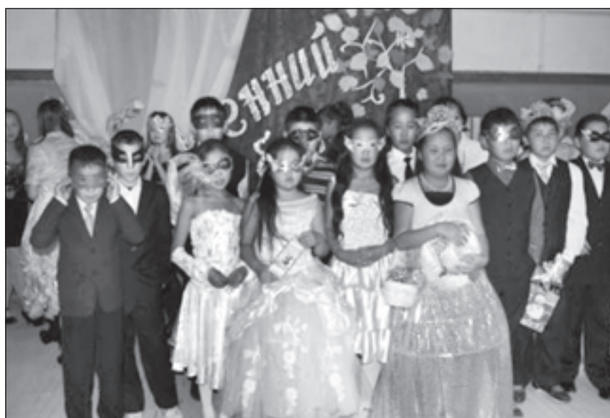
Празднование Дня знаний

активно занимаются научно-исследовательской деятельностью, понимают преимущества и недостатки педагогических нововведений, самостоятельно создают и внедряют новые образовательные методики и технологии. Качикатская средняя школа гордится своими талантливыми учениками. Школьный вокальный ансамбль «Кустук» («Радуга») дипломант республиканских конкурсов «Полярная звезда». Танцевальный коллектив «Илгэ» («Изобилие») участник международного фестиваля в Болгарии, дипломант республиканских конкурсов «Сарданалаах аартык», «Праздник танца Терпсихоры», «Полярная звезда». Своё умение обращаться со словом ребята демонстрируют в студии журналистского мастерства «Саквож». Студия - обладатель диплома I степени Всероссийской интернет-олимпиады по журналистике, лауреат республиканских твор-