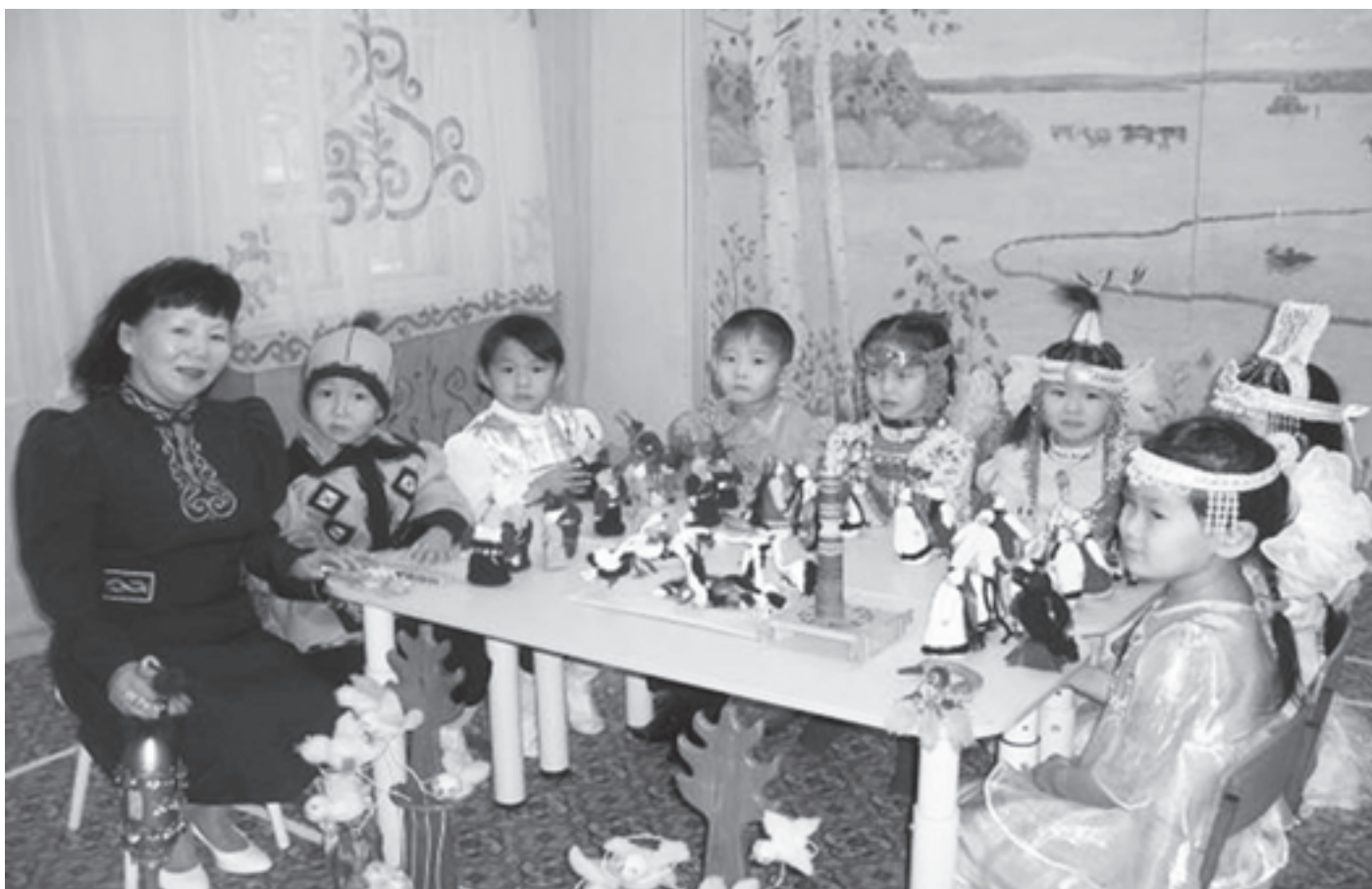
Настольные кукольные игры - любимое занятие малышей

Интеллектуальная игра «Сонор» в детских садах Якутии