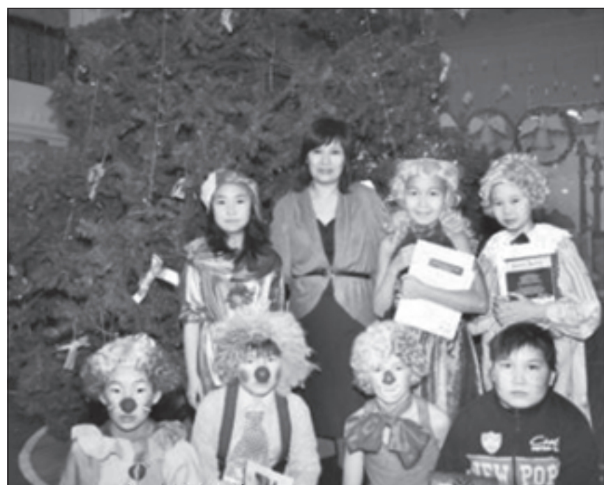
На новогоднем утреннике

Одно из приоритетных направлений в деятельности учреждения - реализация инновационных проектов в системе образования и воспитания детей в сельской местности, создание условий, способствующих достижению высоких устойчивых результатов. Учителя