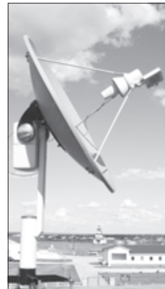
Станция приема космических снимков «Алиса-СК»