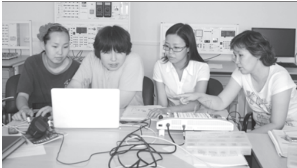
«Ленский край» может гордиться своими лабораториями