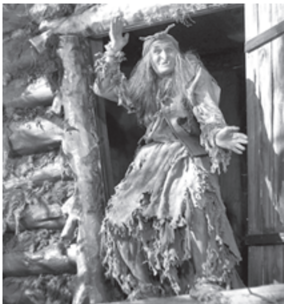
Георгий МИЛЛЯР в роли Бабы-яги в фильме «Морозко» режиссера Александра Роу, 1964 г.