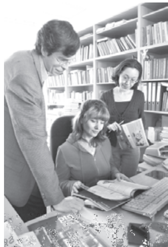
Создание электронных библиотек

фондов омских вузов должно произойти до конца 2013 года. С 1 сентября 2014 года университеты, вошедшие в электронную ассоциацию, планируют запустить семь совместных программ, начав обучение. Но не хватает главного, по мнению первого заместителя председателя Комитета по образованию Государственной Думы Олега Смолина, - национальной стратегии развития электронного обучения и национальной системы создания массовых открытых онлайн-курсов.