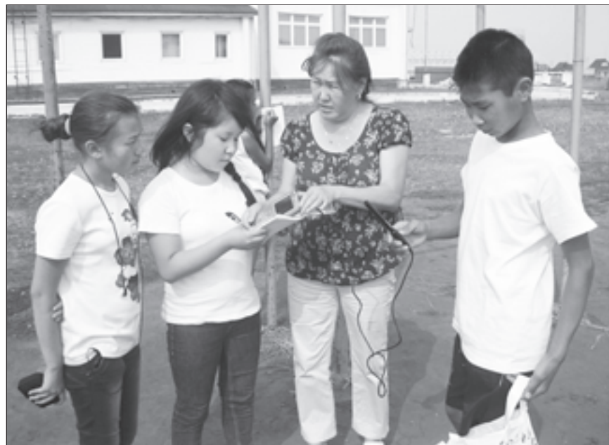
Под руководством педагогов ребята занимаются исследовательской работой

я в том, чтобы сформировать у учителей теоретические знания и практические умения по направлениям работы школьного технопарка за пределами школьной программы; повысить психолого-педагогические знания в области