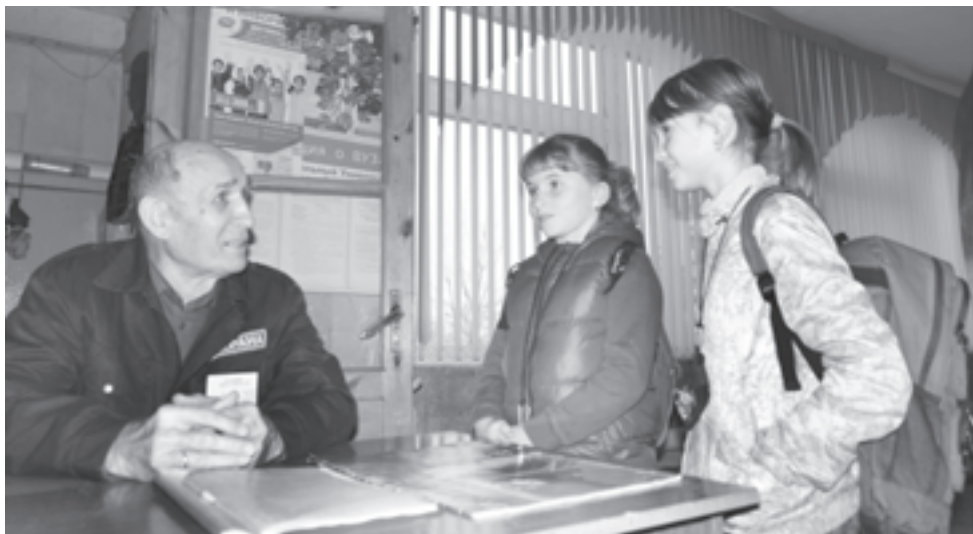
Фото из конверта