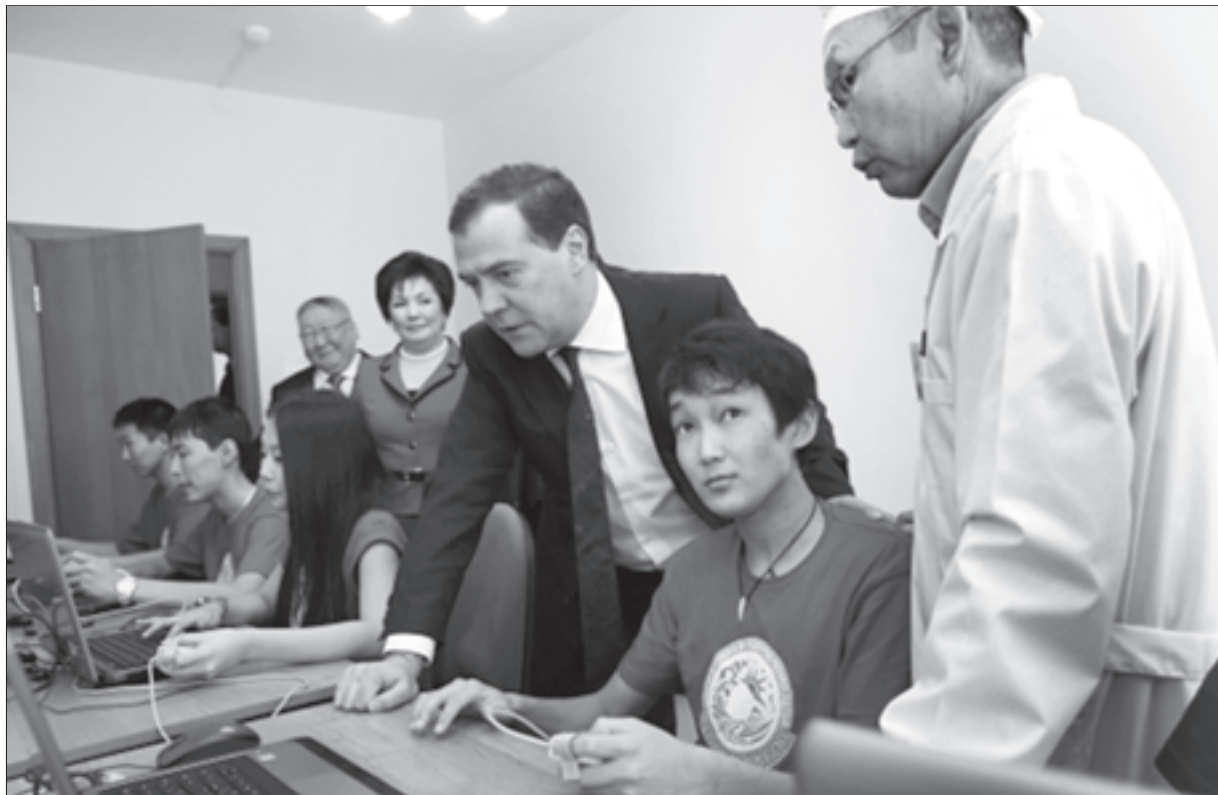
Выезд Дмитрия МЕДВЕДЕВА в «Сосновый бор»

«Сосновый бор» - уникальное место, здесь ребята овладевают иностранными языками. Занимаются спортом, учатся, спорят, играют и мечтают. Те, кто раз здесь побывал, хотя бы вернуться еще. Это происходит потому, что работают в «Сосно-