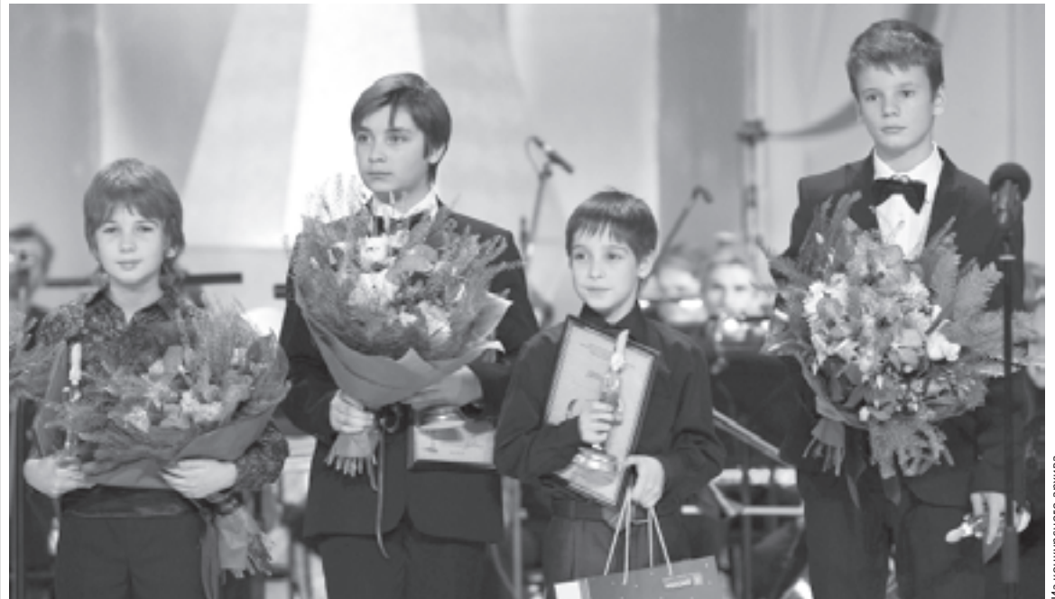
Победители XIII Международного телевизионного конкурса юных музыкантов «Щелкунчик»

Оргкомитет оставляет за собой право менять порядок выступле-