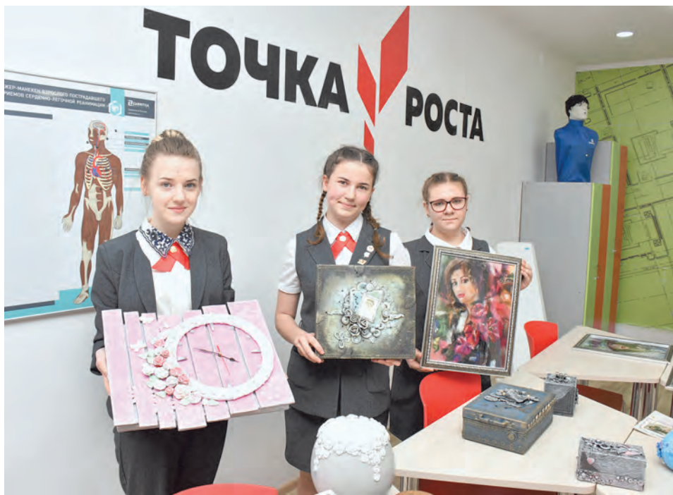
Детское творчество здесь развивается благодаря современным инициативам

- Мы сейчас находимся на том этапе, когда подходит к завершающему этапу реализуемая программа развития. И надо думать над новой, на следующие 3-4 года. Скорее всего, она получит название «Многообразие». Потому что у нас есть «Точка роста», есть музей как некая точка опоры. Сама школа - это точка притяжения