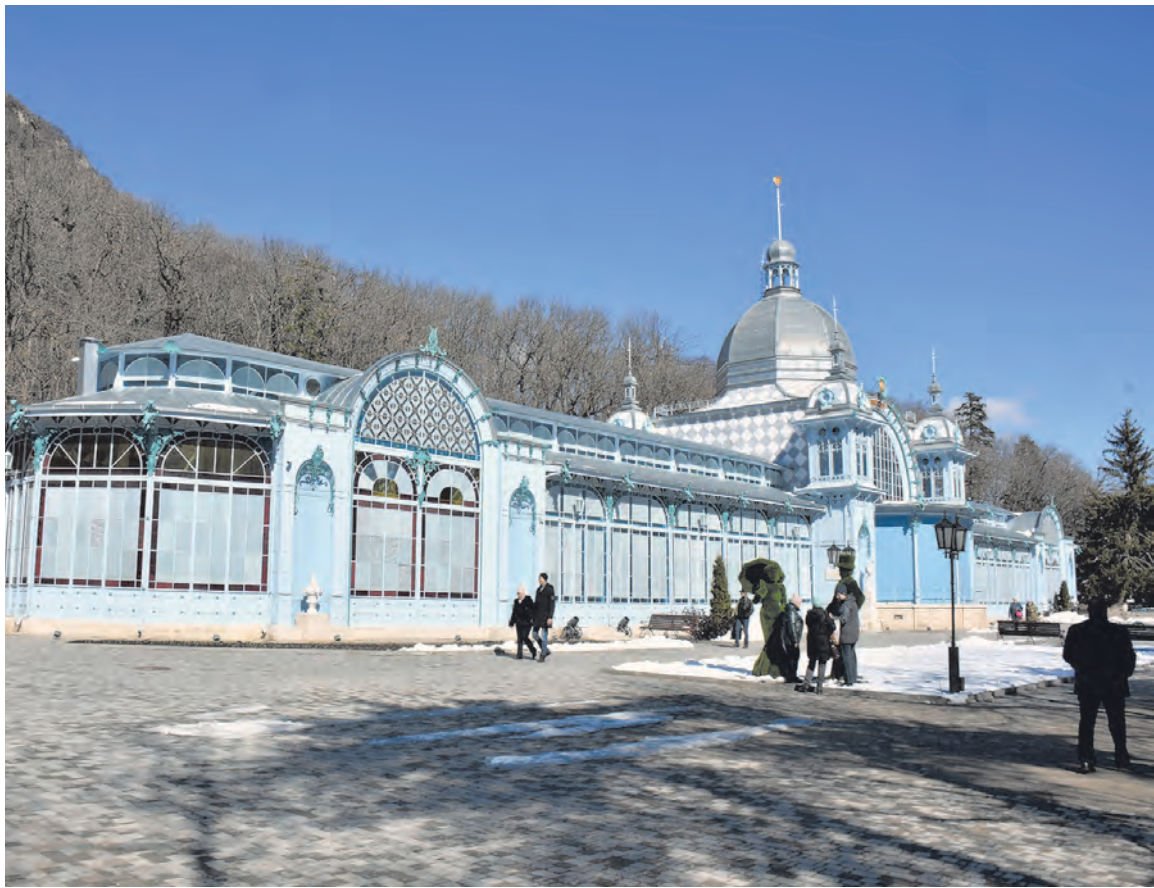
Сделать город привлекательным для людей - наша задача!

- Если мы видим, что ученик готов получить Нобелевскую премию, ему надо помочь ее получить, а не ждаты, пока вырастет, - убежден мэр. - То же и с учителями: заслуживает награды - значит надо ее дать, а не говорить, мол, вот пусть поработает лет 10-15, вот тогда и дадим. Поэтому мы рассказываем обо всех достижениях наших граждан. Знаю, в образовании нередко говорят о некоем отсроченном результате, мол, плоды нашего труда можно будет увидеть лишь через много лет. На самом деле, если человек делает свое дело качественно, плоды его деятельности видны всегда, просто проявляются они по-разному. Получил ученик хорошую отметку - надо похвалить, занял первое место на конкурсе - награждать, сделал вместе с родителями скворечник, повесил его в парке - надо поставить эту семью в пример другим. Это ведь имеет также и очень важное психологическое значение, потому что люди сразу начинают думать: «А чем же мы хуже, давай-ка и мы тоже сделаем доброе дело!» Главное - уметь оценить это.