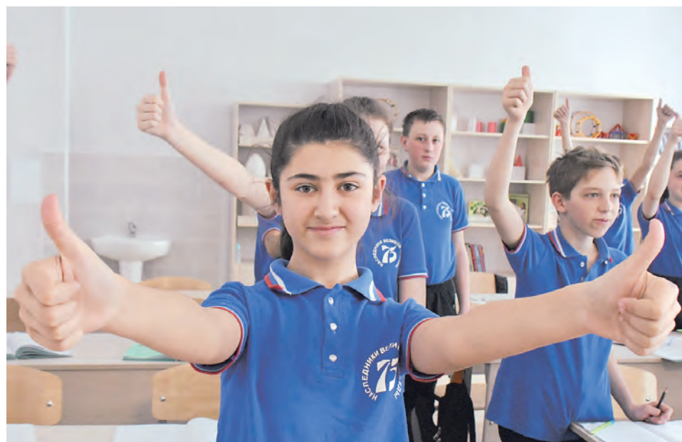
Родина начинается с меня!