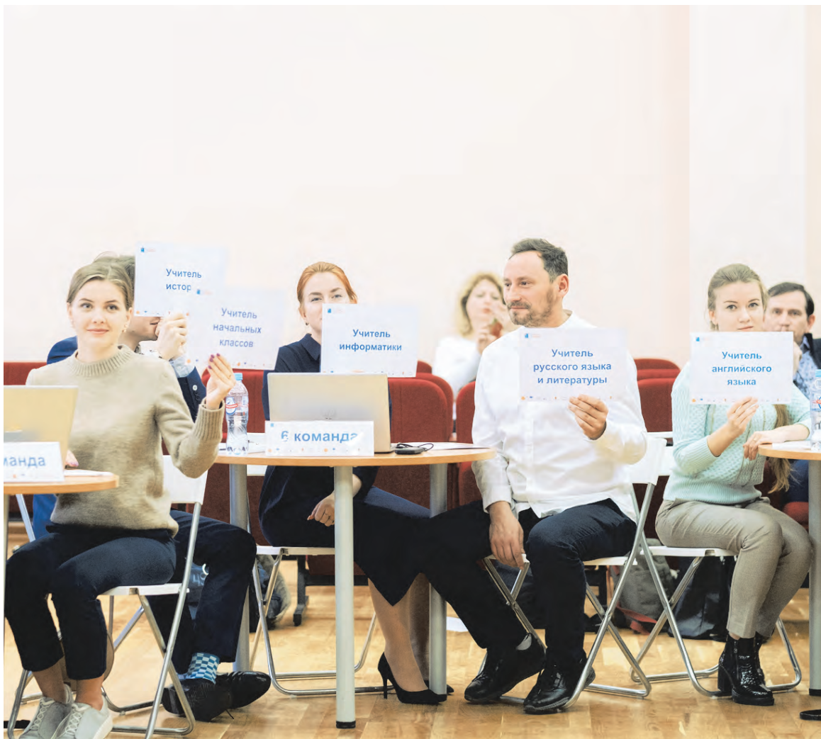
Стартовое мероприятие конкурса «Учитель будущего» 19 ноября 2019 года

Можно сказать, что я шел к этой цели осознанно. Педагог - это профессия, обладателю которой необходимы, во-первых, постоянная мотивация расти и, во-вторых, желание становиться лучше. И в этом смысле все сложилось как нельзя удачно: здесь молодым учителям всегда могут помочь старшие коллеги - если надо,