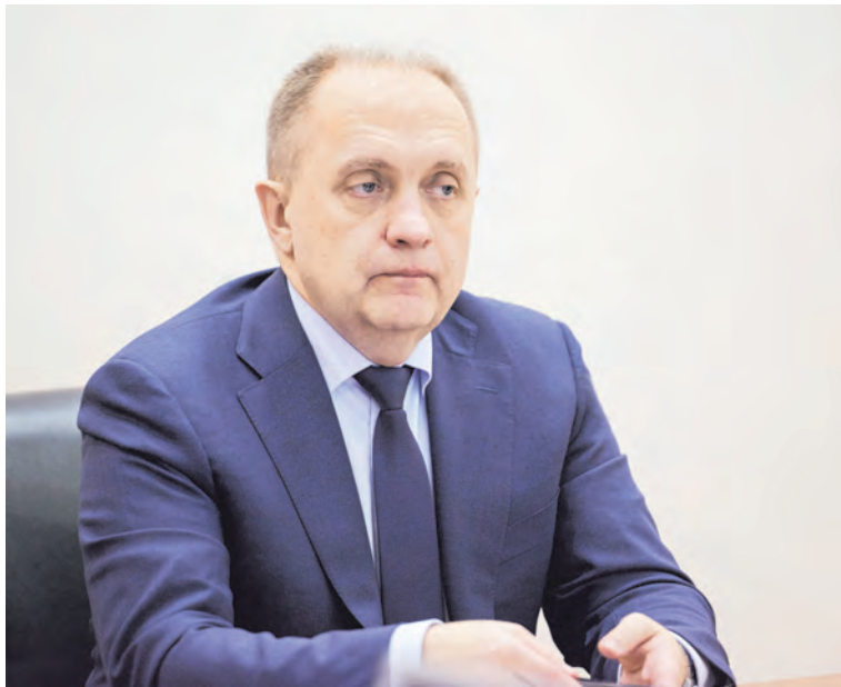
Виктор БАСЮК.

гогических вузов. Согласно закону по окончании двух курсов успешно прошедшие аттестацию студенты смогут вести занятия по дополнительным общеобразовательным программам, соответствующим их специальности и направлениям подготовки. То есть молодые талантливые ребята, которые действительно хотят реализовать себя в качестве преподавателей, могут, еще будучи студентами, вести различные кружки и секции для школьников. Это отличная возможность для ребят получить практические навыки, попробовать себя в профессии, а также учиться у своих старших наставников - опытных учителей.