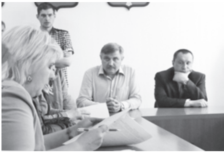
Неприятный разговор с первыми лицами в мэрии

Чего лучше точно не делать, так это фотографировать свой вариант бланка с заданиями и ответами, чтобы выложить в Сеть. Все КИМы имеют уникальные номера, а потому «хозяина» могут идентифицировать уже в течение часа. Результаты ЕГЭ также будут аннулированы.