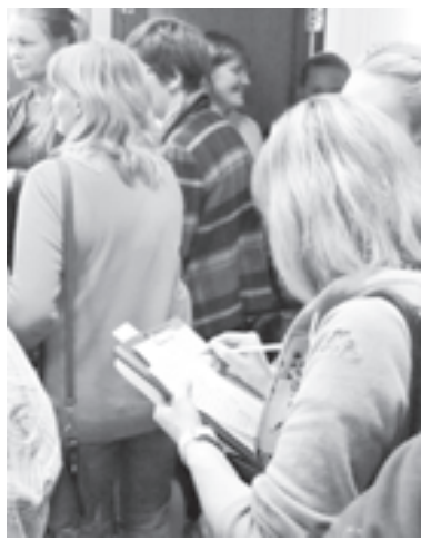
Родители собирают подписи в защиту школы №5