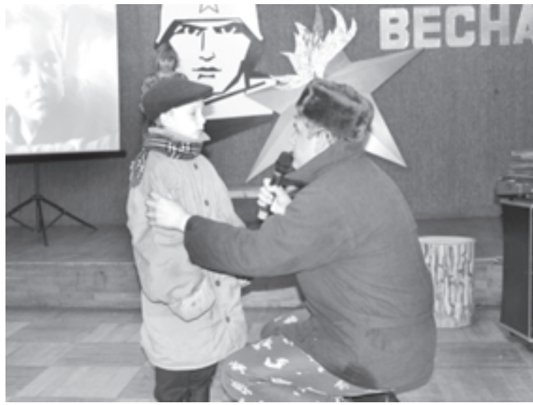
Фрагмент постановки шолоховского рассказа «Судьба человека»

На следующий год (2014) мы обратились к роману А.А.Фадеева «Молодая гвардия». Закипела подготовка к театрализованной постановке: активно обсуждался каждый эпизод (чтобы выбрать наиболее яркий и зрелищный), шились костюмы, готовились де-