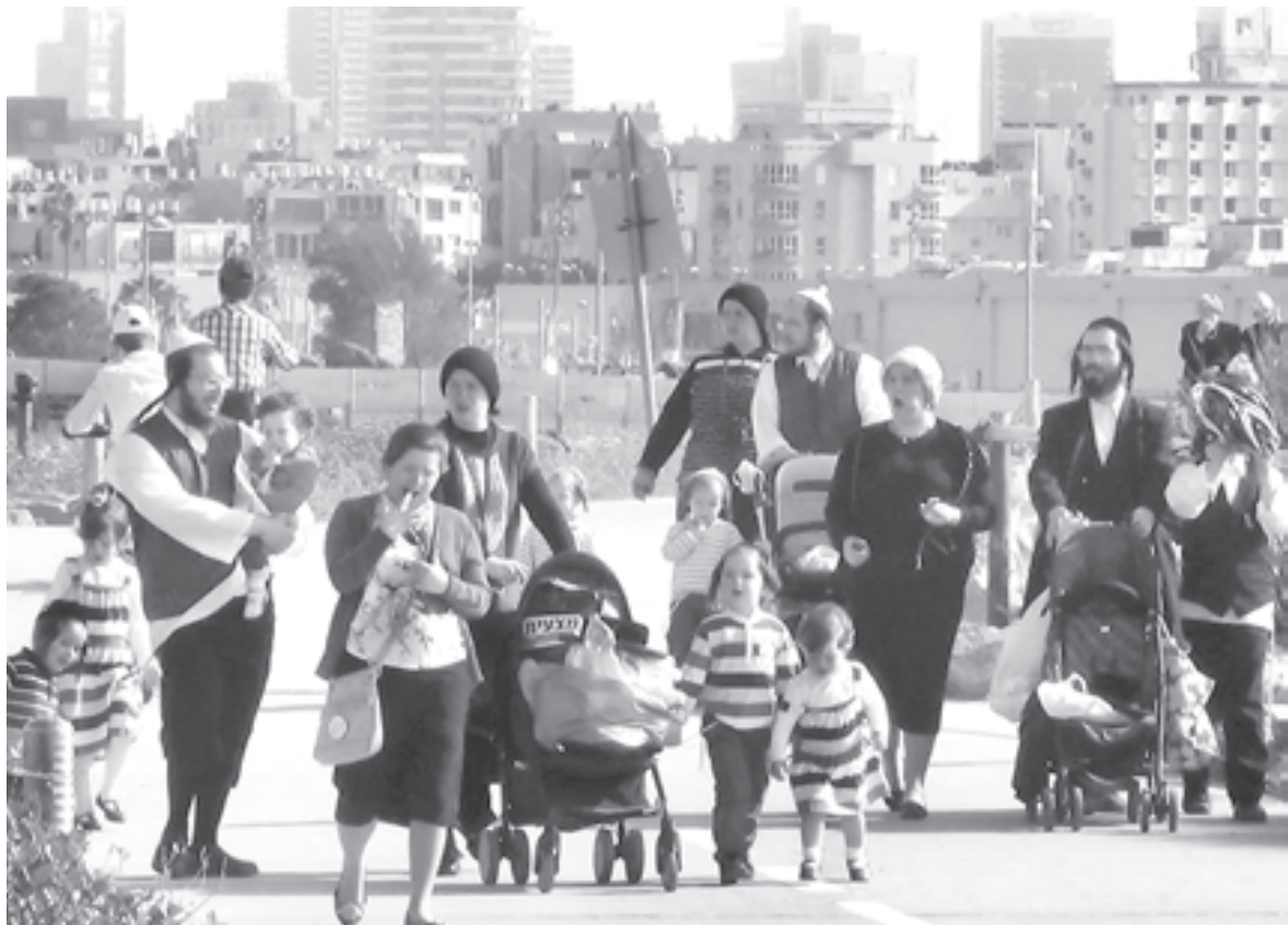
В Тель-Авиве то и дело слышно субботнее приветствие «Шалом, шабат!»

Через неделю (опять, кстати, в шабат) перед последним броском к Эйлату, когда я преодолел уже пус-