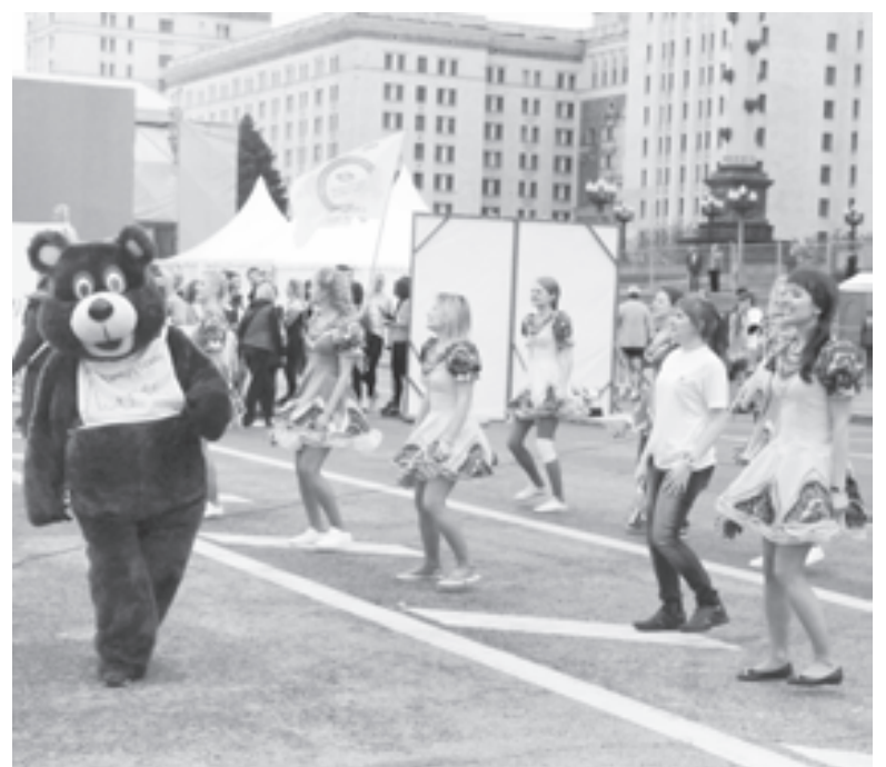
Олимпийский мишка приветствует участников марафона-2015