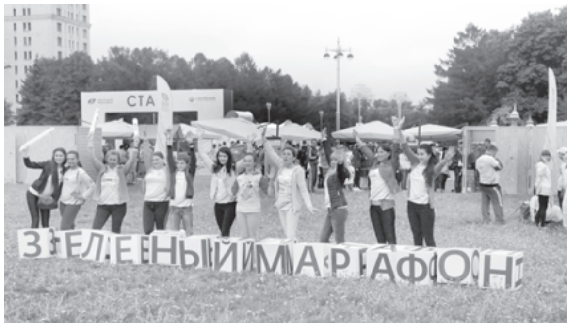
Спорт и экология друг друга дополняют