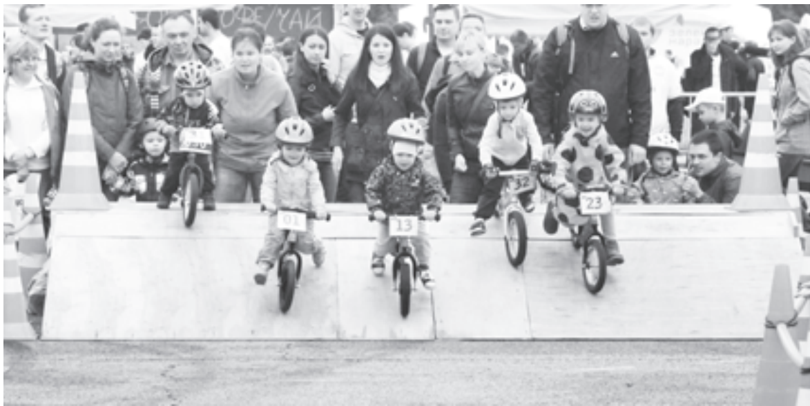
Малыши на старте своего заезда

Надежда ТУМОВА, Михаил КУЗМИНСКИЙ (фото)