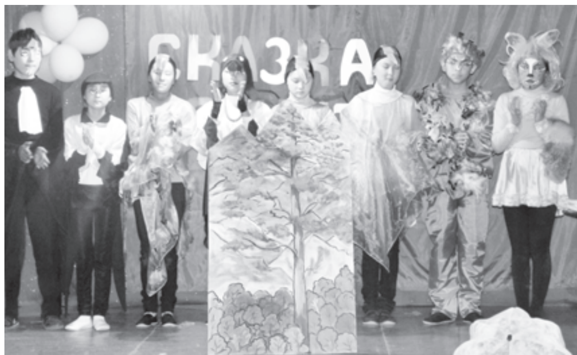
Сцена из спектакля «Сказка о хитрой Лисе»

Это хорошо знают мои юные артисты. Бывает, во время занятий слышу реплику: «Эту постановку сыграю, и все!» Но после премьеры, почувствовав поддержку зрителей, услышав положительные отзывы, все забывают об усталости и уже мечтают о новых ролях. Школьный театр «Юные артисты» позволяет детям поверить в себя, преодолеть собственную робость, неуверенность в своих силах. А для меня большое счастье видеть, как глаза детей светятся счастьем и радостью.