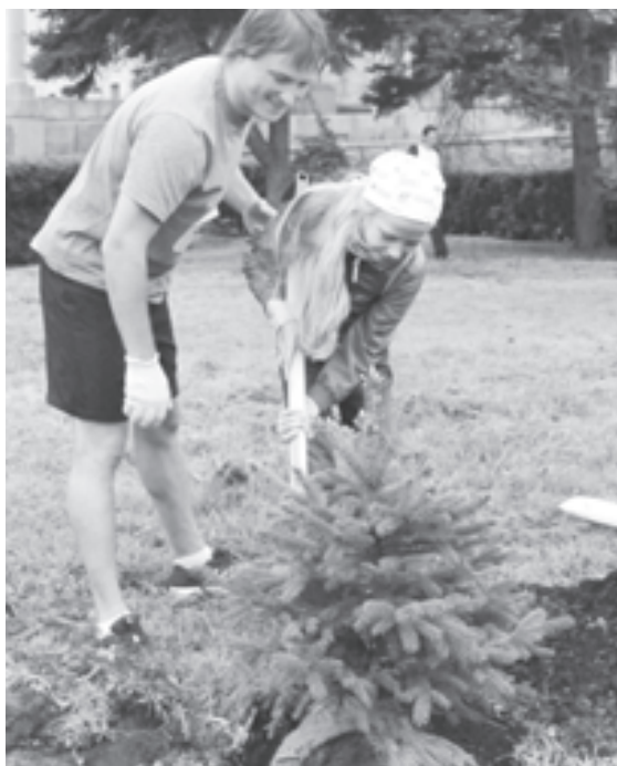
Голубые ели возле университета напомнят: здоровый образ жизни - это здорово!